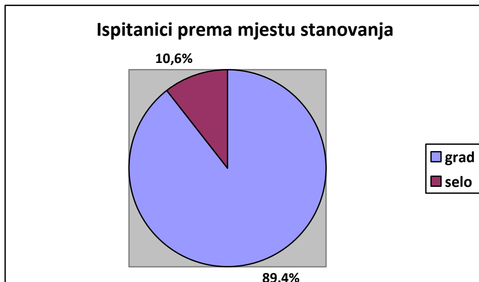
Tablica 4. Ispitanici prema mjestu stanovanja

Većina ispitanika živi u gradu (89,4%, f=160 ), dok ostatak živi na selu (10,6%, f=19 ).