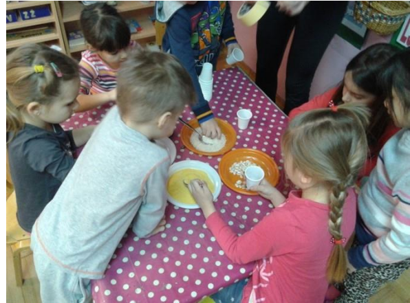
Slika 5. Izrada zvečki

Ulogu dirigenta prvo preuzima voditelj (odgojitelj) kako bi se sva osmišljena pravila demonstrirala. Djeca su bila podijeljena u tri skupine, ovisno o materijalu kojim su se punile zvečke, a svaka skupina je imala i svoju boju markacije na majicama što je djecu zainteresiralo i zadržalo njihovu pažnju. Nakon odgojitelja, odnosno voditelja aktivnosti, ulogu dirigenta preuzimaju djeca, jedno po jedno i tada se počinje promatrati njihovo stvaralaštvo jer stvaraju vlastite skladbe (slika 6.).