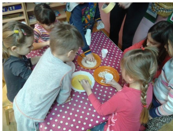
Slika 5. Izrada zvečki

Ulogu dirigenta prvo preuzima voditelj (odgojitelj) kako bi se sva osmišljena pravila demonstrirala. Djeca su bila podijeljena u tri skupine, ovisno o materijalu kojim su se punile zvečke, a svaka skupina je imala i svoju boju markacije na majicama što je djecu zainteresiralo i zadržalo njihovu pažnju. Nakon odgojitelja, odnosno voditelja aktivnosti, ulogu dirigenta preuzimaju djeca, jedno po jedno i tada se počinje promatrati njihovo stvaralaštvo jer stvaraju vlastite skladbe (slika 6.).