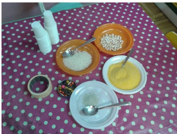
Slika 4. Materijal za izradu zvečki