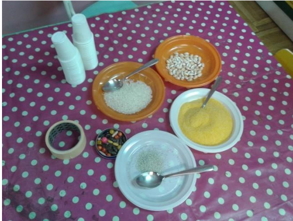
Slika 4. Materijal za izradu zvečki