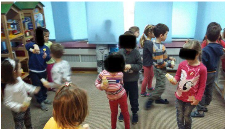
Slika 6. Dijete u ulozi dirigenta

Ulogu dirigenta prvo preuzima voditelj (odgojitelj) kako bi se sva osmišljena pravila demonstrirala. Djeca su bila podijeljena u tri skupine, ovisno o materijalu kojim su se punile zvečke, a svaka skupina je imala i svoju boju markacije na majicama što je djecu zainteresiralo i zadržalo njihovu pažnju. Nakon odgojitelja, odnosno voditelja aktivnosti, ulogu dirigenta preuzimaju djeca, jedno po jedno i tada se počinje promatrati njihovo stvaralaštvo jer stvaraju vlastite skladbe (slika 6.).