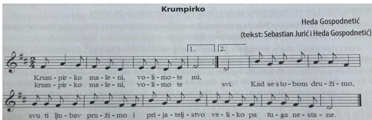
Slika 3. Pjesma "Krumpirko" za mogući kraj aktivnosti (Gospodnetić, 2015, str. 262)

Kako bi se dječje glazbeno stvaralaštvo potaknulo, odgojitelj se mora dobro pripremiti (Gospodnetić, 2015). U pripremi svakako treba obratiti pažnju na to da je smisao aktivnosti stvaranje bez obzira na rezultat same izvedbe, da dijete doživi glazbu i da uživa u glazbeno-stvaralačkom procesu. Sloboda stvaralačkog izraza, kreativnost, mašta potaknuta putem glazbenih aktivnosti odrazit će se i u drugim razvojnim područjima (Bačlija Sušić, 2018a).