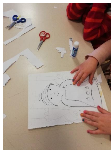
Slika 8. Vježbe vizualne percepcije