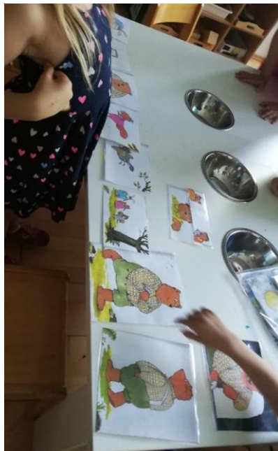
Slika 29. Prepričavanje po slikama.

Pričanje priče po slikama uz poticanje poštivanja pravilnih gramatičkih rečeničnih konstrukcija uz korištenje zamjenica, prijedloga i priloga.