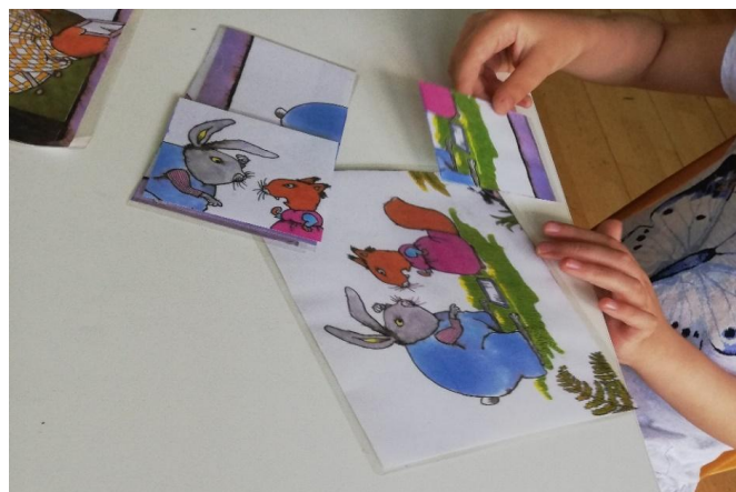
Slika 25. Vježbe vizualne precepcije

Djeci su ponuđene slagalice s likovima iz slikovnice. Ovom aktivnošću smo nastojale potaknuti razvoj koncentracije i pažnje, kao i sposobnost za uočavanje detalja.