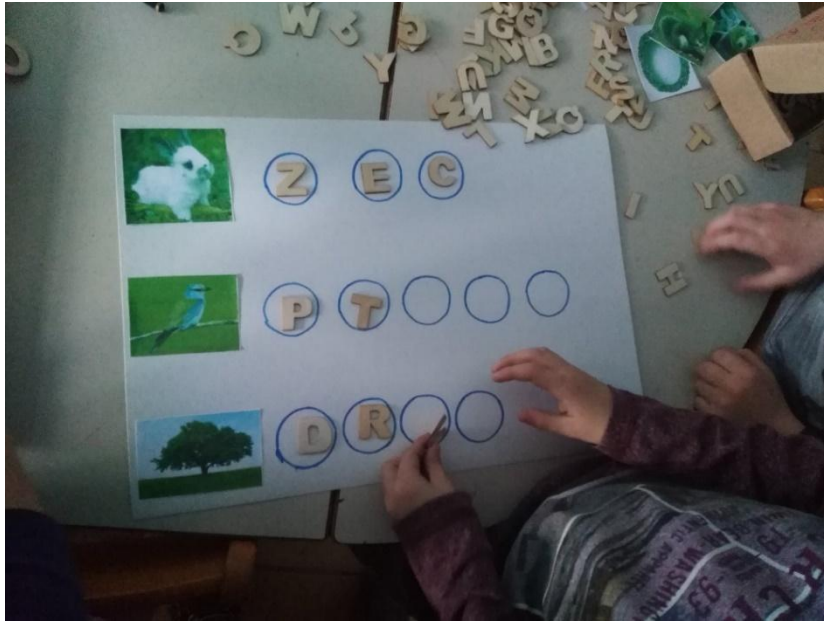
Slika 28. Aktivnost prepoznavanja životinje sa slike i pravilno pisanje naziva