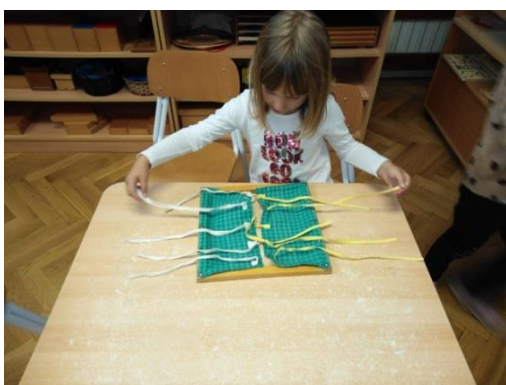
Slika 1. Okvir s mašnama

Pribori su dizajnirani tako da indirektno pripremaju dijete za daljnje učenje. Na primjeru okvira za mašne(vježbe praktičnog života); kada dijete usvoji rad sa zadanim priborom; vezanje mašne, moći će tu radnju primjeniti u svakodnevnoj situaciji: zavezati mašne na svojim tenisicama. Tada će imati priliku samostalno primjeniti ono što je usvojilo kroz aktivnost