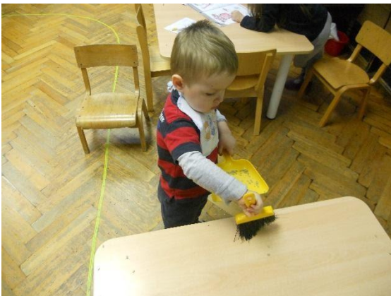
Slika 7. Dijete ispravlja grešku