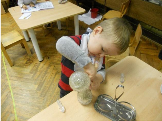
Slika 5. Presipavanje rastresitog materijala

više neće trebati našu pomoć nego će asimilirati prijašnje iskustvo i samo ispraviti svoju pogrešku. To će u njemu stvoriti osjećaj unutarnjeg zadovoljstva što je uvelike značajnije od toga da mu direktno pomognemo.