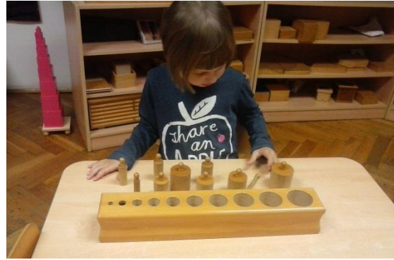
Slika 4. Valjci za umetanje

Odrasle osobe ne smiju kontrolirati djetetove greške jer na taj način vrijeđaju djetetovu čast i omalovažavaju ga. Na taj način direktno kažemo djetetu „Ti si mali! Ti to ne možeš! Daj meni!“ . Za dijete je vrlo važno da ono svoju grešku vidi, prepozna i da samo traži rješenje njenog ispravljanja. Tako dijete postaje samosvjesno i stječe samopouzdanje prema samome sebi. „Ja sam ovo krivo napravio i mogu tu grešku sam i ispraviti“. Djetetu možemo biti velika prepreka na putu k njegovoj samostalnosti jednako kao i što možemo biti most prema brzem stizanju do njegove samosvijesti i stjecanju njegovog samopouzdanja. U sljedeća tri primjera vidjeti ćemo na koji način, kao odgajatelji, možemo pomoći djetetu, te na koje načine nad njim možemo vršiti devijaciju.