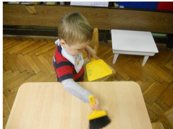
Slika 8. Dijete ispravlja grešku

Na slikama dijete presipava rastresiti materijal iz jedne posude u drugu. U jednom trenutku pšenica mu se prosipala po stolu. Dijete je samostalno otišlo do police gdje stoje predmeti za ispravljanje pogrešaka. Uzelo je lopaticu i metlicu i samo ispravilo svoju pogrešku.