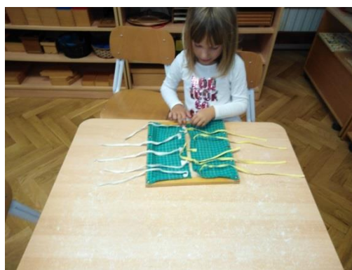
Slika 2. Okvir s mašnama

Pribori su autokorektivni što znači da dijete samostalno ima priliku provjeriti je li nešto dobro napravilo te ima mogućnost samostalno ispraviti grešku ukoliko ju je napravilo.