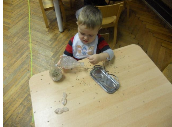
Slika 6. Dijete je prosipalo pšenicu