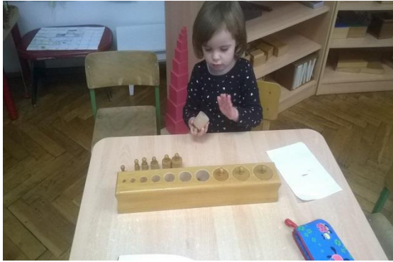
Slika 3. Valjci za umetanje