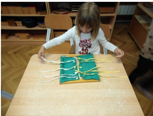
Slika 1. Okvir s mašnama

Pribori su dizajnirani tako da indirektno pripremaju dijete za daljnje učenje. Na primjeru okvira za mašne (vježbe praktičnog života); kada dijete usvoji rad sa zadanim priborom; vezanje mašne, moći će tu radnju primjeniti u svakodnevnoj situaciji: zavezati mašne na svojim tenisicama. Tada će imati priliku samostalno primjeniti ono što je usvojilo kroz aktivnost