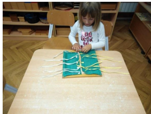
Slika 2. Okvir s mašnama

Pribori su autokorektivni što znači da dijete samostalno ima priliku provjeriti je li nešto dobro napravilo te ima mogućnost samostalno ispraviti grešku ukoliko ju je napravilo. Pribori su usmjereni na samo jedan aspekt rješavanja problema koje će dijete prilikom manipuliranja riješiti.