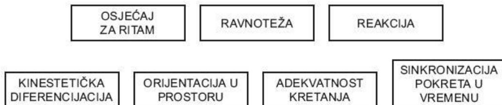
Slika 1. Prikaz komponenata koordinacije (Drabik, 1996).

Prskalo (2004) navodi kako je koordinaciju moguće razvijati na dva načina, a to je; putem učenja novih raznih struktura kretanja, te kroz izvođenje poznatih gibanja, samo u nešto promijenjenim uvjetima, što zahtijeva reorganizaciju postojećih motoričkih znanja. Smatra kako je od velike važnosti da se vježbe za koordinaciju provode u ranim, senzibilnim razdobljima, kako bi dijete što bolje reagiralo na koordinacijske vježbe i osiguralo potpuni razvitak koordinacije.