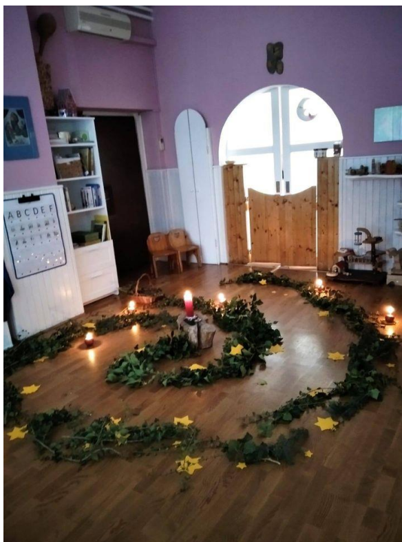
Slika 22. Adventski vrt

U prostoru je i adventski kalendar s prozorčićima, izrađen na različite načine. Svaki dan adventa otvori se po jedan prozorčić, sve do Božića. Ovim kalendarom razvijamo dječji osjećaj za vrijeme, čineći njegovo prolaženje vidljivim. U prostoru se na polici za igračke ili ponekad na svetkovnom stolu nađe i patuljci koji hodaju Zemljom i čuvaju u njoj vatru. Zato je zimski ciklus najviše ispunjen patuljcima.