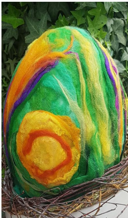
Slika 24. Filcano uskršnje jaje

Poruka Uskrsa je pobjeda uskrsnuća nad smrću i taj veliki događaj se dogodio na Golgoti što je djeci teško razumljivo i o tome njima ni ne govorimo. U pokušaju da djeci približi značenje Uskrsa, waldorfska se pedagogija više usredotočuje na prirodu i njeno buđenje. Jaje je u kršćanstvu simbol uskrsnuća. Predstavlja novi život koje se probija kroz tvrdi opnu unutar koje je skriveno žumance kao simbol svjetlosti. Jaje tako može predstavljati i svakog od nas s Kristom u nama.