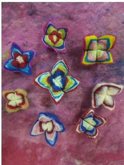
Slika 8. Filcane cvjetovi