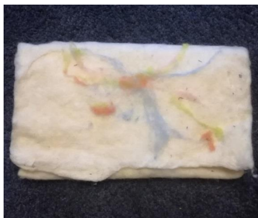
Slika 11. Filcana torbica za lutke