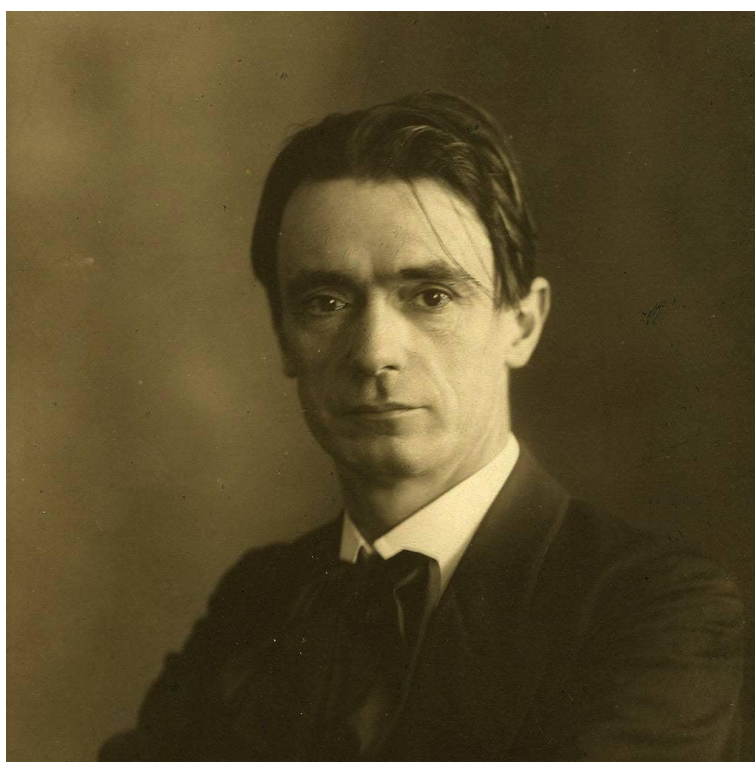
Slika 1. Rudolf Steiner

Rudolf Steiner se rodio 1861. u Kraljevcu, međimurskom mjestu tada na granici između Austrije i Ugarske, kao sin austrijskog željezničarskog činovnika. Završio je Realnu gimnaziju u Bečkom Novom Mjestu te studirao matematiku i prirodne znanosti na Visokoj tehničkoj školi u Beču. Na sveučilištu je osim toga slušao filozofiju, književnost, psihologiju i medicinu. Još kao student bio je angažiran oko uređivanja Goethevog prirodoznanstvenog opusa, što je imalo velikog utjecaja na njegov kasniji rad. Kao dijete je imao nadosjetilna iskustva, što je obilježilo njegov život.