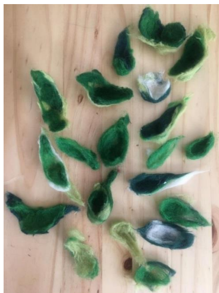
Slika 9. Filcane lišće stabla