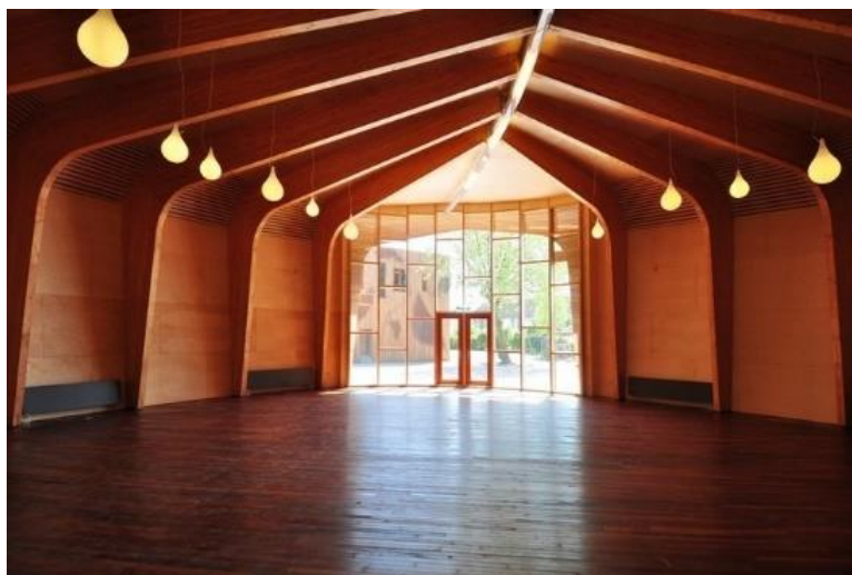
Slika 16. Ritam prostora