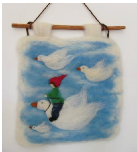
Slika 6. Filcana slika (uprizorenje bajke)