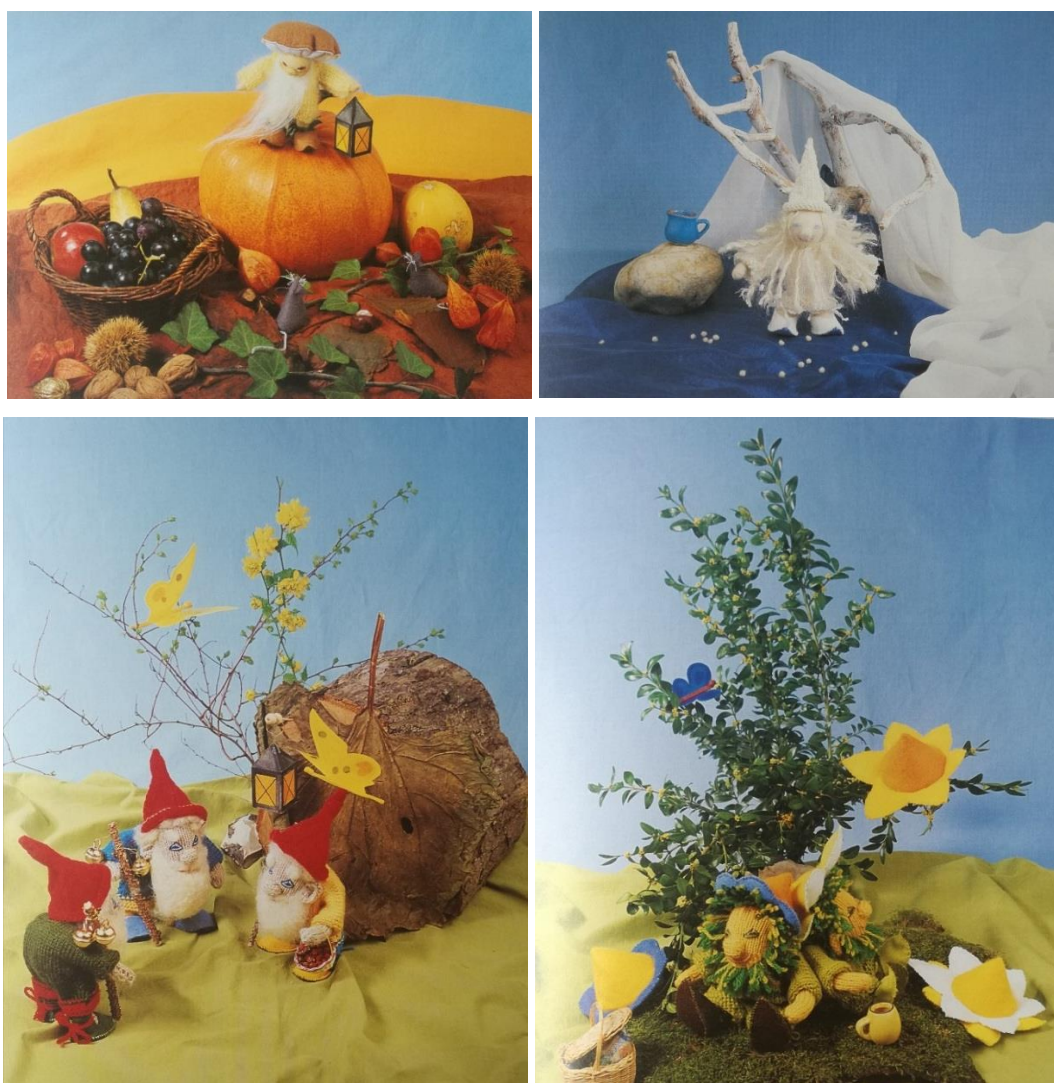
Slika 26. Svetkovni stol patuljci i jesen, zima, proljeće i ljeto

Ljetna svečanost je vrhunac ljeta i proslavlja se s roditeljima u vrtu ili dvorištu. Djeca se krune cvjetnim krunama, a u vrtu je i materijal spreman za krijes: drva, stari češeri, žirevi, grančice... Pleše se igra i slavi život. (Bašić, Bubanko, Katarinčić, Miljević, Richter, 2003. i 2004.)