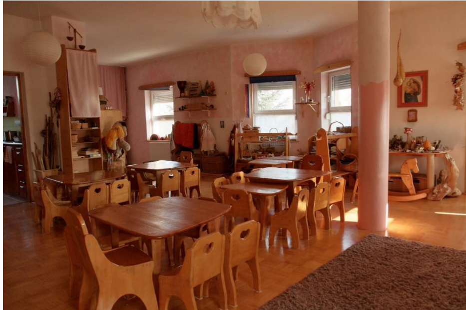
Slika 17. Boja breskvinog cvijeta i laziranje