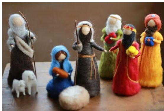
Slika 23. Poklon kraljeva

Na svetkovnom stolu, Mariji koja u svom naručju drži dijete stavlja se aureola. Marija predstavlja unutrašnje kraljevstvo duše. Na krovu štalice koja se pokrije crvenom bojom (kraljevska boja) pojavi se zvijezda. Na svetkovnom stolu pojavljuju se tri kralja, a iz prostora iščezava božićno drvce. Plavi kralj Baltazar donosi tamjan i predstavlja osjećaje. Crveni kralj Melkior donosi zlato i prikaz je čistog mišljenja. Zeleni kralj Gašpar donosi smirnu i prikaz je volje koju treba stvoriti.