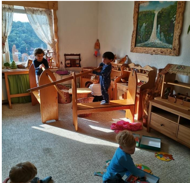
Slika 15. Kutak u nastajanju

će se dijete osjećati sigurnije i zaštićenije u ovim malim prostorima. Vrtićki prostor je slika doma.