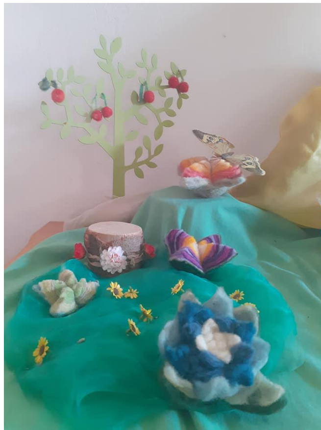
Slika 25. Filcana livada

Ivanje se slavi 24. lipnja, na dan rođenja Ivana Krstitelja. Ovim danom započinje Ivanovo koje se u kršćanskoj zajednici slavi sljedeće četiri nedjelje. Ivan Krstitelj je