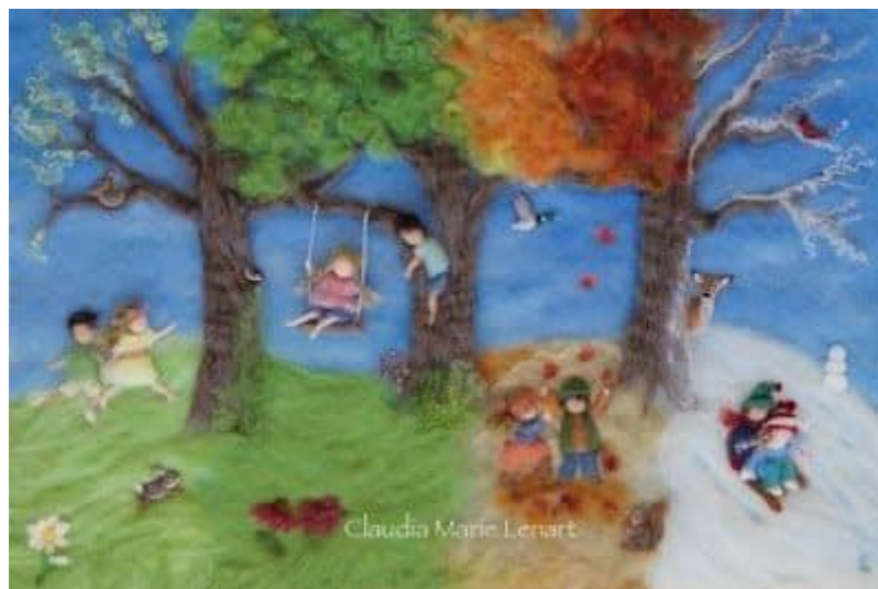
Slika 19. Filcana slika godišnjih doba i dječje igre

Tjednim ritmom djeca polako počinju shvaćati da svaki dan ima određeni karakter koji mu se daje kroz umjetničke aktivnosti: jedan dan je slikanje mokro na mokro ; drugi modeliranje; treći crtanje voštanim bojicama; kruh se mijesi npr petkom; i euritmija je u točno određeni dan. Osim u umjetničkim aktivnostima, tjedni ritam se očituje i u prehrani, npr. ponedjeljkom riža, utorkom proso, srijedom kukuruz ili kvinoja, četvrtkom ječam ili pšenica, a petkom zob.