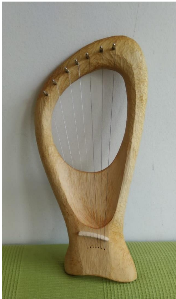
Slika 12. Lira

Već u vrtićkoj dobi, djeca u waldorfskom vrtiću mogu se okušati u obradi drveta i to s „pravim“ alatima. (Djeca u waldorskom vrtiću se koriste svim alatima kojima se koriste i odrasli ljudi, to nisu plastične imitacije, npr. za rezanje jabuke se koristi nož.) Ti prvi koraci u obradi drveta daju sada sasvim različitu kvalitetu iskustva od onih do tada stečenih. Jednom oduzeti materijal ne može se više vratiti. Djeca ove dobi ne mogu unaprijed stvoriti i vidjeti ideju nečega što žele izraditi, a onda to i uobličiti. Njihovi prvi pokušaji u obradi drveta više su istraživanje materijala, prenošenje pokreta, a onda taj komad drveta može u igri postati sve što mašta može zamisliti.