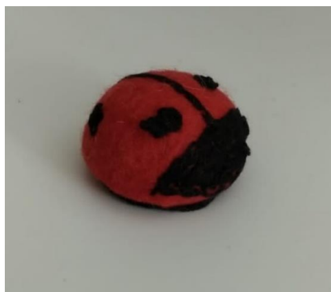
Slika 10. Filcana bubamara