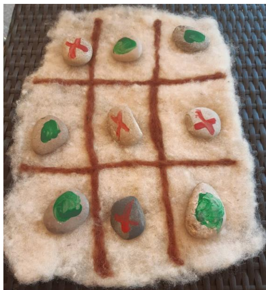
Slika 13. Filcana igra križić-kružić

Cjelokupna waldorfska pedagogija prožeta je umjetnošću. Tako možemo reći da je i uređene prostora obilježeno umjetnošću, a ponajprije likovnošću. Ako počnemo od boje zidova vrtića, boja breskvinog cvijeta nanosi se na zidove na način da ostavlja dojam fluidnosti, prozirnosti, prelijevanja - slično utisku koje dobivamo slikajući tehnikom mokro na mokro . Zidovi su često ukrašeni dječjim radovima u tehnici mokro na mokro . Djeca moraju moći crtati pokretom jer upravo u ovom razdoblju crta za njih nije oblik već pokret, a prostor mora omogućiti djetetu kretanje i istraživanje pokreta. Cjelokupni prostor vrtića najčešće je ukrašen drvenim namještajem i djeca starijih dobnih ciklusa vrlo često i sama izrađuju dijelove namještaja. Sastavni dio unutarnjeg uređenja vrtića je lira, koja ima i uporabnu i ukrasnu funkciju te je najčešće izrađena od strane odgajatelja. Igračke koje popunjavaju drvene police vrtića su najčešće izrađene od komada drveta i osnovnih su oblika i boja. Lutke i životinje koje su izradile odgajatelji i djeca su od tkanine i ispunjene su vunom.