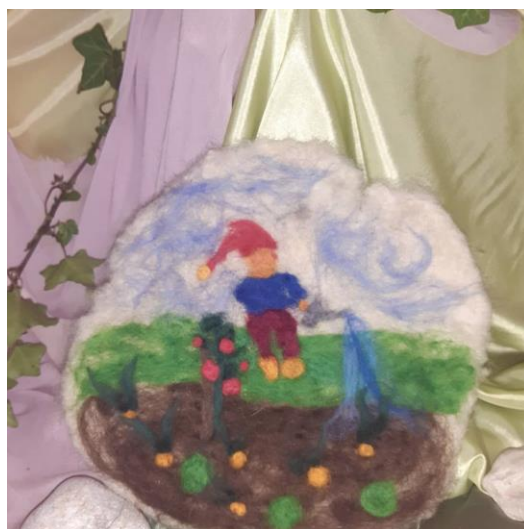
Slika 7. Filcana slika na svetkovnom stolu (uprizorenje bajke)