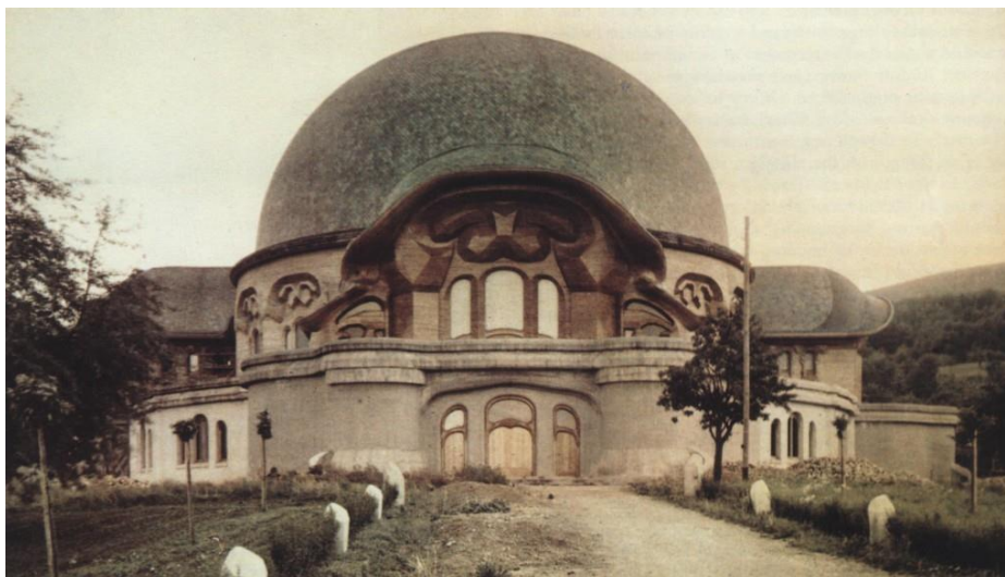
Slika 2. Prvi Goetheanum

Izgorjela je u požaru u novogodišnjoj noći s 1922. na 1923. godinu.