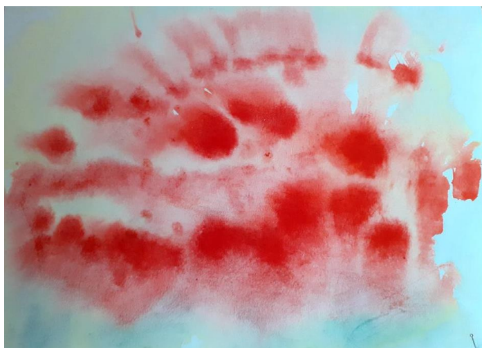
Slika 4. Slikanje mokro na mokro , crvena

uvode u plošnost boje i daju gestu, a gestom se kultivira pokret. Ovom tehnikom djeca se senzibiliziraju za kvalitetu pokreta, boje, tona, ali i forme. (Bašić, Bubanko, Katarinčić, Miljević, Richter, 2003. i 2004.) Prilikom slikanja koriste se biljne akvarel boje - u početku samo tri osnovne boje: žuta, crvena i plava - da ih netom utjelovljena duša može opaziti preko sjećanja koja donosi sa sobom. (Huzjak, 2006) Svaka od ovih boja ima svoj karakter i kvalitetu koju djeca trebaju upoznati, doživjeti prije nego je počnu miješati s drugima. Boje kojim djeca slikaju prate godišnji ritam, npr. zimi plava, u jesen nijanse crvene i žute, u proljeće žuta i plava, a ljeti žuta, crvena i plava. Djeca eksperimentiraju s bojom, ritmom, pokretom i ne crtaju realistične figure. Djeca stupaju u dijalog s bojom i iz tog se dijaloga događa susret ploha, pokret, nadahnuće te razvija mašta.