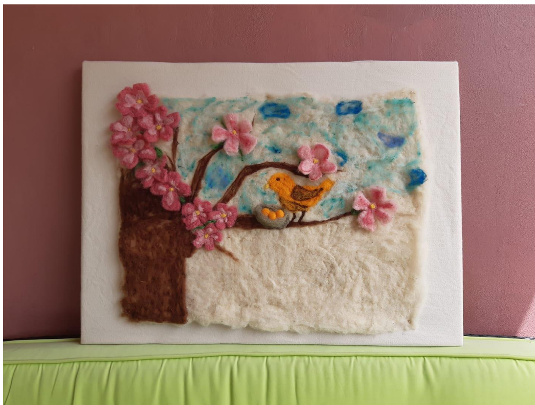
Slika 5. Filcana slika – behar

Stol pokrijemo velikim najlonom na kojega položimo prostirku od trstike, a vunu u tankim pramenčićima slažemo u oblik pravokutnika. Vunu obilno poprskamo vrelom vodom i preko stavimo til. Provjerimo je li vuna ravnomjerno nanescena i sve premažemo sapunom za pranje rublja. Trljamo kružnim pokretima cijelim dlanom, uvijek u istom smjeru, dok ne dobijemo kompaktnu masu. Postupak ponavljamo najmanje tri puta. Ostavimo da se suši preko noći. Ponovo namočimo vrućom vodom i sad možemo napraviti sliku od vune u boji pazeći da stavljamo tanke pramenove, jer ih jedino tako možemo ufilcati. Postupak ponavljamo kao i prethodni dan - složimo motiv ili apstrakciju, poprskamo vrelom vodom, prekrijemo tilom i namažemo sapunom te kružno utrljavamo. Kad je postupak gotov istisnemo višak sapuna. Ispod stavimo suhi ručnik i smotamo sliku u rolu da pokupimo višak sapunice. Nakon toga pod tušem, na kosini lagano ispiremo da izađe sva sapunica. Ocijedimo, opetovano umotamo u ručnik i zatim rastegnemo i sušimo.