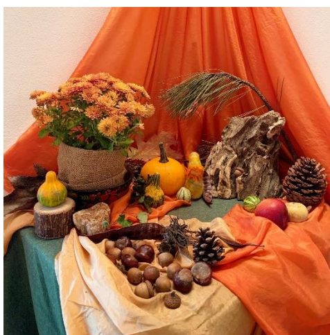
Slika 20. Svetkovni stol – jesenski ciklus

Svetkovinom žetve slavi se bogatstvo plodova koje nam daruje zemlja. Svetkovinski stol se prekriva zlatnožutim maramama, koje su odraz boja u prirodi. Na stolu je žitno klasje u vazama, a u košaricama su plodovima jeseni tikve, bundeve, šipak, jabuke, krumpiri, kestenje, češeri, žirovi te drugi plodovi polja, vrta i šume. Na zidovima su obješeni suho cvijeće i ljekovito bilje te slamnate zvjezdice koje su izradila djeca i ukasila ih cvijećem. Vrtić je pun mirisa suhog voća i ljekovitog bilja.