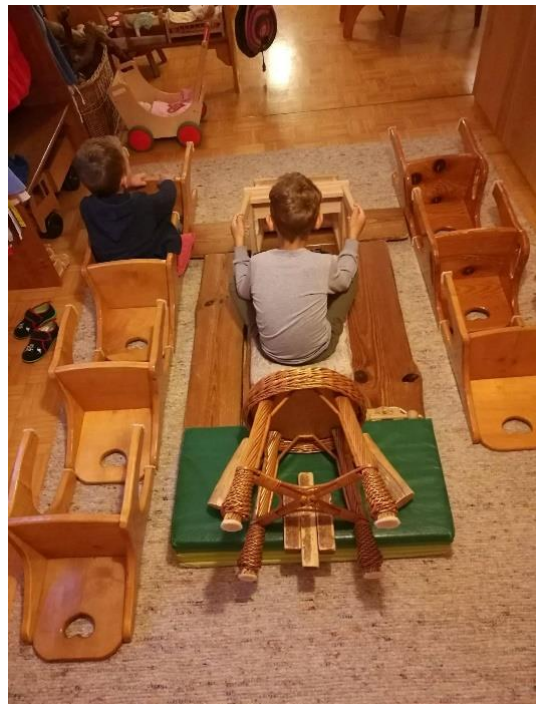
Slika 18. Transformacija prostora – svemirski brod

Aktivnosti koje se odvijaju u prostorima waldorfskih vrtića/škola vrlo su dinamične. Tu je puno slobodne igre, euritmija, slikanje, oblikovanje... Nužno je da kompozicija interijera bude vrlo prilagodljiva stvarajući živo i aktivno okruženje. Postoji nekoliko predloženih rješenja za ovaj problem. Stolovi i stolice trebaju biti lagani i lako premjestivi i uklonjivi. Kreveti za popodnevni odmor trebaju biti ili uklopljeni u prostor tako da čine kulise ili lako uklonjivi u prostoru.