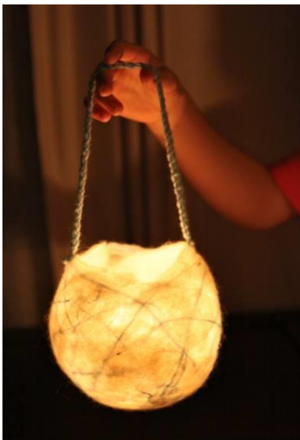
Slika 21. Filcana lampica

Tijekom Martinja, na svetkovnom stolu je slika sv. Martina. Stol je prekriven crvenom maramom preostalom od Miholja, u prostoru su lampice načinjene od staklenki i prozirnog papira. Svjetlo je sada zaštićeno. Na stolu su i kolačići u obliku gusaka, sunca, zvjezdica i mjeseca, ispečeni dan prije proslave.