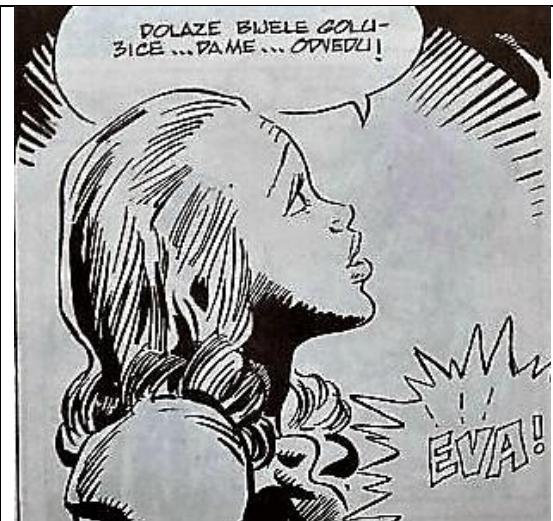
Slika 7-Evina smrt u hrvatskom izdanju

Iz prethodne je dvije slike vidljivo na koji su način sadržaji slika u hrvatskom izdanju stripa prilagođeni. Naime, dok se u američkom izdanju Evi ukazuju anđeli, u hrvatskom je izdanju prikazana samo Eva s pogledom prema gore. S obzirom da je hrvatski strip izdan u razdoblju u kojem je Hrvatska bila socijalistička Republika,