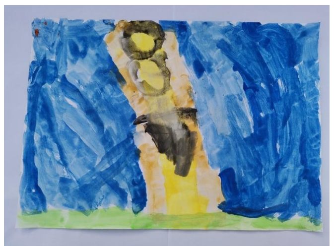
Slika 17: Dijete navodi kako je osjetilo štapovi i uže koji su bili tvrdi. Navodi kako plavu koristi jer je poput grbavog osjećaja.