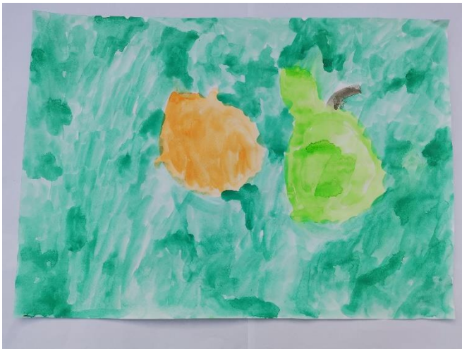
Slika 4: Osjeća tvrdo i mekano. Tvrdo kao jabuka, a mekano kao kora od naranče.