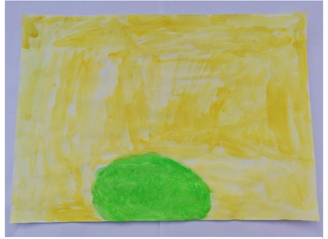
Slika 28: Navodi gorak miris. Navodi kako žuta ide uz gorki miris, a zelenu navodi kao najdražu boju.