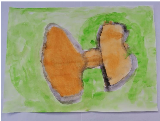
Slika 6: Navodi da je osjetilo naranču. Zelenu koristi jer je kutija u kojoj su opipavali, zelena.