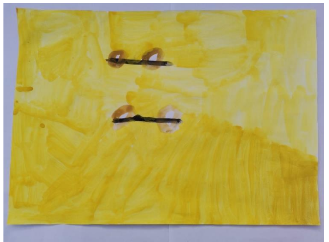
Slika 15: Djevojčica koja je imala poteškoća s izražavanjem onog što je osjetila, navodi kako je grana crna. Opisuje osjećaj tvrdim.