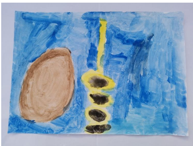
Slika 16: Opisuje kako osjeća plastičnu grančicu (plastični osjećaj povezuje žutom) i papirnato (smeđi krug koji predstavlja glatko).