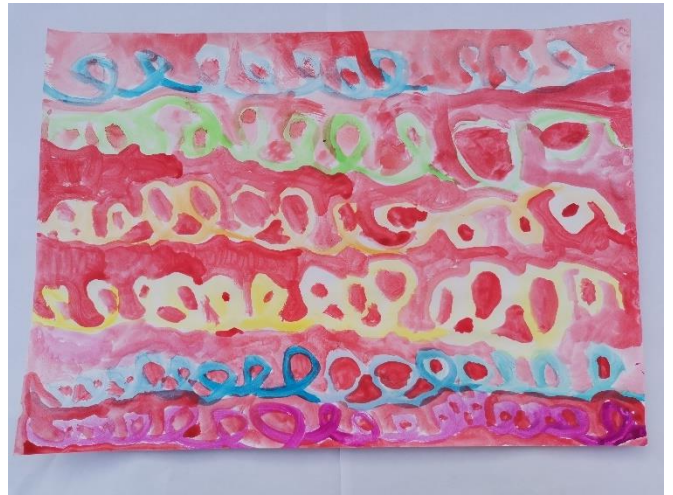
Slika 35: Zamišljeno je da je miris ugodan i šaren. Podsjeća na lavandu ili ružmarin, a unutar tog mirisa nalazi se crvena boja.