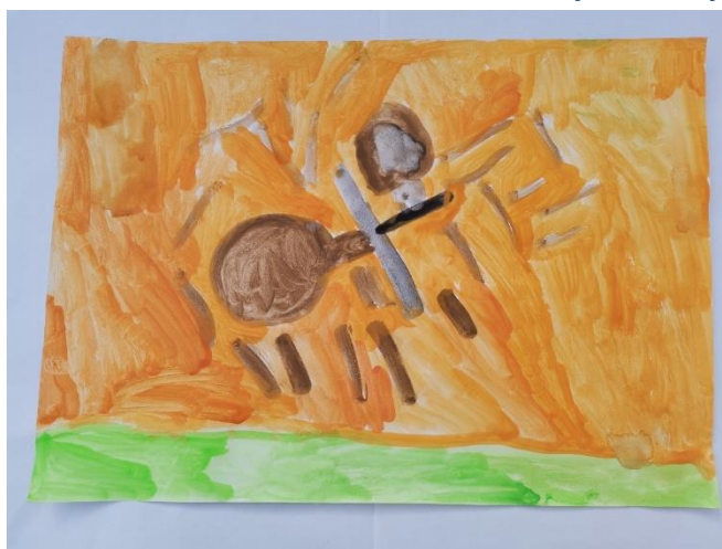
Slika 20: Navodi kako zelena predstavlja mekani tepih. Opisuje da osjeća grančice (smeđe).

Iz izjava djece, vidljivo je kako je od ukupno 11 radova, 5 onih koji su doživjeli lavandu kao neki cvijet. Unatoč tome što su neka djeca lavandu doživjela kao cvijet, imali su vidno različite prikaze tog cvijeta. Zanimljivo je što su u opisima naveli da su osjetili cvijeće, no nitko od njih nije prikazao taj cvijet klasičnim simbolom cvijeta sa žutim tučkom u sredini i laticama nego je svatko doživio cvijet na različit način. Ono što je zajedničko navedenim radovima cvjetova, jest to što su te radove izradile djevojčice. Dječaci su uglavnom lavandu doživljavali kao deblje i tanje štapove i grančice, dok su neki dječaci naslikali predmete poput naočala i valjka. Vidljivo je kako djeca nisu pribjegavala apstraktnome, nego su slikala predmete za koje su mislili da su osjetili. Uglavnom je svima zajedničko to što su doživjeli lavandu poput grančica različite debljine.