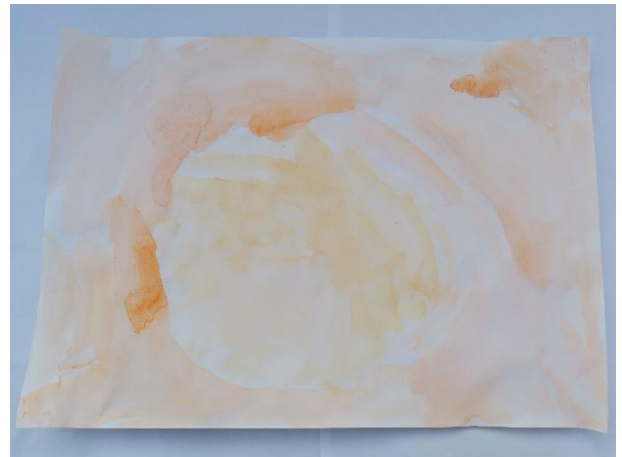
Slika 2: Dječak koji je opipavao lavandu, nakon izjave prijatelja koji je rekao da je osjetio limun, izjavljuje: "I ja sam osjetio limun".