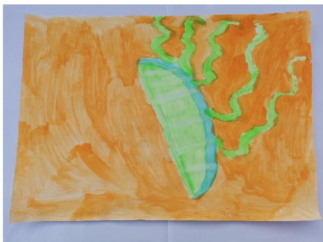
Slika 37: Navodi da ga miris podsjeća na limetu koja je kisela iako nikada nije probao limetu.