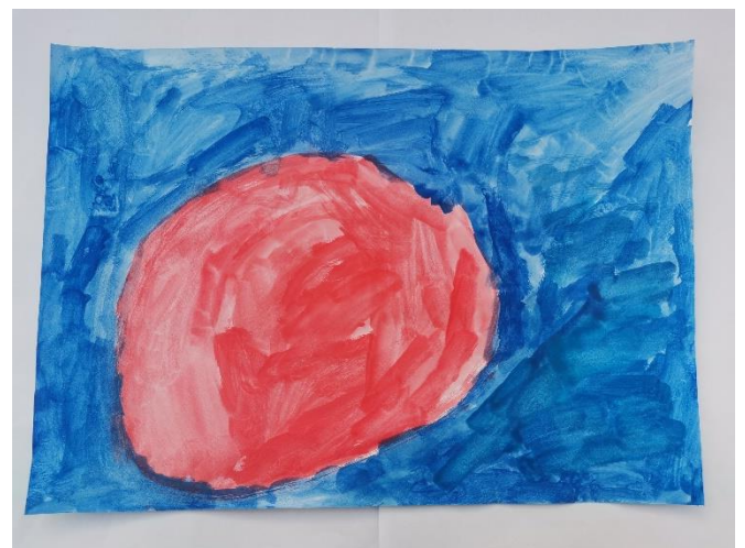
Slika 26: Navodi da je miris bio lijep. Miris je prikazan okruglo i crveno. Plavu navodi kao lijepu boju.