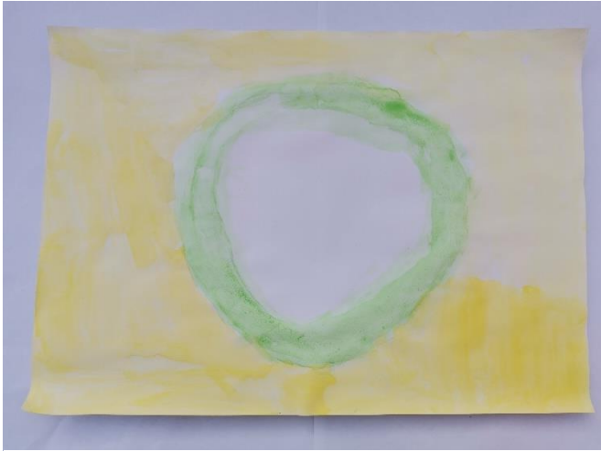
Slika 27: Navodi da je miris bio lijep. Kao najdraže boje navodi žutu i svjetlo zelenu. Asocijacija na miris pizze.