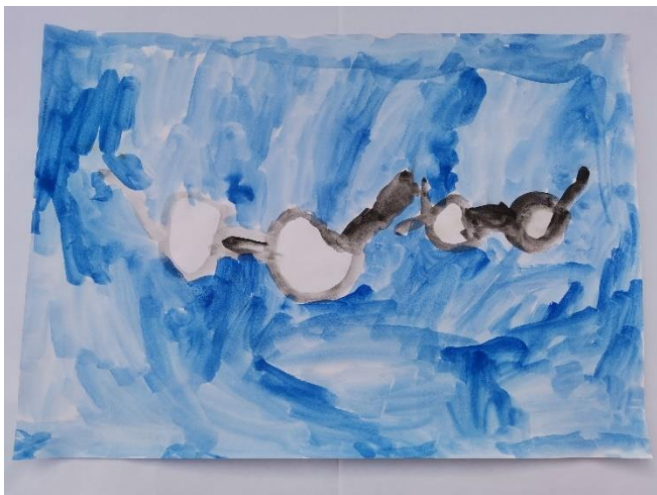
Slika 18: Navodi kako osjeća naočale. Plavu koristi jer misli da je kutija iznutra plava.