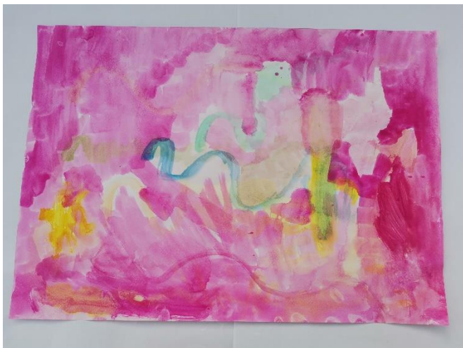
Slika 14: Navodi da osjeća cvijet, kao suhi grm. Ružičastu navodi kao omiljenu boju.