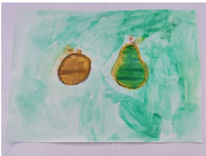
Slika 8: Navodi da je kruška je tvrdo, a smeđe je mekano. Pozadina je zelena jer mu je bilo hrapavo.