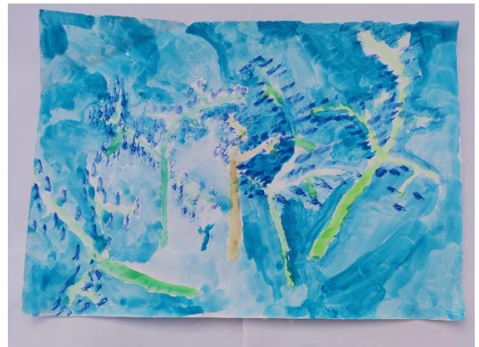
Slika 11: Smatra da je to bila lavanda.

Opisuje grančice malo tvrdima, malo mekanima, a cvjetice kao mekane.