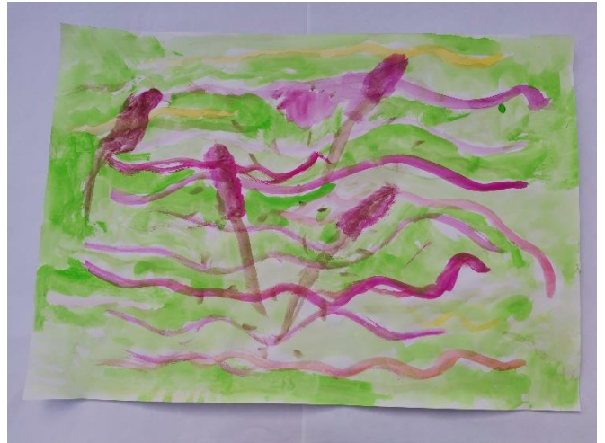
Slika 13: Navodi kako osjeća neke grančice za koje smatra da su svijetle boje. Opisuje grančice kao suhe i tvrde.