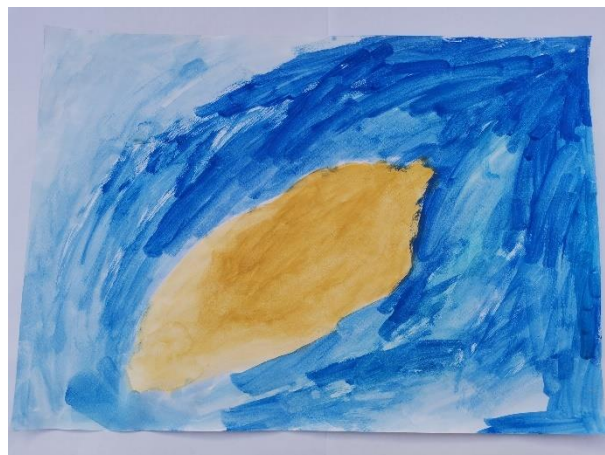
Slika 3: Izjavljuje da je osjetio limun koji je malo hrapav.