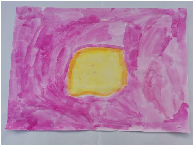
Slika 29: Navodi ružičastu i ljubičastu kao najdraže boje. Opisuje miris kao ugodan. O žutom krugu s narančastim obrubom ne navodi razloge upotrebljavanja.