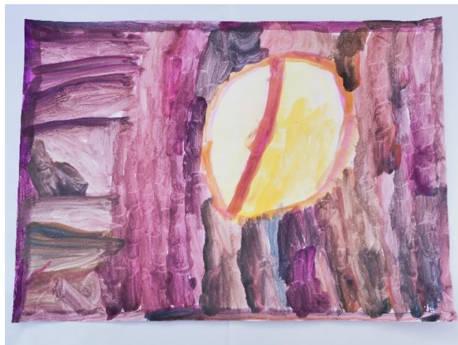
Slika 31: Navodi kako je miris loš. Zatim, opisuje kako je miris na početku bio dobar što je prikazano žutom bojom, a kasnije nije bio dobar što prikazuje pozadina.