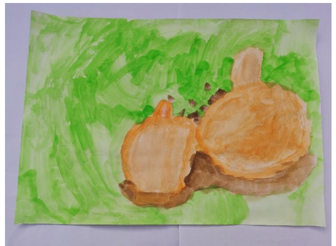
Slika 7: Dijete navodi da je bilo tvrdo kao kora od naranče. Smeđu koristi kako bi prikazalo tvrdo.