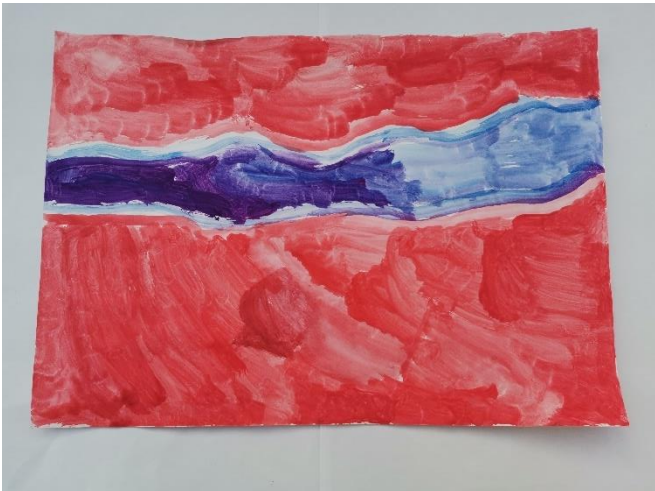
Slika 32: Miris opisuje lijepim te navodi da ju podsjeća na lavandu koja je ljubičasta zbog čega koristi ljubičastu. Lavandu navodi kao najdraži cvijet, kao i crvenu, plavu i ljubičastu kao najdraže boje.

U prikazima doživljaja mirisa, starija su djeca uglavnom koristila okrugle oblike ili pak određene ravne i valovite linije. Simboličko značenje kruga općenito, kao što je već spomenuto može imati različita značenja, od kojih su samo neka vezana uz označavanje kretnje, izdvojenost od prostora ili neki određeni predmet. (Belamarić prema Miloloža, 2018) Radovi na slikama 25, 26, 27, 28, 29, 30 i 31 prikazuju doživljaj mirisa u obliku različitih krugova koji su smješteni na različite pozicije na papiru. Doživljaji mirisa prikazani krugom uglavnom su ugodni, dok samo jedno dijete navodi miris gorkim, a još jedno dijete navodi lošim. Vidljiva je povezanost osobno najdražih ili lijepih boja s ugodnim mirisom. Doživljaj na slici 31 znatno se simbolički razlikuje od ostalih navedenih. Naime, svjetlom bojom, žutom, prikazan je prvi doživljaj koji je dijete opisalo kao dobar. Potom se, dobar miris pretvara u loš, što je prikazano nijansama tamno smeđe i ljubičaste. Dakle, dobar miris na početku prikazan je toplom bojom, a u kasnijem lošem, prevladavaju nijanse hladnih boja.