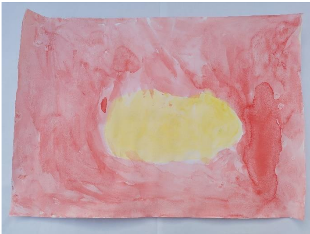
Slika 1: Izjavljuje da misli da je osjetio limun koji je tvrd kao kamen.

U prvom dolasku djeci sam ponudila nevizualni poticaj vezan uz osjetilo opipa gdje su djeca opipavala limun i lavandu bez da su ih vidjeli. Provedena je predaktivnost u kojoj su se djeci ponudile različite teksture i oblici koje djeci nisu bili okom vidljivi, kao na primjer vata, mokra spužva, brusni papir i slično, koje su djeca opipavala te opisivala kakav im je osjećaj kada dotaknu određenu površnu. Na prethodno opisani način, isključen je vidni podražaj, a djecu se pokušalo usmjeriti na njihov doživljaj određene površine pomoću osjetila opipa. Zatim se krenulo na glavnu aktivnost u kojoj su djeci bili ponuđeni lavanda i limun kao nevizualni poticaji vezani uz osjetilo opipa. Isključivanje vidnog podražaja postiglo se na način da su limun i lavanda bili u različitim kutijama u koje su djeca stavljala samo ruke, a sadržaj u kutiji nije im bio vidljiv. Nakon što su dobro opipali sadržaj u kutiji pokušali su svoj doživljaj opipanog naslikati tehnikom akvarela.