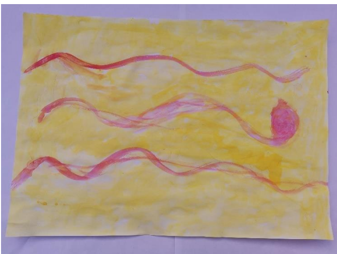
Slika 34: Navodi da je miris "fin" te podsjeća na ljubičastu boju. Navodi ružičastu i žutu kao najdraže boje.