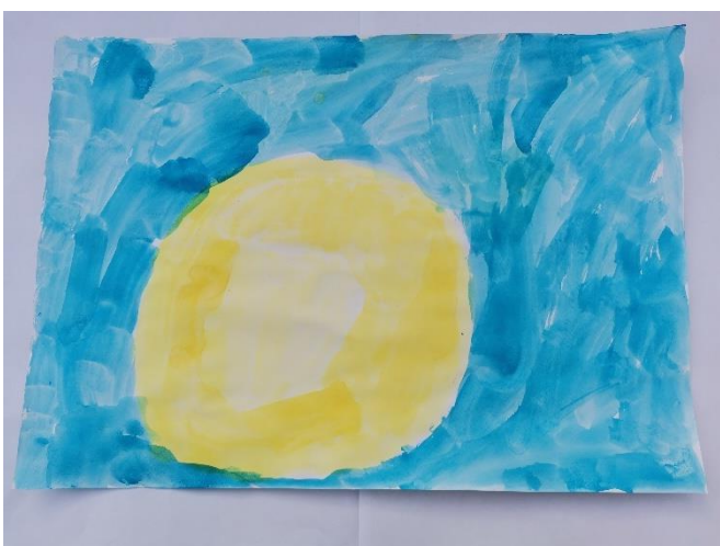
Slika 25: Navodi asocijaciju na žutu trešnju koja je kisela. Miris je ugodan. Plavu navodi kao lijepu boju.

Na slici 21, prikazan je sladoled oko kojeg se nalaze srca, koja označavaju da se djetetu miris svidio. Slika 22 prikazuje također srca, od kojih je jedno žute, a drugo zelene boje. Na navedenoj slici, primjetna je povezanost žute, narančaste i crvene kao toplih boja koje se dodiruju, kao i plava i zelena koje predstavljaju hladne boje. Radovi na slikama 23 i 24, prikazuju vizualni doživljaj sladoleda.