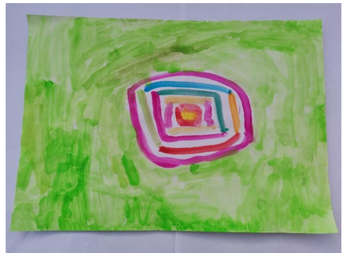
Slika 30: Navodi šarene boje kao najdraže te miris kao "fin". Zamišlja da je taj miris u travi zbog čega je pozadina zelena.