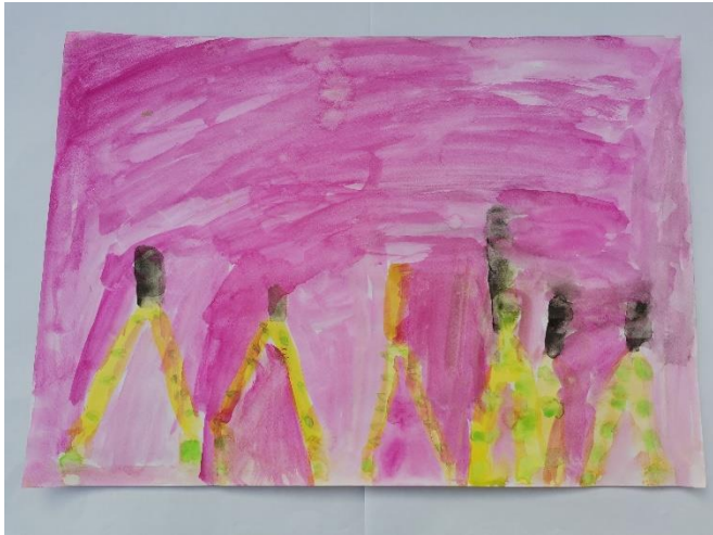
Slika 12: Opisuje da su bile grančice za koje smatra da su žute, te da su zeleni cvjetici na grančicama. Navodi da je osjećaj bio „pikav“.