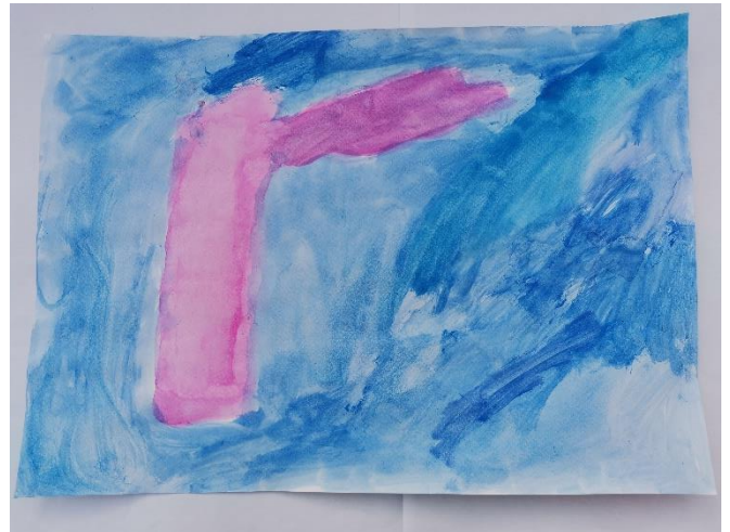
Slika 33: Miris podsjeća na ženski parfem. Plavu navodi kao plavu boju.