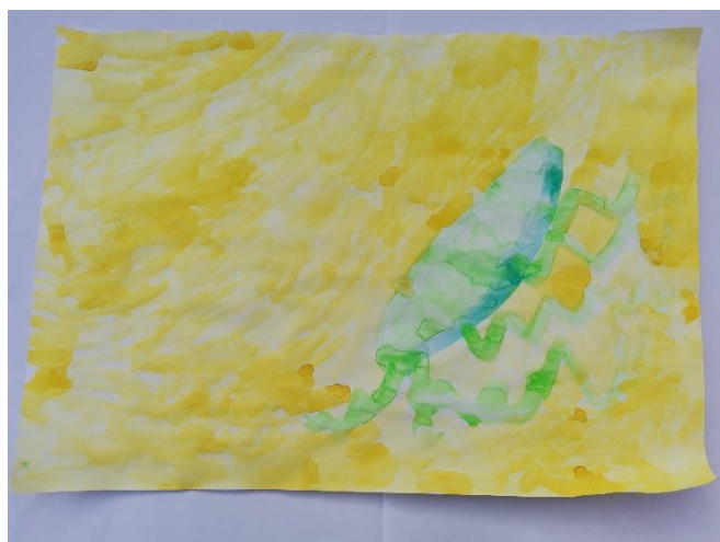
Slika 38: Opisuje miris lijepim.