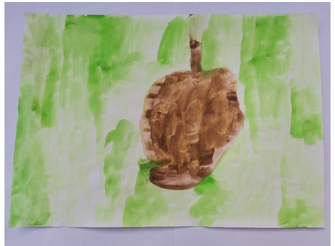
Slika 5: Dijete navodi da je osjetilo nešto tvrdo, dugačko i debelo. Zelena pozadina je jer misli da je pod u kutiji zelen.