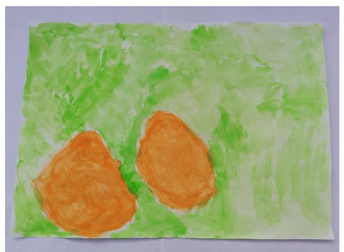
Slika 9: Izjavljuje da je osjetilo naranču. Zelena predstavlja mekano.