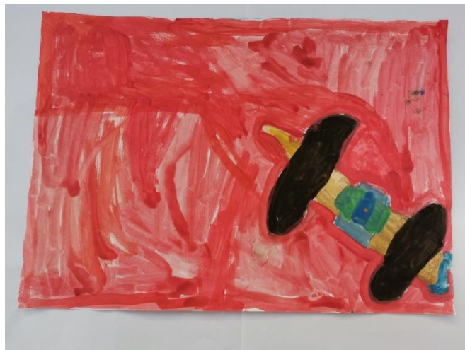
Slika 19: Opisuje kako je osjetio nešto mokro i mekano. Smeđom označava oštro, a crnom mekano. Navodi crvenu kao najdražu boju.