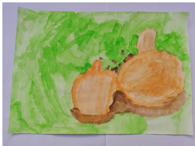
Slika 7: Dijete navodi da je bilo tvrdo kao kora od naranče. Smeđu koristi kako bi prikazalo tvrdo.