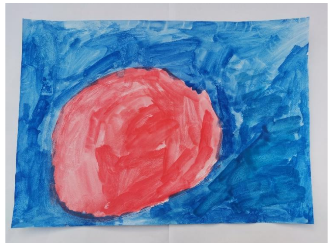
Slika 26: Navodi da je miris bio lijep. Miris je prikazan okruglo i crveno. Plavu navodi kao lijepu boju.