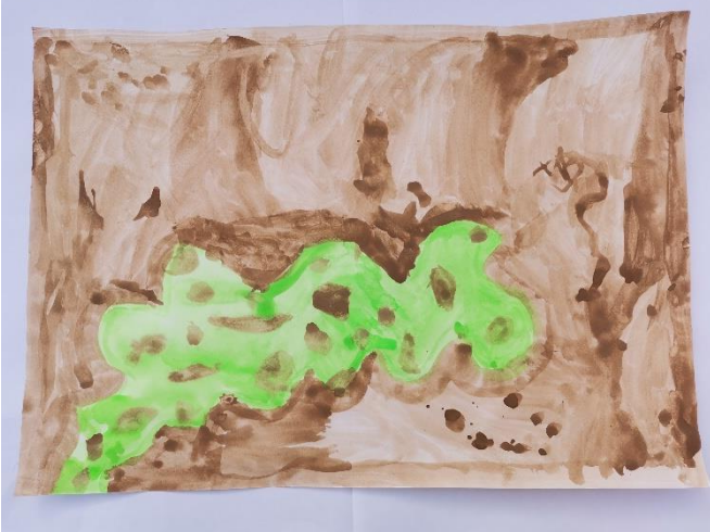
Slika 39: Opisuje miris smrdljivim.

Dijete koje je naslikalo rad pod brojem 37, miris je podsjetilo na limetu stoga je naslikalo limetu. Dijete je prikazalo limetu onako kako misli da ona vizualno izgleda. Između radova na slici 37 i 38 primjetno je kopiranje.