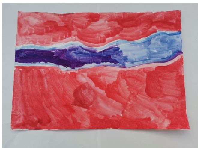
Slika 32: Miris opisuje lijepim te navodi da ju podsjeća na lavandu koja je ljubičasta zbog čega koristi ljubičastu. Lavandu navodi kao najdraži cvijet, kao i crvenu, plavu i ljubičastu kao najdraže boje.

U prikazima doživljaja mirisa, starija su djeca uglavnom koristila okrugle oblike ili pak određene ravne i valovite linije. Simboličko značenje kruga općenito, kao što je već spomenuto može imati različita značenja, od kojih su samo neka vezana uz označavanje kretnje, izdvojenost od prostora ili neki određeni predmet. (Belamarić prema Miloloža, 2018) Radovi na slikama 25, 26, 27, 28, 29, 30 i 31 prikazuju doživljaj mirisa u obliku različitih krugova koji su smješteni na različite pozicije na papiru. Doživljaji mirisa prikazani krugom uglavnom su ugodni, dok samo jedno dijete navodi miris gorkim, a još jedno dijete navodi lošim. Vidljiva je povezanost osobno najdražih ili lijepih boja s ugodnim mirisom. Doživljaj na slici 31 znatno se simbolički razlikuje od ostalih navedenih. Naime, svjetlom bojom, žutom, prikazan je prvi doživljaj koji je dijete opisalo kao dobar. Potom se, dobar miris pretvara u loš, što je prikazano nijansama tamno smeđe i ljubičaste. Dakle, dobar miris na početku prikazan je toplom bojom, a u kasnijem lošem, prevladavaju nijanse hladnih boja.