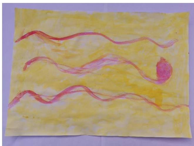
Slika 34: Navodi da je miris "fin" te podsjeća na ljubičastu boju. Navodi ružičastu i žutu kao najdraže boje.