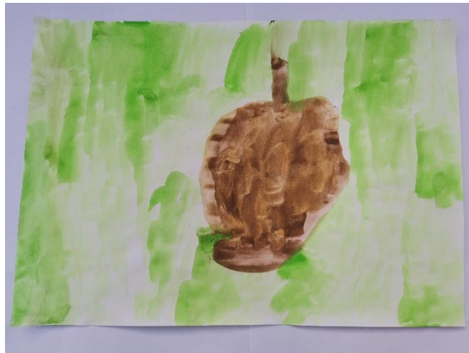
Slika 5: Dijete navodi da je osjetilo nešto tvrdo, dugačko i debelo. Zelena pozadina je jer misli da je pod u kutiji zelen.