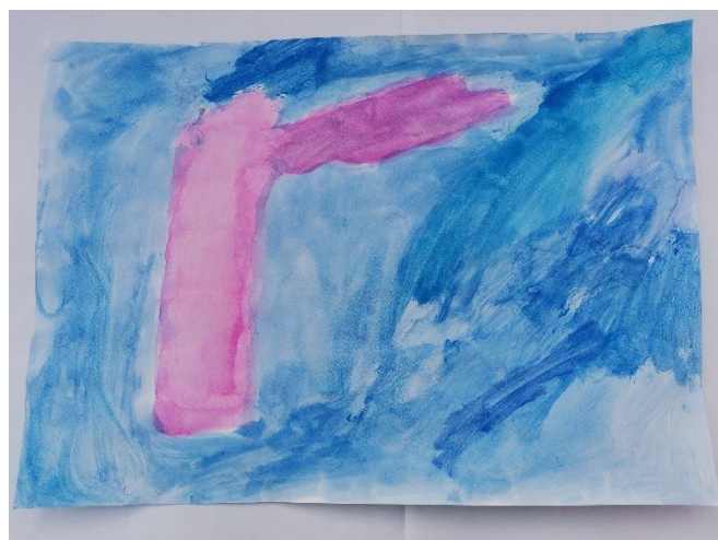
Slika 33: Miris podsjeća na ženski parfem. Plavu navodi kao plavu boju.