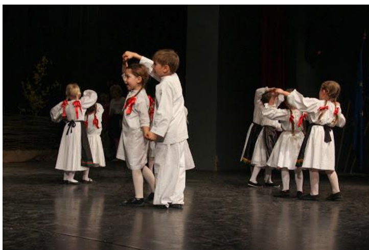
Slika 2. Djeca kao nositelji tradicije

Djeca danas imaju priliku upoznati se s tradicijskom dječjom kulturom, folklorom, pjesmama, plesovima, igrama, običajima, nošnjama i instrumentima putem folklornih igraonica organizirane u vrtićima i školama, pojedinim skupinama u vrtiću koje se intenzivnije bave folklorom, te u folklornim društvima.