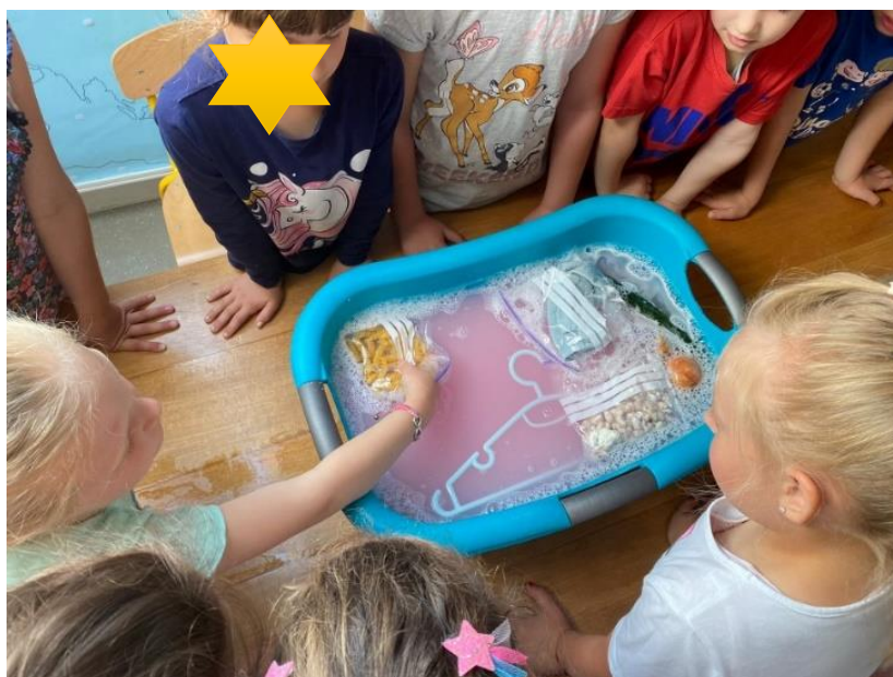
Slika 7. Djevojčica pokušava pogoditi što je dodirnula