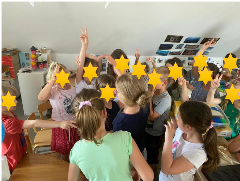
Slika 28. Biranje brojalicom tko će prvi udariti pinjatu

Naziv aktivnosti: Pinjata sa slatkišima i riječima