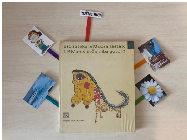
Slika 14. T.P. Marović: Ča triba govorit

Prijepisi pjesama: (Izvor za sve prijepise: Petrasov Marović, T. (1975) Ča triba govorit )