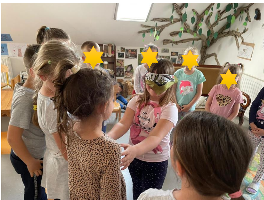
Slika 17. Ključni dio igre s pjevanjem Čvorak