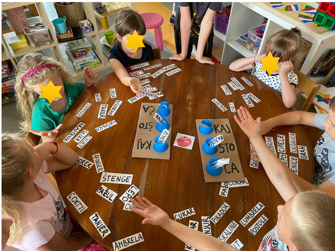
Slika 24. Rasprava tijekom natjecateljske igre