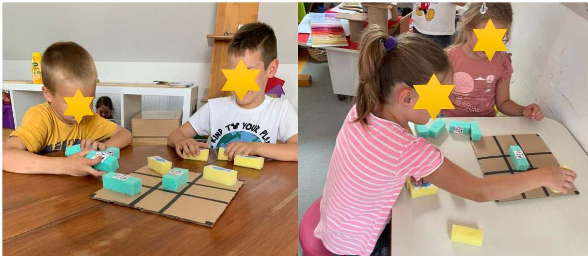
Slika 22. Križić-kružić u modifikaciji riba-krava

Naziv aktivnosti: Riba – krava / Križić – kružić