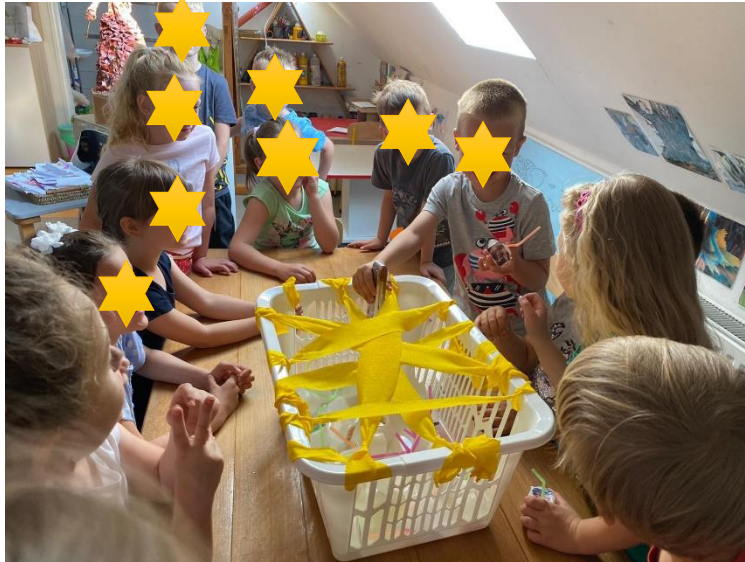
Slika 18. Uzimanje iz košare velikom pincetom

Naziv aktivnosti: Senzomotorička igra s velikom pincetom