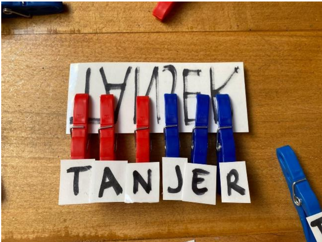
Slika 21. Složena slova uz riječ