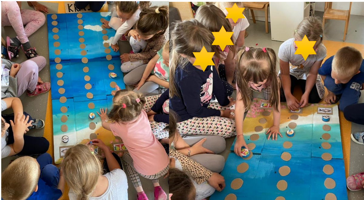
Slika 15. Natjecateljska igra