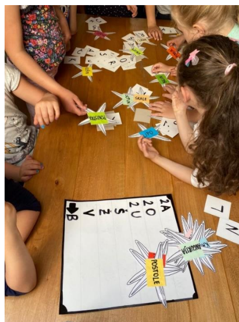
Slika 11. Pronalaženje riječi po zadacima