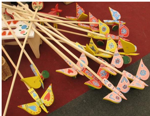
Slika 3. Drvene igračke iz Hrvatskog zagorja

Tradicijske drvene igračke izrađivale su se od vrbe, johe, javora, bukve ili nekog drugog podatnog drveta. Najčešća inspiracija za izradu igračaka bili su predmeti ili životinje iz svakodnevnog života, umanjenog oblika, obogaćene živim bojama (Biškupić Bašić, 2013). Djetetu igračka mora biti zanimljiva i prepoznatljiva kako bi se u isto vrijeme mogla razvijati njegova maštovitost i sanjarenje o izmišljenom i bajkovitom svijetu. Kada je riječ o drvenim igračkama, mogli bismo ih podijeliti u četiri osnovne skupine: životinje, namještaj, glazbeni instrumenti, prijevozna sredstva. Prvoj skupini pripada i prepoznatljiva zagorska tradicijska igračka – leptir. Leptirovo tijelo učvršćeno je na dva kotačića i ima dva drvena pomična krila. Za pokretanje leptira služi štap. Okrećući kotačiće, krila se pomiču i lupkaju.