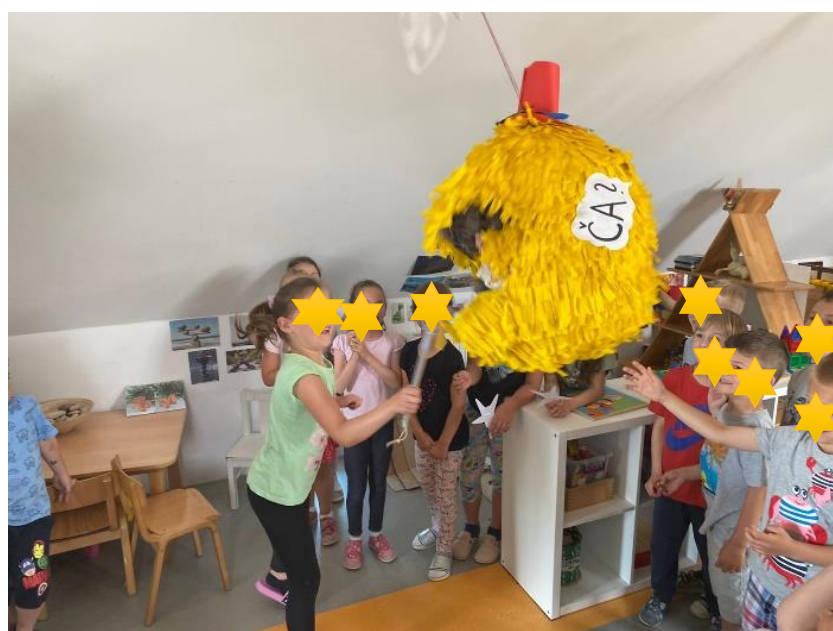
Slika 29. U procesu razbijanja pinjate