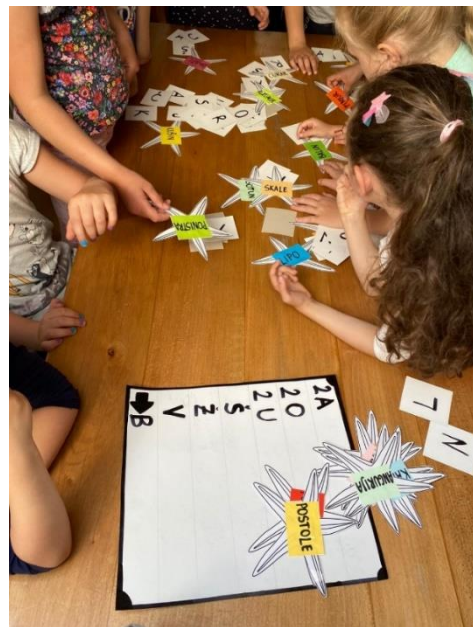
Slika 11. Pronalaženje riječi po zadacima