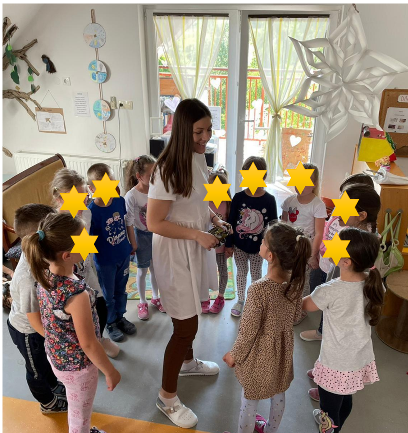
Slika 16. Objašnjavanje pravila igre