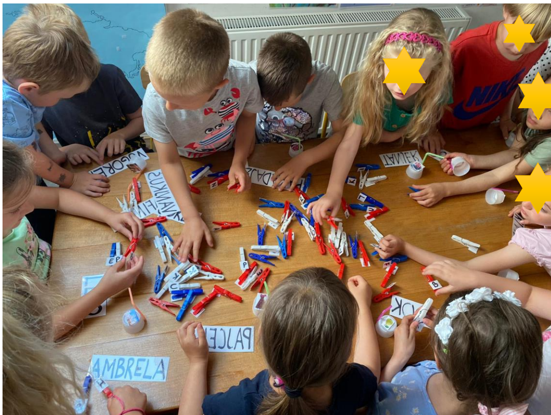
Slika 20. Traženje slova za određenu riječ

Naziv aktivnosti: Pridruživanje slova uz odabranu riječ