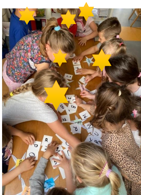
Slika 10. Potraga za slovima