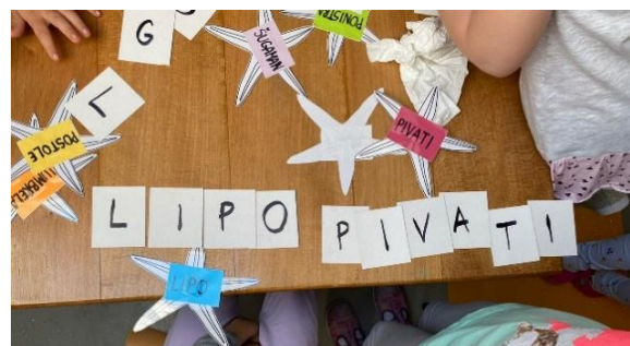
Slika 13. Samoinicijativna aktivnost