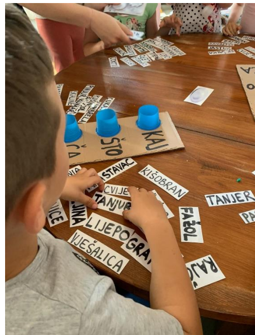
Slika 26. Razvrstavanje riječi po narječjima