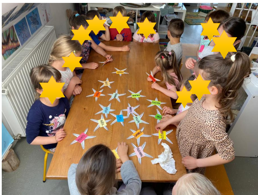
Slika 9. Čitanje i prepoznavanje riječi na morskim zvijezdama