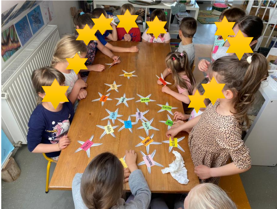
Slika 9. Čitanje i prepoznavanje riječi na morskim zvijezdama