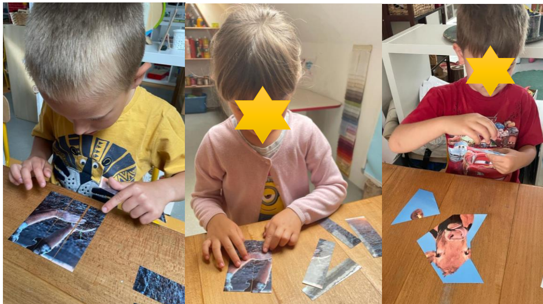
Slika 23. Slaganje dijelova slika