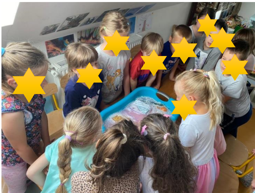
Slika 6. Djeca strpljivo čekaju svoj red