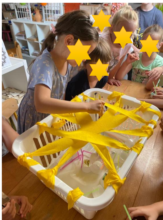
Slika 19. Pincetni hvat