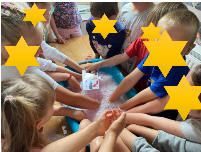
Slika 8. Potraga za stvarima

Naziv aktivnosti: Senzomotorička potraga za stvarima u vodi