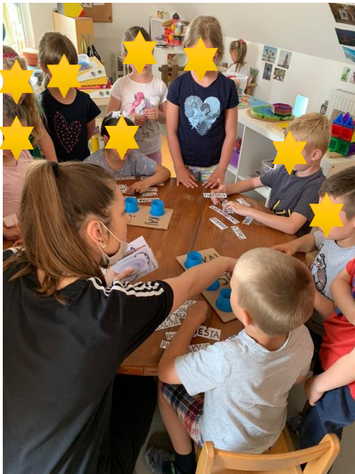
Slika 25. Objašnjavanje pravila

Evaluacija: Djeca su s obzirom na kompleksnost igre vrlo dobro razumjela što se od njih očekuje i koji je njihov zadatak. S ovom igrom su se, što je sasvim logično, teže uhvatila u koštac djeca koja nemaju dobro razvijene čitačke vještine. Njima je odgojiteljica pomagala na način da ih potiče i upućuje na pažljivo slušanje prvog slova, odnosno glasa u riječi, kako bi što brže pronašli odgovarajuću riječ.