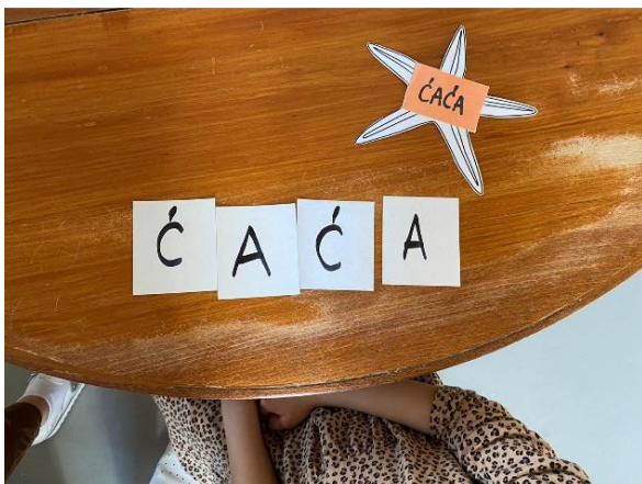
Slika 12. Složena riječ

Evaluacija: U ovoj odgojnoj skupini sva djeca imaju dobro razvijene predčitačke i čitačke sposobnosti, što se moglo jasno vidjeti u prvom dijelu ove aktivnosti. Sva su djeca uspješno pročitala odabranu riječ. U drugom dijelu u kojem su djeca trebala složiti riječ od slova se već vidjela jasnija razlika koliko je koje dijete savladalo prepoznavanje i spajanje slova u riječ. Nekoliko je djevojčica čak samoinicijativno počelo pridruživati dvije riječi. Većina djece je uspješno i brzo odradila ovaj zadatak, dok je nekoliko djece imalo poteškoća u pronalaženju pojedinih slova. U trećem dijelu ove aktivnosti sva djeca su se izvrsno snašla. Traženje riječi koje u sebi imaju određena slova bilo im je jednostavno.