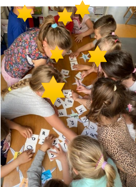
Slika 10. Potraga za slovima