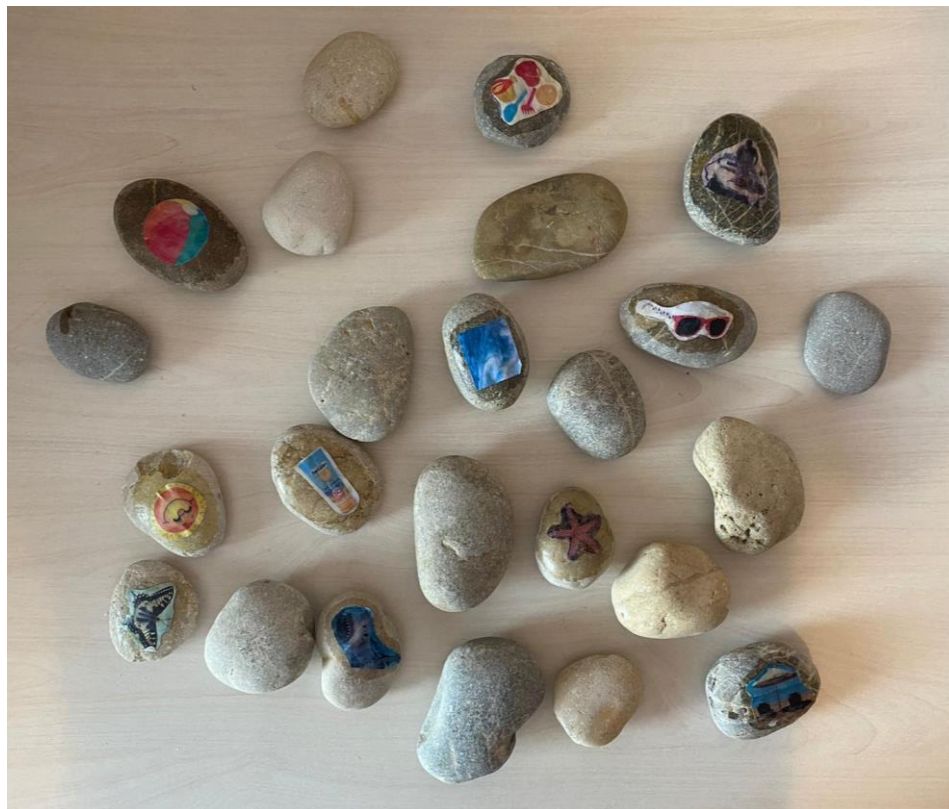
Slika 5. Memory na kamenčićima