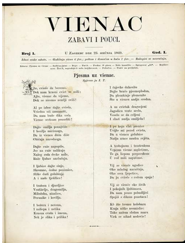
Slika 1 Prvi broj Viena

Glavni je književni list (danas kažemo- časopis) hrvatske književnosti i kulture 19. stoljeća. bio Vijenac, koji je 1869. pokrenula Matica ilirska, danas Matica hrvatska. Vijenac je izlazio kao tjednik, te je mogao kulturna zbivanja pratiti ažurno i spremno. Prvi urednik Vijenca bio je Đuro Deželić, koji je uspio privući na suradnju velik broj književnika i znanstvenika. Već od prvoga broja u njemu surađuju August Šenoa, Ivan Zahar, Ivan Dežman. Već samo nastojanje da časopis afirmira stvarne književne vrijednosti, u stihu i prozi, da tiskom objavljuje samo zrele književne tekstove, a ne više amaterske i početničke vježbe, da nametne primat književnog, umjetničkog i suvremenog nad sentimentalnim i staromodnim, velik je odmak od vremena koje mu je prethodilo.