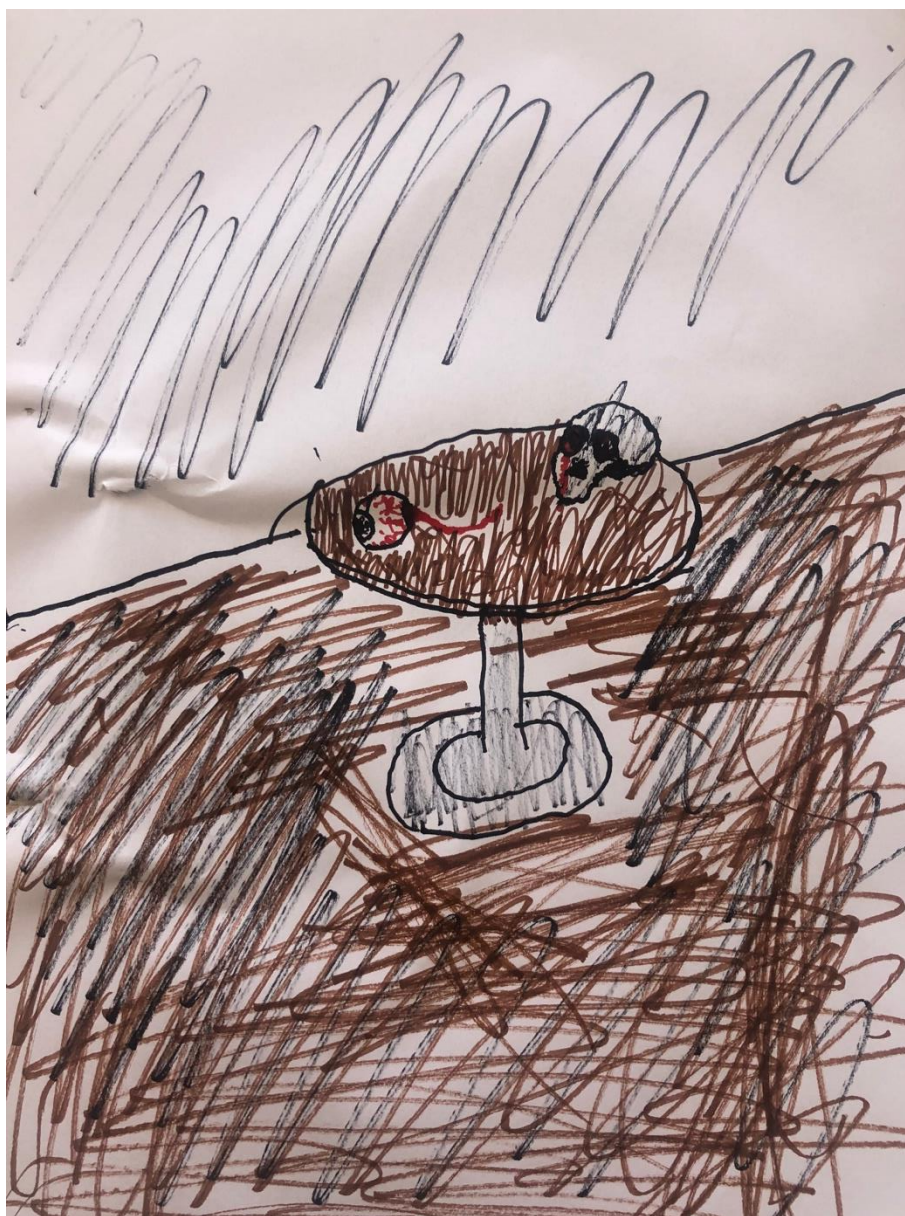
Slika 8. Primjer učeničkog rada