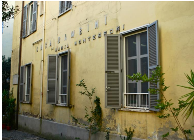
Slika 1 Dječja kuća („Casa dei Bambini“) (slika preuzeta sa stranice

Montessori škole i vrtići otvarali su se po cijelom svijetu, u Sjevernoj Americi, Japanu, Njemačkoj, Indiji itd., a metodu su razglasili posjetitelji koji su dolazili iz cijelog svijeta kako bi se uvjerali u uspješnost Marijinog rada u dječjim kućama. Vrlo brzo je postalo očigledno da su sva djeca sposobna za neovisno učenje i za ostvarenje određenih postignuća ukoliko se poučava njezinom metodom. Za svoje djelovanje Montessori je dobila međunarodna priznanja, a svjetske tiskovine su objavile brojne članke o njoj i uspješnosti njezine metode te je u vrlo kratkom vremenu postala slavna.