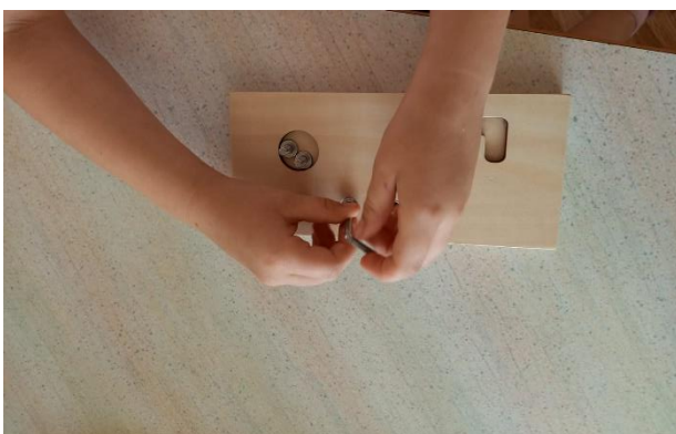
Slika 3 Odvrtnje i zavrtanje vijka (fotografirano u „DV Sopot“)

Pribor koji se koristi u vježbama za praktični život mora biti prilagođen uzrastu djece, npr. u radu će se koristiti maleni predmeti poput male metle, malog čajnika/zdjele/kante i slično. Tu spadaju i posebni okviri koji se koriste za vezanje vezica i vrpce, prišivanje dugmadi, spajanje kukica, lijepljenje čička, rad s iglama i kopčama. Vježbe za praktični život uključuju tri područja: i) brigu za samog sebe (pranje zubi i ruku, obuvanje, oblačenje i skidanje, čišćenje cipela itd.); ii) brigu za okolinu (pranje rublja i suđa, metenje prostorije, brisanje prašine, čišćenje, pranje prozora, briga za biljke i životinje, rad u vrtu itd.); iii) vježbe vezane sa životom u zajednici (pozdravljanje, postavljanje stola, ulijevanje pića, odvrtnje i zavrtanje vijka i sl.) (Seitz i Hallwachs, 1996).