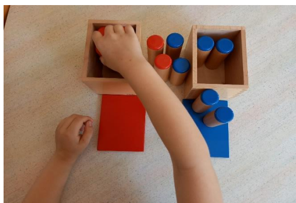
Slika 6 Zvučne bočice (fotografirano u „DV Sopot“)