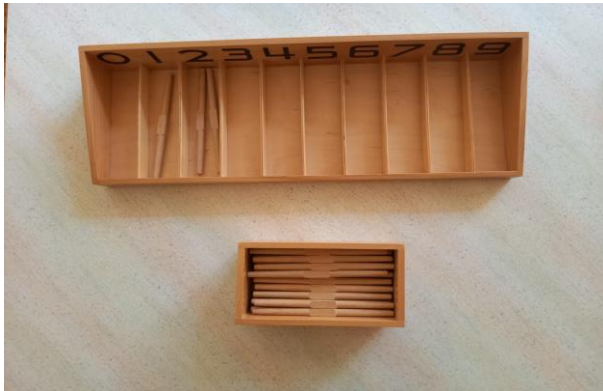
Slika 7 Vretena u kutiji (fotografirano u „DV Sopot“)

Učenje s priborom za matematiku je kinestetičko učenje. Dijete uči radeći i na taj način svladava osnovne zadatke. Pomoću Montessori pribora djeca svladavaju zakonitosti i pravila iz područja matematike na zoran način, a također se mogu svladati i teškoće koje mogu biti prisutne prilikom učenja čime se razvija djetetov matematički duh (Seitz i Hallwachs, 1996).