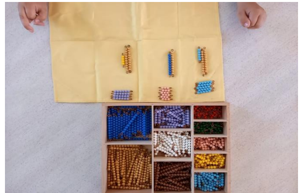
Slika 8 Šarene perlice (fotografirano u „DV Sopot“)