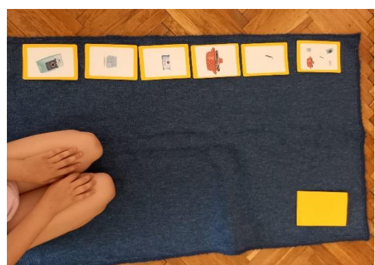
Slika 10 Nomenklature kartice (fotografirano u „DV Sopot“)