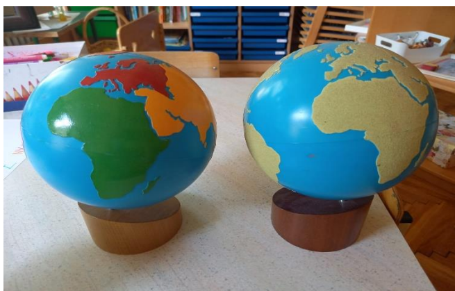
Slika 11 Globus mora i kontinenata u boji (lijevo) Globus mora i kopna hrapavi (desno) (fotografirano u „DV Sopot“)

Maria Montessori je osmislila poseban materijal za kozmički odgoj djece koji su kasnije nadogradili Montessori pedagozi. Taj poseban didaktički materijal uključuje globuse na kojima su zemlje i oceani ispupčeni i mogu se opipati. Znanje iz područja geologije se usvaja putem specijalnog pribora za geologiju. Tako strukturirani materijali omogućuju djeci zorno učenje u kojem istražuju i otkrivaju svijet i svemir (Seitz i Hallwachs, 1996).