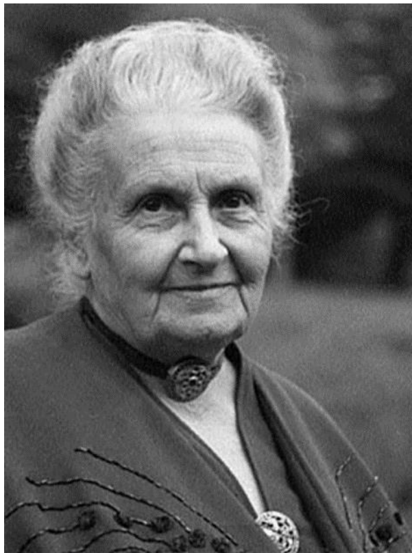
Slika 2 Maria Montessori

Pokret je nastavio rasti unatoč njezinoj smrti, te se početkom šezdesetih godina 20. stoljeća u cijelom svijetu obnovilo zanimanje za njezine ideje, što traje do danas. U Sjedinjenim Američkim Državama 90-ih godina prošloga stoljeća bilo je više od 4000 Montessori vrtića i škola. Programi za Montessori poduke pokrenuti su posvuda u svijetu. Glavna Montessori udruženja sastala su se u listopadu 1991. godine u New Orleansu i utemeljila organizaciju „Savjet za odobravanje programa obrazovanja za Montessori odgajatelje i učitelje“, što predstavlja veliki napredak u suradnji i naporima za međunarodnu primjenu Montessori metode.