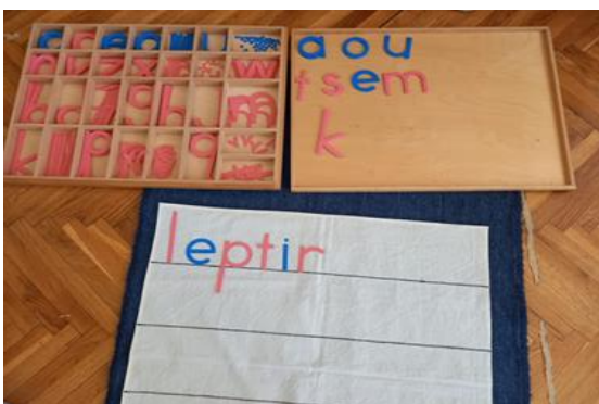
Slika 9 Montessori pribor za pisanje (fotografirano u „DV Sopot“)

Korištenjem pribora za poticanje govora djeca obogaćuju rječnik, šire svijest o materinskom jeziku ili postupno uče i svladavaju strani jezik. Pribor za poticanje govora je usklađen s priborom za poticanje osjetilnih sposobnosti jer putem osjetilnih materijala dijete diferencirano pristupa jeziku i proširuje ga korak po korak (Seitz i Hallwachs, 1996).