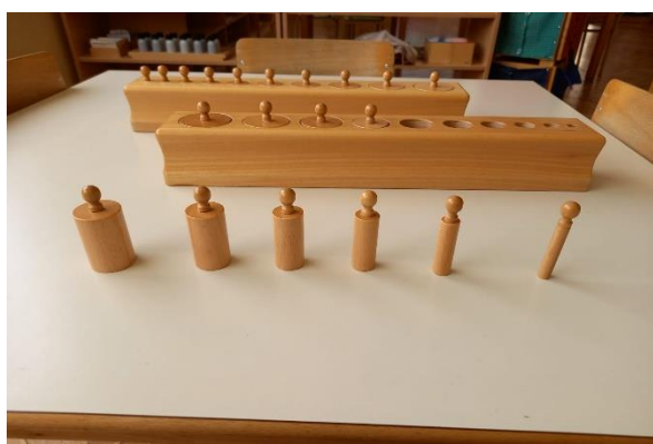
Slika 5 Valjci za umetanje (fotografirano u „DV Sopot“)

Boju, oblik, veličinu, težinu i površinu predmeta dijete spoznaje kao osobine kroz iskustvo koje dolazi preko osjetila što dovodi do materijalizirane apstrakcije. Za Mariju Montessori je vrlo važno da dijete putem jasnih i uređenih dojmova postiže unutarnji red. Montessori osjetilni materijal je jednostavan i ima meditativni karakter jer tijekom rukovanja s njim djeca postižu unutarnji duševni i tjelesni mir te koncentraciju. Kroz osjetilni materijal dijete stječe uređenije, svjesnije i točnije iskustvo (Seitz i Hallwachs, 1996).