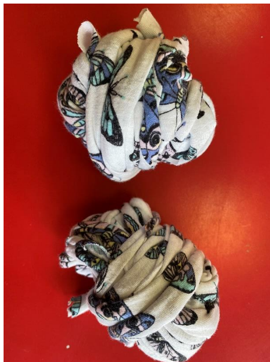
Slika 13. Klupko od izrezane majice

Treća faza obuhvaća omotavanje novonastalog debljeg konca od pamuka oko obruča na različite načine, koji će stvoriti neobičan mozaik. Tijekom pletenja, tj. provlačenja pamučnog konca kroz zavezana polja, učenik može mijenjati pamučni konac te će tako rad biti još maštovitiji. Konac se lako, bez vezanja, može promijeniti i to tako