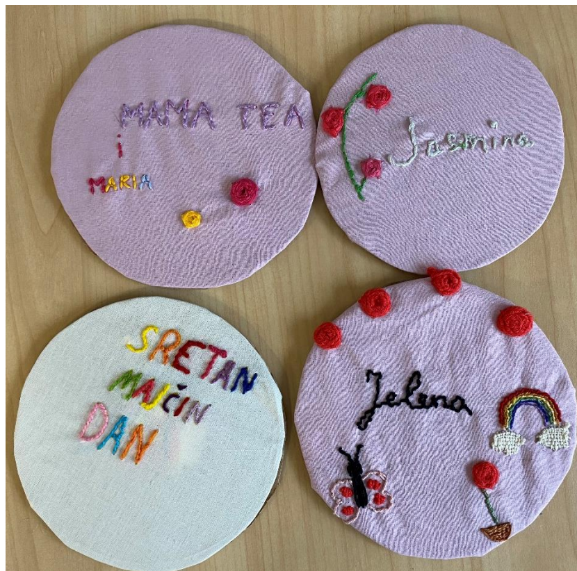
Slika 26. Gobleni povodom Majčina dana