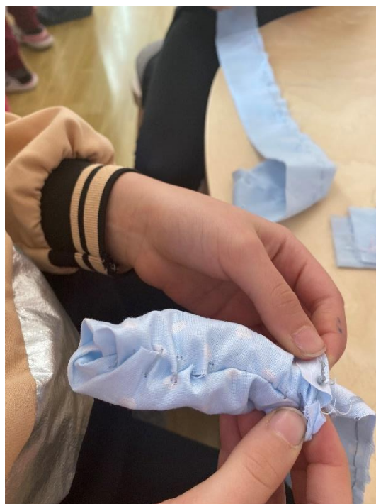
Slika 20. Okretanje tkanine