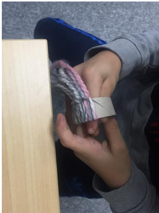
Slika 5. Omotavanje vune oko obruča