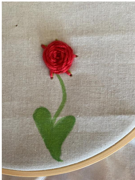
Slika 25. Prva ruža završena

Kada je goblen završen, stavlja ga se u okvir kako bi ga se duže sačuvalo i kako bi služio svrsi. Zato je jedan obruč za goblene dovoljan učeniku da izradi mnogo radova, što ga čini vrlo praktičnim kreativnim alatom. U školi često nije moguće uokviriti sve radove, a kao zamjensko rješenje može se koristiti karton. U tom slučaju izrezuju se dva kartonska kruga jednakog promjera kao i obruč za goblene. Na prvi kartonski krug stavi se platno s radom, zatim se okrene i po rubu stavlja vruće ljepilo. Ostatak platna se zalijepi i dobro zategne na nanoseno ljepilo. Tako će platno ostati zategnuto kao da je uokvirano. Zatim se uzima drugi krug te se lijepi na prethodni kako bi pozadina goblena izgledala uredno. Na pozadini se mogu napisati posveta, datum izrade ili ime autora.