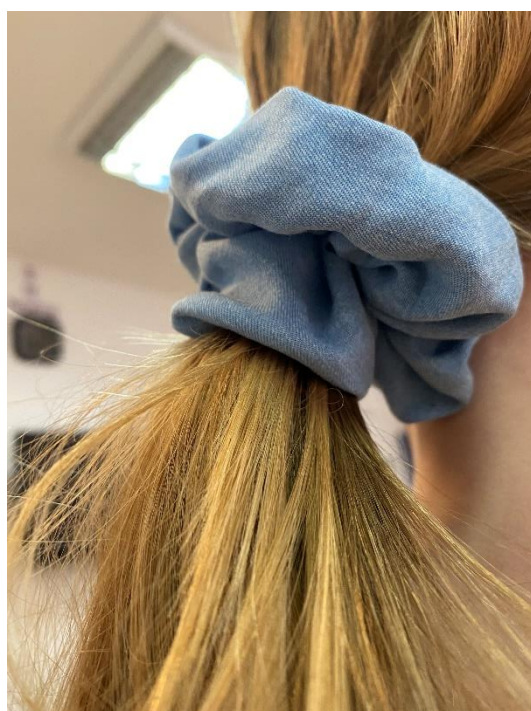
Slika 22. Gumica za kosu u funkciji