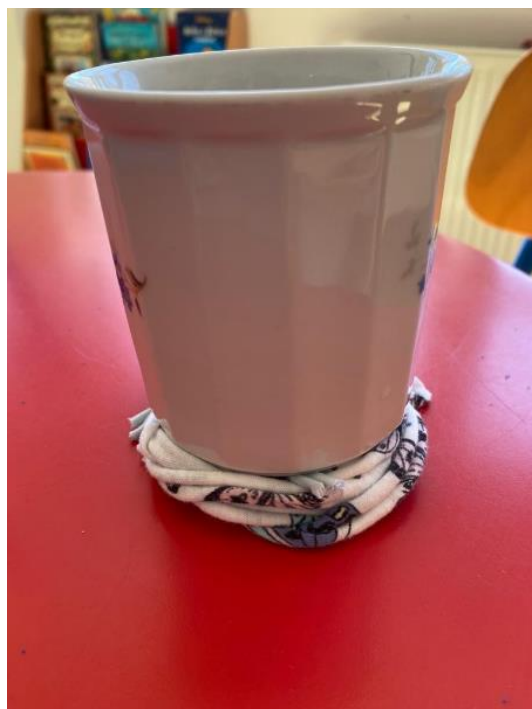
Slika 15. Upotreba podmetača