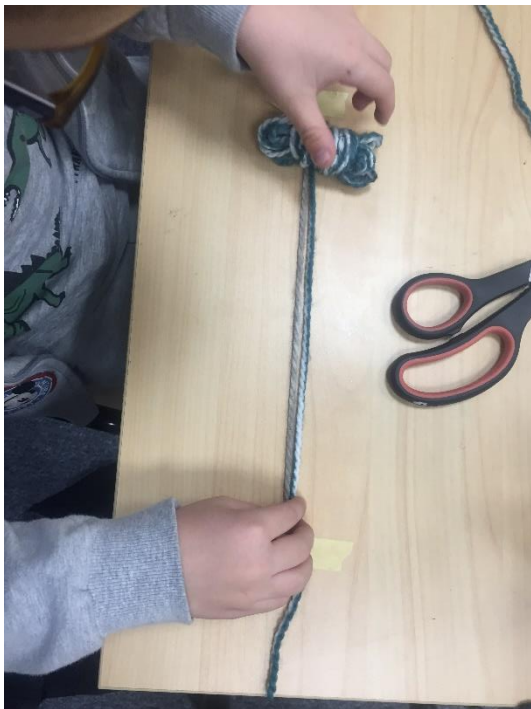
Slika 4. Rezanje trakica vune

Za navedenu aktivnost potrebni su klupko vune, obruči izrezani od rolica toaletnog papira, vata i škare. Učenicima je prije održavanja aktivnosti zadano da u svome kućanstvu prikupe rollice toaletnog papira koje su ključne za izradu vunениh kapica. Samostalnim prikupljanjem i donošenjem materijala u školu učenici mogu razviti ideju i za upotrebu drugih materijala koji se nalaze u njihovoj okolini, koje su prvobitno planirali odbaciti. Aktivnost započinje objašnjavanjem važnosti dužine svake trakice jer će točnost i preciznost uvelike olakšati izradu i završni rad učiniti urednim. Učenici na stol lijepe jednu trakicu duljine trideset centimetara. Zatim dobivaju manje klupko te samostalno izrezuju trakice jednake duljine. Zatim rolicu toaletnog papira izrezuju na obruče.