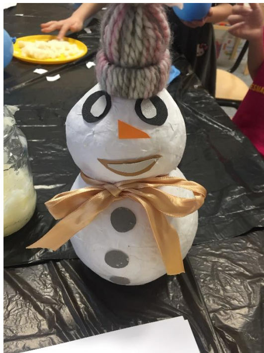
Slika 8. Završen i uređen snjegović