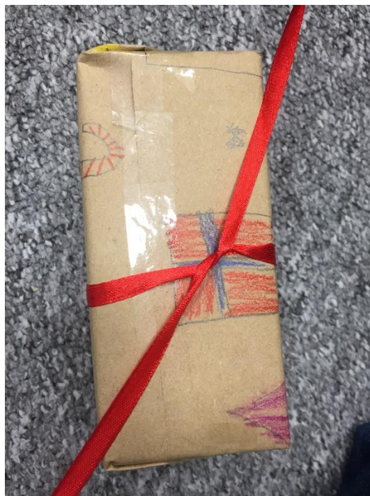
Slika 17. Vežanje mašne na kraju