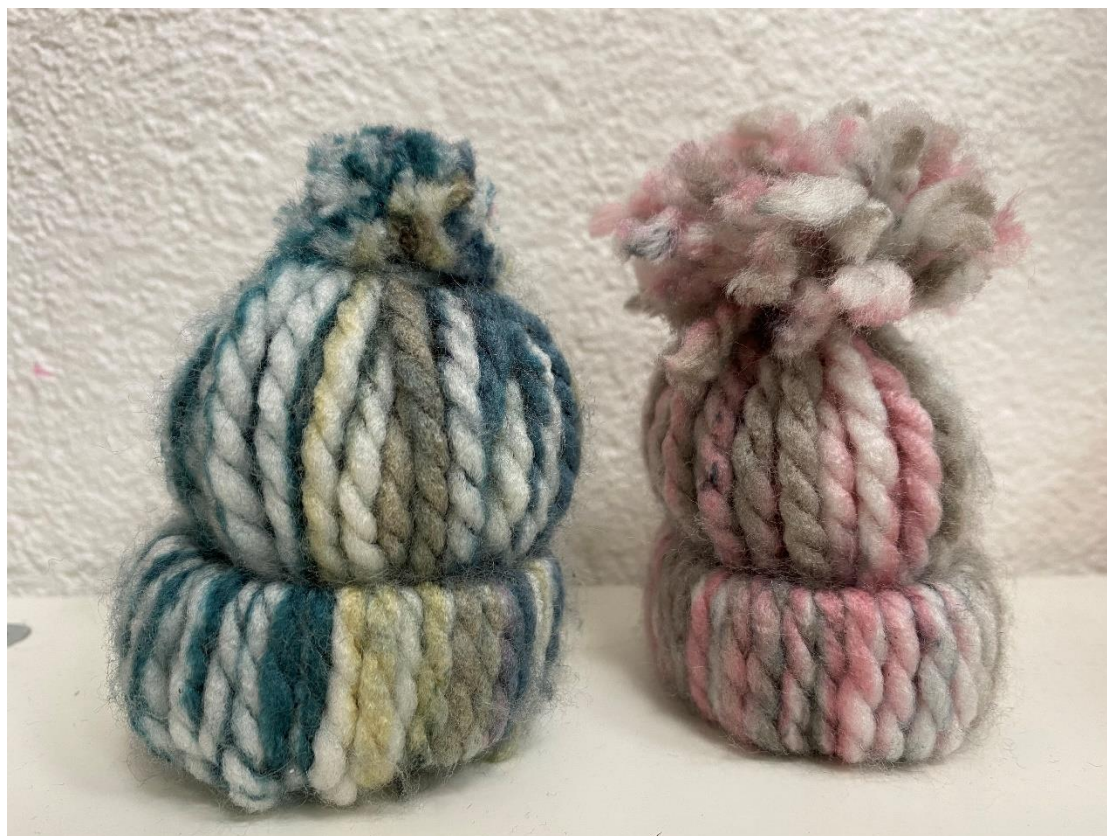
Slika 6. Završene vunene kapice

Zadatak je prilično jednostavan: savinuti trakicu na pola, provući kroz obruč s unutarnje strane te s vanjske strane provući prvi dio prepolovljene trakice kroz drugi dio trakice, čime se dobiva manji čvor kojim se trakica drži za obruč. Ostatak trakice visi s jedne strane obruča. Ako se pogriješi prilikom rada, to će se lako prepoznati jer svaki višak trakice treba visjeti s iste strane kao ključna komponenta za izradu cofleka. Jednostavni potez ponavlja se dok se ne popuni cijeli obruč. Zatim slijedi vezanje svih ostataka trakica. Kada su trakice povezane u manji svežnjić, tj. repić, slijedi uređivanje i obrezivanje cofleka škarama. Na kraju u unutrašnjost gotove kapice treba staviti malo vate kako bi kapica dobila oblik.