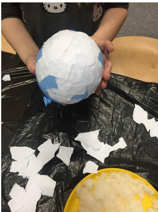
Slika 7. Strpljiva izrada

Za navedenu aktivnost potrebni su kaša za kaširanje, bijeli papir, dva balona, marker i već izrađena vunena kapica. Kaša za kaširanje skuha se od brašna i vode. Pogodnija je malo gušća kaša, stoga se predlaže dodati više brašna nego što je predviđeno. Kašu je najbolje skuhati noć prije izrade jer se treba dobro stisnuti. Bijeli papir koji će se koristiti u izradi treba biti recikliran ili već upotrebljavan. Učenici mogu sami napuhati svoje balone te odrediti veličinu tijela snjegovića, a jedino je pravilo da gornji dio treba biti manjih dimenzija, tj. da gornji balon bude slabije napuhan. Ako se učenici uprljaju kašom za kaširanje, neće biti problema jer se brašno i voda lako očiste, stoga ih učitelj potiče na slobodnije kretanje i istraživanje vlastitih sposobnosti, koje uključuju strpljivost i preciznost. Ova aktivnost pogodna je za razvijanje fine motorike i koordinacije oko-ruka jer će sitni papiri, koje su učenici trebali iskidati, kliziti u doticaju s kašom na balonu. Svaki komadić treba strpljivo posložiti da nema praznina. Nakon što je cijeli balon prekriven papirićima namočenim u kašu, slijedi sušenje. Sutradan se čačalicom ili škarama buši balon te se dobiva željeni oblik snjegovića. Učitelj pripomaže vrućim ljepilom prilikom spajanja dijelova snjegovića.