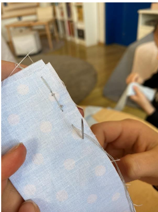
Slika 19. Spajanje rubova trake

Za navedenu aktivnost potrebni su tkanina, igla i konac boje slične tkanini, elastična traka i sigurnosna igla. Najpogodnije su tkanine, osim pamuka, popelin, tetra ili viskoza. Doduše, sve tkanine mogu doći u obzir ako zadatak ima i reciklažnu svrhu. Kada učenici dobiju zadatak da od kuće donesu odjeću za reciklažu, imat će velik izbor vrsta tkanina, što će gumice na kraju činiti vrlo originalnima i neobičnima. Tkaninu je potrebno izrezati u trake širine sedam i dužine trideset centimetara. Traku je prije šivanja potrebno okrenuti naopačke. Zatim počinje šivanje, pri čemu je traka presavinuta na pola te se iglom i koncem spajaju dva kraja tkanine po duljini. Ako je šav sitniji i precizniji, gumica za kosu bit će urednija i čvršća. Kada je traka prošivena, okreće se pomoću prstiju ili olovke na koju se može navući.