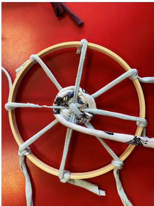
Slika 14. Izrada podmetača

da se na početku svakoga dijela konca škarama izreže uzak prorez te se svaki dio provuče kroz taj prorez, zategne i spoji.