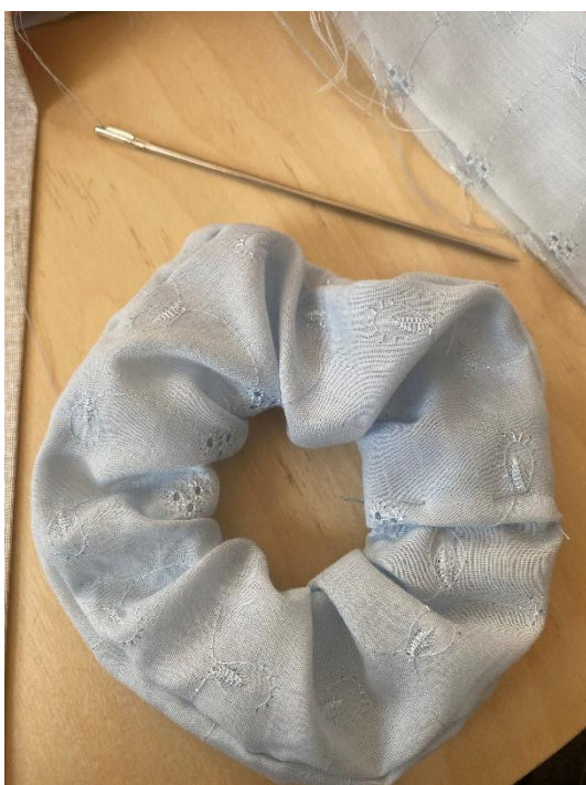
Slika 21. Završena gumica za kosu

Zatim se uzima sigurnosna igla koja je provučena kroz elastičnu traku i provlači se kroz sašivenu traku. Na kraju se dva ruba po širini oko elastične trake spajaju te tako nastaje gumica za kosu koju djeca popularno zovu scrunchie . Po želji se od ostatka tkanine može dodati mašna za ukras. Djevojčice su u pravilu vrlo motivirane za izradu i šivanje jer završenu rukotvorinu mogu upotrebljavati svaki dan. Dječaci, nimalo manje motivirani, izrađenu gumicu nerijetko poklanjaju majkama, sestrama ili prijateljicama iz razreda. Povrh svega, i djevojčice i dječaci u prilici su vježbati svoju sposobnost šivanja te razvijaju strpljenje i preciznost.