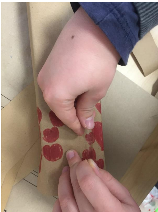
Slika 16. Precizno umatanje u tijeku

Za navedenu aktivnost potrebni su prazne kutijice od potrošenih proizvoda, smeđi pak-papir, flomasteri, bojice, markeri, škare, selotejp i ukrasna trakica. Učenici će u svojim kućama tijekom određenog perioda prikupljati prazne kutijice od čajeva, lijekova, kozmetičkih proizvoda, igračaka, hrane i slično. Prazne kutijice važna su stavka s popisa materijala jer će upravo one služiti za vježbu i učenje zamatanja darova. Cilj je aktivnosti prenijeti djeci znanje koje se u modernom svijetu sve više gubi zato što većina trgovina nudi uslugu zamatanja dara. Ova vježba učenike najviše uči strpljenju, preciznosti i urednosti. Osim toga, njihov će ukrasni papir biti poseban zato što će ga sami dizajnirati i ukasiti po želji. Izražavat će se koristeći se svojom maštom, a zauzvrat će dobiti nešto vrlo originalno. Učenici će na kraju aktivnosti osjetiti koliko je volje i truda potrebno uložiti u ukrašavanje dara.