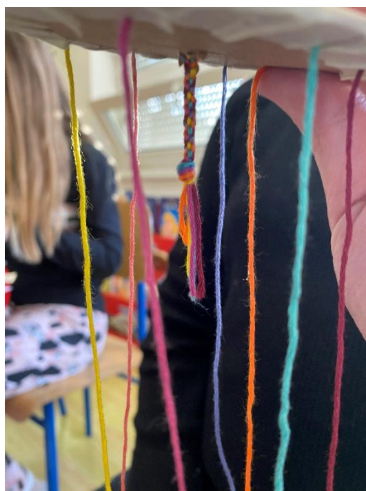
Slika 10. Za vrijeme izrade