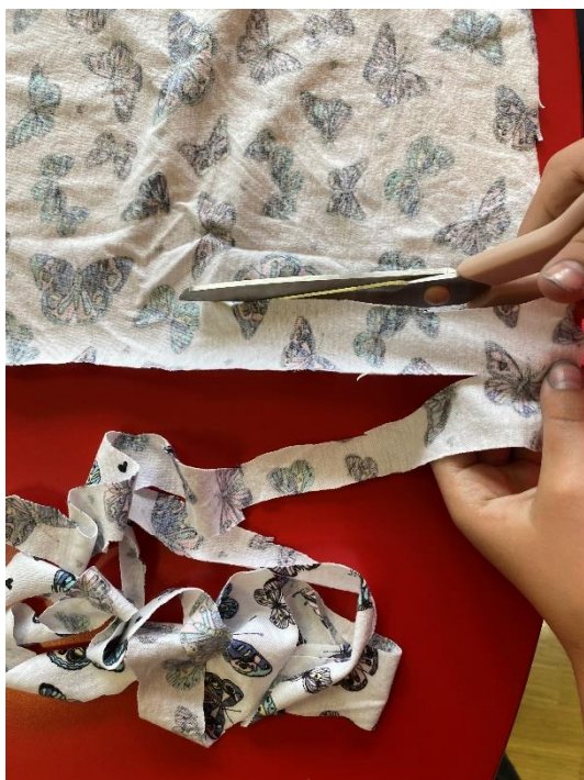
Slika 12. Rezanje majice na trakice

Za navedenu aktivnost potrebni su obruč za goblen, stare pamučne majice i škare. Pamuk je odličan za izradu jer se prilikom rezanja ne trga, nego se razvlačenjem obrub skuplja te nema končića i nastaje uredno klupko. Izrezivanjem majica i stvaranjem klupka djeca će shvatiti da odjeća koju su planirali baciti ne mora nužno završiti u otpadu, nego se može reciklirati i ponovno biti svrsishodna. Učenici će moći dekorirati svoju učionicu vlastitim rukotvorinama. Cilj je aktivnosti formirati stajalište o recikliranju te potaknuti na osmišljavanje sličnih materijala koje također možemo reciklirati. U prvoj fazi izrade prikuplja se odjeća za reciklažu, a u drugoj se fazi odjeća reže na komade pogodne za izradu pamučnog klupka.