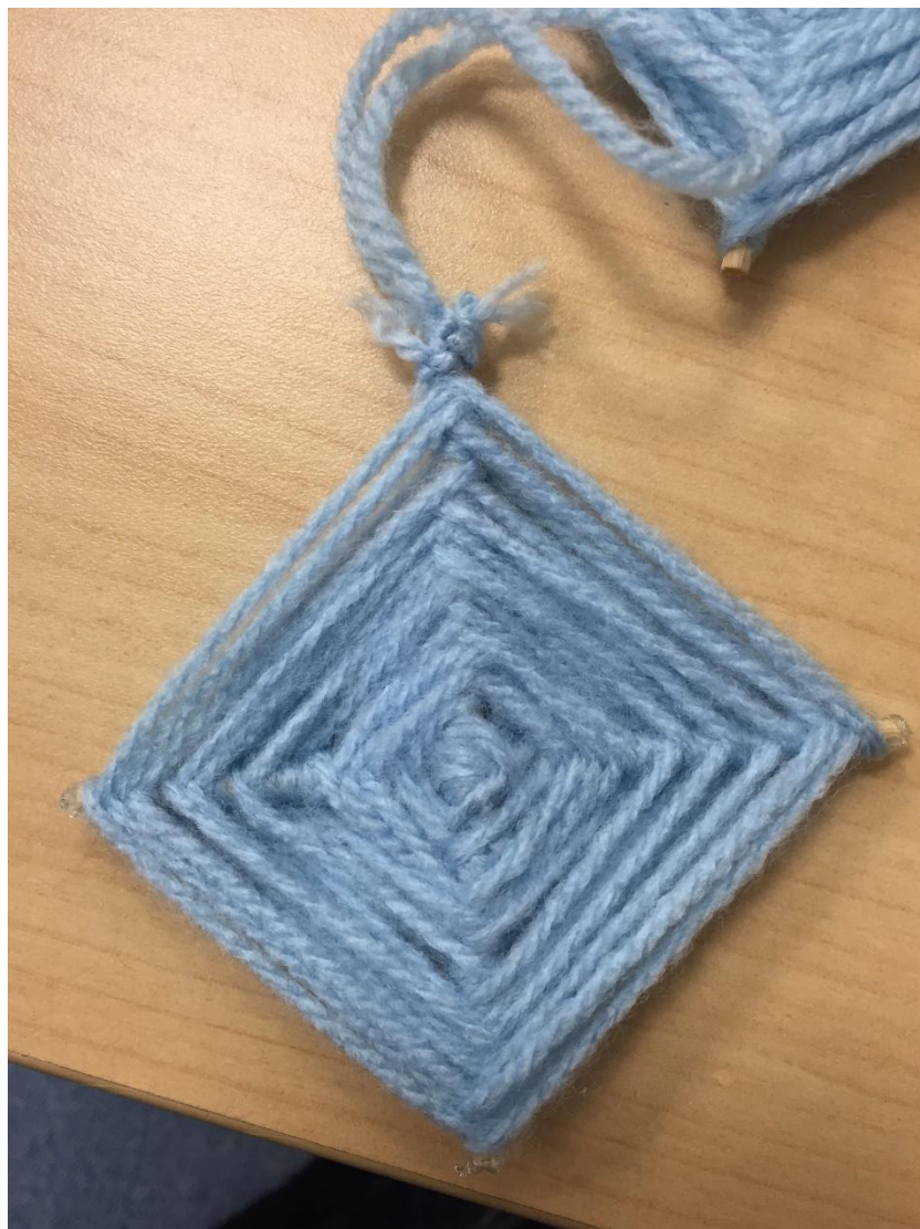
Slika 3. Završena vunena pahuljica