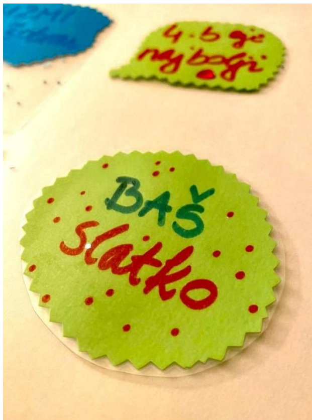
Slika 23. Popularna uzrečica kao naljepnica

Za navedenu aktivnost potrebni su kolaž papir, markeri, flomasteri, bojice, uređaj za plastificiranje, samoljepljiva traka i škare. Također, može poslužiti novinski papir iz kojeg se mogu izrezivati oblici, slova, riječi ili fotografije. Svaki učenik dobiva jednu prozirnu foliju za plastificiranje i slobodu za donošenje odluka o broju naljepnica i ostalome. Savjet je učeniku da se izradi što više naljepnica u jednoj foliji. Kada se folija provuče kroz plastifikator, svaka se naljepnica zasebno izreže i iza nje se nalijepi obostrana ljepljiva traka. Nakon toga naljepnice su spremne za korištenje i razmjenu. Navedeni način izrade naljepnica može poslužiti učiteljima za izradu kartica s imenima na početku školske godine ili kartica sa zaduženjima u razredu. Između ostalog, cilj je aktivnosti pokazati učiteljima da je ponekad pogodno prilagoditi se novitetima zanimljivima djeci te smisliti nove kreativne zadatke prilagođene određenom razdoblju.