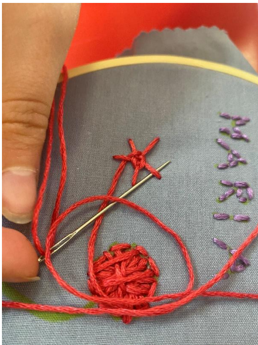
Slika 24. Vježbanje veza ruže