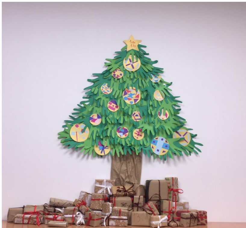
Slika 18. Darovi ispod božićnog drvca