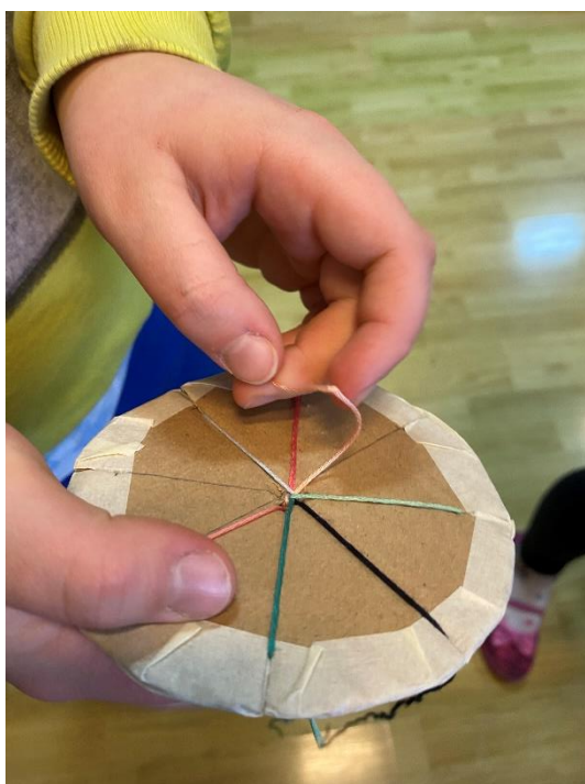
Slika 9. Prebacivanje trećeg konca

Za navedenu aktivnost potrebni su karton, sedam raznobojnih konaca, ljepljiva traka i škare. Od kartona se izreže krug koji će služiti kao pomagalo za pletenje narukvica, a pomoću ravnala njegova se površina podijeli na osam polja. Škarama se svako polje zarezuje jedan centimetar te ljepljivom trakom oblijepi rub kruga. Na taj će način pomagalo za pletenje narukvica izdržati duže te će poslužiti za izradu mnoštva narukvica. Za izradu narukvica mogu poslužiti konac ili vuna, no najpogodniji je konac za goblene od šest niti. Izrada koncem za goblene prilično je delikatna zbog niti koje se često odvajaju, stoga učenici moraju pažljivo, strpljivo i precizno raditi kako ne bi došlo do zapetljavanja. U sredini kruga probuši se rupica kroz koju se provlači sedam konaca zavezanih u skup. Čvor će biti ispod kruga, a na vrhu će se konci provući u utore na rubu kruga. Od osam utora sedam će biti popunjeno koncima, dok osmi utor uvijek treba ostati prazan, a konac s trećega utora (brojano od praznoga utora) prebacuje se u prazni utor na desnu stranu. Krug se okreće cijelo vrijeme, a prazni utor uvijek je okrenut prema učeniku koji stalno prebacuje treći konac od praznoga. Nakon nekoga vremena ispod kruga će početi izlaziti pletena narukvica neobičnog mozaika, ovisno o korištenim bojama.