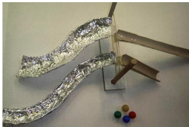
Slika 4. Dvostruki tobogan (Slunjski 2006)

Spoznajni razvoj: razvoj taktilne i vizualne percepcije; razvoj prostorne percepcije (pokreti loptice u prostoru); stjecanje iskustva i spoznaja u predmetnoj sredini (vođenje zapažanja, nova iskustva); stjecanje iskustva istraživanjem odnosa i veza među predmetima; stjecanje iskustva o uzročno – posljedičnim vezama; razvoj pozornosti.