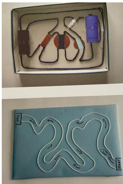
Slika 7. Magnetni labirint (Slunjski, 2006)

Stalna dodavanja novih predmeta i samoinicijativno donošenje novih predmeta čiju mogućnost privlačenja djeca žele provjeriti te poticajnim odgojno – obrazovnim aktivnostima, potaknut će istraživanje te će omogućiti sređivanje, grupiranje i verbalizaciju iskustava o tome koje materijale magnet privlači, koji od njih sami stječu magnetizam, a koji to ne mogu (Došen Dobud, 2018).