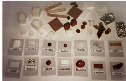
Slika 2. Primjer materijala (Slunjski, 2006)

Spoznajni razvoj: razvoj sposobnosti uočavanja veza i odnosa među stvarima i pojavama – shvaćanje prirodnih pojava (promjena u prirodi); razvoj sposobnosti rješavanja problema – uočavanje problema, kombiniranje različitih iskustava, stvaranje pretpostavki, traženje rješenja, otkrivanje zakonitosti (razmišljanje o tome hoće li nešto plutati ili tonuti u vodi, zašto će plutati, odnosno tonuti...)