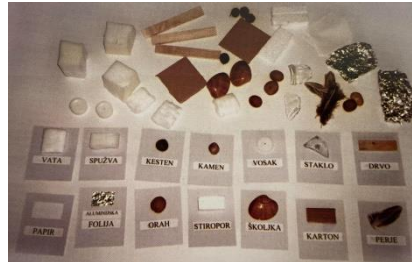
Slika 2. Primjer materijala (Slunjski, 2006)

Spoznajni razvoj: razvoj sposobnosti uočavanja veza i odnosa među stvarima i pojavama – shvaćanje prirodnih pojava (promjena u prirodi); razvoj sposobnosti rješavanja problema – uočavanje problema, kombiniranje različitih iskustava, stvaranje pretpostavki, traženje rješenja, otkrivanje zakonitosti (razmišljanje o tome hoće li nešto plutati ili tonuti u vodi, zašto će plutati, odnosno tonuti...)