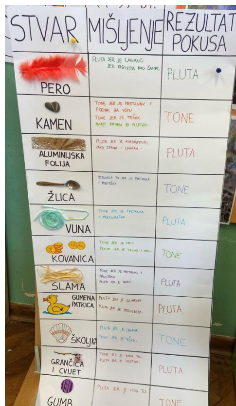
Slika 1. Aktivnost pluta - tone, DV Zvončić

Na sljedećoj je slici prikazan rezultat provedene aktivnosti pluta – tone, u DV Zvončić, u mješovitoj skupini. Djeca su prije provedenog eksperimenta iskazivala svoja mišljenja o tome hoće li što plutati ili tonuti.