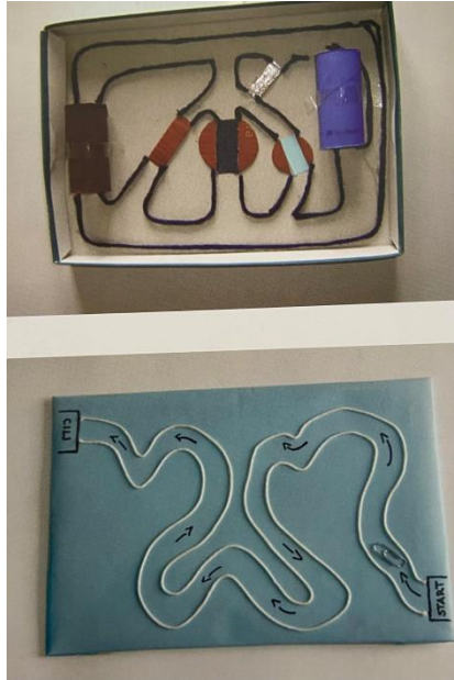
Slika 7. Magnetni labirint (Slunjski, 2006)

Stalna dodavanja novih predmeta i samoinicijativno donošenje novih predmeta čiju mogućnost privlačenja djeca žele provjeriti te poticajnim odgojno – obrazovnim aktivnostima, potaknut će istraživanje te će omogućiti sređivanje, grupiranje i verbalizaciju iskustava o tome koje materijale magnet privlači, koji od njih sami stječu magnetizam, a koji to ne mogu (Došen Dobud, 2018).