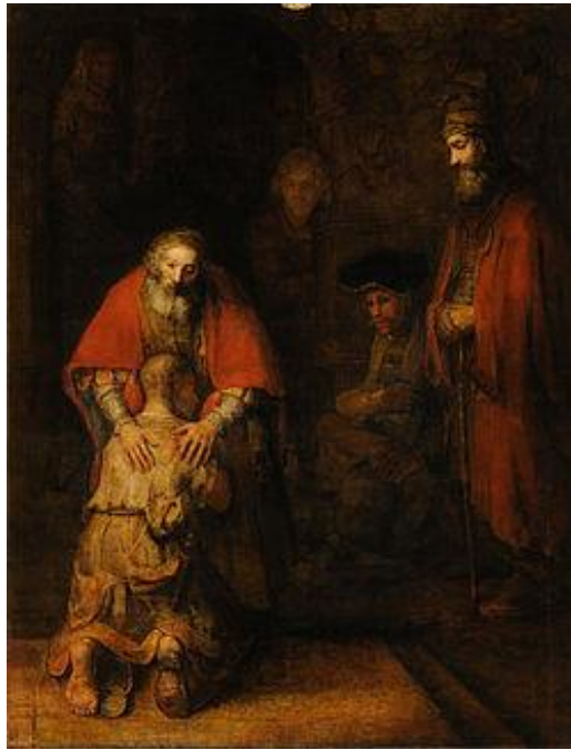
Slika 1 Povratak izgubljenog sina - Rembrandt van Rijn