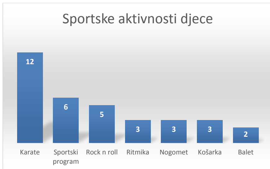
Graf 2. Sportske aktivnosti djece

Rezultati dobiveni iz anketnog upitnika pokazuju da se 34 djece bavi nekom vrstom kineziološke aktivnosti, dok se samo osam djece ne bave nikakvim sportom. Nadalje, odgovor na pitanje kojim sportovima se djeca bave prikazat ćemo u sljedećem prilogu.