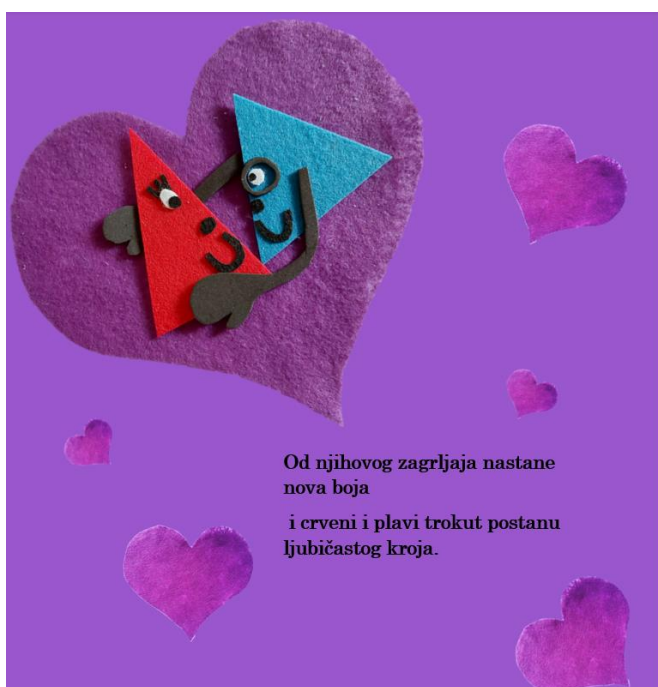
Slika 18. Šesnaesta stranica autorske slikovnice „Mali trokut velikih prijatelja“