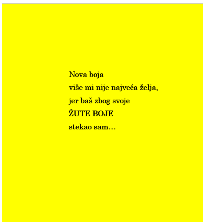
Slika 20. Osamnaesta stranica autorske slikovnice „Mali trokut velikih prijatelja“