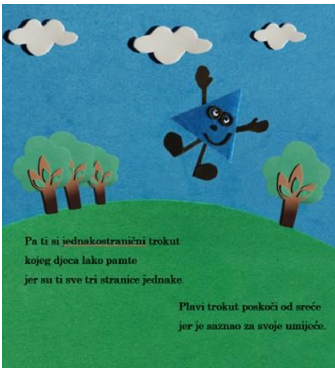
Slika 14. Dvanaesta stranica autorske slikovnice „Mali trokut velikih prijatelja“