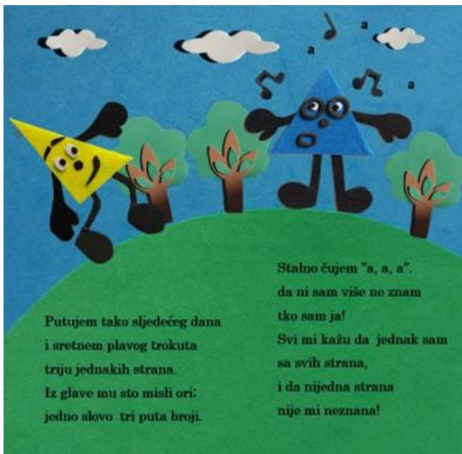
Slika 13. Jedanaesta stranica autorske slikovnice „Mali trokut velikih prijatelja“