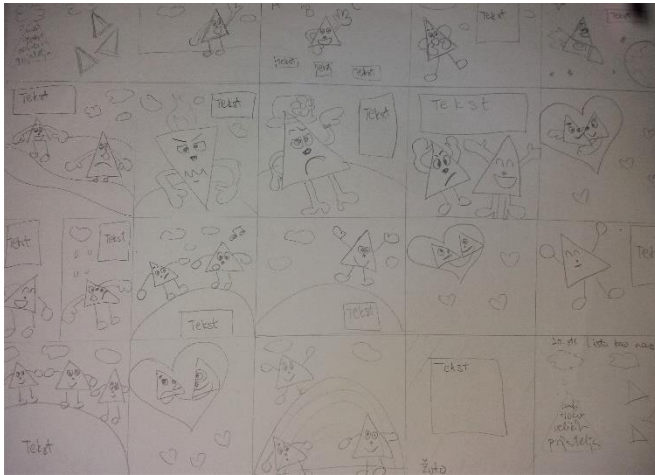
Slika 1. Storyboard slikovnice „Mali trokut velikih prijatelja“

njihovim međusobnim pomaganjem, ujedno upoznaju i s procesom miješanja i imenovanja osnovnih boja. Poruka cijele slikovnice objedinjena je na samome kraju kada raznostranični trokut ugledavši dugu shvati kako je njegova originalnost i izvornost jedinstvena te da bez njega, ovaj svijet ne bi bio jednako lijep, kao što je s njim.