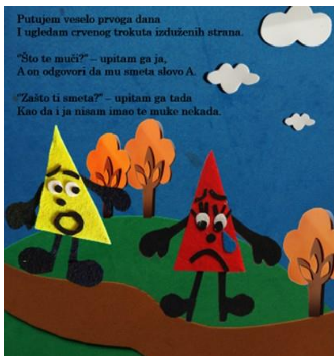
Slika 6. Četvrta stranica autorske slikovnice „Mali trokut velikih prijatelja“

Putujem veselo prvoga dana I ugledam crvenog trokuta izduženih strana.