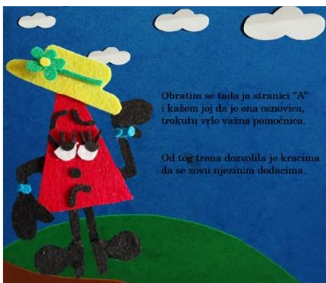
Slika 9. Sedma stranica autorske slikovnice „Mali trokut velikih prijatelja“