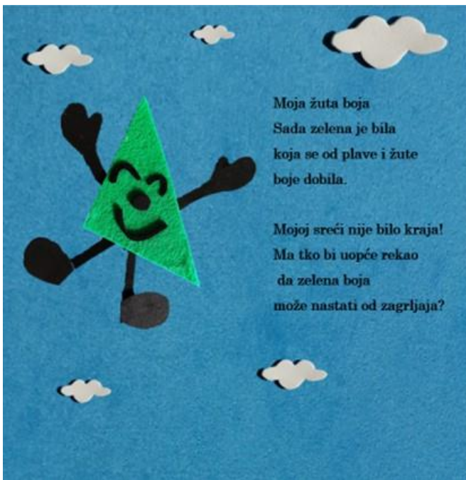
Slika 15. Trinaesta stranica autorske slikovnice „Mali trokut velikih prijatelja“

Moja žuta boja Sada zelena je bila koja se od plave i žute boje dobila.