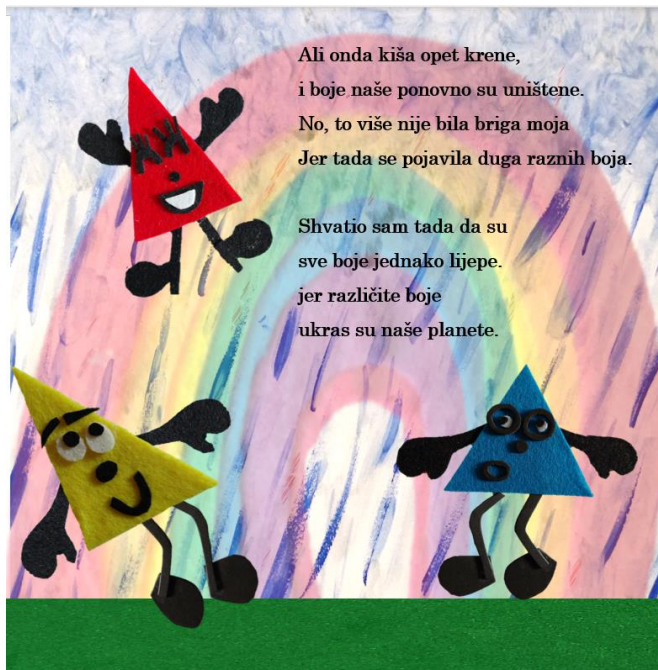
Slika 19. Sedamnaesta stranica autorske slikovnice „Mali trokut velikih prijatelja“