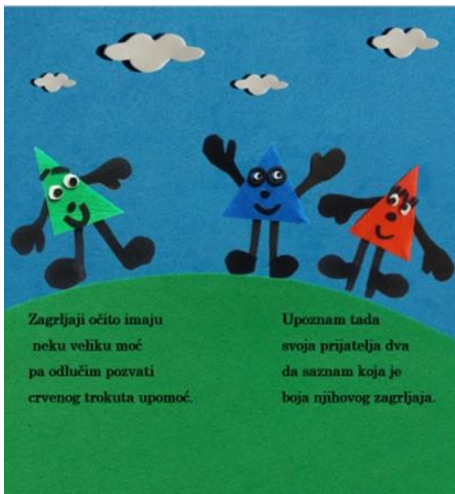
Slika 17. Petnaesta stranica autorske slikovnice „Mali trokut velikih prijatelja“