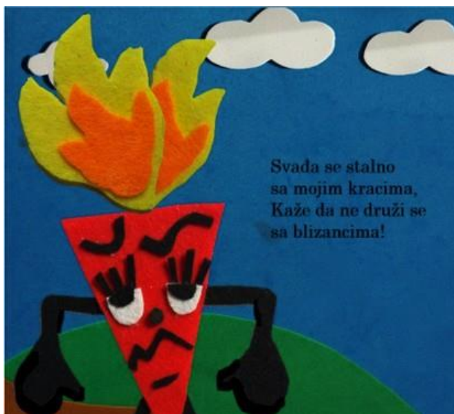
Slika 8. Šesta stranica autorske slikovnice „Mali trokut velikih prijatelja“