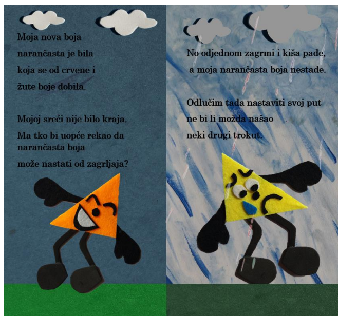
Slika 12. Deseta stranica autorske slikovnice „Mali trokut velikih prijatelja“