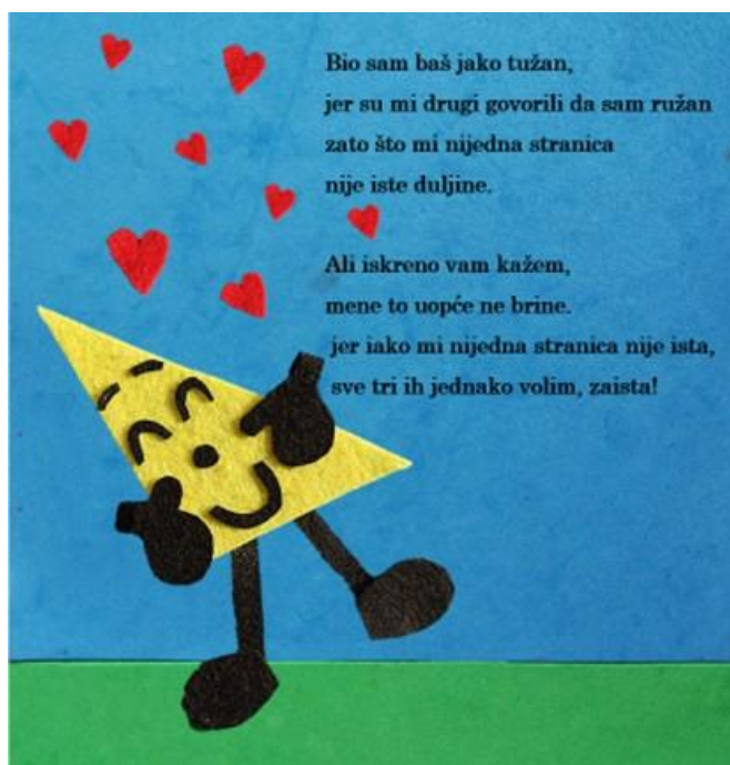
Slika 5. Treća stranica autorske slikovnice „Mali trokut velikih prijatelja“