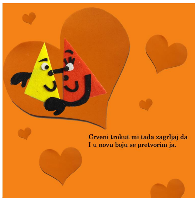
Slika 11. Deveta stranica autorske slikovnice „Mali trokut velikih prijatelja“