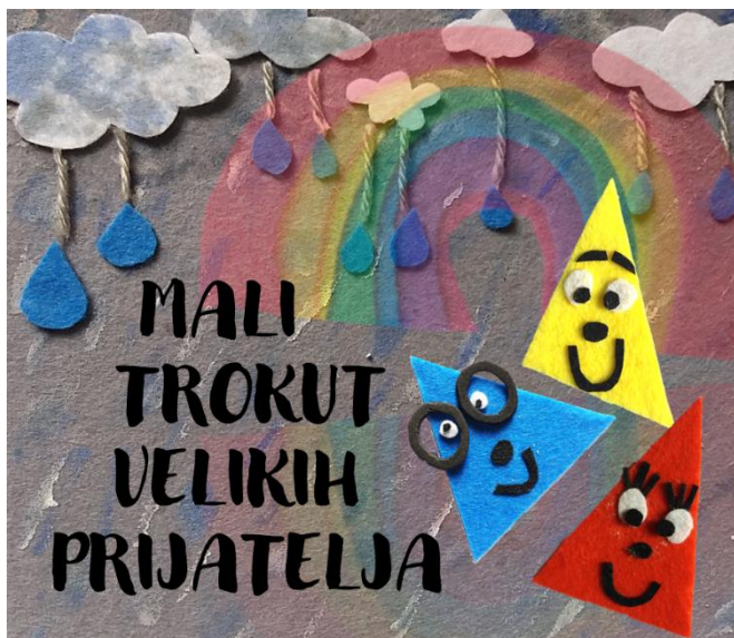
Slika 2. Naslovna stranica i posljednja stranica slikovnice „Mali trokut velikih prijatelja“