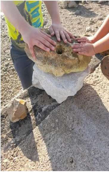
Slike br. 3