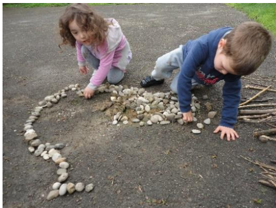
Slike br. 4 - Sunce

Djeca su na prirodan način, spontano i bez vanjskih ograničenja slobodno uranjala u aktivnost, istražujući pri tome mogućnosti različitih načina kreativnog izražavanja. Samostalno prikupljaju potrebne materijale iz svog okruženja (kamenje, grančice, cvjetove, pokošenu travu, lišće...) te stvaraju pojedinačne i zajedničke kompozicije u obliku mandala.