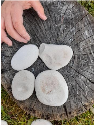
Slike br. 2