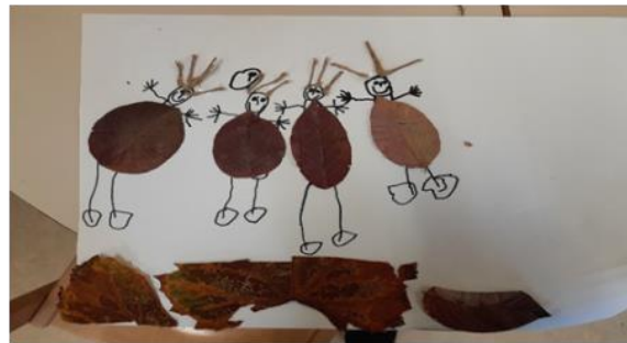
Slike br. 30 - Ja i moj prijatelj