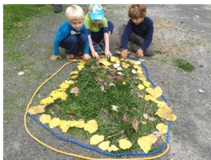
Slika br. 6 - Kuća