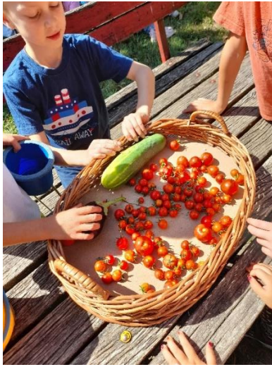
Slike br. 11