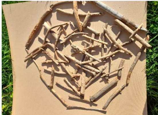
Slika br. 9 – Gnijezdo za vrpce