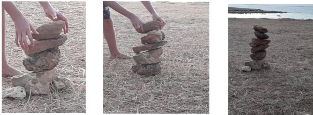
Slike br. 1

Ovaj kolaž fotografija nastao je u morskombijentu kao izraz slobodnog balansiranja kamenjem.