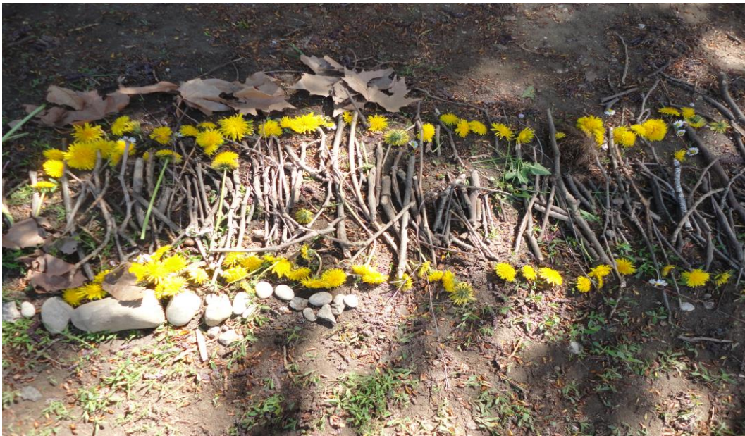
Slike br. 21 – Put u rudnik