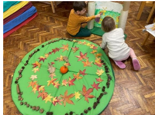
Slike br. 15 – Spirale od lišća jeseni