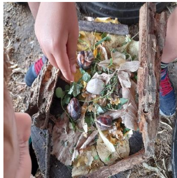
Slike br. 25 - Zvijezda, srce, cvijet ljubavi