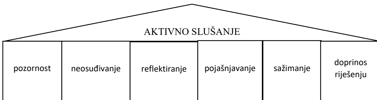
Slika 7. Vještine aktivnog slušanja