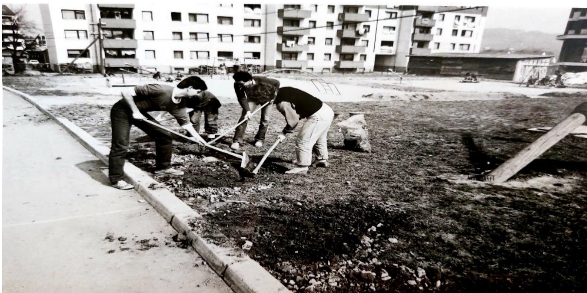
Slika 15. Radne akcije zaposlenika i roditelja novog objekta vrtića