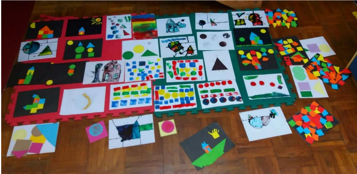
Slika 30. Radovi nastali kroz projekt „Boje“

Posebno značajnu orijentaciju suvremenom kurikulumu daje Reggio pristup na kojem se temelji cjelokupna organizacija odgojno-obrazovnog procesa i oblikovanja kurikuluma, čije su osnovne značajke sadržane u kategorijama (Slunjski, 2011) ravnopravnih, recipročnih odnosa između djece i odraslih, zatim uvažavanju prirodne kreativnosti djeteta, koju je potrebno sustavno njegovati, poticati i razvijati. Uz navedeno naglašava se značaj okruženja koji omogućuje izražavanje kreativnosti, slobodu djetetovog izbora aktivnosti, istraživanja i otkrivanja. Pri tome djeca i odrasli partneri su u procesu učenja, koje se temelji na istraživanju, otkrivanju, zajedničkom interpretiranju i razumijevanju vlastitog iskustva.