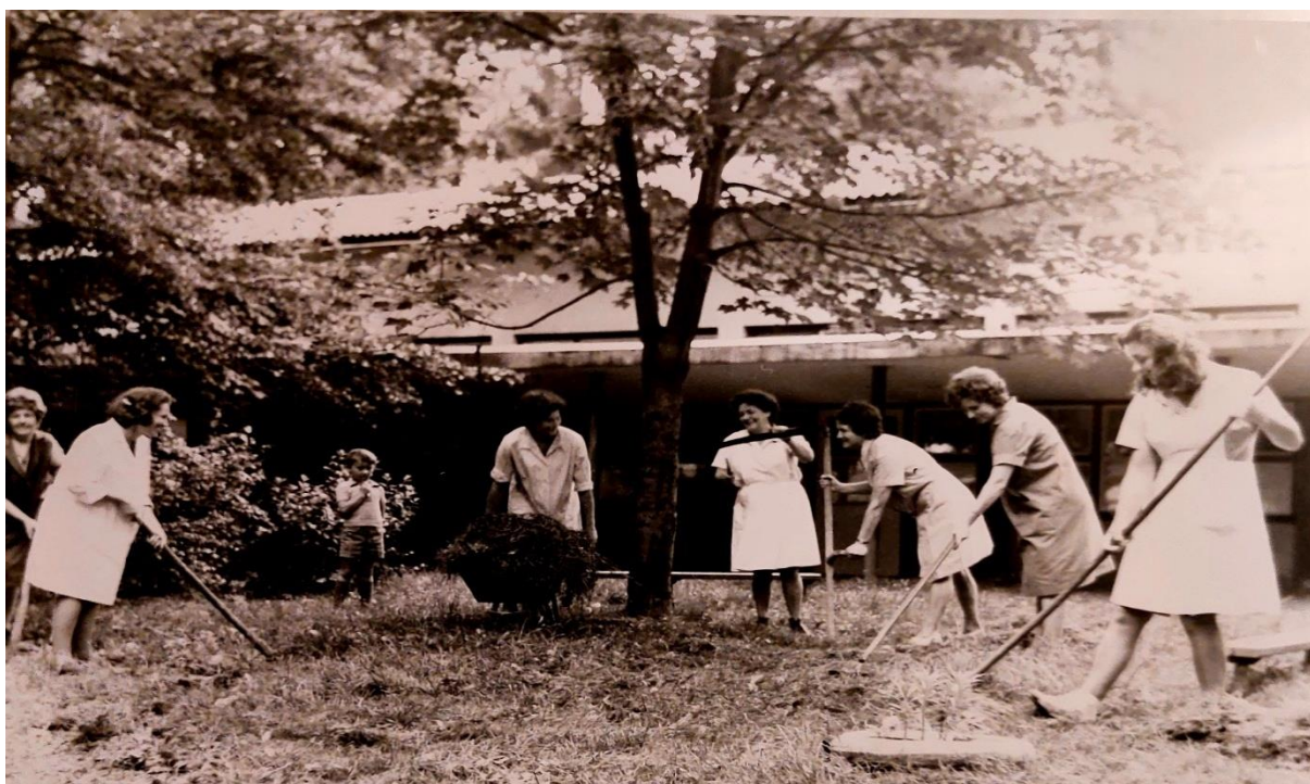
Slika 34. Radna akcija zaposlenica i majki djece koja pohađaju jaslice

Prema Jurčević-Lozančić (2005) roditeljska kompetencija se stječe kroz nove spoznaje, vještine, mijenjanje loših postupaka i radom na boljem roditeljskom djelovanju. Međuodnos roditelja i djece treba biti prožet osjećajima ljubavi, povjerenja i pripadnosti kao i međusobne odgovornosti.