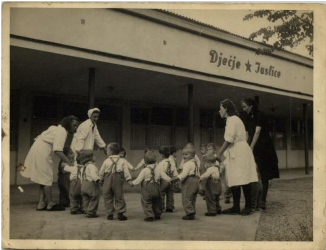
Slika 7. Žene bez rupca su odgojiteljice, žena sa bijelim rupcem je njegovateljica, žena u crnom je spremačica/sobovija

Dolaskom školovane odgojiteljica (na slici lijevo, 1950) uveden je muzički i ritmički odgoj u jaslicama. Njezina angažiranost i posvećenost glazbenom području doživljena je kao svojevrsna prijetnja, te je izazvala osjećaj nepovjerenja od strane upravitelja i roditelja. Najveća zamjerka je bila jer nije štopala vrijeme glazbenih aktivnosti već je pjevala i muzicirala u svakoj prigodi. Zapošljavanje njegovateljice je bilo iz potrebe da se higijenski uvjeti podignu na visoku razinu zbog zaštite od zaraznih bolesti. Roditelji su djecu za jaslice morali skinuti i predati na ulaznim vratima gdje je bio pult na kojem su se djeca oblačila isključivo u odjeću koja se prala na visokim temperaturama u vrtiću. Također su se djeca vrlo pomno pregledavala da bi se izbjegla mogućnost zaraznih bolesti. Kao i danas, odgojiteljice su radile s djecom u neposrednom radu pet sati, a ostalo se odnosilo na pripremu (izvor: Spomen knjiga DV Duga Resa).