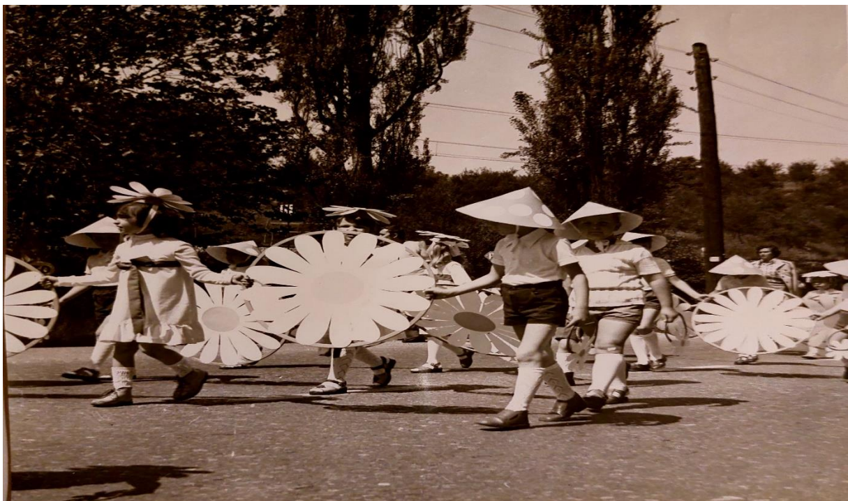
Slika 12. Cvjetni korzo povodom Dana mladosti

Učinjen je korak dalje u suradnji sa roditeljima te se od 1963. godine započelo sa održavanjem roditeljskih sastanaka i individualnih informacija prema potrebi korisnika i odgojiteljica. Počeo se kupovati časopis „Radost“ kojem su se radovale odgojiteljice. Časopis se zaduživao i pomno