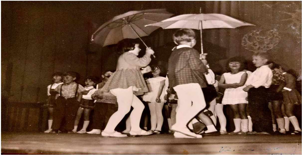
Slika 11. Priredba u Kinu, završena svečanost za roditelje