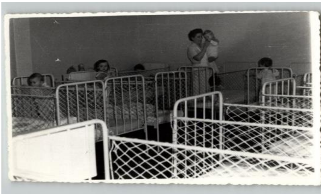
Slika 6. Željezni „kinderbeti“ u kojima su djeca cijelo vrijeme boravila dok su bila u unutarnjem prostoru jaslica

Jaslička djeca su svakodnevno boravila na otvorenim prostorima. U tom periodu je također sve bilo vrlo planirano i vođeno od strane njegovateljica i odgojiteljica. Vrijeme je moralo biti ispunjeno igrama kola i šetnjama isključivo vođenih od strane odgojiteljica. Djeca su se vodila za ruke ili cijela skupina vodeći se užetom za šetnju.