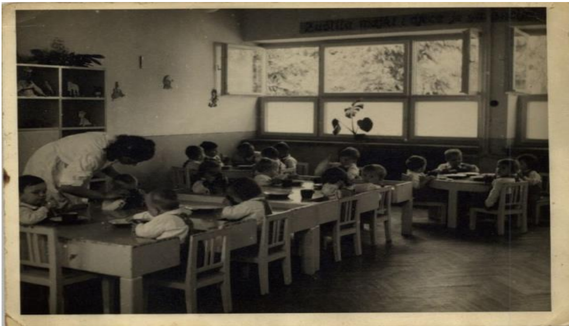
Slika 3. Topli obrok, mlijeko i kruh

Prema dokumentaciji jedan period su uz djecu bile spremačica i naizmjenice žene iz AFŽ-a (Antifašistički fronta žena) Hrvatske. Sama organizacija je djelovala na otklanjanju posljedica rata, poticanju odgoja i obrazovanja te posebno na školovanju ženske djece. Godine 1945. su upravo te žene po prvi puta organizirale pravi topli obrok, kruh i toplo mlijeko (izvor: Spomen knjiga DV Duga Resa, 1945).