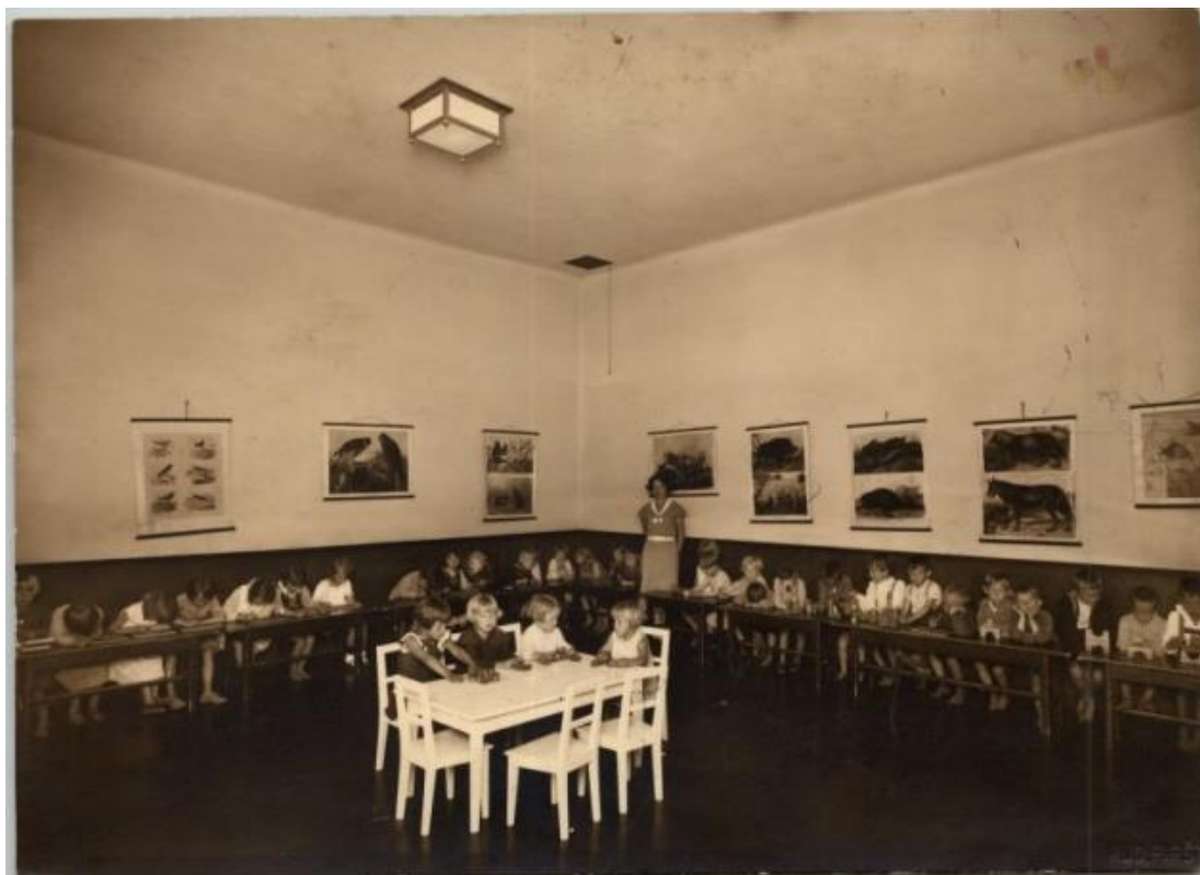
Slika 2. Prva učionica za mlađu djecu

djeca trebaju vidjeti i naučiti. Te fotografije-plakati imali su edukativne značajke. Djeca su učila recitacije, priče i kola koje je znala zabavija. Podučavala je „iz glave“. Priručnika nije bilo.