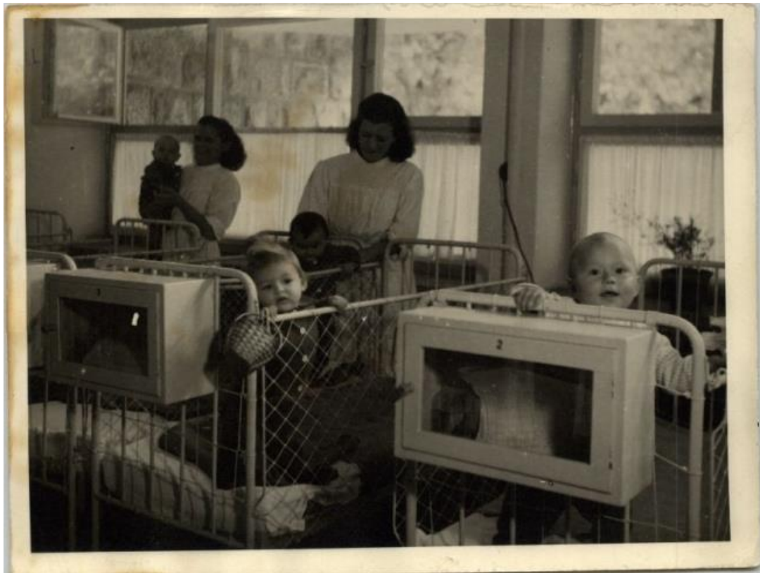
Slika 8. Željezni kovčezzi koji su zaključani zbog tajnosti podataka djeteta.

Uvođenjem mjesečnih i dnevnih planova za djecu jasličke dobi bolje se kontroliralo razvoj djeteta u fizičkom i psihičkom razvoju. Evidentirala su se psihička ponašanja i antropološka mjerenja. Svi podaci su se strogo čuvali pod ključem u malim metalnim kovčezima pa bi se reklo da je to bila preteča današnje Uredbe o zaštiti osobnih podataka. U jaslicama se po prvi puta zapošljava medicinska sestra. Dogovorio se i povremeni nadzor liječnika i njegovi pregledi djece koja borave u ustanovi.