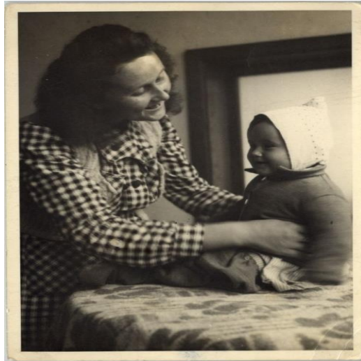
Slika 5. Odgojiteljica s djetetom jasličke dobi