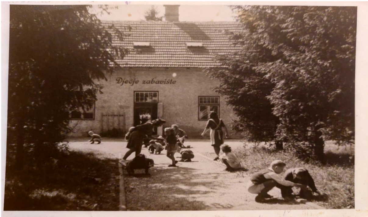
Slika 1. Zgrada konjušnice (2016) preuređena u prostor Dječjeg zabavišta (1926) za djecu radnika tvornice

Sama zgrada sagrađena je deset godina ranije i prva funkcija je bila za konjušnicu vlasnika Tvornice. S obzirom da su se djeca trebala negdje smjesti, dok su prije svega majke u Tvornici, donji dio se adaptirao u dvije prostorije za djecu, a gornji tavanski prostor uredio se za stan „zabavije“ Marije Polović. Ona je sa djecom bila od 1926. do 1928.godine. Nakon toga se vratila u obližnje selo da bude s majkom. Osigurano stanovanje uz rad je tada bilo neizbježno, ali i nužno jer nije bilo mogućnosti putovanja kao ni posjedovanja prijevoznog sredstva (Spomen knjiga DV Duga Resa, 1926-1928).