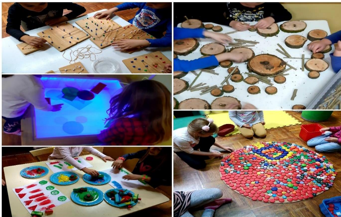
Slika 22. Rad u malim grupama, mnoštvo prirodnog i neoblikovanog materijala, rad kroz projekte nova je svakodnevnica današnjih dječjih vrtića

Posebno veliki trend interesa za upis u vrtić bio je 2004. godine. Upisano je 260 djece, dok je na listi čekanja ostalo čak 150 djece. Roditelji su izuzetno nezadovoljni. Vršiti se pritisak na Osnivača. Ponovno su u situaciji, kao 80-tih godina da se mora naći rješenje za upise svih zainteresirani. Odluka je pala da će se adaptirati nekadašnji studentski dom koji više nije potreban i u upotrebi. Na taj način će se izgraditi novi treći objekt Dječjeg vrtića Duga Resa.