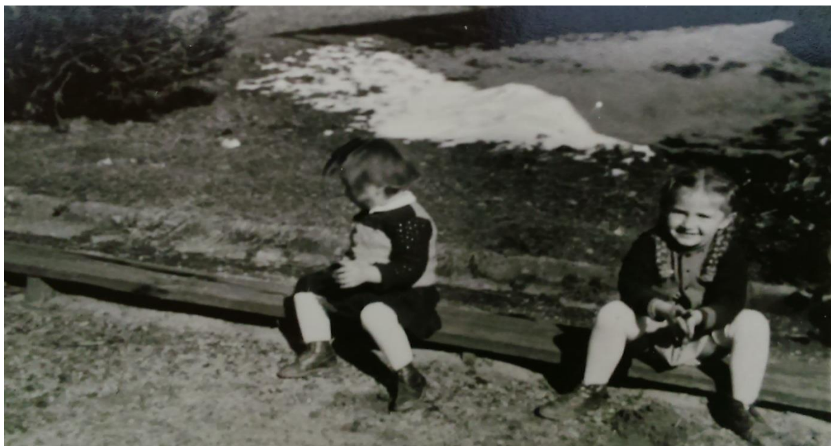
Slika 33. Dječje igra sjedeći na klupici, igra prstima, igra zemljom, veliko zadovoljstvo

igre, određuje i inzistira na redu i disciplini koja ograničava dječju igru. Negativne značajke postupanja odgojitelja prema djetetovoj igri su kritiziranje, obavljanje zadataka umjesto djeteta i iskazivanje površnog interesa za igru gdje često dolazi do zahtjeva prema djetetu da prekine započetu igru. Odgojitelji, roditelj i svi koji prate dijete u njegovom razvoju mogu čuti od djeteta njihov odgovor „ Ne mogu sad doći, moram se igrati! “ (Došen-Dobud, 2016: 17). Spomenuta autorica naglašava da je to znak sretnog djeteta.