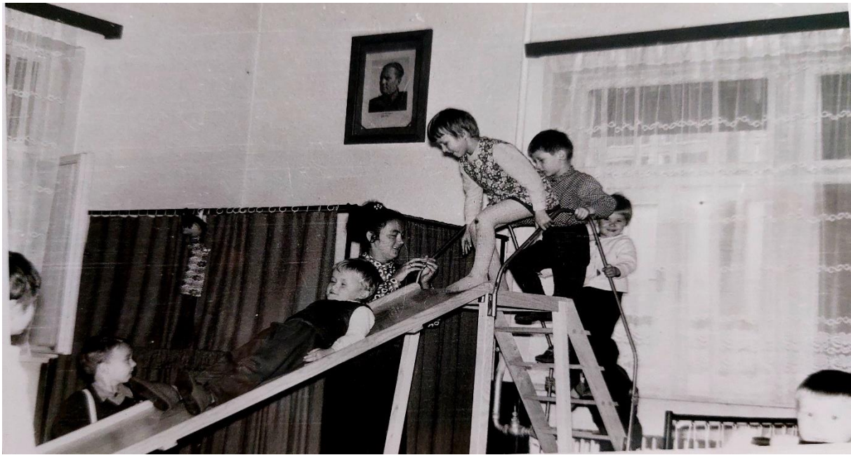
Slika 37. Tobogan u unutarnjem prostoru po prvi puta u dječjem vrtiću