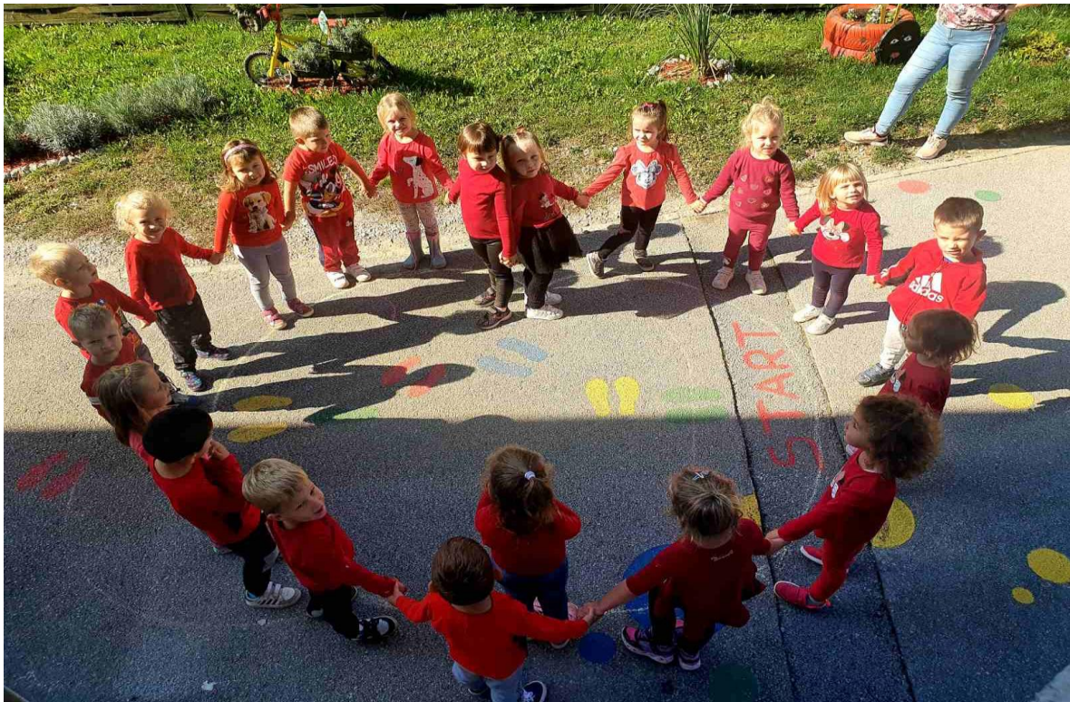
Slika 25. Dječji tjedan „Ljubav djeci prije svega“