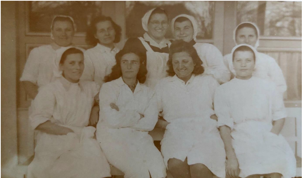
Slika 40. Djelatnice DV Duga Resa, njegovateljice, odgojiteljice, pralja, kuharica i upraviteljica, 1948. godine

osjećaju i rade, kako organiziraju, oblikuj te podržavaju procese učenja odgojitelja i djece (2014: 37). Prema Slunjski (2011) unapređenje i mijenjanje odgojno-obrazovne prakse nemoguće je bez odgojitelja koji istu svakodnevno osvještavaju. Osobne koncepcije (2014: 63) odgojitelja određuju sve aktivnosti, prosudbe, interpretacije i načini postupanja u radu s djecom. Poticajni prostor je jedan od pokazatelja važne uloge odgojitelja koji je spreman mijenjati svoje koncepcije i odgojno-obrazovnu praksu kao i načine razmišljanja. Kurikulum vrtića prepoznaje se i u odnosima, komunikaciji, poštovanju i suradnji svih zaposlenih u vrtiću, kao i partnerstvu s roditeljima koji su ravnopravno uključeni u kurikulum vrtića i njegovo stvaranje. Svi oni zajedno predstavljaju temeljne čimbenike vrednovanja unutarnjeg kurikuluma vrtića, dok se vanjsko vrednovanje ostvaruje kroz nadležne institucije i akademsku zajednicu.