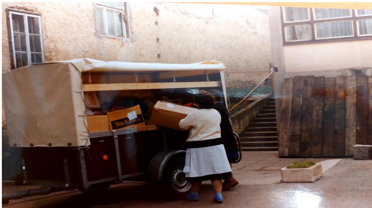
Slika 21. Donacije za vrtić dolazi većinom iz Njemačke i Italije

poslovanja traje i danas. Čine ga pet članova, tri predstavnika Osnivača, jedan predstavnik roditelja i jedan predstavnik odgojitelja. Financijska situacija je izuzetno loša, ali se sve obnavlja s puno entuzijazma. Dobiva se dosta donacija s kojima se vrše radovi adaptacije i uređenja.