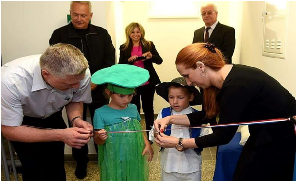
Slika 23. Otvaranje drugog kata objekta Resica (2016.) i smještaj sve djece sa područja grada Duga Resa

Kad se riješe glavni problemi, smještaj sve djece, dobri materijalni uvjeti, kvalitetno provođenje odgojno-obrazovnog rada slijedi vrijeme da se učini korak dalje za drugu djecu. Četvrti objekt otvara se na području male općine Generalski Stol 2017. godine. Tome se je pristupilo iz želje da sva djeca, pa tako i ona u ruralnom području imaju jednake mogućnosti za odgoj i obrazovanje od najranije dobi. Prvi otpor mještana, „jer oni vode djecu u grad i ne treba im kod njih“ (mještani općine Generalski Stol) pretvorio se u veliko zadovoljstvo i interes za istim. U vrtiću Generalski Stol isprva je bilo smješteno 15-ak djece, a danas imamo 32 djece smještene u dvije odgojno-obrazovne skupine.