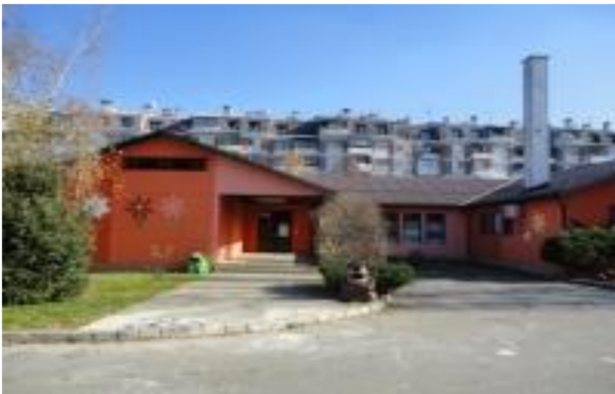
Slika 14. Novi montažni objekt „Maslačak“ na lokaciji Trg hrvatskih mučenika gdje je niknulo novo naselje sa zgradama i stanovima za mlade obitelji