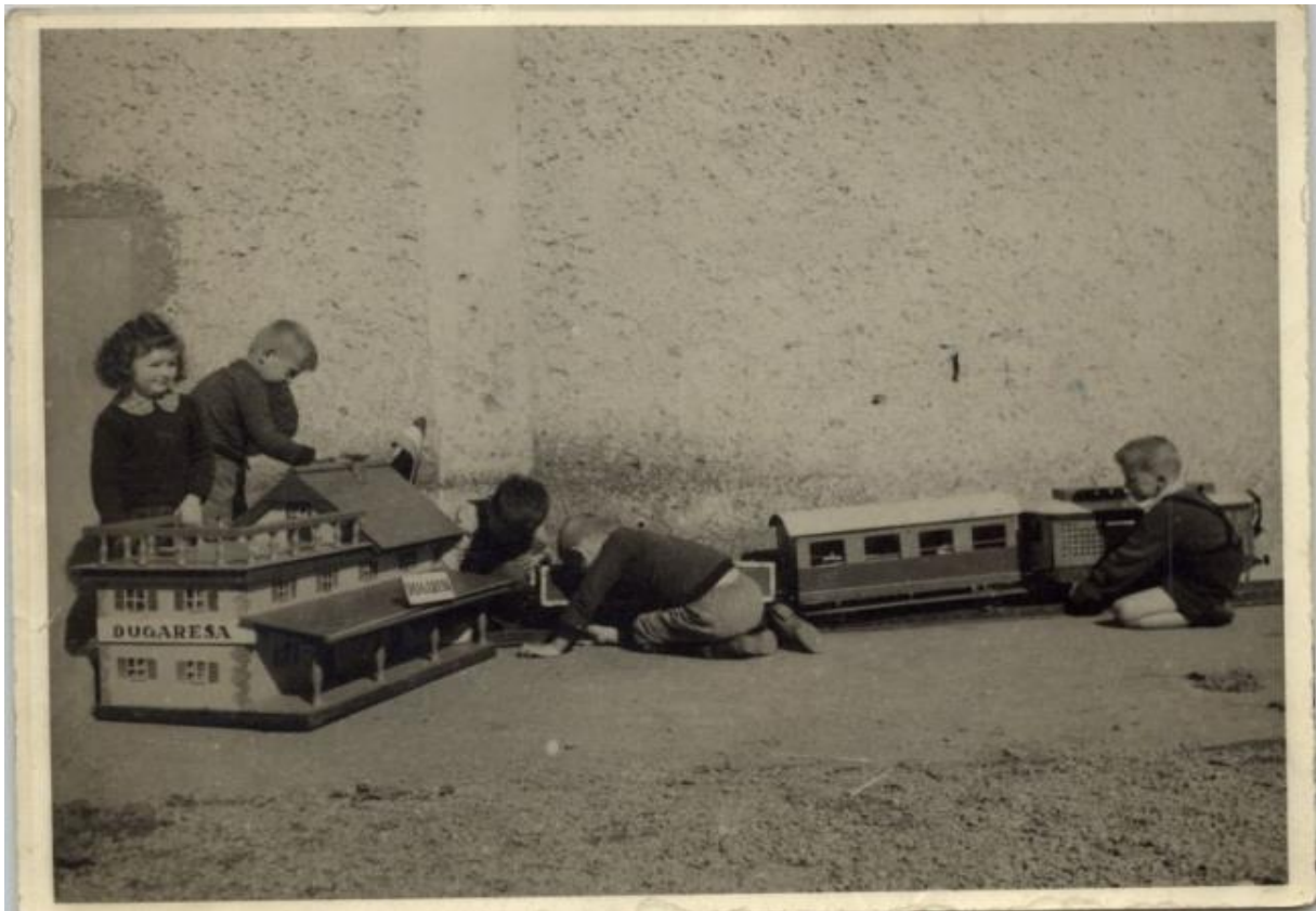
Slika 28. Slobodna igra sa velikim maketama koje su se stavljale u prostor vanjskog dvorišta i ponovno se spremale u spremište nakon završetka igre, trajanje igre bilo je propisano

Program odgojno-obrazovnog rada (1971) zastupao je vanjske nagrade, pohvale i kazne. Kao što je rečeno, najvažnija je bila priprema djeteta za školu te se težilo izravnom poučavanju djece. Komunikacija s roditeljima je također najčešće bila u toj godini jer se tada najviše savjetovalo roditelje što treba dijete znati da bi mogao biti spreman za školu. Tradicionalni odnos bio je temeljen na hijerarhijskoj poziciji moći odgojitelja prema roditelju. Osnove programa rada s djecom predškolskog uzrasta (1983) donio je novinu jer se njime po prvi puta obuhvatio rad sa djecom jasličke dobi, od 1. do 3. godine. Kao programski dokument bio je suvremeniji od prethodnog ali nije imao bitnog utjecaja na pedagošku praksu (Petrović-Sočo, 2013) jer su se i dalje zanemarivale individualne potrebe djece te se nastavilo sa hijerarhijskim odnosom odgojitelja prema roditelju.