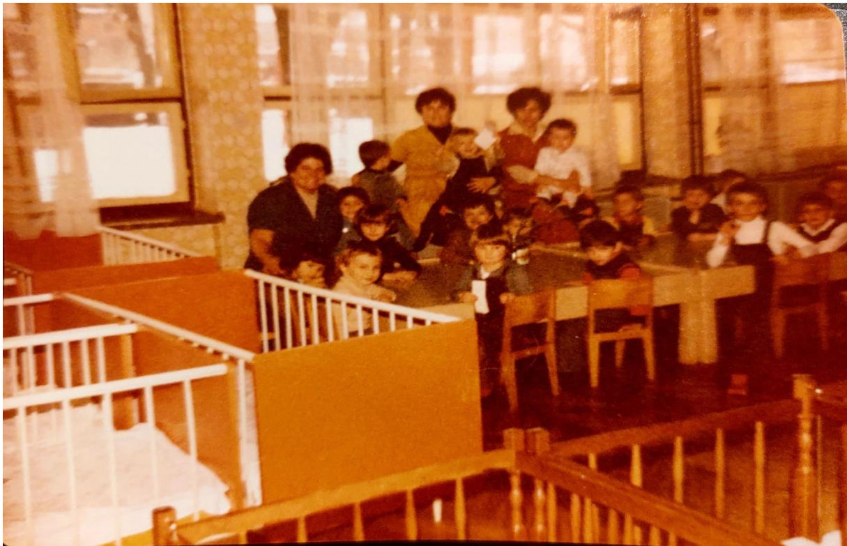
Slika 13. Novi drveni krevetići za djecu jasličke dobi

U tom periodu šest odgojno-obrazovnih skupina su više nego prekapacitirane. U njih je smješteno čak 170 djece. Tadašnji upravitelj, nastavnik razredne nastave, gosp. Čurilović Anton, 1978. godine predaje projektnu dokumentaciju za izgradnju novog objekta. Sljedeće godine počinju radovi koji se kreću vrlo sporo. Također, dolazi do epidemije žutice s kojom su se uspeli dosta dobro nositi. Nakon skoro tri godine izgradnje, 1981. godine otvara se novi moderni montažni objekt za još pet odgojno-obrazovnih skupina. Zapošljava se 17 novih djelatnika. Broj odgojno-obrazovnih skupina je 12, od koji su čak četiri skupine čiste predškolske. Svi su bili radosni zbog broja djece i da su svi kapaciteti popunjeni. Otvaranje novog objekta daje zamah u stručnom radu. Novi mladi odgojitelji pristupaju novom načinu planiranja, pripremanja i vođenja pedagoške dokumentacije. Po prvi puta se roditelje počinje gledati kao partnere, a ne samo pasivne promatrače. Organiziraju se zajedničke radne akcije. Zaposlenici i roditelji zajedno uređuju vanjski okoliš novog, ali i starog objekta.