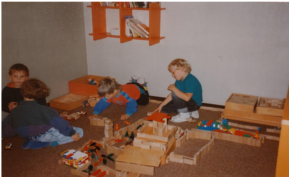
Slika 32. Igra u centru građenja nekoliko dječaka zahtjeva poštivanje nepisanih pravila i razumijevanje

U igri dijete istražuje domene mogućeg u odnosu na sebe, predmete, događaje u svojoj okolini i tako rekonstruira prijašnja iskustva, znanja, načine djelovanja i izgrađuje nova.