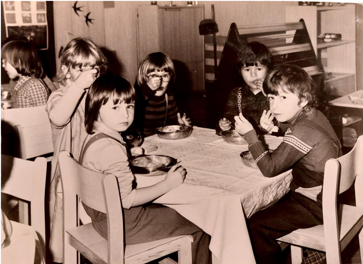
Slika 9. Školska djeca na ručku i boravku u obdaništu nakon nastave

Sukladno zahtjevima i potrebama stanovništva formirano je i školsko odjeljenje s naglaskom na tehnički odgoj djece. Školska grupa je bila za djecu od prvog do četvrtog razreda osnovne škole koja su dolazila u obdanište nakon završetka nastave. Tu su boravili do dolaska roditelja po završetku njihovog radnog vremena, ručali su i pisali domaću zadaću. Rekli bismo pojednostavljeno da je u Dugoj Resi od 1954. godine postajalo današnji dnevni boravak za školarce u vrtiću.