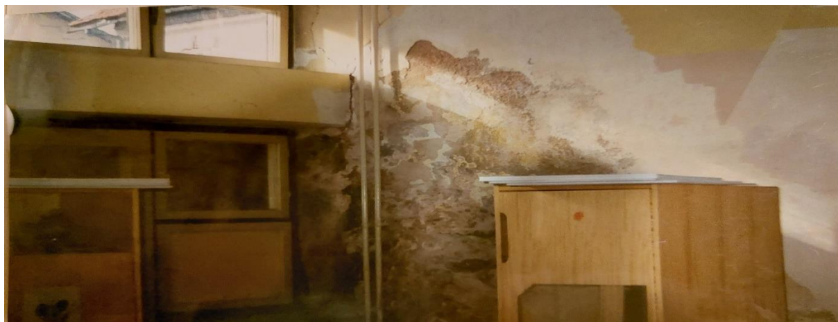
Slika 20. Loši smještajni uvjeti u vrtiću nakon ratnih zbivanja

Nakon Domovinskog rata nastale su velike promjene u kolektivu. Mnogi djelatnici su napustili grad, a s obzirom na manji broj djece postojeći djelatnici su preraspoređeni na neke druge poslove unutar ustanove. Vrtićem počinje upravljati Upravno vijeće, te taj način