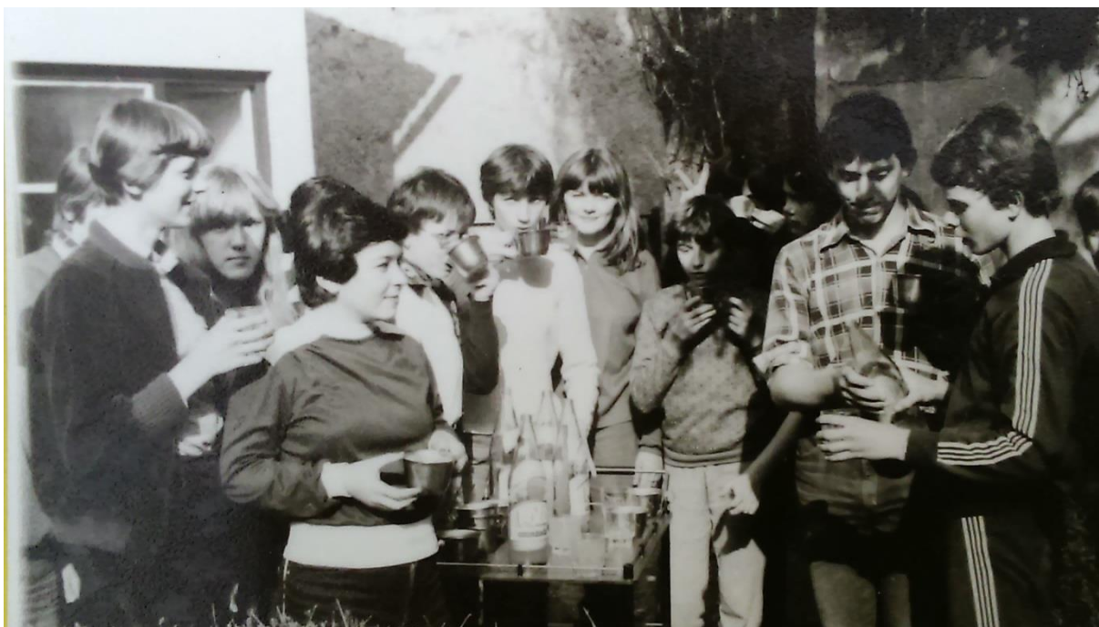
Slika 17. Predah mladih roditelja i zaposlenika nakon rada uz sok „žuti i crni Polo“