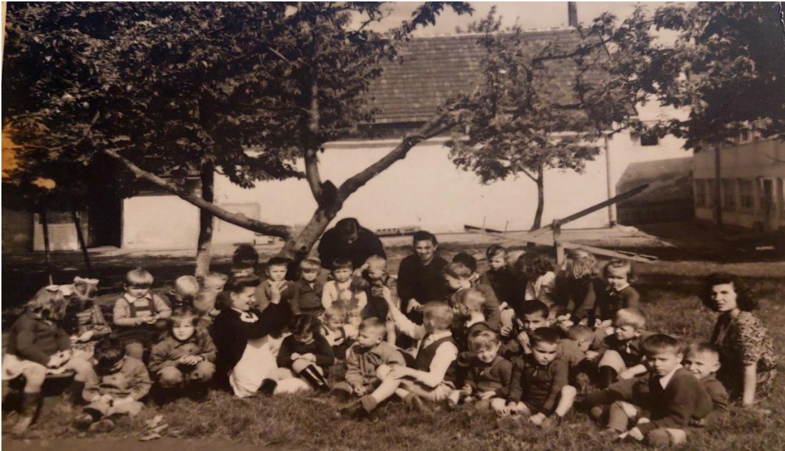
Slika 4. Djeca Zabavišta na svom igralištu (1949) sa prvim postavljenim klackalicama

da se u Ustanovu smještaju mlađa djeca jasličke dobi. U to vrijeme se smatralo da djecu do treće godine nije moguće obrazovati (izvor: spomen knjiga DV Duga Resa).