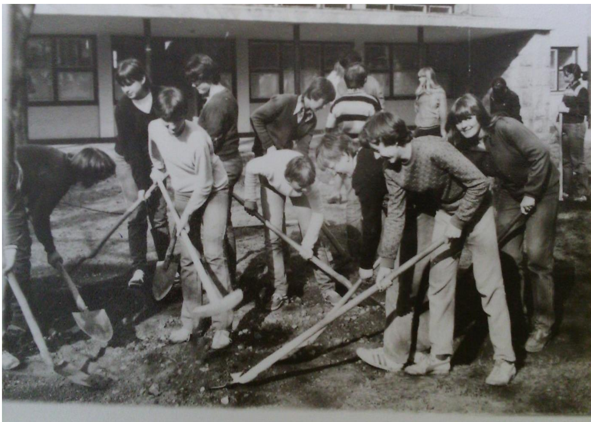
Slika 16. Radne akcije roditelja na „starom“ objektu Kasar