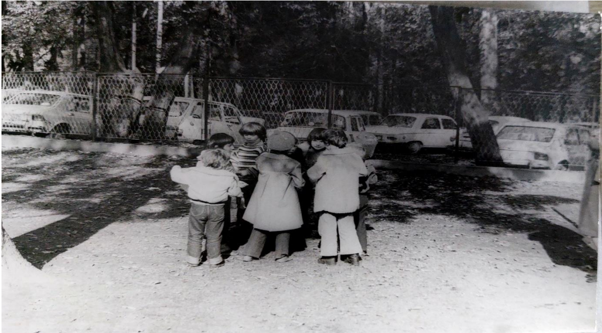
Slika 36. Radni dogovor djece na igralištu

Suvremeno shvaćanje djeteta naglašava djetetovu jedinstvenost i neponovljivost. Svako dijete je posebno i konstruira svoje djetinjstvo. Načela današnjeg rada s djecom su fleksibilnost odgojno obrazovnog procesa, partnerstvo vrtića s roditeljima i širom zajednicom, osiguranje kontinuiteta te neizostavna otvorenost za kontinuirano učenje i usavršavanje sudionika odnosno praktičara odgojno obrazovnog procesa.