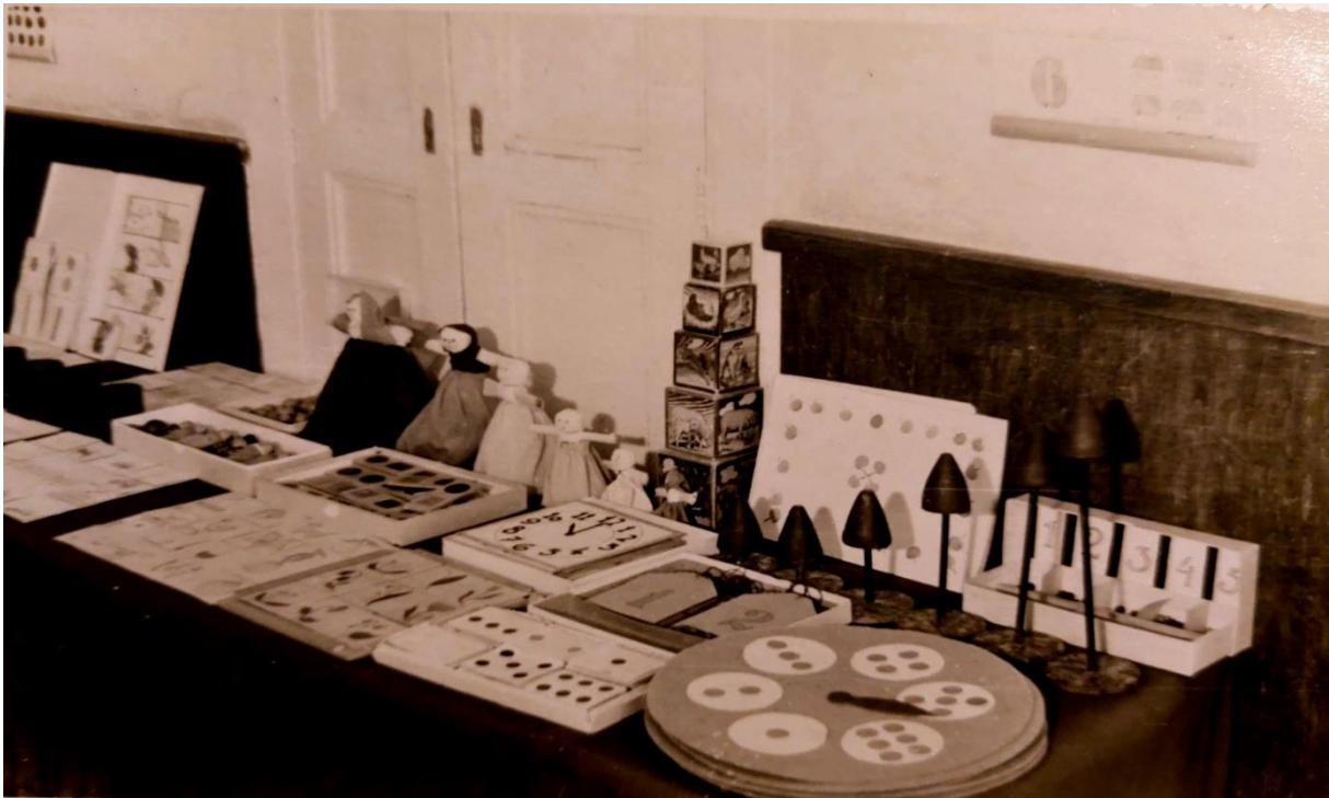
Slika 10. Izložba izrađenog didaktičkog materijala nakon pohađanja seminara u Zagrebu, 1953. godine

edukacijama iz slobodnih aktivnosti i kako ih omogućiti djeci. Po povratku iz Zagreba odgojiteljice su morale održavati ogledne aktivnosti i izložbe didaktičkog materijala te na taj način prenijeti iskustva doživljenog svim drugim djelatnicama (prema bivšim zaposlenicima ustanove).