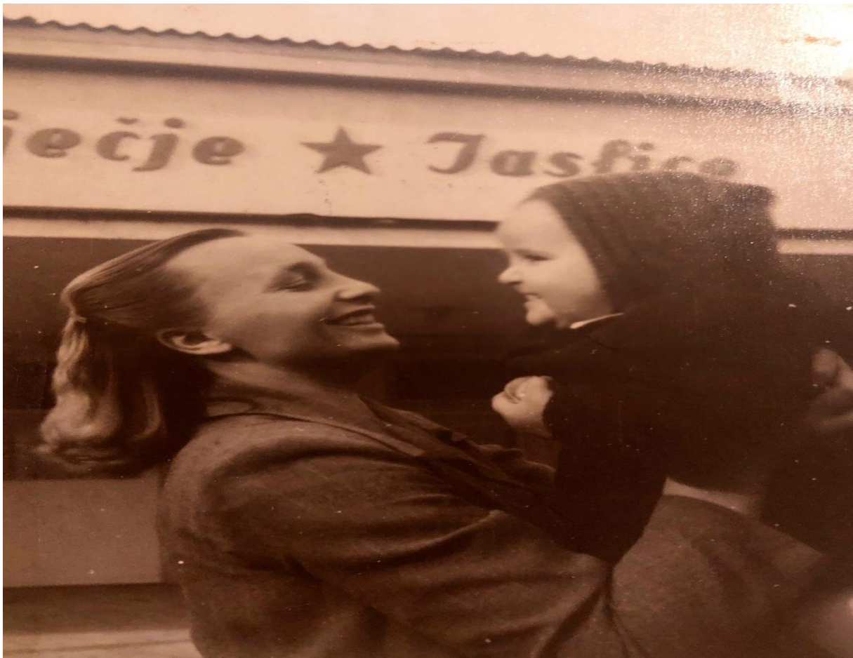
Slika 35. Majka nakon preuzimanja djeteta iz jaslica

Danas aktualne spoznaje govore o djetinjstvu koje je užurbano, prati ga komercijalizacija te su djeca izložena manipulaciji masovne dominacije medija. S obzirom na vidljive društvene promjene, te intenzivni tržišni utjecaj na djecu, djetinjstvo postaje izuzetno kratko, gotovo da nestaje i postaje svijet odraslih. Današnja djeca gotovo nikada nisu bez prisutnosti odrasle osobe, sve aktivnosti su im unaprijed isplanirane i slobodno vrijeme sa vršnjacima bez kontrole gotovo više i ne postoji. Za skraćivanje djetinjstva su svakako kriva i mnogobrojna stresna iskustva današnje djece (Bašić, 2012). Nasuprot spontanoj igri postavlja se niz aktivnosti s ciljem učenja, koje su podržane tehnološkim napretkom. Zanimljivo tumačenje o tradicionalnom i suvremenom shvaćanju djetinjstva i djece daje Babić (2014) uvodeći nas u svijet znanstvenih promišljanja o djetetu i djetinjstvu. Na taj način dobivamo uvid u autoričino poznavanje građe i opusa koji se bavi ovom tematikom te uvida u različite pristupe u proučavanju djece i djetinjstva kroz povijest. U promijenjenom djetinjstvu dijete se promatra kao aktivno, kompetentno biće koje ima svoja prava i odgovornosti.