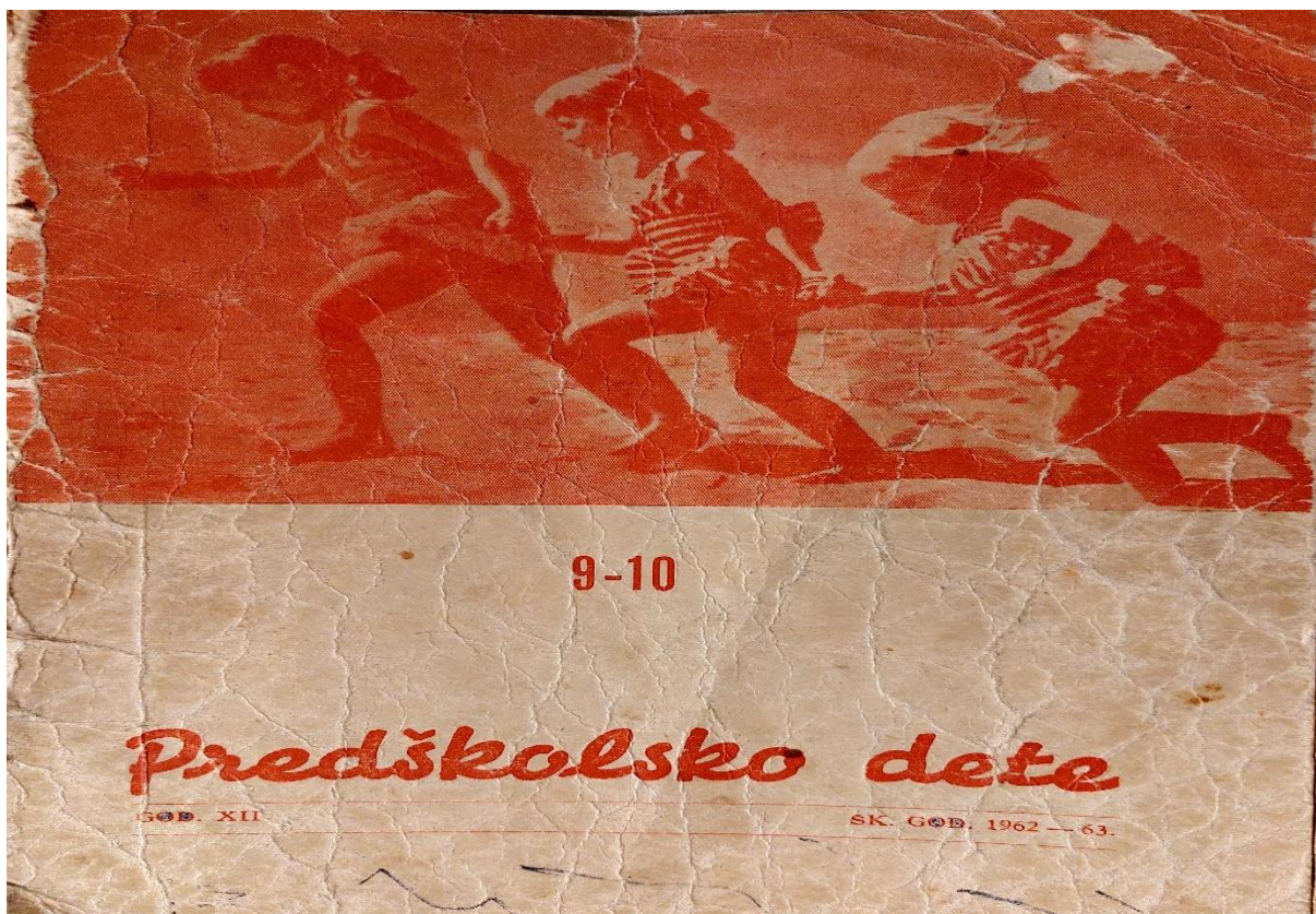
Slika 26. Časopis po kojem se provodio odgojno-obrazovni rad 60-tih godina u DV Duga Resa

Program odgojno-obrazovnog rada u dječjim vrtićima (1971) i Osnove programa rada s djecom predškolskog uzrasta (1983) imali su za cilj pripremiti dijete za školu za koju se smatralo da je početak u obrazovanju djeteta. Navedeni programi, kroz tradicionalni pristup i izravno podučavanje, svu odgovornost su temeljili na onome tko podučava. Program je bio unaprijed propisan. Odgojitelj je bio aktivan, dok je dijete bilo isključivo pasivan sudionik podučavanja.