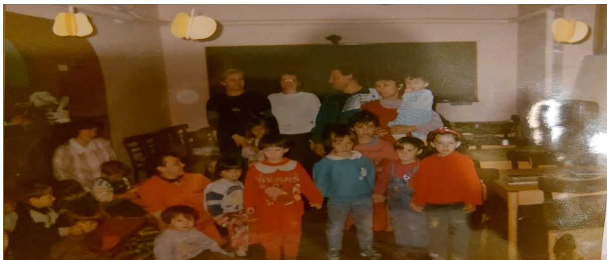
Slika 19. Djeca, odgojiteljice i domara u skloništu Gradske knjižnice Duga Resa

Dječje jaslice i vrtić Duga Resa cijelo vrijeme uzbuna i stradanja (Spomen knjiga DV Duga Resa, 1991.) radio je u skloništu Gradske knjižnice. Jedan dio djece je bio sa svojim odgojiteljicama u izbjeglištvu u Ankaranu (Slovenija). Ustanova je pala na 120 djece. Plaće su bile minimalne, ali se ponovno vratila dobra atmosfera, svi su se držali zajedno i željeli su da djeca što manje osjete u kakvom teškom periodu odrastaju. U tom periodu su nastala jako lijepa likovna i literarna djela odgojiteljica i djece. Ipak, svi su čekali bolja vremena i prestanka rata.