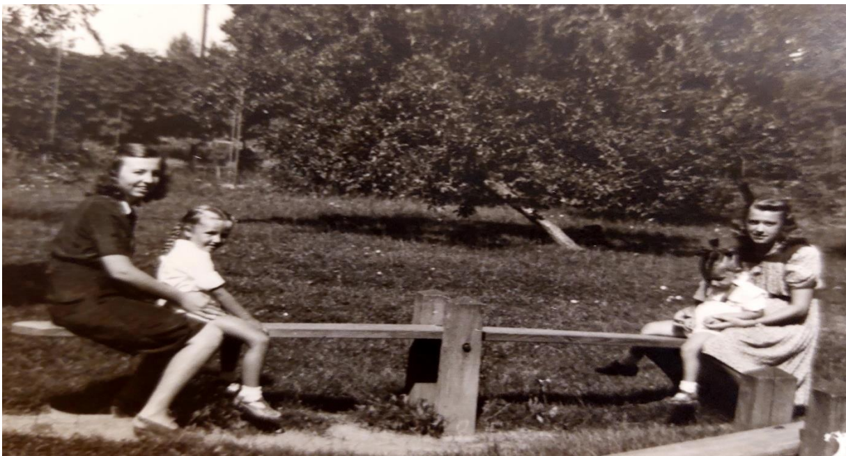
Slika 31. Mlade djevojke se igraju sa mlađim sestrama na igralištu dječjeg vrtića nakon škole jer im je želja postati odgojiteljicama

Važno je naglasiti zonu proksimalnog razvoja odnosno idućeg razvoja koju je utemeljio psiholog Vygotsky . Zona sljedećeg razvoja djeteta nastaje u prostoru razlike između aktualnog razvojnog stupnja djeteta i njegove potencijalne razine koja će se ogledati u višoj razini njegove autonomije. U zoni proksimalnog razvoja nalazi se raspon zadataka između onih koje dijete samo može savladati i onih koji su u slijedećoj fazi razvoja. Upravo zbog navedenih spoznaja kako dijete najprirodnije i najbolje uči u okruženju s drugom djecom i odraslima, u vrtićima bi se trebao poticati zajednički život djece različite dobi, tj. dobno heterogene skupine.