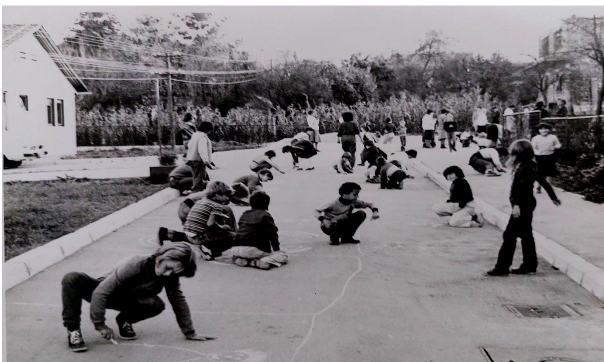
Slika 39. Slobodno crtanje kredom na asfaltu rezervirano za „velike“ predškolce 1982. godine

Promišljajući o današnjem provođenju odgojno-obrazovne prakse važno je naglasiti da svaki dječji vrtić i odgojno-obrazovna ustanova ima svoj kurikulum i samim time svoju jedinstvenu kulturu ustanove. Kultura odgojno-obrazovne ustanove utječe na način kako ljudi razmišljaju,