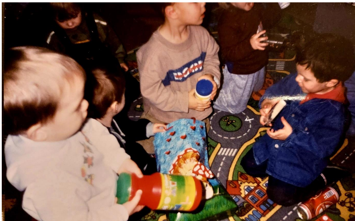
Slika 29. Pedagoški neoblikovani materijal postaje svakodnevnica u dječjem vrtiću

načela pluralizma i slobode u primjeni pedagoških ideja i koncepcija, različitosti u vrstama i oblicima provođenja programa te demokratizaciji društva prema subjektima koji se pravno i zakonom definiraju kao nositelji programa. To znači da je dječji vrtić mjesto u kojem dijete svakodnevno boravi i uči, oblikuje svoju igru, istražuje i eksperimentira. Posebna važnost daje se prostoru u kojem dijete boravi jer postaje izuzetno bitno da je prostor poticajan kako bi dijete moglo zadovoljiti svoju prirodnu znatiželju, potrebu za igrom, učenjem i druženjem s drugima (Sočo, 2013). Odgojitelj kao stručnjak za rani i predškolski odgoj razumije, podržava i potiče dijete svakodnevno te ga prati u njegovom rastu i razvoju. Uz takvu toplinu i podršku odgojitelja dijete razvija svoje kompetencije, uči, razvija se i napreduje. Ovaj dokument otvara put razvoju nove kvalitete odgojno obrazovnog rada što je istaknuto u naslovu ovoga rada.