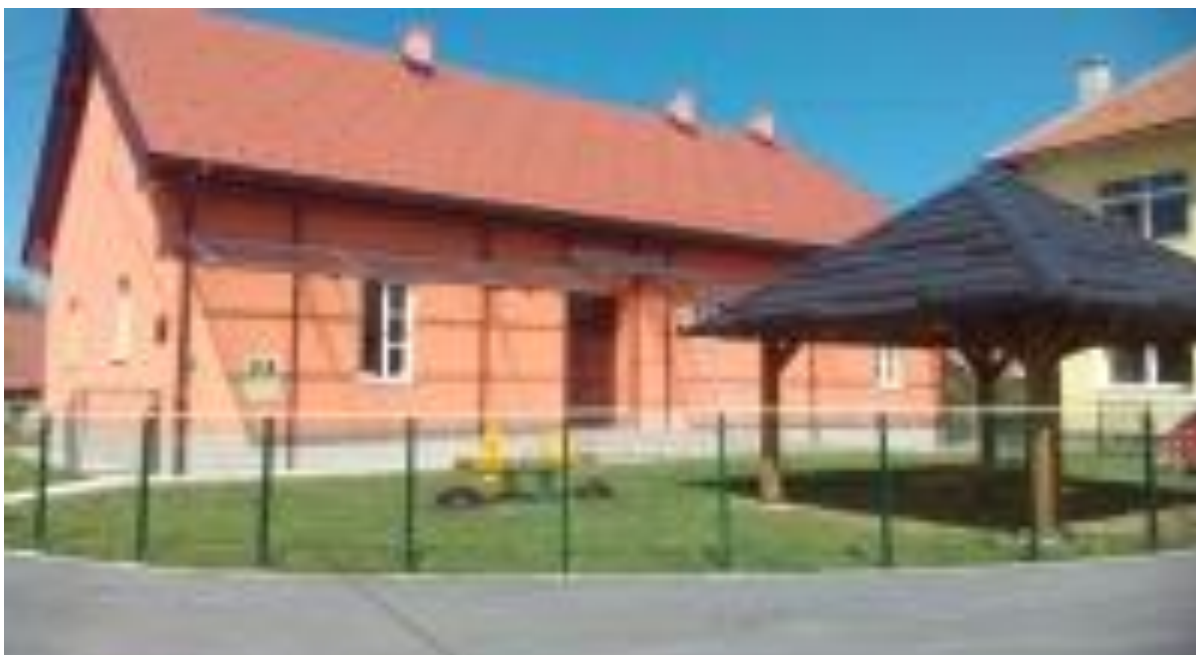
Slika 24. Četvrti objekt DV Duga Resa, vrtić u Generalskom Stol (Izvor: Arhivsko gradivo DV Duga Resa, 2017)

Osnivač, grad Duga Resa od 2018. godine uvodi besplatan vrtić za treće i svako sljedeće dijete u obitelji bez obzira da li druga djeca pohađaju vrtić u isto vrijeme. Takva demografska mjera se u tom pogledu pokazala učinkovitom i zadovoljstvo obitelji s više djece je veliko, ali smještaji kapaciteti nakon njenog uvođenja opet nisu dostatni. Zbog velikog interesa ponovno se vraća lista čekanja , naročito za djecu jasličke dobi. Broj djece koja nisu u sustavu je manji, ali ipak postoji. Dječji vrtić u svojoj dugoj povijesti rada susreće se s još jednom pandemijom. Korona virus je izazvao privremeno zatvaranje vrtića, odnosno organizaciju rada u obliku dežurstva u ožujku 2020. godine. Vrtić je bio prazan i tih. Naučili smo živjeti s virusom u ove dvije teške godine. Rad vrtića je bio organiziran u suradnji s roditeljima, „Vrtić kod kuće“ (web stranica DV Duga Resa, 2020), dok je on-line i elektronska komunikacija dobila izuzetno veliku važnost i ulogu u našim životima. Pandemija je odredila drugi način provođenja odgojno-obrazovnog rada, zabranila miješanje djece i skupina, smanjila komunikaciju uživo.