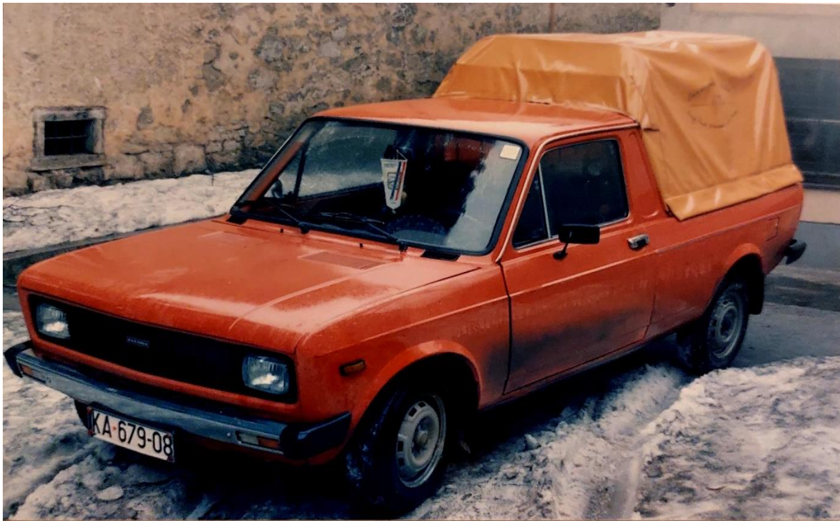
Slika 18. Novo dostavno vozilo „Zastava 101“

Najvažnije od svega, odgojiteljice se trude da usvajaju sve preporuke struke. Osjeća se timski rad i zajedništvo. U društvu je stvorena klima kako je posao odgojitelja, tada isključivo termin „teta“ vrlo lijep i posebno dobar posao za ženu. Roditelji također iskazuju poštovanje i zahvalnost.