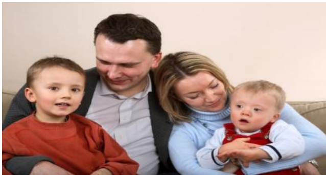
Slika 10. Down sindrom u obitelji

Djetetu s Down sindromom potrebna je ljubav kao i svoj drugoj djeci, potrebna im je obitelj koja im pruža poštivanje i ljubav kao što i oni njoj pružaju. Priručnik „ DOWNOV SINDROM u obitelji “ sadrži niz vrijednih ideja koje su na jednostavan način predstavljene i jasno opisane za primjenu.