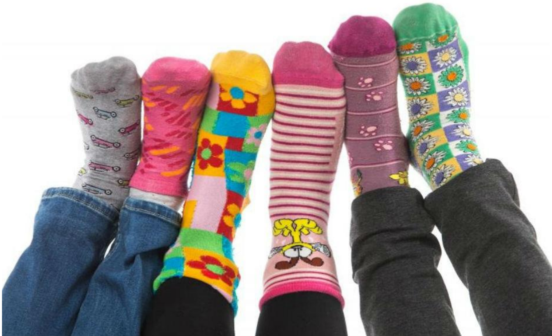
Slika 12. Simbol dana Down sindroma

Simbol dana Down sindroma su šarene čarape jer ih osobe s Down sindromom ne mogu upariti. Nošenjem šarenih čarapa pokazuje se podrška borbi osoba s Down sindromom kako bi se što bolje integrirali u naše društvo.