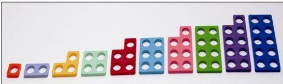
Slika 7. Numicon pomagalo

može obogatiti edukativnim materijalima i pomagalima. Sve više djece s Down sindromom u RH koriste Numicon pomagalo. Numicon pomagalo pomaže da nauče i vizualno povežu količine i tako shvate matematičke operacije.