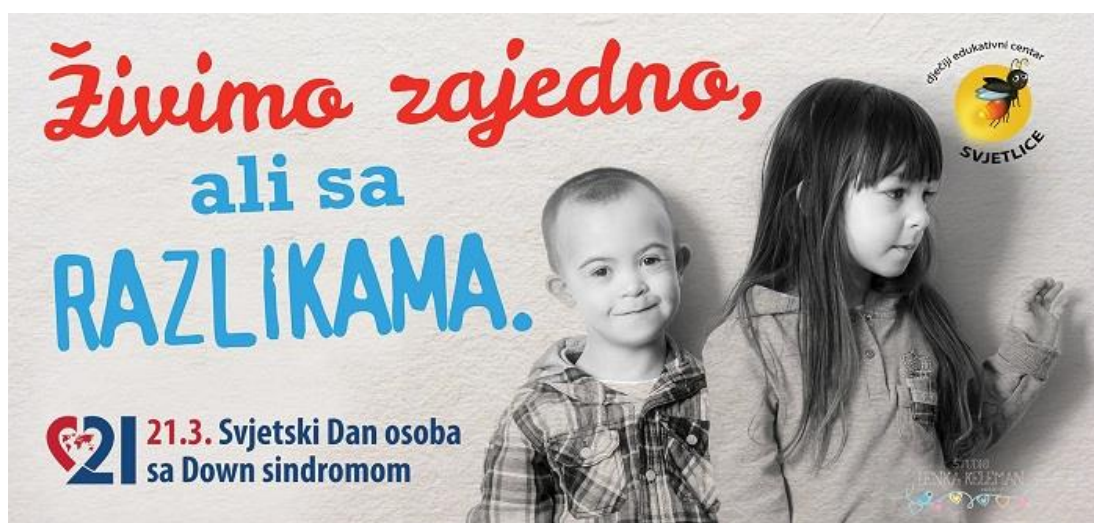
Slika 11. Svjetski dan osoba s Down sindromom

Ujedinjeni narodi (UN) su prihvatile predloženu rezoluciju i 10. studenog 2011. godine donijele odluku da se 21. ožujka obilježava kao Međunarodni dan Down sindroma . Usvajanjem odluke UN je iskazao svoju podršku zaštiti prava osoba s Down sindromom u cijelom svijetu, posebice zemljama u razvoju.