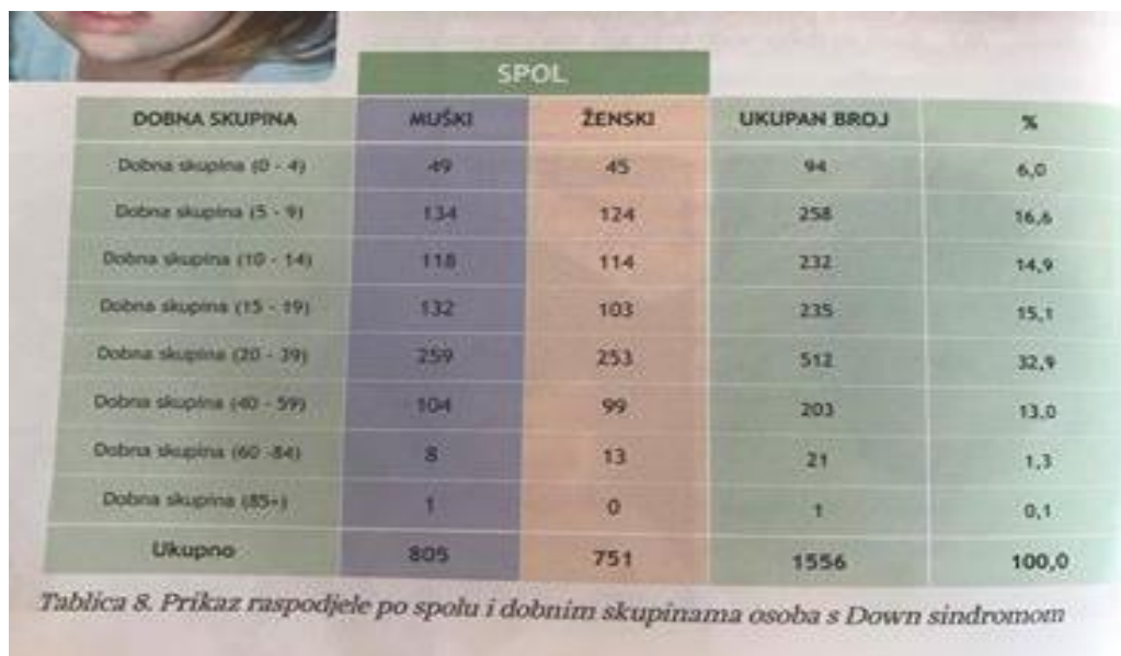
Slika 5. Prikaz raspodjele po spolu i dobnim skupinama osoba s Down sindromom

Najčešće dijagnoze osoba s Down sindromom su umjerene intelektualne teškoće, poremećaji razvoja govora, prirodne srčane greške te oštećenje sluha. Što se tiče školovanja, tada je zabilježeno 450 djece s Down sindromom, od čega je 246 dječaka i 204 djevojčice.