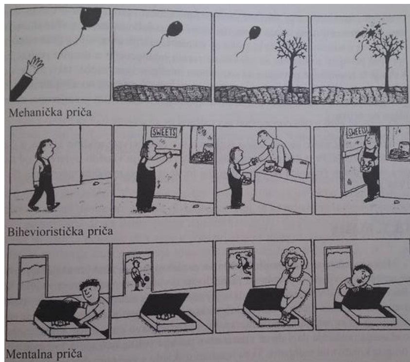
Slika 2. Tri tipa priče (Bujas Petković i sur. 2010. str. 171)

Kako je već navedeno, postojala su tri tipa priče. Prva je mehanička (dijete ispusti balon, balon leti, približava se drvetu te se probuši na grani), druga bihevioristička (djevojčica hoda po ulici, dolazi do slastičarnice te ulazi, kupuje slatkiše i izlazi van) te mentalna priča (dječak sprema slatkiš u kutiju, izlazi u dvorište i igra se, majka pronalazi slatkiš i pojede ga, dječak gleda u kutiju i čudi se gdje je slatkiš).