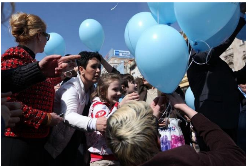
Slika 9. Obilježavanje Svjetskog dana svjesnosti o autizmu

Savez udruga za autizam Hrvatske 18 , 2017. godine obilježio je jubilarni 10. Svjetski dan svjesnosti o autizmu, pod motom „ Rušimo zajedno barijere autizma – izgradimo pristupačno društvo! ”