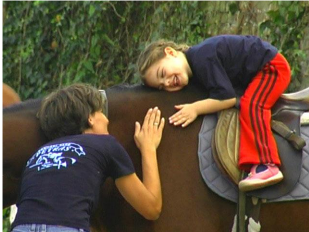
Slika 6. Terapijsko jahanje