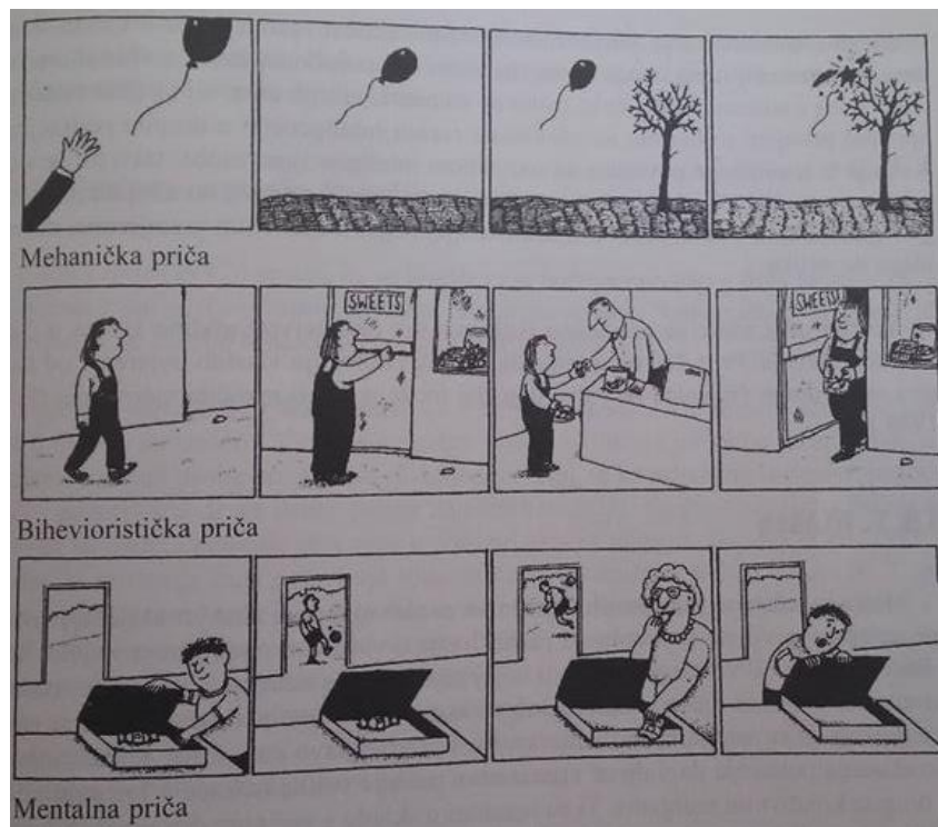
Slika 2. Tri tipa priče (Bujas Petković i sur. 2010. str. 171)

Kako je već navedeno, postojala su tri tipa priče. Prva je mehanička (dijete ispusti balon, balon leti, približava se drvetu te se probuši na grani), druga bihevioristička (djevojčica hoda po ulici, dolazi do slastičarnice te ulazi, kupuje slatkiše i izlazi van) te mentalna priča (dječak sprema slatkiš u kutiju, izlazi u dvorište i igra se, majka pronalazi slatkiš i pojede ga, dječak gleda u kutiju i čudi se gdje je slatkiš).