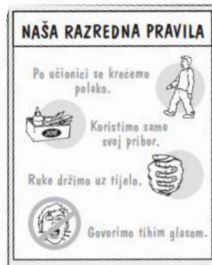
Slika 7. Primjer vizualnih razrednih pravila

također stvaranje vizualnih individualiziranih miniraspona, označavanje stvari i ambalaže te oglašavanje razrednih pravila crtežima ili simbolima.