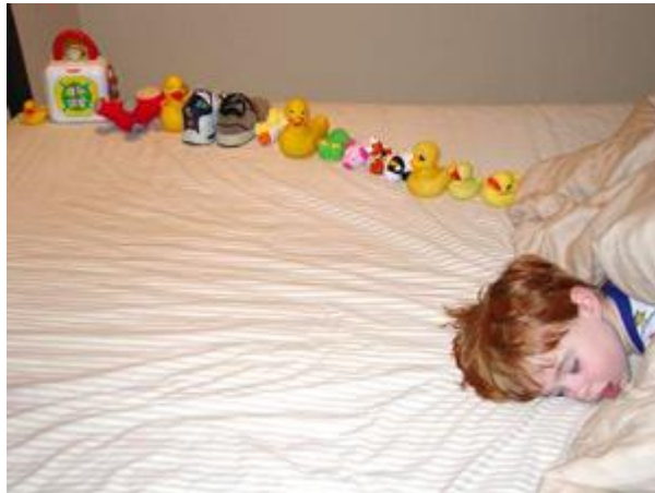
Slika 3. Dječak s autizmom, precizno slaganje igračkaka

Izražena je potreba da se vanjska okolina nikada ne mijenja te u slučaju najmanje promjene okoline djeca postanu anksiozna što predstavlja veliki problem za funkcioniranje obitelji (Nikolić, 2000). Preporuča se dijete zaokupiti drugom aktivnošću koja je poticajna i njemu zabavna. U svakom slučaju ga se ne smije ostaviti u njegovim “ritualima“, barem ne predugo, jer tada zapada sve dublje u svoj svijet.