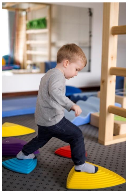
Slika 4. Primjer terapije senzorne integracije