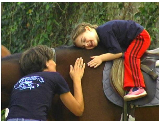
Slika 6. Terapijsko jahanje