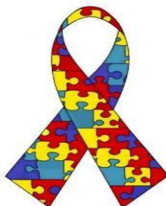
Slika 8. Znak svjesnosti o autizmu

Prema odluci Glavne skupštine UN-a, svjetski dan svjesnosti o autizmu, posvećen osobama s poremećajima iz spektra autizma, obilježava se 2. travnja. Cilj je skrenuti pozornost javnosti diljem svijeta na sve veći problem ovoga složenog poremećaja. Tim se povodom u brojnim gradovima puštaju plavi baloni u zrak.