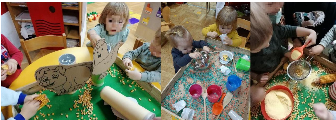
Slika 7. Igra istraživanja rastresitog materijala

Svoja prva iskustva istraživanja i opažanja svijeta dijete dobiva putem osjetilnih podražaja stoga je igra i učenje putem istraživanja rastresitih materijala od velike važnosti. Osim taktalnog iskustva, dijete korištenjem raznih alata pokušajima punjenja i pražnjenja posuda rješava probleme poput, na koji način i kojim alatom napuniti posudu, koliko je količine potrebno da bi se pojedina posuda napunila kao i radost promatranja materijala koji klizi niz kosinu. U skupini Cipelići rastresiti materijali ponuđeni su u sklopu teme farma te je velikim dječjim interesom postao svakodnevni materijal u skupini, a praćenjem dječjeg interes postepeno se centar i nadograđivalo (Slika 7).