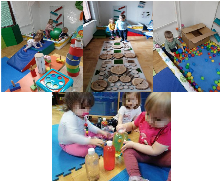
Slika 8. Senzomotoričke aktivnosti

U nastavku senzomotornog centra redovito se izmjenjuj različiti materijali i podloge (Slika 8) koje osim djelovanja na osnovne receptore djeluju i na razvoj ravnoteže. Na tu je sposobnost moguće djelovati od najranije dobi stoga je važno da i u unutarnjim prostorima odgojitelji vode računa o tome.