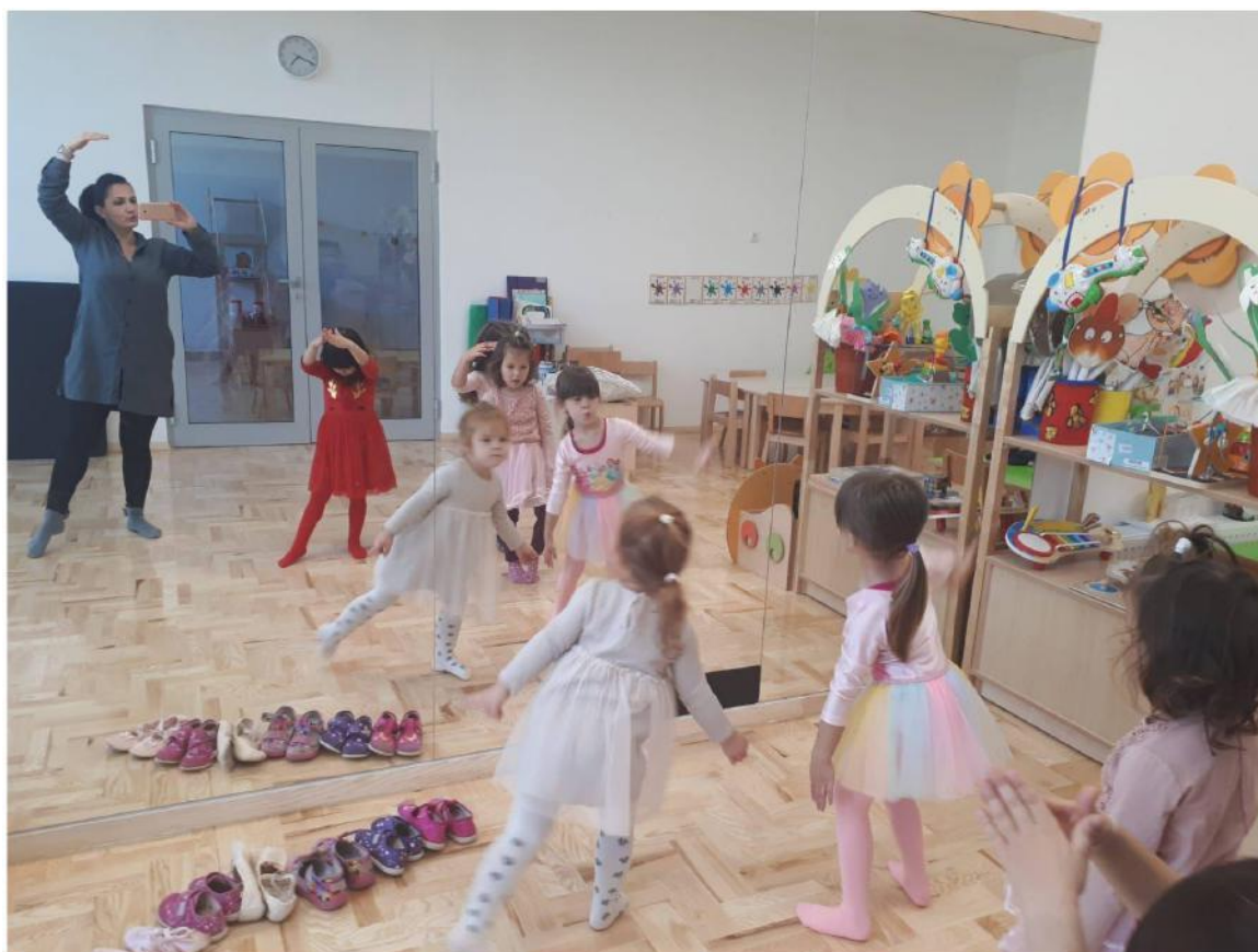
Slika 1. Voditeljica ritmike i plesa za vrijeme trajanja sata