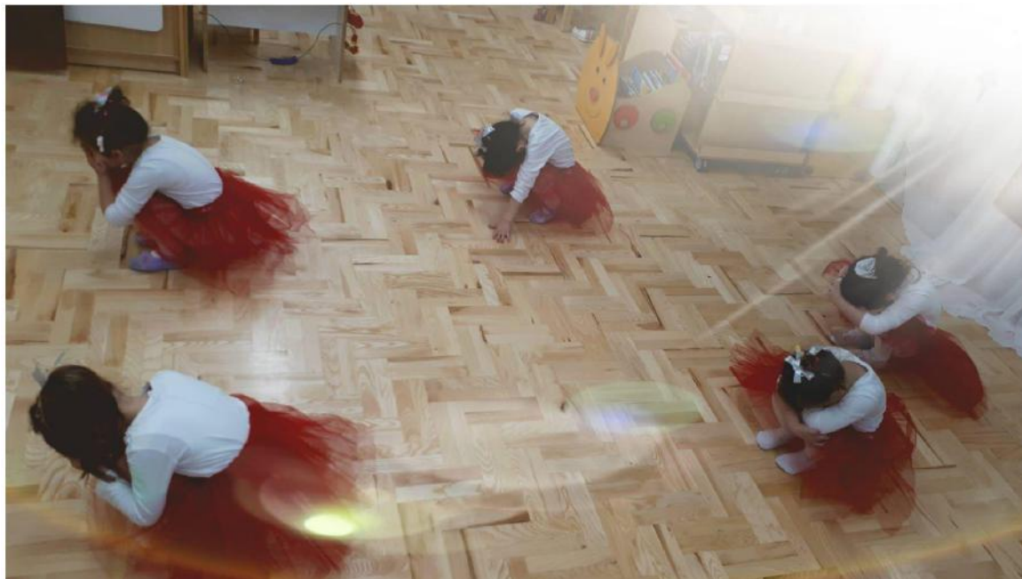
Slika 7. Šumske vile se bude iz sna

Tišina je oko nas. Nakon ugone i mira počinjemo se micati. Najprije dižemo jednu ruku, zatim drugu ruku. Polako dižemo tijelo u klek na koljena s ispruženim rukama u visinu. Glavu dignemo gore, a pogled je usmjeren ispred sebe. Zatim dignemo tijelo i zadržimo ga tako nekoliko sekundi. Zatvorimo oči. Naše misli putuju k suncu koje je na zalasku i miluje nam lice. Zamislimo vjetar koji miluje naše tijelo i njiše ga. Zamišljamo ptičice i slušamo njihov pjev.