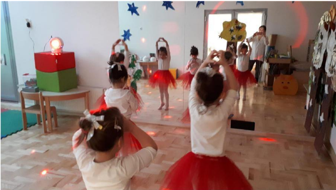
Slika 3. Pripremne vježbe istezanja uz glazbu

Tijelo u zaklon. Istezanje ligamenata – ispružimo cijelo tijelo, načinimo pretklon tako da stavimo dlanove ruku na pod. Ponovimo vježbu osam puta.