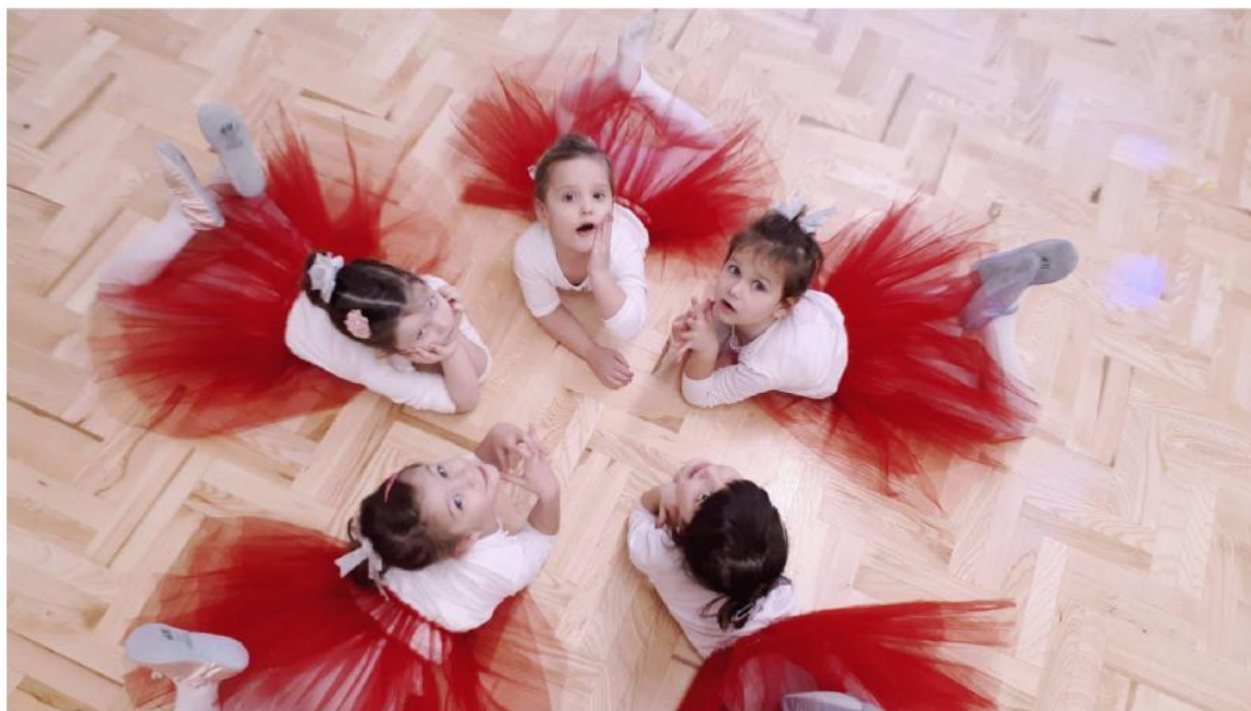
Slika 2. Malene plesačice čekaju početak sata