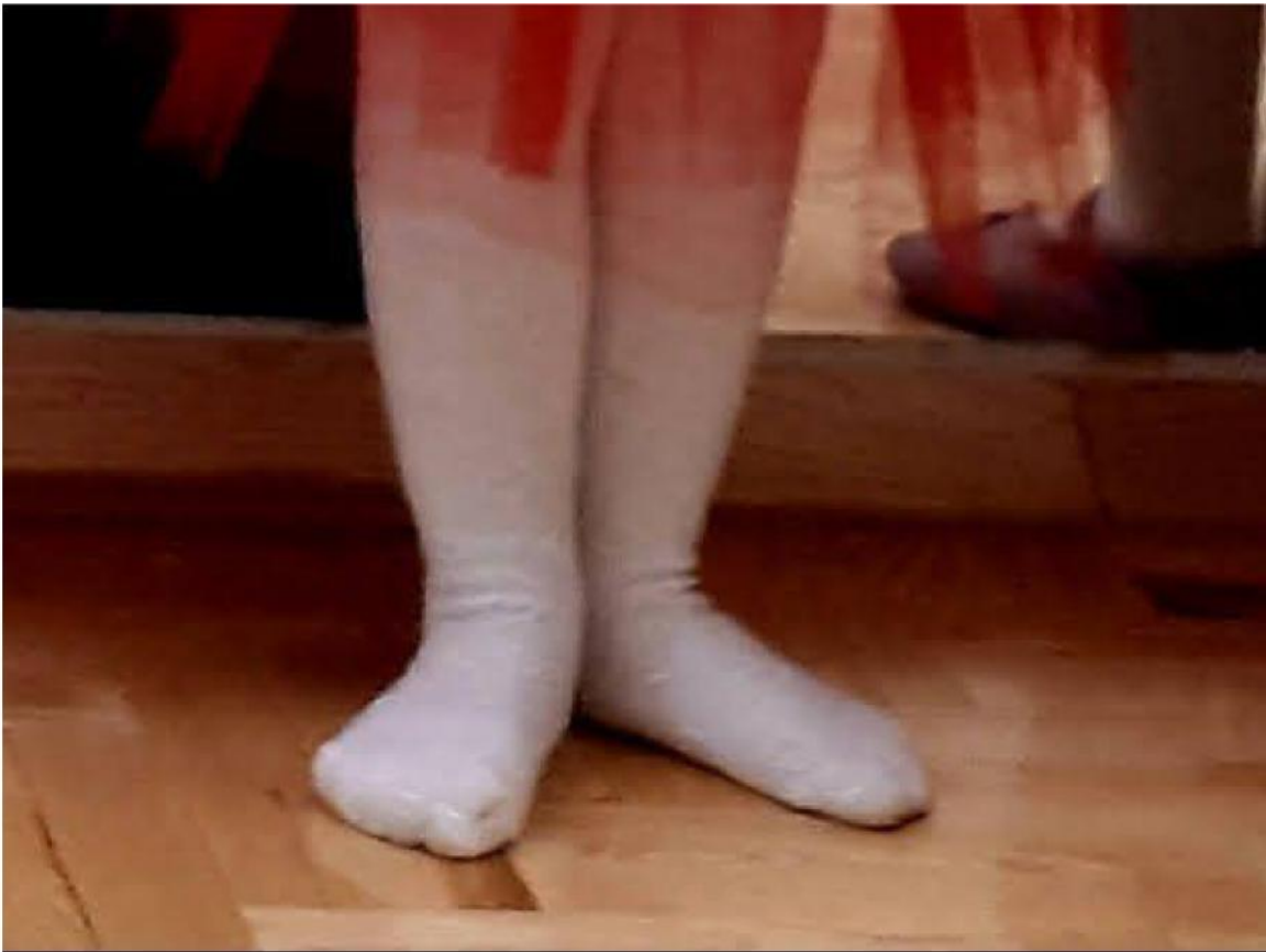
Slika 6. Pozicija na vrhovima prstiju plesačice