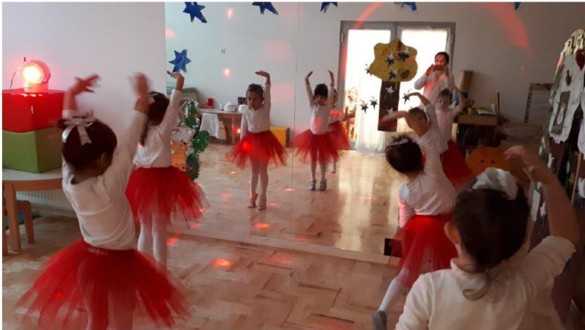
Slika 4. Vježbe istezanja na vrhovima prstiju