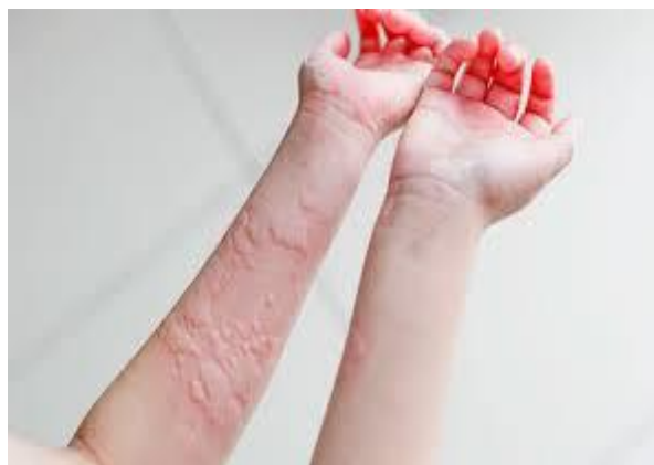
Slika br. 3- primjer urtikarije