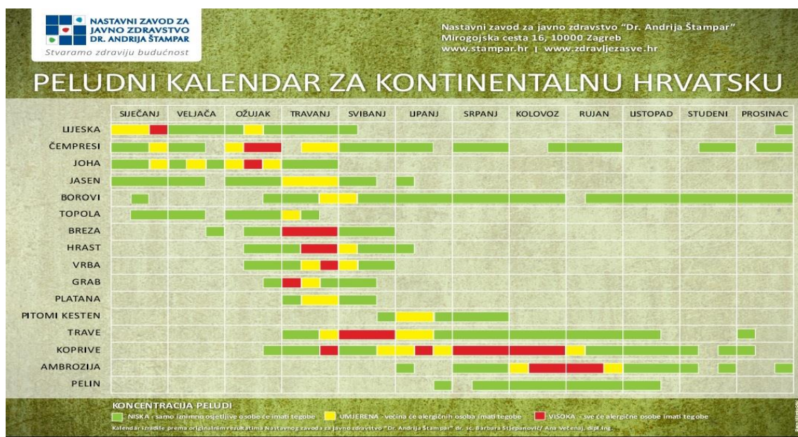
Slika br. 1- primjer peludnog kalendara za kontinentalnu Hrvatsku

S druge strane, različite biljke proizvode sitne, lagane čestice koje nazivamo pelud. Pelud služi za oplođivanje dijelova drugih biljaka, a najčešće se prenosi strujanjem zraka (Daniels, 2004). Tri su uvjeta koja određenu biljnu vrstu kategoriziraju kao alergogenu, a to su: oprašivanje vjetrom, proizvodnja peludi u velikim količinama i činjenica da pelud ima alergogene osobine što znači da peludna zrnca u doticaju sa sluznicom uzrokuju alergijsku reakciju (Fistrić, 2015). Pelud biljaka običnog izgleda (stabla, trave, korov) najčešće izazivaju alergijske reakcije. Alergija na pelud je poznata i pod nazivom peludna groznica ili hunjavica. Stabla čija pelud najčešće uzrokuje alergije su breza, lijeska, joha i jasen, a od korova su to artemizija i ambrozija. Peludni kalendar uvelike pomaže u praćenju koncentracije peludi za određeno godišnje doba, a s obzirom na klimatske uvjete (Mušič, 2009).