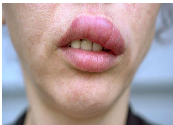
Slika br.4- primjer angioedema