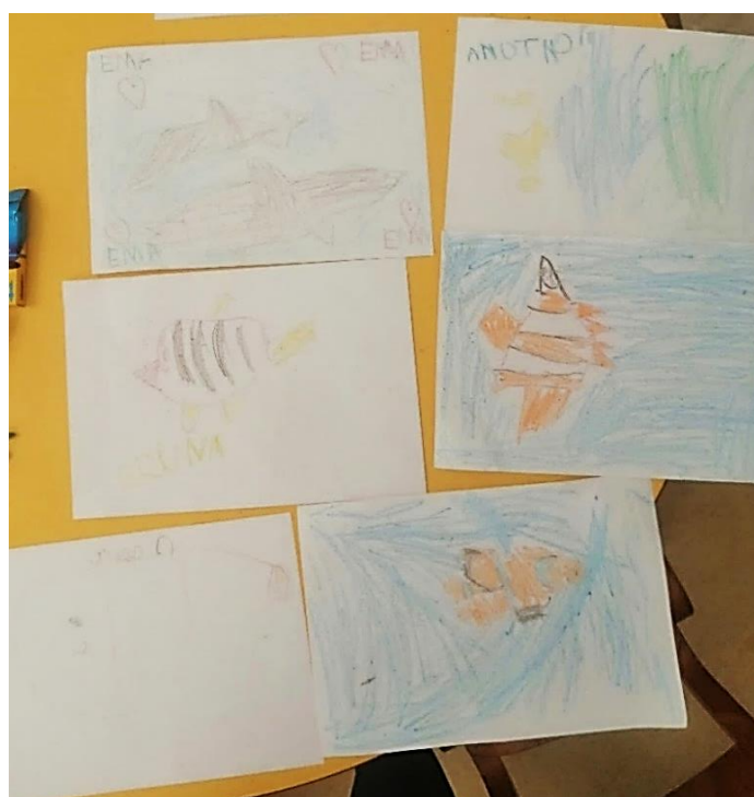
Slika 12. Dječji radovi morskih životinja - tehnika: pastele

Pri radovima ostvarenim s pastelom jasno su vidljivi motiv koji je najviše privukao djecu – ribe (Slika 12). Prepoznatljiva riba je Riba klaun koju lako raspoznavamo zbog dobro odabranih boja. Prilikom slikanja pastelama djeca su bila usmjerena na detalje te su sjeli uz fotografije riba i nastojali ih prikazati što preciznije.