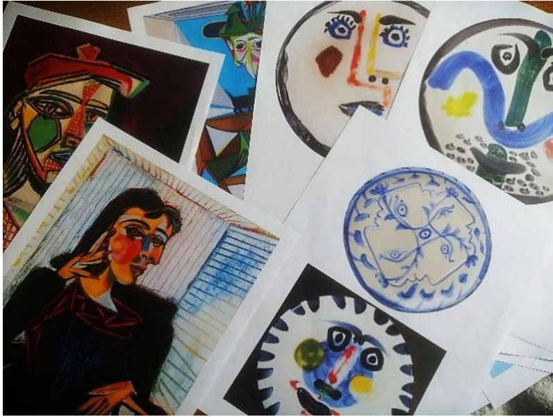
Slika 1. Prikazana umjetnička djela kao poticaj za kreativnost