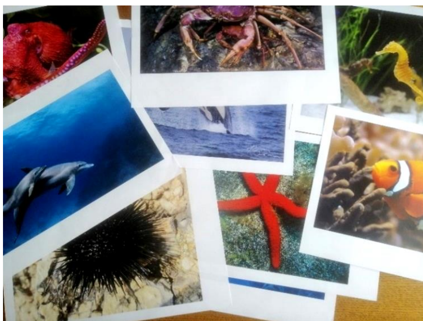
Slika 6. Fotografije morskih životinja

Sat je započeo razgovorom, međutim na pomalo nespecifičan način. Djeca nisu odmah saznala temu sata, već su je nakon zagonetki trebali odgonetnuti sami. Svaku zagonetku pratila je fotografija životinje nakon što su djeca odgonetnula životinju. Nakon spomenute životinje djeca su se, promatrajući fotografije, nastojala prisjetiti što im je poznato i što znaju o navedenoj morskoj životinji. Iznosili su svoja iskustva s tim životinjama – jesu li ih vidjeli ili dodirnuli. Ovakvim pristupom i načinom rada lako je vidljiva njihova zainteresiranost za temu te njihovo poznavanje iste. Nakon razgovora fotografije su djeci bile dostupne na stolu gdje su im se mogli približiti i pomno promotriti izgled svih životinja (Slika 6).