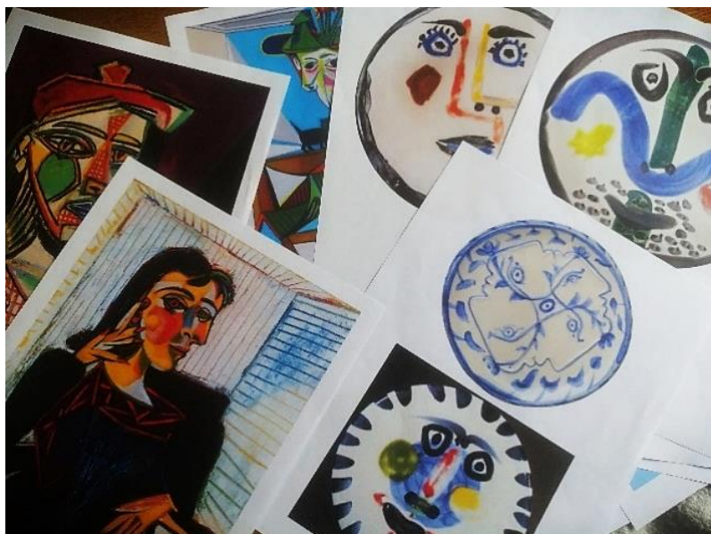
Slika 1. Prikazana umjetnička djela kao poticaj za kreativnost