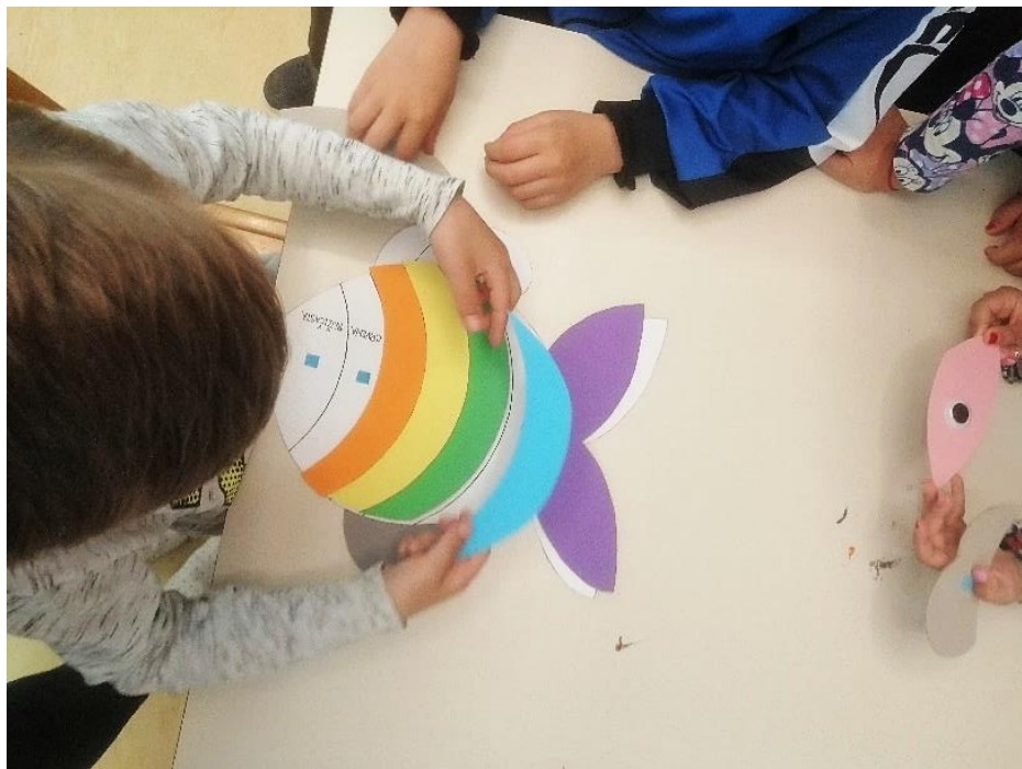
Slika 9. Didaktička igra nizanja različitih boja

Nimalo slabiji interes skupine ostvarila je i igra sastavljanja ribe različitih boja (Slika 9). Zadatak ove igre bio je razaznati koji oblik pojedine boje kojem djelu ribe pripada. Djeca su pomoću čička pojedine boje prilijepila na karton. Ovom igrom djeca su mogla bolje percipirati različitost oblika te su istovremeno razvijala koncentraciju i zapažanje.