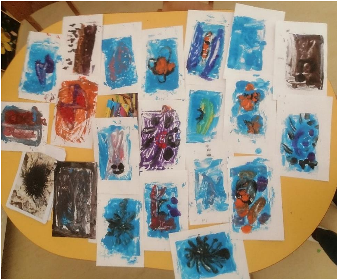
Slika 13. Dječji radovi ostvareni tehnikom monotipije

Prilikom izrade monotipije djecu nisu privukli samo motivi ribe (kao kod izrade radova pastelom), već i druge životinje koje žive u moru, pa su naslikali i njih (Slika 13). I kod slikanja po foliji (kao i kod crtanja s pastelama) djeca su nastojala koristiti boje i oblike životinja što sličnijim onima iz prirode. U jednom djelu radova razaznaje se motiv rada, no na dijelu radova nije moguće sa sigurnošću razaznati motiv.