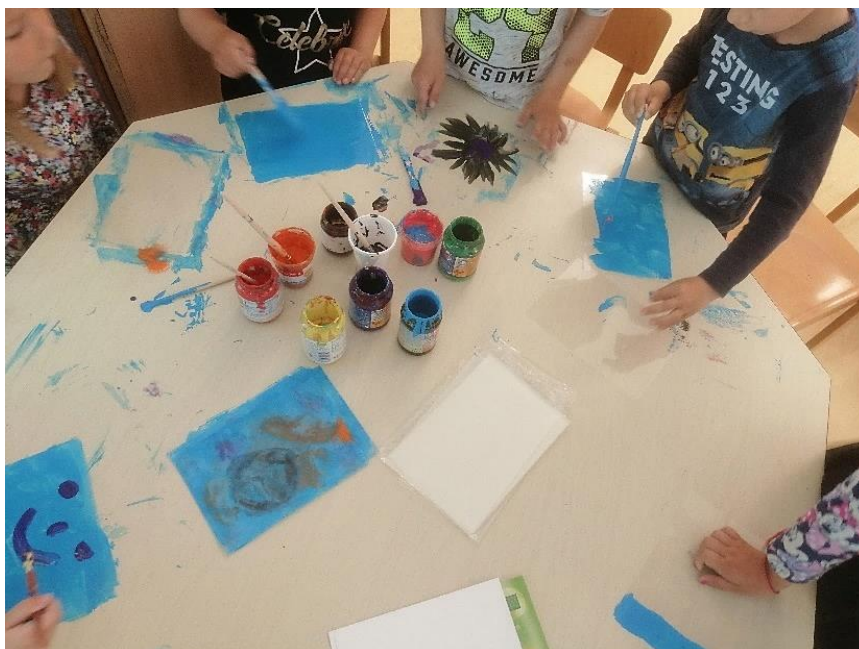
Slika 11. Oslikavanje folije (monotipija)