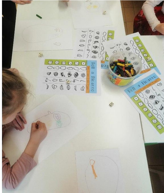
Slika 3. Izražavanje pastelama

Kiparska tehnika oblikovanja glinamola jako je dobro prihvaćana u skupini. Djeca su oblikovala navedeni materijal u obliku tanjurića, a zatim su na njima iscrtali lica uz pomoć čačkalica (Slika 4). Djeca su nastojala pažljivo oblikovati glinamol (uleknuti reljef) stvarajući odgovarajući volumen i dizajn predmeta koji kasnije mogu upotrebljavati na različite načine.