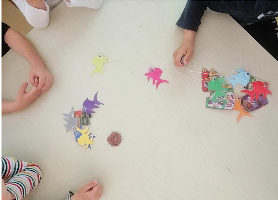
Slika 8. Didaktička igra pecanja ribice

Nimalo slabiji interes skupine ostvarila je i igra sastavljanja ribe različitih boja (Slika 9). Zadatak ove igre bio je razaznati koji oblik pojedine boje kojem djelu ribe pripada. Djeca su pomoću čička pojedine boje prilijepila na karton. Ovom igrom djeca su mogla bolje percipirati različitost oblika te su istovremeno razvijala koncentraciju i zapažanje.