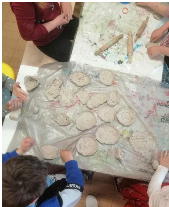
Slika 4. Ucrtavanje lica na tanjurićima izrađenim od glinamola

Kiparska tehnika oblikovanja glinamola jako je dobro prihvaćana u skupini. Djeca su oblikovala navedeni materijal u obliku tanjurića, a zatim su na njima iscrtali lica uz pomoć čačkalica (Slika 4). Djeca su nastojala pažljivo oblikovati glinamol (uleknuti reljef) stvarajući odgovarajući volumen i dizajn predmeta koji kasnije mogu upotrebljavati na različite načine.