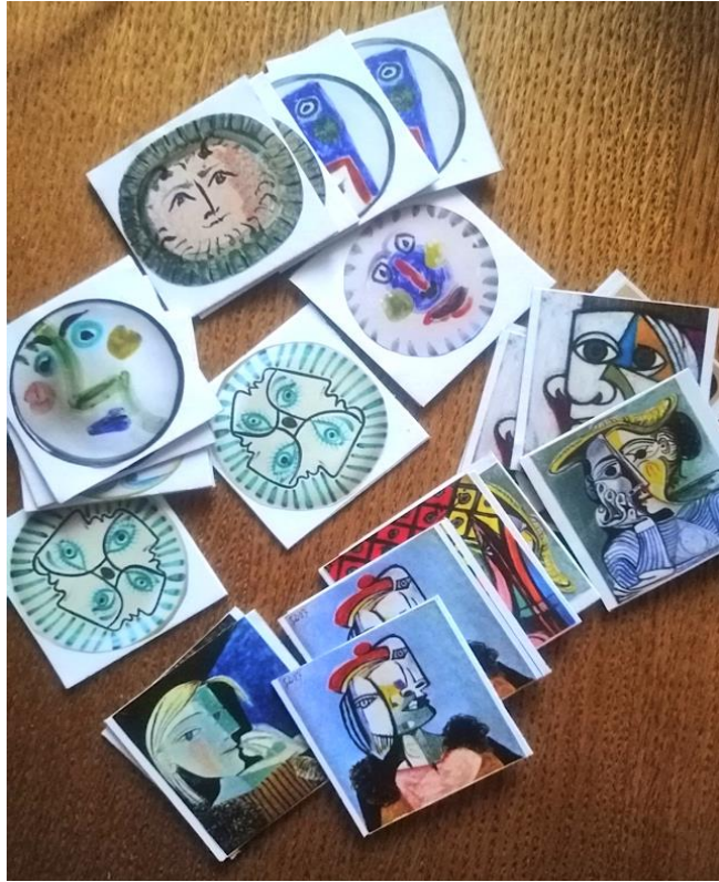
Slika 2. Memory sa kubističkim portretima i licima prikazanim na tanjurima