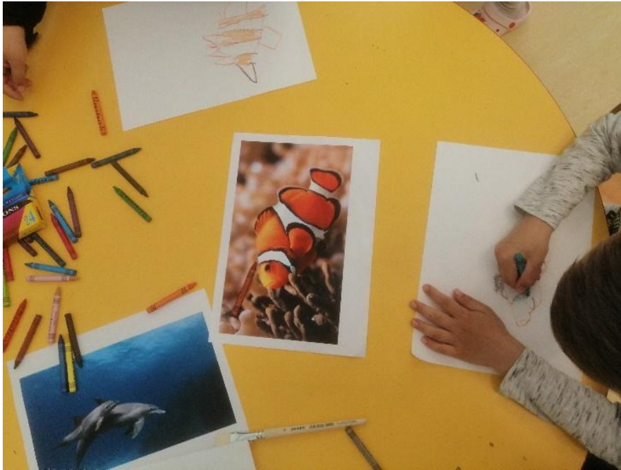
Slika 10. Izražavanje pastelom – morske životinje

Morske životinje kao planiran motiv odvela nas je u dva različita načina umjetničkog izražavanja. Jedan način bio je korištenje slikarske tehnike pastele (Slika 10), a drugi grafičke tehnike monotipije. Pastele su skupini od ranije poznate tehnike rada, stoga nisu privukle djecu u velikom broju kao monotipija.