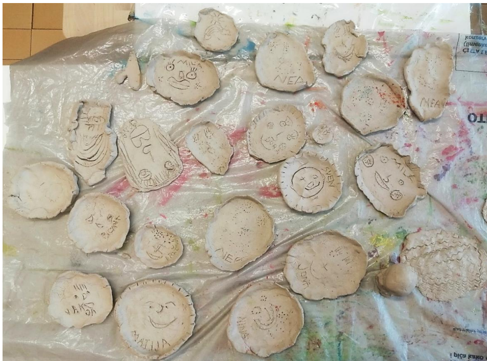
Slika 5. Dječji radovi - tehnika: glinamol

Rad s glinamolom jako se dojmio skupini. U početku nisu znali kako oblikovati tanjur, ali s upornošću su uspjeli oblikovati kuglu i otisnuti je u oblik tanjura. Djeca su većinom iscertavala lice čačalicama korištenjem linija, ali pojedini su se odlučili za prikaz lica ubodima čačkalice u glinamol, tj. oblikovani tanjur (Slika 5). Djeca su se jako posvetila oblikovanju, sama izrada tanjura bila im je zanimljivija od iscertavanja dijelova lica. Nakon oblikovanja djeca su tražila još glinamola. Komentari djece prilikom izrade oblikovanja: „Zašto ne možemo napraviti uši? Naši tanjuri moraju biti neobični“, „Ovo je zabavno, mogu li napraviti još jedan tanjur?“.