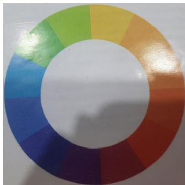
Slika 1. Krug boja prema Ostwaldu, Jakubin, 1999.

Na desnoj se polovici Ostwaldova kruga, prema Jakubinu, nalaze sve žute, narančaste, crvene i grimizne boje, a na lijevoj polovici kruga nalaze se žutozelene, zelene, plave, ljubičastoplave i ljubičaste. Navodi da se boje unutar kruga dijele na tri grupe, a to su osnovne boje, sekundarne boje i tercijarne boje. (Jakubin, 1999)