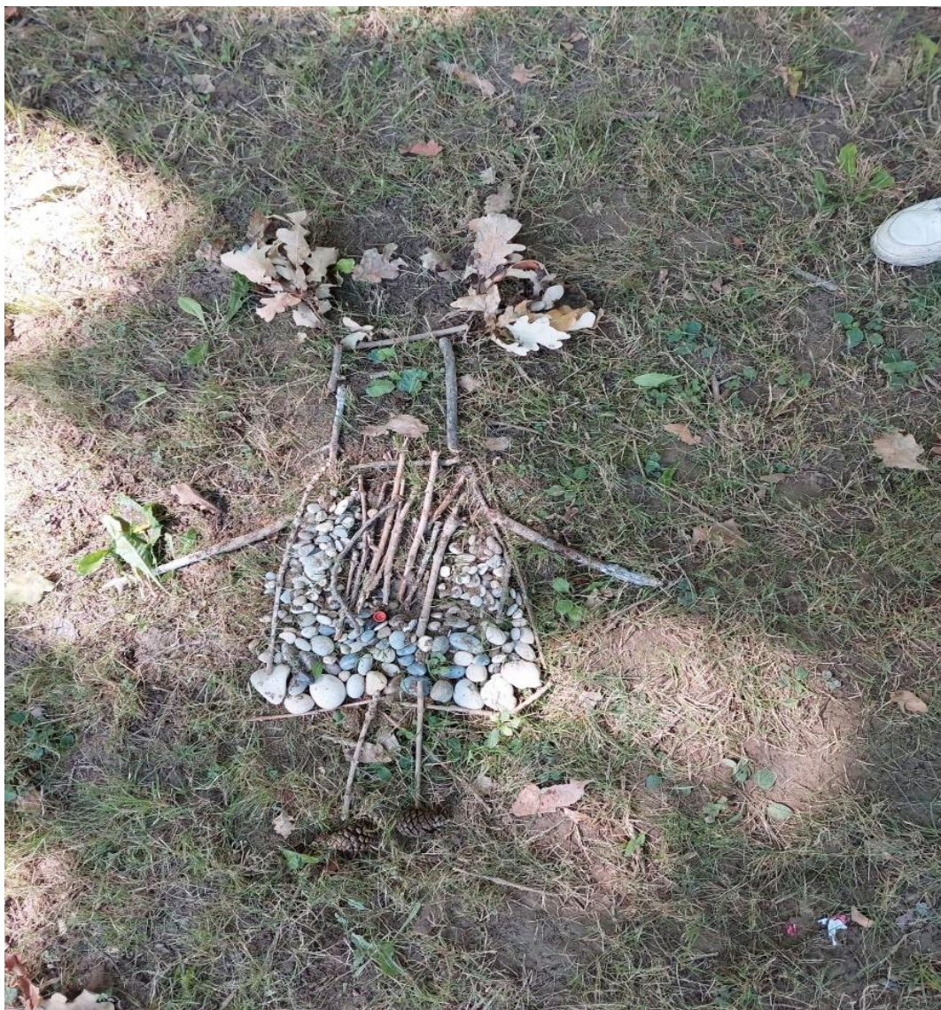
Slika 14: Šumska vila

Kroz izradu šumske vile do izražaja je došla dječja mašta ali i njihovo zapažanje i uspoređivanje sa stvarnim svijetom. Prirodnim materijalima koje su prikupili su izradili šumsku vilu, koju su kasnije i crtali i izmišljali priče o njoj. Na početku su sudjelovale samo djevojčice, ali se razbila stigma da tako nešto nije za dječake, jer kada su vidjeli kako djevojčice s užitkom skupljaju materijale, prišli su i pomogli s ostvarenjem šumske vile, dodavanjem pijeska na „ruke“ („vilinskog praha“) kako bi čarolija bila potpuna. Prije odlaska na spavanje tražili su priču o njihovoj šumskoj vili, u kojoj su i sami dodavali svoje rečenice.