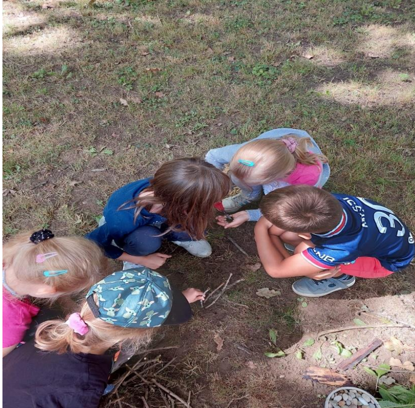
Slika 6: Početak izgradnje kuće za gliste