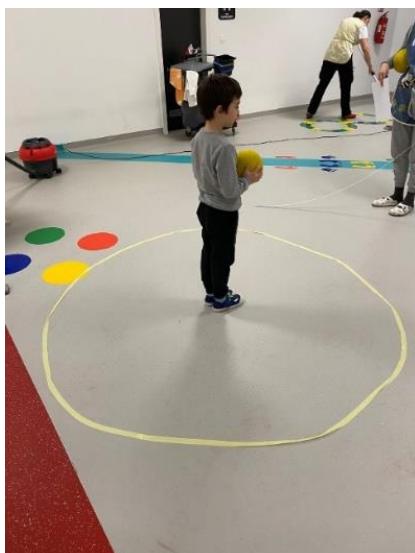
Slika 2. Bacanje i hvatanje lopte s pljeskom