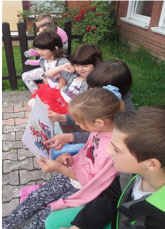
Slika 5. Djeca prije interpretativnoga čitanja ulomka proučavaju sliku patuljaka