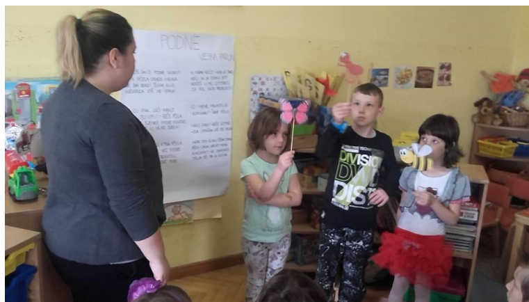
Slika 2. Interpretativno čitanje pjesme „Podne“ uz sudjelovanje djece i izrađenih lutkica