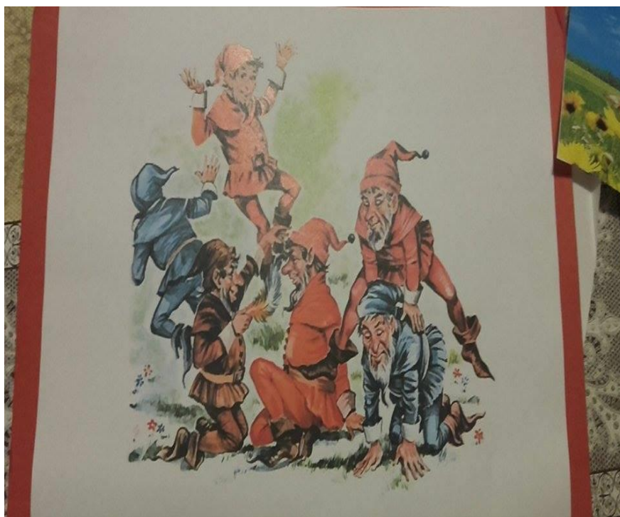
Slika 4. Prikaz patuljaka o kojima se razgovaralo prije interpretativnoga čitanja ulomka

Aktivnost je započela prikazom slike neobičnih patuljaka koju sam ranije pripremila. Nekako sam povezala patuljke i Domaće koji se spominju u priči. Gledajući sliku neobičnih patuljaka razgovarali smo o tome znaju li oni gdje i kako patuljci žive, jesu li oni veliki ili mali, jesu li slični ljudima ili su neobična stvorenja.