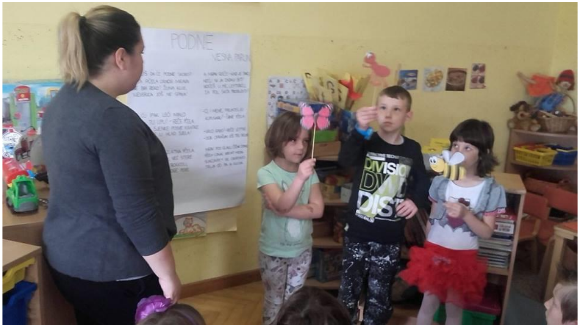
Slika 2. Interpretativno čitanje pjesme „Podne“ uz sudjelovanje djece i izrađenih lutkica

Tako smo pjesmu još par puta na isti način interpretirali te odlučili da svatko od njih nacрта nešto što su zapamtili iz pjesme i što im se posebno sviđjelo.