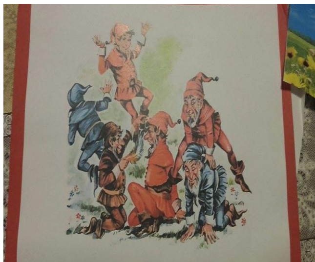
Slika 4. Prikaz patuljaka o kojima se razgovaralo prije interpretativnoga čitanja ulomka