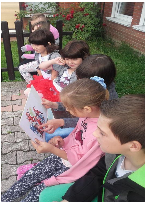
Slika 5. Djeca prije interpretativnoga čitanja ulomka proučavaju sliku patuljaka

S obzirom da su im patuljci otprilike već dobro poznati, odlučila sam interpretativno pročitati ulomak iz priče „Šuma Striborova“. Izabrala sam ulomak u kojem Domaći izlaze iz plamena i skaču, plešu po pepelu, pod policu, na stolicu. Također je u ulomku stajao i opis Domaćih kao malih mužića od jedva pola lakta.