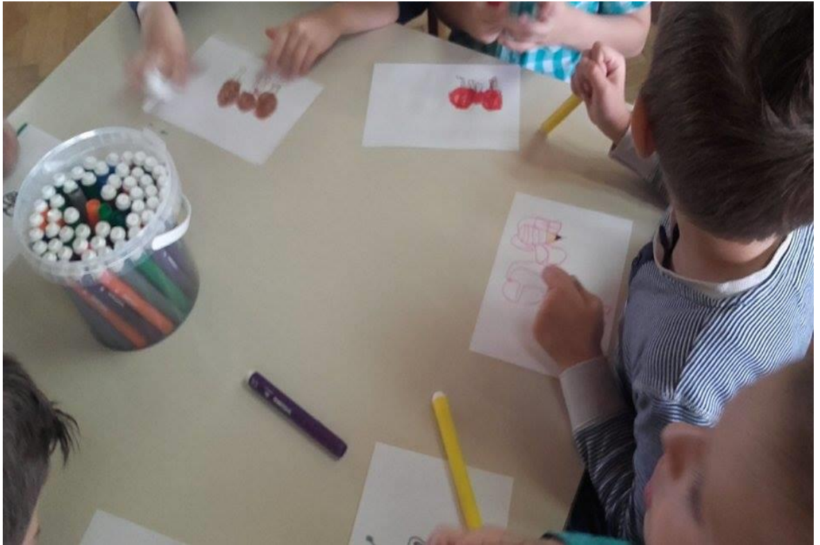
Slika 3. Nakon interpretativnoga čitanja pjesme djeca crtaju što im se najviše svidjelo