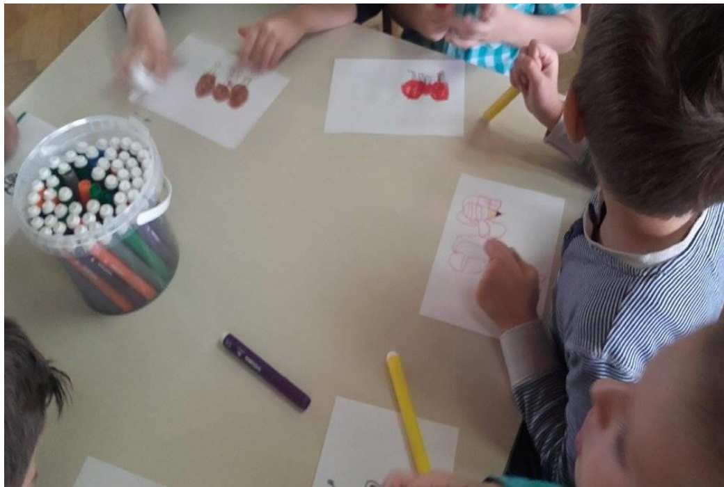
Slika 3. Nakon interpretativnoga čitanja pjesme djeca crtaju što im se najviše sviđjelo

Tako smo pjesmu još par puta na isti način interpretirali te odlučili da svatko od njih nacрта nešto što su zapamtili iz pjesme i što im se posebno sviđjelo.