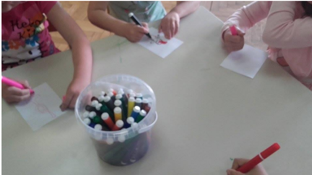
Slika 6. Nakon interpretativnoga čitanja ulomka iz „Šume Striborove“ djeca crtaju patuljke

Kada smo razriješili sve nepoznate riječi, ponovno sam interpretirala ulomak, te su mi nakon interpretacije rekli da im je sada bilo malo lakše za shvatiti tekst. Kao aktivnost nakon interpretacije djeca su odlučila nacrtati ono što im se najviše svidjelo. Crteži su bili puni patuljaka s kopicama i opancima koji iskaču iz vatre.