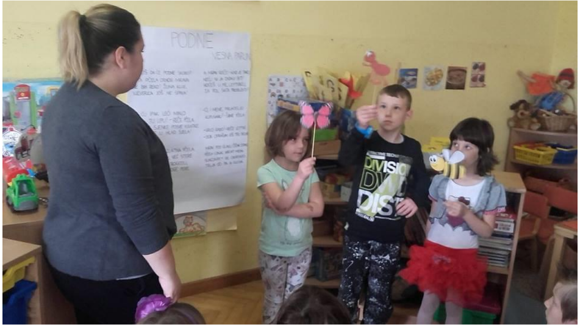
Slika 2. Interpretativno čitanje pjesme „Podne“ uz sudjelovanje djece i izrađenih lutkica

Tako smo pjesmu još par puta na isti način interpretirali te odlučili da svatko od njih nacрта nešto što su zapamtili iz pjesme i što im se posebno sviđjelo.