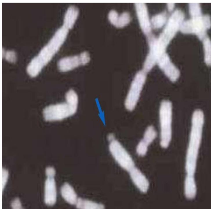
Slika 3. X kromosom na kojem je vidljivo fragilno mjesto

Javlja se sa učestalošću od 1:4000 muškaraca, odnosno 1.8000 žena, pa se danas općenito smatra najčešćim uzrokom nasljedne mentalne retardacije. Dosad je otkriveno jedanaest genskih lokusa (određeno mjesto na kromosomu koje zauzima gen odnosno sekvencija DNK) odgovornih sa devet pretežno neurologijskih bolesti kod kojih se javlja ovaj zanimljiv oblik nasljeđivanja (Barišić, I., 1998).