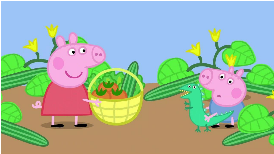
Slika 9. Prizor iz animiranog filma „Peppa Pig – Ručak“

Nakon razgovora prikazala bih im isti film još jednom, a zatim bih im postavila pitanje „Zna li možda netko kako sadimo voće i povrće?“.