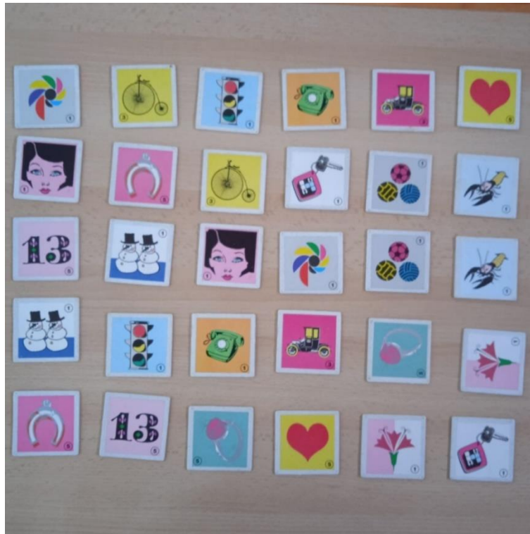
Slika 3. Varijanta rasporeda kartica na inicijalnom testiranju (test nakon gledanja kartica).