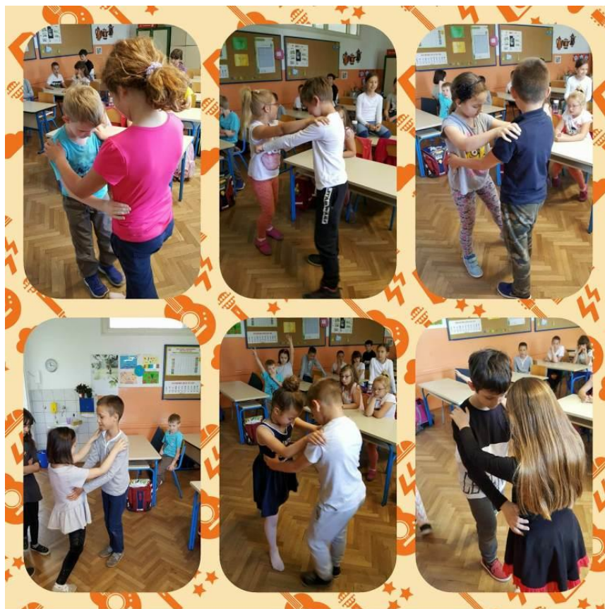
Slika 1. Prikaz plesne aktivnosti u školi (Krajačić, 2018).

Kurikulum glazbene kulture definira odgojno-obrazovne ishode, razradu odgojno-obrazovnih ishoda, sadržaj te preporuke za ostvarivanje ishoda. Ples pripada Domeni B (Istraživanje glazbom i uz glazbu), a ishodi koju obuhvaćaju ples su: