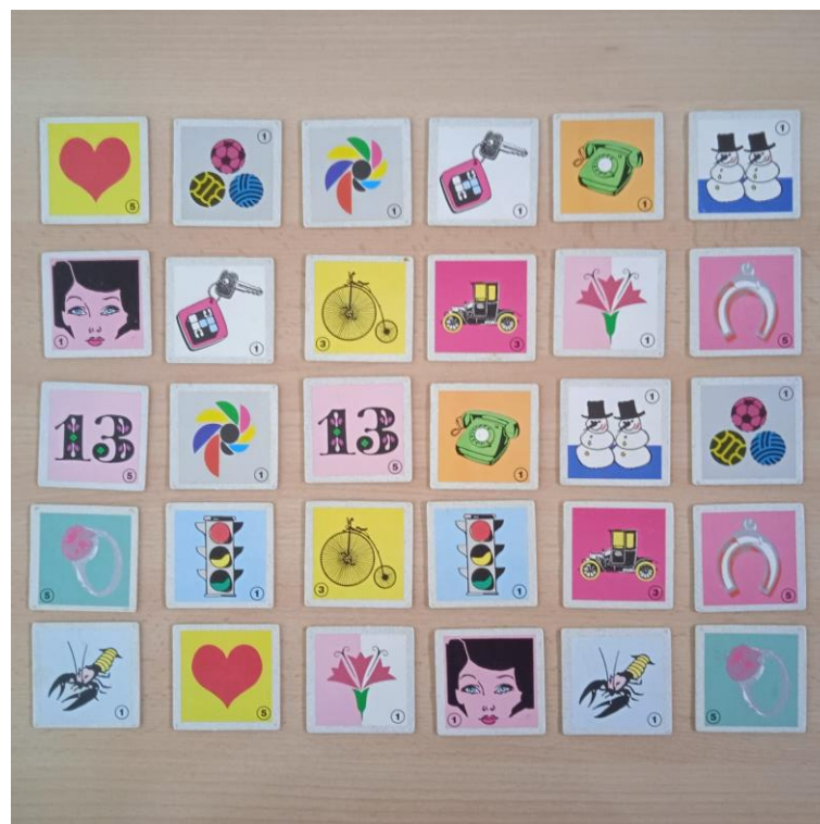
Slika 4. Varijanta rasporeda na inicijalnom testiranju (test bez gledanja kartica).