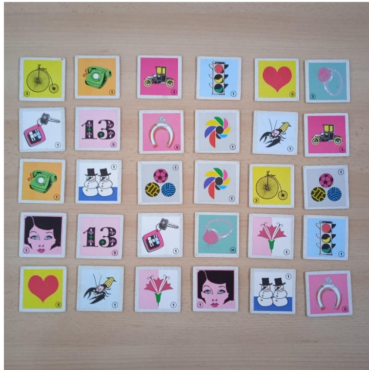
Slika 5. Varijanta rasporeda kartica na završnom testiranju (test nakon gledanja kartica).