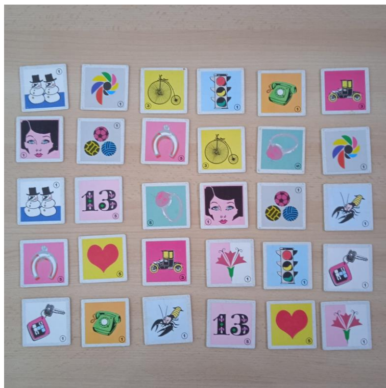
Slika 6. Varijanta rasporeda kartica završnom testiranju (test bez gledanja kartica).