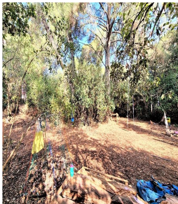
Slika 3. Prostor za igru