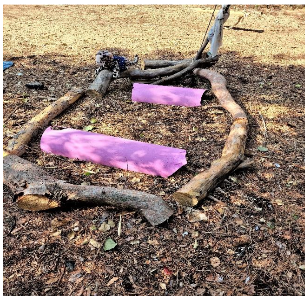
Slika 4. Igračka

Prostor šume upotpunjuju igračke koje su izradila djeca od prirodnih materijala nađenih u šumi (Slike 4 i 5). Vrlo su kreativne i multifunkcionalne jer mogu predstavljati sve ono što djeca žele i trebaju. Mala količina gotovih igračaka potiče djecu na planiranje, međusobnu komunikaciju, odabir prirodnih materijala za igru i dogovaranje načina njegovog korištenja. Drveću je iskorišteno za vježbanje spretnosti, ali i odmaranje. Na njima su postavljene ljuljačke i mreže za penjanje te viseće ležaljke za odmor i spavanje, hammock.