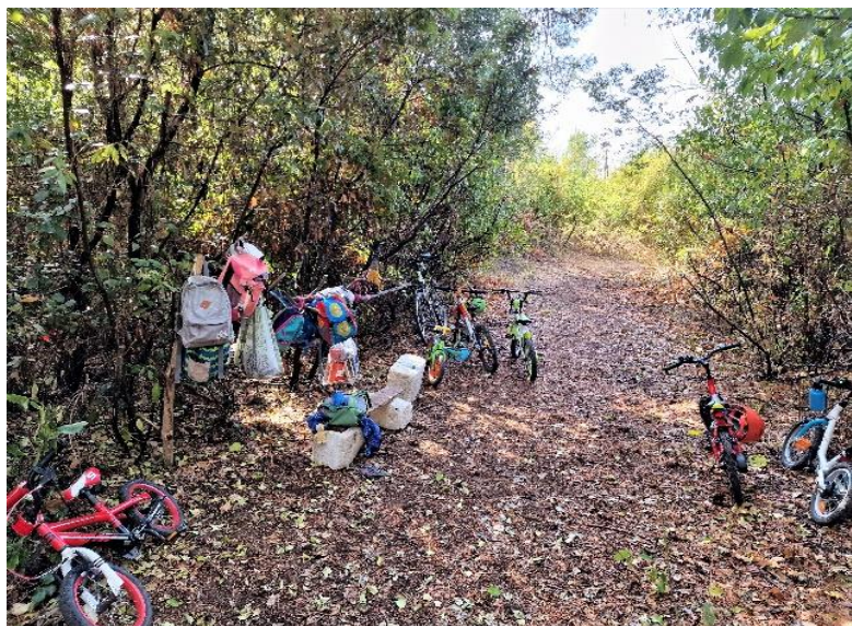
Slika1. Prostor za odlaganje opreme

Druga djeca, roditelji i odgojitelji se druže u centralno prostoru šume i razgovaraju (Slika 2). Atmosfera je opuštena, umirujuća, djeca nemaju nikakvih teškoća pri odvajanju, druže se, razgovaraju i zabavljaju. Uočava se kvalitetna komunikacija u kojoj je prisutna tolerancija i uvažavanje drugih. Djeca formiraju grupice prema zajedničkim interesima i spontano kreću u igru, mogu se slobodno kretati unutar većeg područja (Slika 3).