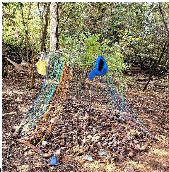
Slika 5. Prostor za igru, šator s češerima

Nakon voćne užine slijedi šetnja u drugi dio šume koji je brdovit. Teren je izazovan za vježbanje grube motorike i ravnoteže. Djeca uživaju u ispitivanju svojih motoričkih sposobnosti i vještina, stariji vježbaju spretnost vožnje bicikla spuštanjem niz nizbrdicu. Spuštanje biciklom je vrlo zabavno, a u penjanju na uzvisinu mlađem koji zapinje pomaže stariji prijatelj. Nakon toga izrađuju se prepreke za vožnju na uzvisini od ostataka drva koje djeca nalaze u okolini i treniraju vožnju, zaobilaženje i preskakanje prepreka biciklom. Iako djeca svakodnevno igraju različite rizične igre, vidljivo je da mogu procijeniti stupanj rizika u koji se mogu upustiti. Tako u ove