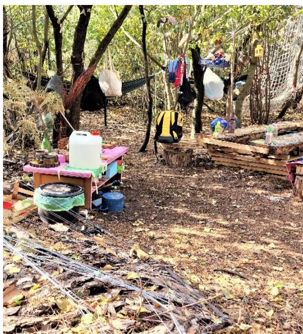
Slika 2. Centralni prostor

Druga djeca, roditelji i odgojitelji se druže u centralno prostoru šume i razgovaraju (Slika 2). Atmosfera je opuštena, umirujuća, djeca nemaju nikakvih teškoća pri odvajanju, druže se, razgovaraju i zabavljaju. Uočava se kvalitetna komunikacija u kojoj je prisutna tolerancija i uvažavanje drugih. Djeca formiraju grupice prema zajedničkim interesima i spontano kreću u igru, mogu se slobodno kretati unutar većeg područja (Slika 3).