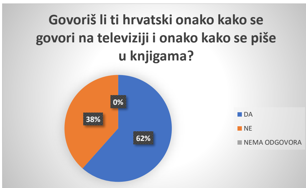
Slika 6 Grafički prikaz odgovora na pitanje Govoriš li ti hrvatski onako kako se govori na televiziji i onako kako se piše u knjigama? (starija dobna skupine Ptićice)

U Ptićicama njih 8 odgovara potvrdno (61,54%), dok su drugi odgovorili s ne (38,46%).