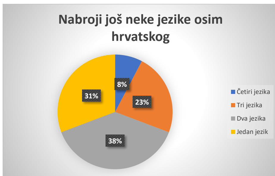
Slika 4 Grafički prikaz odgovora na pitanja Nbroji još neke jezike osim hrvatskog (starija dobna skupina Ptićice)

U Ptićicama, jedno dijete navodi četiri jezika (7,69%), troje djece tri jezika (23,07%), petoro djece navodi dva jezika (38,46 %), a njih četvero navodi jedan jezik (30,76%). Nabrojani jezici bili su engleski, slovenski, ruski, španjolski, njemački i francuski.