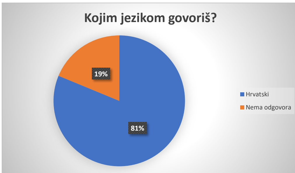
Slika 1 Grafički prikaz odgovora na pitanje Kojim jezikom govoriš? (mlađa dobna skupina Ribice)

U starijoj skupini sva djeca odgovaraju da govore hrvatskim jezikom (69,23%), ali dvoje od njih navode još ukrajinski (7,69%) i španjolski (7,69%), dok ih je 2 uz hrvatski, spomenulo i engleski jezik(15,28%).