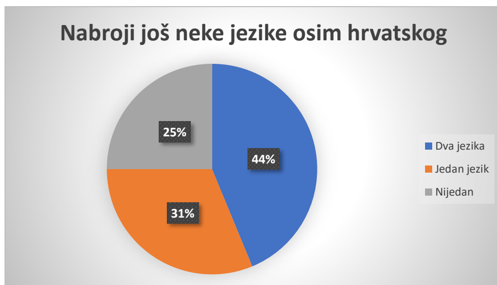
Slika 3 Grafički prikaz odgovora na pitanja Nbroji još neke jezike osim hrvatskog (mlađa dobna skupina Ribice)

U Ptićicama, jedno dijete navodi četiri jezika (7,69%), troje djece tri jezika (23,07%), petoro djece navodi dva jezika (38,46 %), a njih četvero navodi jedan jezik (30,76%). Nabrojani jezici bili su engleski, slovenski, ruski, španjolski, njemački i francuski.