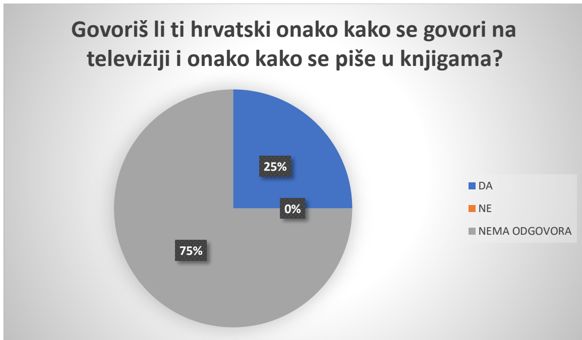
Slika 5 Grafički prikaz odgovora na pitanje Govoriš li ti hrvatski onako kako se govori na televiziji i onako kako se piše u knjigama? (mlađa dobna skupina Ribice)

dijalekta i hrvatskoga standardnog jezika. U Ribicama samo četvero djece (25%) odgovara potvrdnim odgovorom, druga djeca (75%) nisu davala odgovor, što sugerira da nisu razumjela što ih se pita.