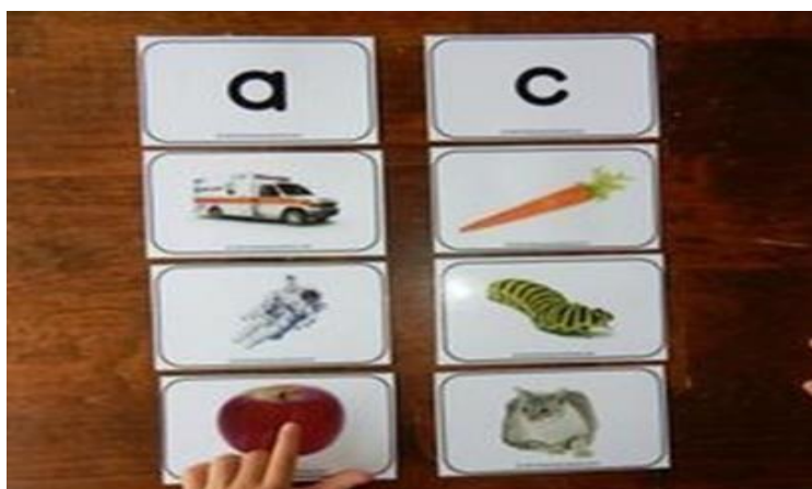
Slika 10 -predmeti grupirani u skupine po tri