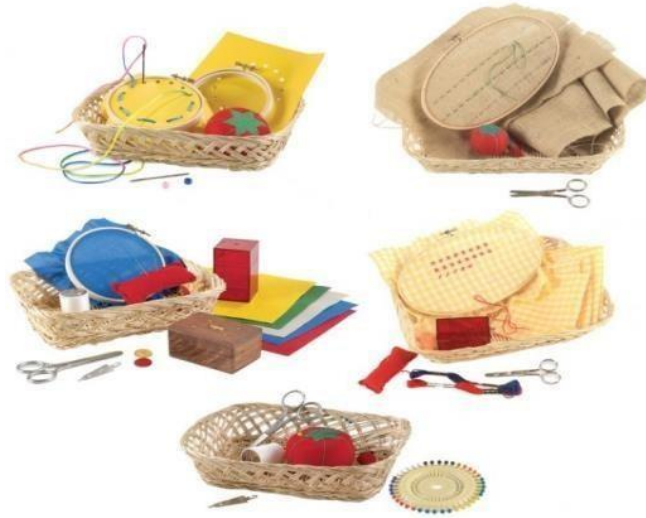
Slika 6- materijal za šivanje

kroz oblike nacrtane na papiru ili filcu.