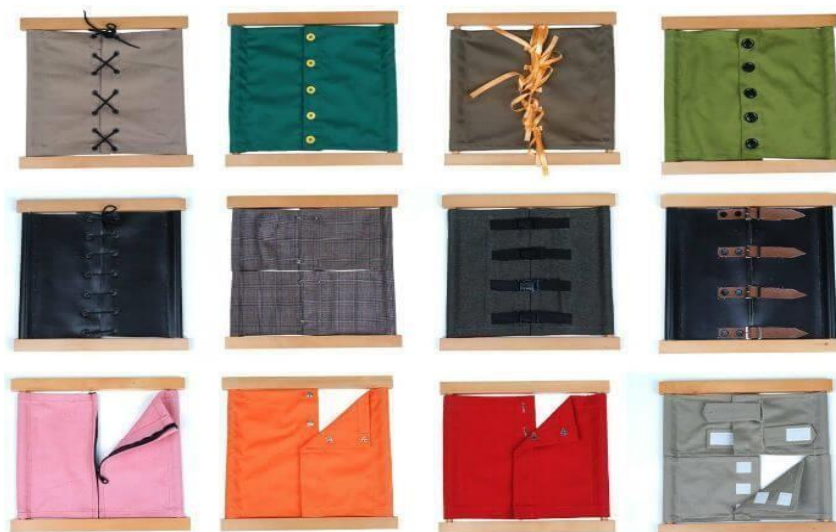
Slika 1- vježbe za razvoj samostalnosti

Primjer prema Pitamić (2014) – zakopčavanje dugmadi – aktivnost koju je potrebno podijeliti u faze kako bi dijete moglo shvatiti čitav proces. Prvo moramo pokazati postupak na odjeći koja nije na djetetu, krećući odozdo prema gore.