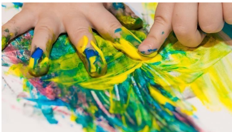
Slika 5- slikanje prstima