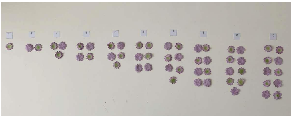
Slika 2 -povezivanje broja i brojke

jasne i ponovljene, što kod djece potiče razvoj mišljenja određenim redom, iz čega proizlazi sposobnost djeteta da stvara apstraktna mišljenja. Zbog svoje specifičnosti učenja kroz rad, matematičko se učenje smatra kinestetičkim. Iako mnogo predškolske djece rano pokaže interes za brojanje i brojeve, on se većinom gubi kada djetetu zadatci postanu preteški pa ih dijete ne može shvatiti. Materijalima se djetetu želi pomoći da savlada osnovne zakonitosti u matematici na njima primjeren način, te se tako potiče razvoj „matematičkog duha“ kako bi dijete savladalo poteškoće koje su nastale (Seiz i Hallwachs, 1997).