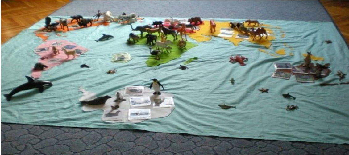
Slika 3- karta svijeta, kozmički odgoj

ga na razmišljanje i stvaranje vizije o svijetu. Budući da je glavna ideja bazirana na „cjelini“, djecu se uči tome da su različitosti u kulturama, pojave i događaji u prirodi, kao i oni sami, dio jedne velike cjeline – svijeta (Kortschack-Gummer, 2011).