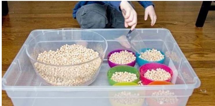
Slika 4- presipavanje materijala u posudice