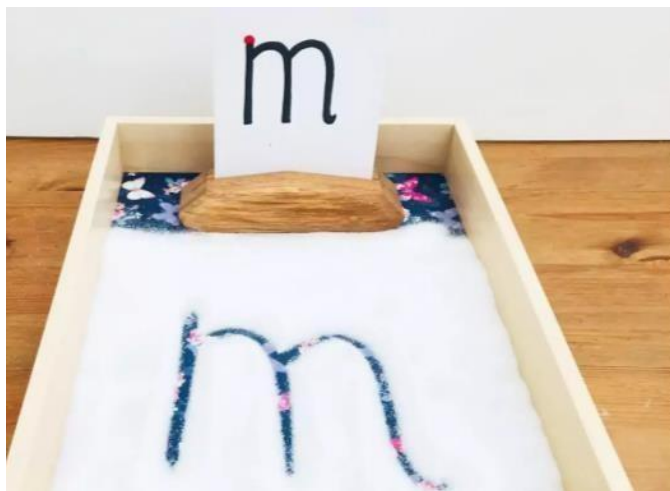
Slika 7 - trag u pijesku