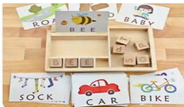
Slika 8- kartice s nazivima