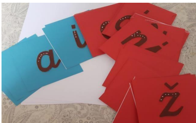
Slika 9- slova od brusnog papira