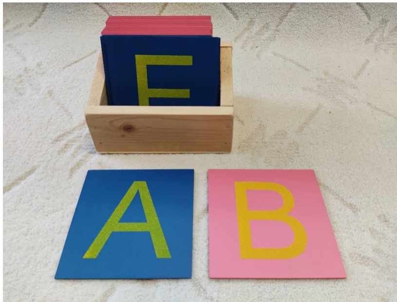
Slike 9: Velika slova od brusnog papira (autorski rad)

Područje za razvoj govora se smatra primarnim dijelom Montessori pedagogije. Sadržaji ovog područja su prirodno implementirani u svim drugim područjima jer dijete upoznaje jezik pomoću sluha, vida, govora i senzomotoričkih sposobnosti koje su prijeko potrebne za čitanje i pisanje. Vježbe pokreta ruke dijeli na prvi dio koji uvježbava pokret ruke za pisanje i drugi dio koji uvježbava pisanje slova (Heiland, 1992).