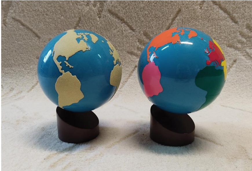
Slika 11: Globus 1 i 2 (autorski rad)

Osnovni cilj kozmičkog odgoja je pokazati djetetu način kako će samostalno upoznati svijet oko sebe. Maria Montessori je htjela putem ovih materijala omogućiti djeci da stvore povezanost sa svijetom (Seitz i Hallwachs, 1996).