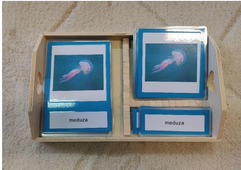
Slika 10: Kartice za imenovanje (autorski rad)

izbor knjiga, povezivanje kartica s predmetima, čitanje i pisanje malih predmeta i različitih životinjskih skupina (Herrmann, 2018). Promatrajući razvoj djeteta, uočava se velika važnost govora kod stjecanja socijalnih vještina (Montessori, 2019).