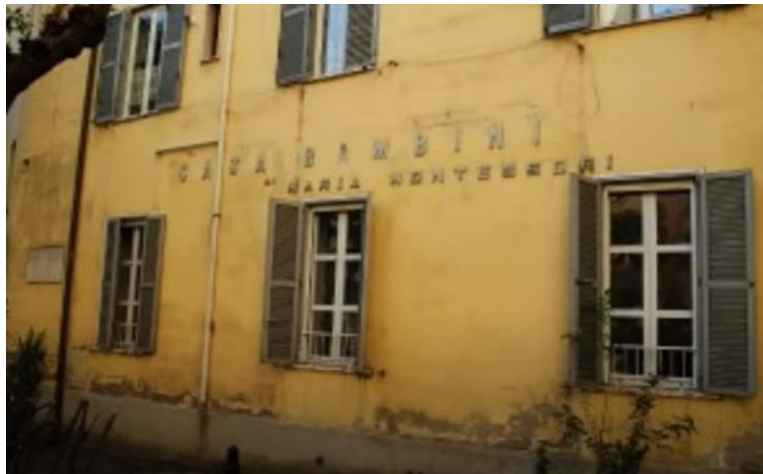
Slika 2: Casa dei Bambini (preuzeto:

djeci samo ako ona to traže jer u suprotnom im narušavaju razvoj njihove samostalnosti. „Maria Montessori je zaključila da djeca najbolje uče u opuštenom, veselom okruženju, gdje mogu sama i slobodno razviti svoju djelatnost. Na tom zlatnom pravilu temeljila je svoju metodu.“ (Buczynski, 2008, str. 92).