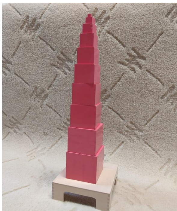
Slika 5: Ružičasti toranj (autorski rad)