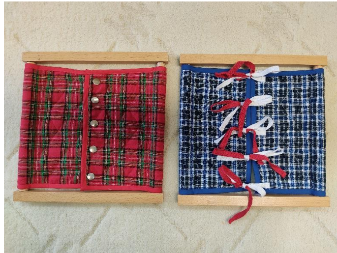
Slika 3: Okviri za zakopčavanje i vezanje (autorski rad)

Kako je vidljivo u tablici 1 vježbe praktičnog života su većinom aktivnosti s kojima su se djeca ranije susretala u svojim obiteljskim domovima (Philipps, 1999). Imitiranjem odraslih, dijete će obavljati raznovrsne poslove kod kuće, kao što su pranje posuđa, pripremanje voća i povrća, pospremanje svojih stvari, samostalno oblačenje i obuvanje (Stevanović, 2000).