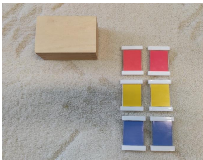
Slika 6: Pločice u boji – primarne boje (autorski rad)