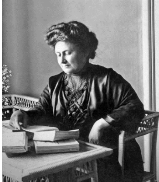
Slika 1: Maria Montessori (preuzeto:

djecom koja su imala određene teškoće. Oni su nakon dvogodišnjeg poučavanja, ostvarila bolje rezultate nego zdrava djeca. U tom trenutku se zapitala na koji način se s njima radi (Philipps, 1999).