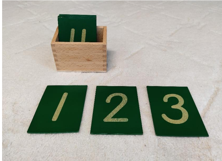
Slika 7: Brojke od brusnog papira (autorski rad)

Iz tablice 3 vidljivo je da ima dosta materijala iz područja matematike. Funkcije materijala obuhvaćaju sva matematička područja kako bi djeca na smislen način upoznala i razumjela matematička pravila.