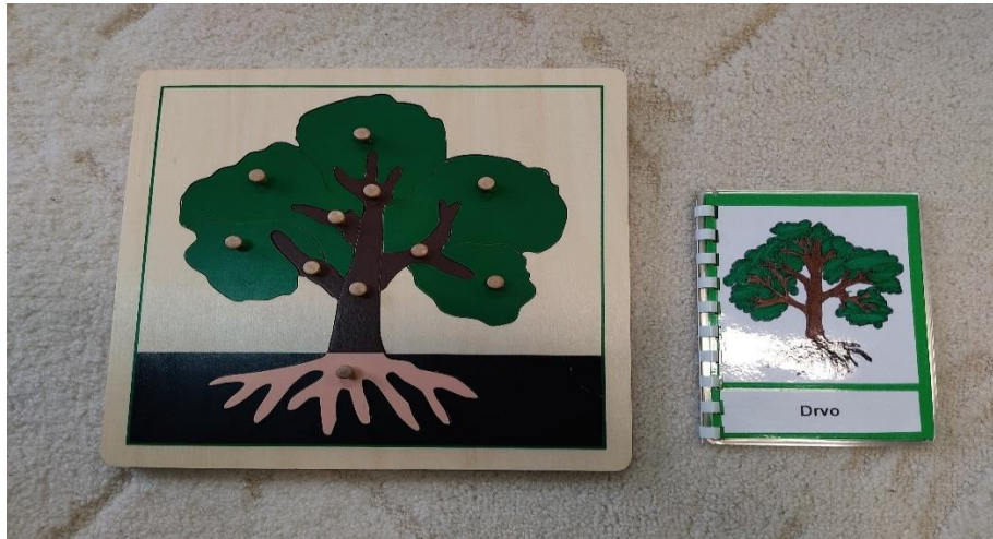
Slika 12: Slagarica i knjižica drvo (autorski rad)

Osnovni cilj kozmičkog odgoja je pokazati djetetu način kako će samostalno upoznati svijet oko sebe. Maria Montessori je htjela putem ovih materijala omogućiti djeci da stvore povezanost sa svijetom (Seitz i Hallwachs, 1996).