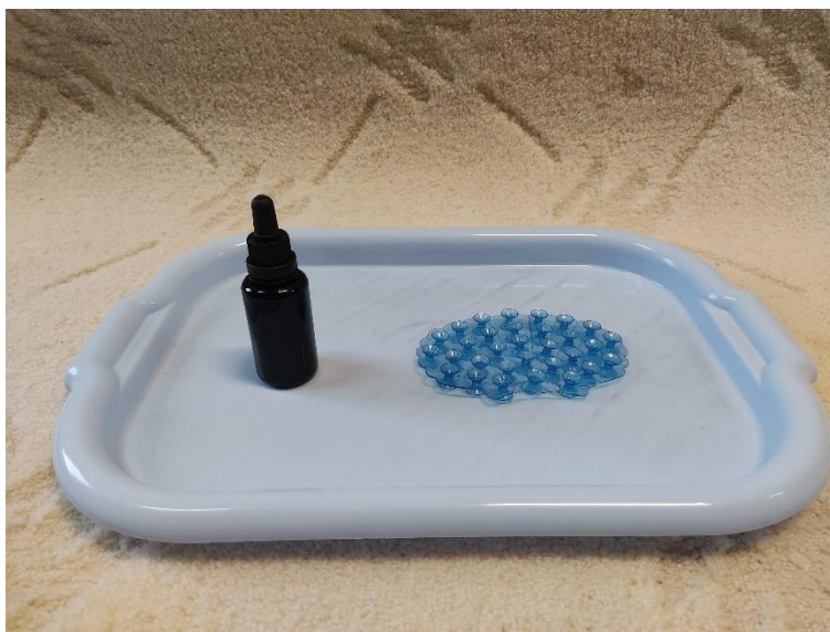
Slika 4: Prenošenje vode malom pipetom (autorski rad)