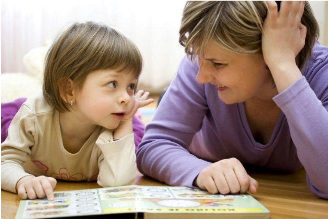
Slika 10. Važnost interakcije autističnom djeteta s odgajateljicom

svom nastavničkom iskustvu u planiranju i izvođenju lekcija svaki školski dan, što ih je opremilo deduktivnim i induktivnim podučavajućim strategijama.