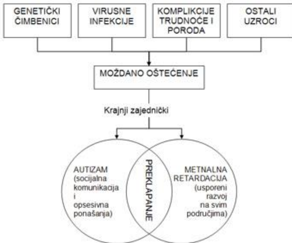
Slika 5. Poremećaji autističnog spektra

Govor je jedan od prvih znakova autističnog poremećaja koji može skroz izostati ili može biti siromašan. Kod poneke djece govor se uredno počne razvijati i onda u jednom trenutku postupno nestaje ili se osiromašuje. U neki slučajevima djeca odjednom prestanu govoriti i ne žele izreći ni jednu riječ. U takvim slučajevima djeca s poremećajem autizma će pokazati gestom ako nešto trebaju ili će osobu dovesti na određeno mjesto kako bi pokazali što žele. Iako imaju dobro razvijene slušne organe autistična djeca ponekad znaju nalikovati na gluhe osobe jer se ne odazivaju na pozive i podražaje iz okoline. Autistično dijete čuje sve podražaje međutim ne reagiraju jer određeni dijelovi mozga ne znaju proraditi informacije i zbog toga dijete ne shvaća smisao prenesenih riječi. Takve situacije kod djeteta uzrokuju anksioznost i nemoć koje dovodi do povlačenja u sebe i svoj svijet gdje se osjeća najprihvatljivijem. (Nikolić, 1990.)