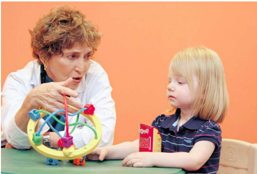
Slika 8. Autistična djevojčica u igri s odgajateljicom

Dijete u svom obrazovnom periodu najviše vremena provede u odgojno-obrazovnoj ustanovi. Zbog toga je vrlo važno da se osjeća prihvaćeno, sigurno i sretno. Za djetetov dobar osjećaj u odgojno-obrazovnoj ustanovi bitan je kvalitetan i topao odnos između odgojitelja i roditelja. U samom odgoju djeteta s poremećajem autizma vrlo je bitna suradnja između odgojitelja, roditelja i odgojno-obrazovne ustanove. Dijete s posebnim potrebama više osjeti negativan odnos između odgojitelja i roditelja nego dijete koje nema posebne potrebe. Ono neće moći napredovati ako je odnos narušen. Odgojitelj se često nađe u poziciji da ne može izgraditi dobar odnos s roditeljima jer njihovo viđenje je ujutro tijekom dolaska djeteta i popodne tijekom odlaska. Kako bi se odnos gradio u dobrom smjeru potrebno je povjerenje, tolerancija, objektivnost i volja za razgovorom. (Milanović, 2014.)