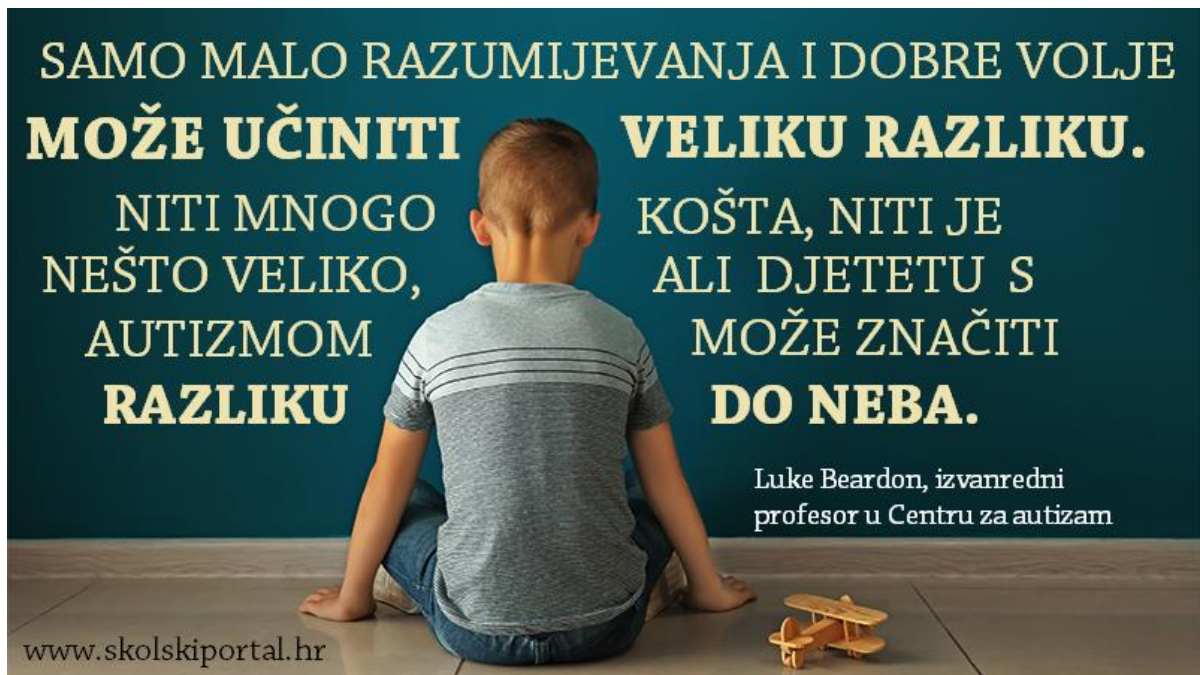
Slika 7. Tri zlazna pravila za potporu djeci s autizmom

„Odgojitelj je stručno osposobljena osoba koja provodi odgojno-obrazovni program rada s djecom predškolske dobi i stručno promišlja odgojno-obrazovni proces u svojoj odgojno-obrazovnoj skupini. On pravodobno planira, programira i vrednuje odgojno-obrazovni rad u dogovorenim razdobljima. Prikuplja, izrađuje i održava sredstva za rad s djecom te vodi brigu o estetskom i funkcionalnom uređenju prostora za izvođenje različitih aktivnosti. Radi na zadovoljenju svakidašnjih potreba djece i njihovih razvojnih zadataka te potiče razvoj svakoga djeteta prema njegovim sposobnostima. Vodi dokumentaciju o djeci i radu te zadovoljava stručne zahtjeve u organizaciji i unapređenju odgojno-obrazovnog procesa. Suraduje s roditeljima, stručnjacima i stručnim timom u dječjem vrtiću kao i s ostalim sudionicima u odgoju i naobrazbi djece predškolske dobi u lokalnoj zajednici. Odgovoran je za provedbu programa rada s djecom kao i za opremu i didaktička sredstva kojima se koristi u radu.“ (Članak 26. Državnog pedagoškog standarda Republike Hrvatske, 2008).