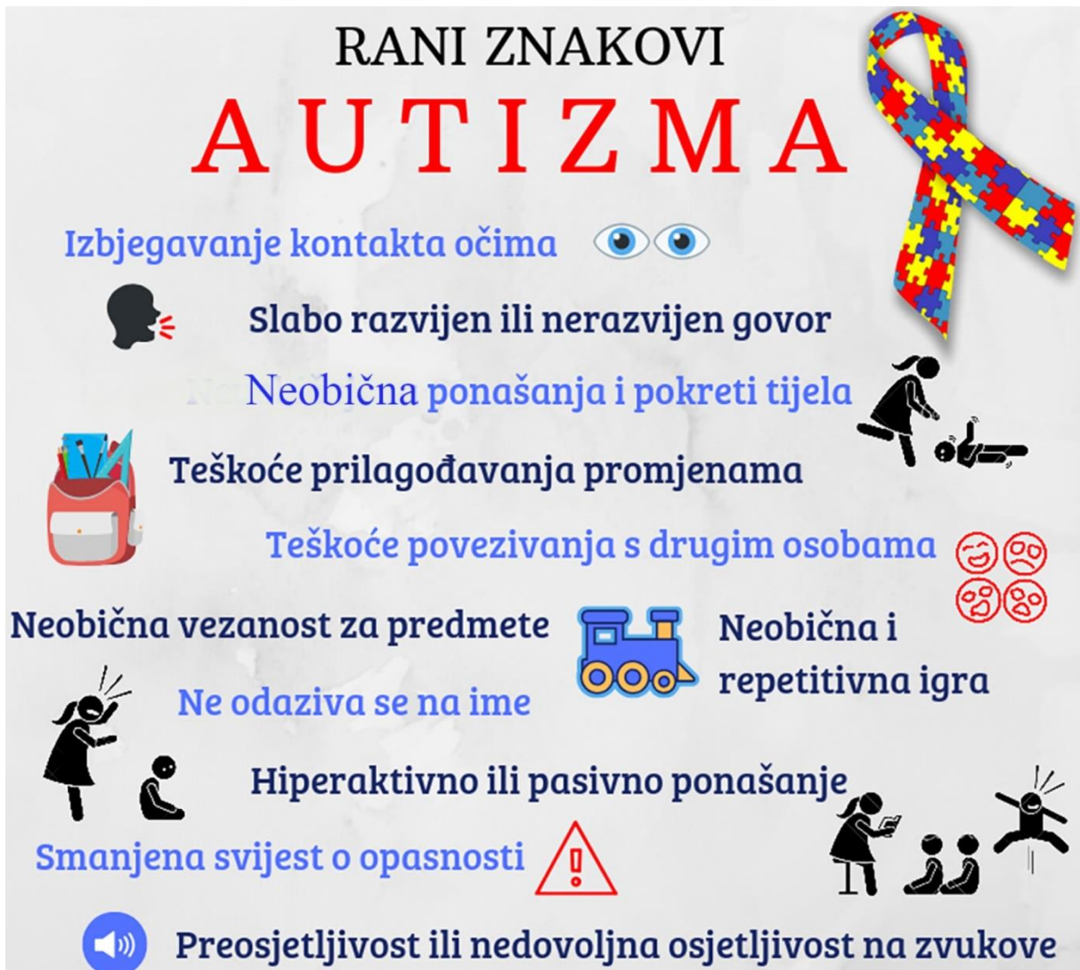
Slika 8. Rani znakovi autizma

kompetencija, kompetencija u prirodnim znanostima i tehnologiji, učiti kako učiti, inicijativnost, poduzetnost i kulturna svijest i izražavanje. U samom obrazovanju odgojitelja uz teorijsko znanje vrlo je bitno praktično znanje. U nekim situacijama odgojitelji ne mogu stečeno i naučeno teorijsko znanje primijeniti jer su u tim trenucima potrebne vještine inovativnosti i improvizacije. (Glasser, 2005)