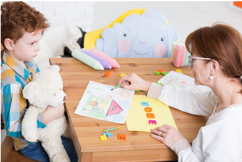
Slika 2. Igra s autisitčnim dječakom

autističnom poremećaji pa često dolazi do zamjene oko poremećaja. Oko 6. mjeseca života dijete koje boluje od Rettovog poremećaja odjednom prestane raditi uobičajene pokrete koje je do sada normalno radilo. Dijete polagano počinje gubiti interes za okolinu i društveni razvoj, dolazi do smanjenja pokreta ruku i hiperventilacije. U četvrtoj godini života dijete počinje gubiti koordinaciju mišićnih pokreta što se naziva ataksija i ne može naučene pokrete ponoviti a to se naziva apraksija. Jedna od karakteristika za Rettov sindrom je teža mentalna retardacija. (Bujas Petković, Frey Škrinjar i sur., 2010)