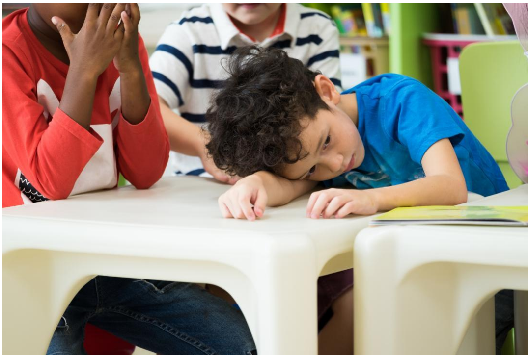
Slika 1. Autistično dijete i obazovanje