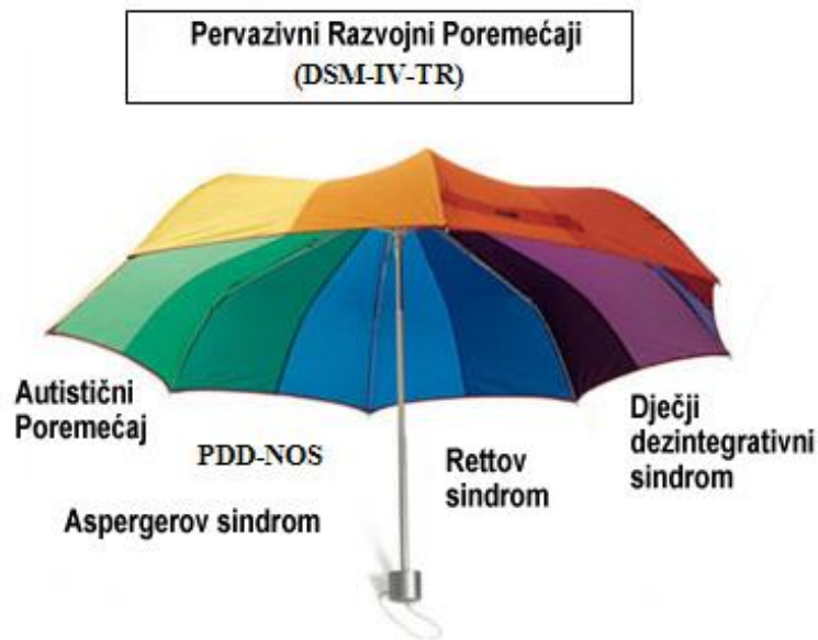
Slika 6. Simptomi autizma

normalnog razvoja pojavljuje se u trećem mjesecu djetetovog života. Karakteristično je za djecu s autizmom da promatraju svoje ruke i igraju se s njima. Znaju se igrati sa svojim rukama i po par sati bez prestanka. Određeni stereotipni pokreti karakteristični su za djecu s autizmom. Neke od stereotipnih pokreta su njihanje, pljeskanje, prevrtanje predmeta i slično. Dijete s poremećajem iz spektra autizma uzima igrače drugima, uzima sve što mu se sviđa u bilo kojim situacijama. Određene negativne oblike ponašanja moguće je sniziti na što nižu razinu uz pomoć odgojnih metoda. (Nikolić, 1990.)