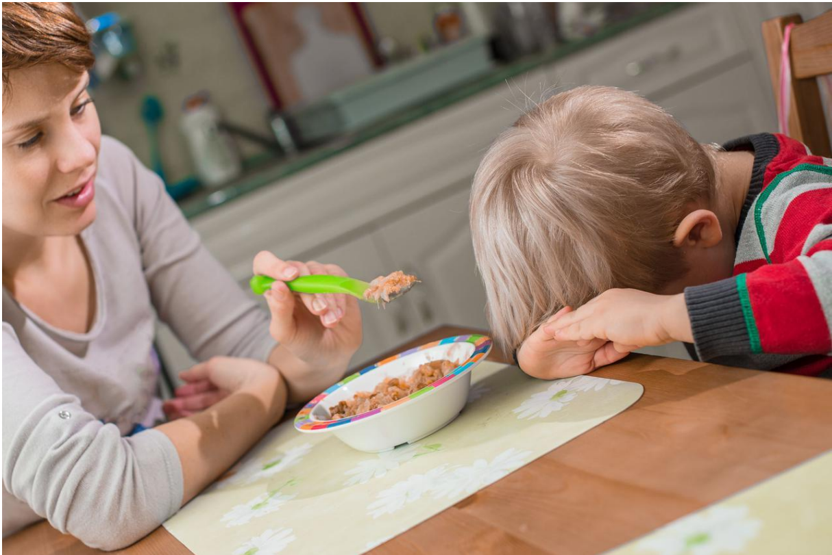
Slika 9. Neobično ponašanje prilikom obroka jedan je od čestih znakova autizma

Glazba pomaže zaobići verbalni jezik metodološkim premošćivanjem jaza u neverbalnom samoizražavanju. Erena (2015.) je to je potvrdio proučavajući intervenciju glazbe i njezin utjecaj na socijalne vještine 6 adolescenata s poremećajem autizma tijekom 8. sesije u trajanju od 90 minuta. Od autistične djece zahtijevalo se da izvode različite plesne forme, kreativne pokrete, ritmičke igre i pjevanje u dijadama, malim i velikim skupinama. Nalazi pokazuju da su adolescenti koji su imali ASD prikazuju značajno poboljšanje u započinjanju i održavanju društvene interakcije sa svakom sesijom, a primijećen je manji otpor tijekom interakcije.