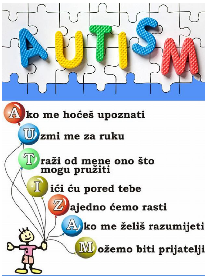
Slika 3. Plakat za svjetski dan svjesnosti o autizmu

Atipični poremećaj također pripada u poremećaje pervazivnih razvojnih poremećaja s nekim zajedničkim obilježjima autističnog poremećaja. Razlika između autističnog poremećaja i atipičnog poremećaja je ta što se atipični poremećaj javlja nakon treće godine djetetovog života i ne pojavljuje se poremećaj u sva tri područja kao kod autističnog poremećaja. (Remschmidt, 2009). Neki od simptoma koji su zajednički kod oba poremećaja su povlačenje u svoje misli i svoj svijet, neverbalan govor, pojava anksioznosti i ljutnje, izbjegavanje kontakta u oči te stereotipni pokreti. Atipični autizam može se javiti kao psihološki, biološki ili nasljedni poremećaj. (Bujas Petković i Frey Škrinjar, 2010).