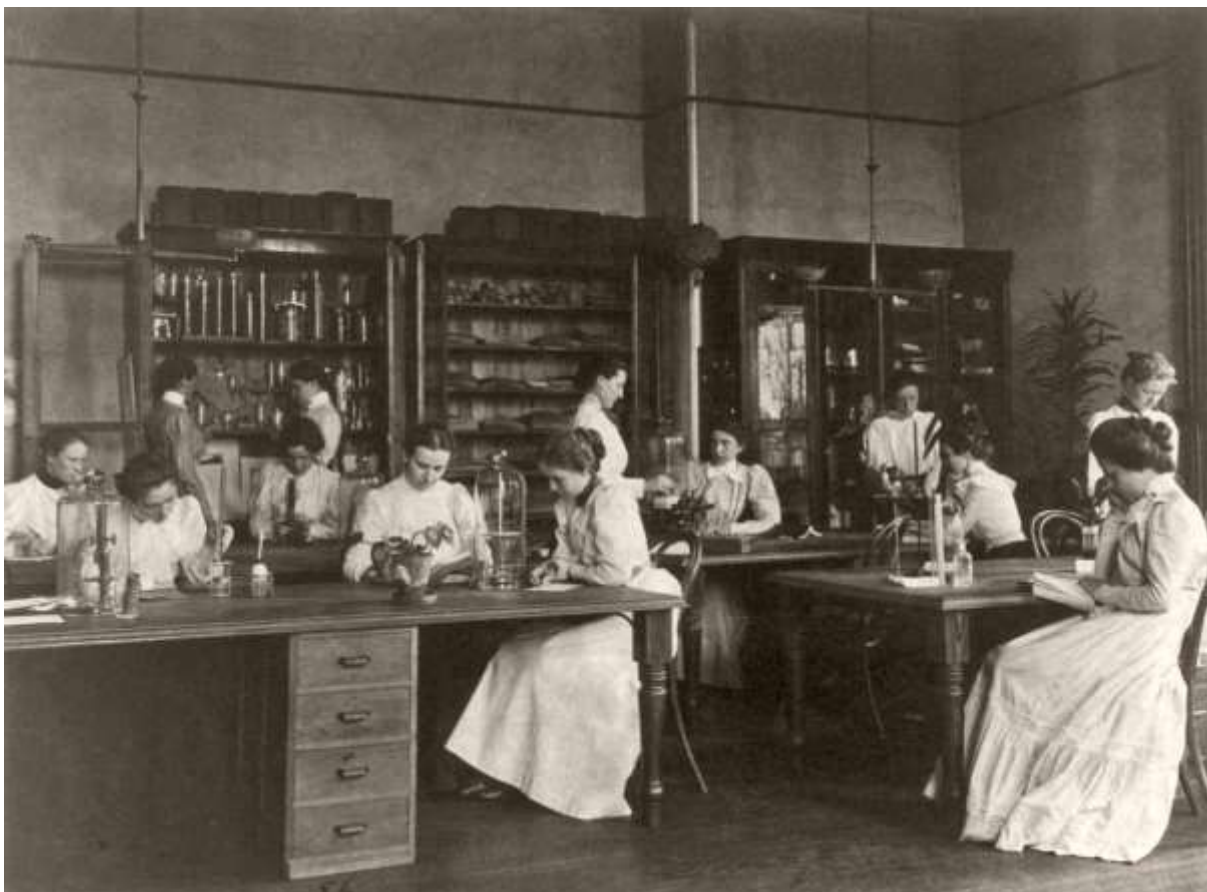
Slika 12. Frances Benjamin Johnston, Djevojke u laboratoriju srednje škole, Washington DC, 1899. godina