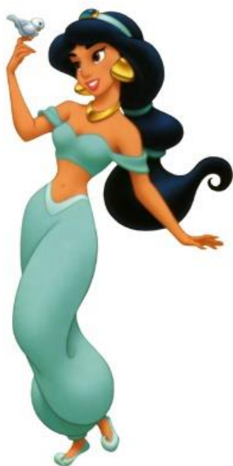
( Slika 3. Jasmina iz crtalog filma „Aladdin“)⁴

spasiti. Upravo ta poruka zabrinjava mnoge roditelje, jer djevojčice stječu dojam da je dovoljna samo njihova ljepota kako bi se netko zaljubio u njih. Da su velike plave oči, mali struk i hrabri kukovi standardni i da bez obzira na to, uvijek će živjeti sretno. S druge strane, mladići se poučavaju da su super jaki heroji koji čekaju da spase djevojke. Također, u Disney crtanim filmovima naglašava se i rasizam. Većina likova su bijelci, dok likove druge rase predstavljaju kao zločince. Na primjer u crtanom filmu „Dumbo“ cirkuski radnici su crni i bez ličnosti te pjevaju pjesme u kojima su neki od stihova „Nikada nismo naučili čitati ili pisati ...Uhvati onaj konop, dlakavi majmune!“. U crtanom filmu „Aladdin“ uvodna pjesma govori o Bliskom istoku kao o „barbarskom“. Aladdin je svijetle puti, dok je loš čovjek Jafar tamniji te govori i izgleda stereotipno. Kod Jasmine, Aladdinove djevojke, njena seksualnost je dosta naglašena zbog njezine odjeće koju nosi, a tek joj je 15 godina. (Kolega, M., Ramljak, O., Belamarić, J., 2011)