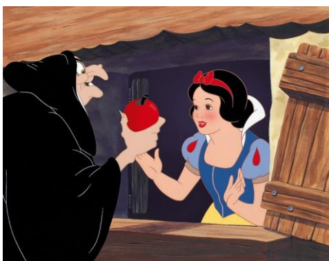
(Slika 4. Snjeguljica i zla maćeha) 11

Ovaj crtani film ima etičku i moralnu poruku. Isplati se biti dobar jer će ti se dobro vratiti, ali ipak ljudi ne smiju biti previše naivni i vjerovati baš svakome, pogotovo ljudima koje ne poznaju.