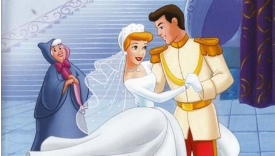
(Slika 5. Pepeljuga, princ i dobra vila (u pozadini)) 12

Vidljiva je dimenzija ljepote, Pepeljuga kao glavni lik ima izuzetnu ljepotu, dugu plavu kosu, minijaturan struk i krupne oči dok su njezine polusestre prikazane kao ružne i zločeste. To utječe na dječju percepciju lijepoga. (Fadić, M., 2014)