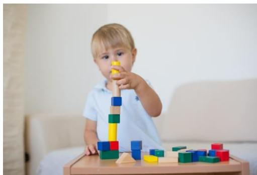
Slika 2: Konstruktivna igra

Konstruktivna igra je igra u kojoj se dijete koristi raznim predmetima u namjeri da nešto stvori. Složenost tvorevine ovisi o spoznajnoj razini djeteta. Iako je to vrsta igre u kojoj dijete samostalno gradi vlastite predmete, poželjno je da se i odrasli ponekad uključe u zajedničko stvaranje s djetetom. U tu vrstu igre spadaju igre s plastelinom, perlicama, kolažom, Lego kockama ili igre rezanja i ljepljenja različitih materijala. Konstruktivna igra veoma doprinosi i razvoju dječje kreativnosti.