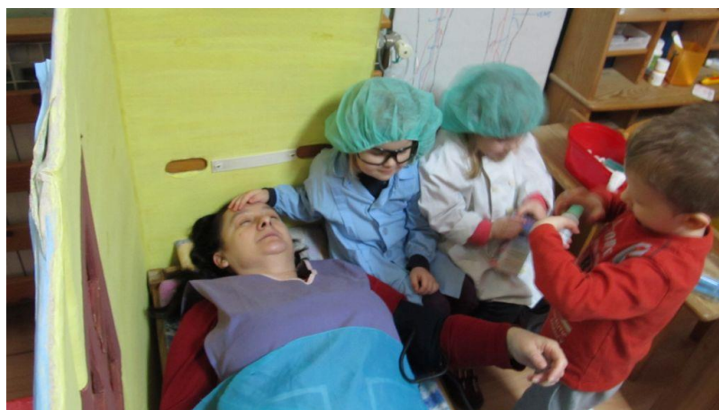
Slika 11: Simbolička igra