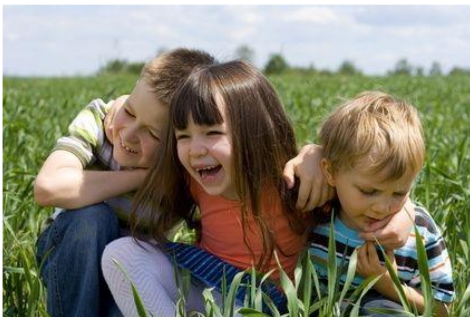
Slika 8: Razvoj društvenosti djeteta

Rješavanjem zadataka i prevladavanjem kriza dijete prelazi u sljedeće stadije razvoja, a u predškolskoj dobi Erikson ih razlikuje tri. U prvom stadiju dijete uspostavlja temeljno povjerenje u odnosu s majkom, u drugom stadiju uspostavlja autonomiju u odnosu s roditeljima, i u trećem stadiju uspostavlja inicijativu u odnosu s obitelji. Za zaključiti je kako će primjeren odnos okoline prema djetetu doprinjeti i njegovu pozitivnom društvenom razvoju.