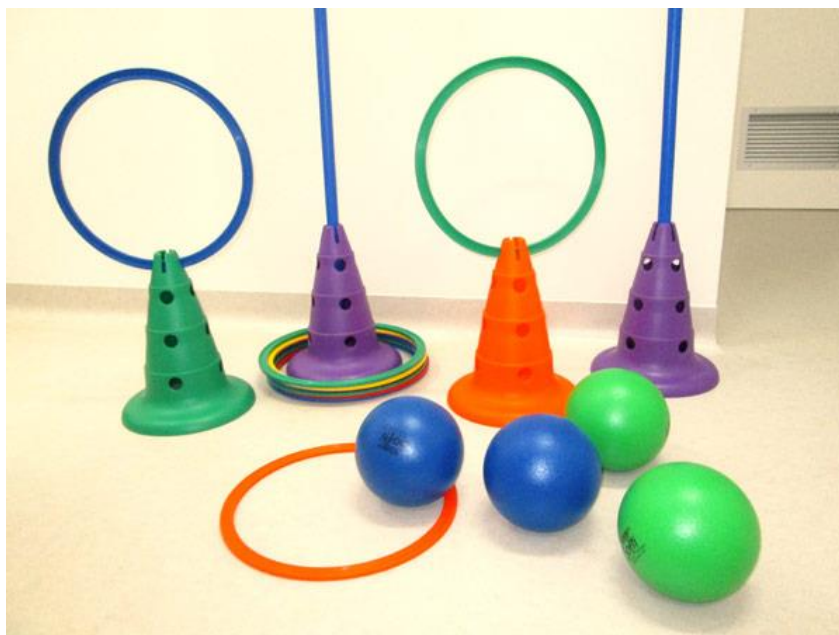
Slika 6: Pomagala u razvoju motoričkih sposobnosti