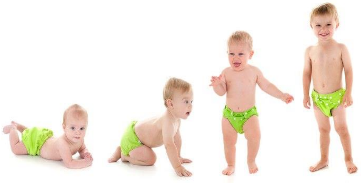
Slika 5: Rast i razvoj djeteta

Pravilan rad s djecom predškolske dobi podrazumijeva rad u skladu s karakteristikama njihova rasta i razvoja. Zbog toga je važno poznavati osnovne karakteristike čovjekova rasta i razvoja, tj. razvojne osobine djece predškolske dobi. Iako su razvojne karakteristike jednake, potrebno je individualno raditi sa svakim djetetom, budući da je svako dijete zasebna jedinka sa vlastitim osobnostima i sposobnostima.