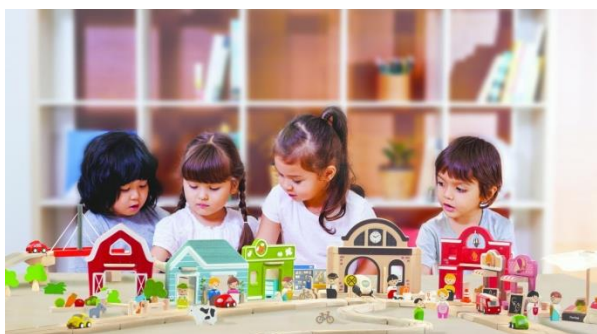
Slika 3: Igra pretvaranja

Igra pretvaranja je suradnička igra u kojoj djeca uz pomoć predmeta koji su simbol za nešto njima zamišljeno, zamišljaju i svoje i tuđe emocije u različitim izmišljenim odnosima i scenarijima. Tom igrom pozitivno se djeluje na razvoj djetetove društvenosti, kreativnosti, ali i razvijanju vještina rješavanja nastalih problema u interakciji s drugima, odnosno socijalizacije. Važno je roditeljsko poticanje igre, a nikako sputavanje ili uvjeravanje u nemogućnost ostvarivanja određenih dječjih zamišljenih scenarija. Kroz igru djeca često izražavaju i svoje osjećaje, pa je važno pratiti igru i iz nje učiti o djeci.