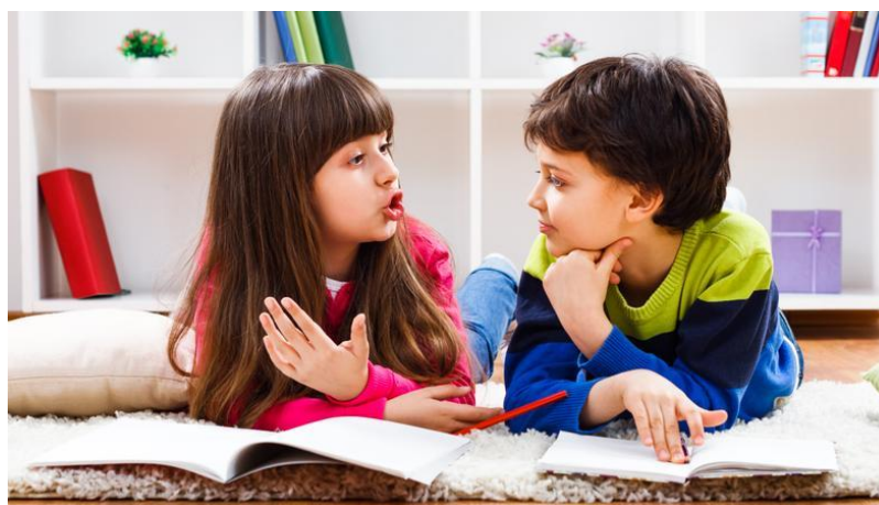
Slika 7: Dječji govor

Prvim riječima započinje verbalno razdoblje. Broj riječi koje djete govori je mali i to su uglavnom dvosložne imenice, a s vremenom se on širi i repertoar postaje kompliciraniji. Kasnije se javljaju slaganja rečenica, od jednostavnih ka složenijima, kao i savladavanje gramatike. Kako se razvija djetetova sposobnost komunikacije s odraslima, dijete shvaća kako govorom može i osmišljavati priče i time razvija svoju kreativnost. Postavljanja pitanja važna su za djetetov spoznajni razvoj, i važno je da odrasli strpljivo odgovaraju na svako dječje pitanje što dijete potiče na nova pitanja, učenje i spoznaju novih stvari. Nakon usvajanja govora, dijete u predškoli savladava i pisani jezik.