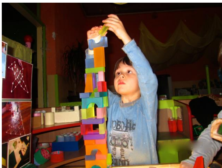
Slika 10: Igra građenja

Igru građenja možemo organizirati korištenjem plastelina. Meki plastelin omogućiti će djeci lako stvaranje raznih oblika, a njegove raznovrsne boje činiti će ga još zanimljivijim materijalom za igru. Poželjno je da odrasla osoba sudjeluje u igri i svojim primjerom pokaže djetetu što se sve može lako stvoriti od spomenutog materijala, ali i pratiti dijete dok samostalno gradi svoje oblike. Igrom plastelinom dijete će vježbati pokrete ruku i pritom ih usavršavati. Igre građenja mogu se organizirati i uz pomoć raznih kocki, a nama su najpoznatije Lego kocke kao omiljene dječje igračke. Uz pomoć njih dijete konstruira i gradi one oblike koji su njemu poznati i zanimljivi, bili to dvorci, vlakovi, rakete ili nešto drugo. Svaki oblik ima vlastitu svrhu za dijete koje ga gradi. Dijete stvara nove oblike, razvija si maštu i svoje ideje, a često se u igri građenja događa i suradnja s drugom djecom pa pritom dijete razvija i svoje socijalne vještine. Pomoću igara građenja, dijete polako ulazi i u svijet matematike, nailazi na probleme fizike, ali i statike i ravnoteže pa pritom svladava i takve prepreke na koje nailazi pri građenju.