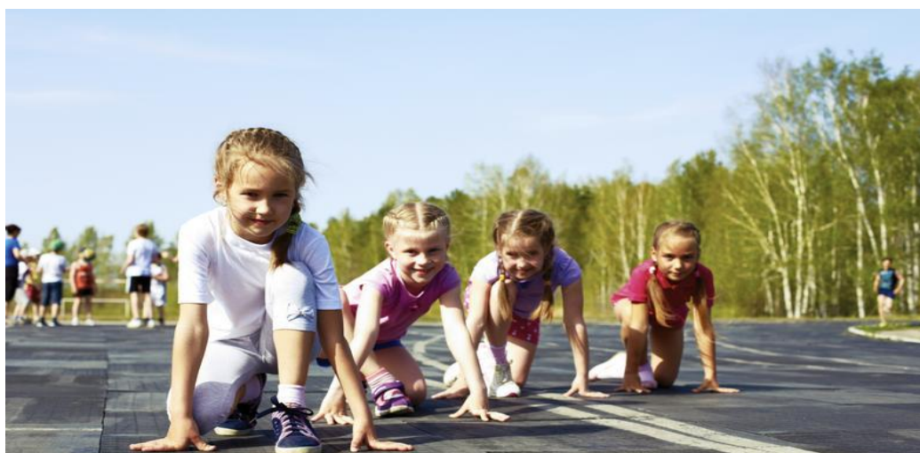
Slika 12: Natjecateljske igre

Kada dijete uvježba određene pokrete i postane spretno i sposobno za sudjelovanje u raznim igrama s pravilima koje su natjecateljskog duha, ono se upušta u igre s pravilima kojih se mora pridržavati. Tako se primjerice javljaju popularne društvene igre poput „Čovjeće ne ljuti se“, „Mlin“, ili igre u kojima se očituje njihova tjelesna razvijenost i spretnost. Tako primjerice igraju „Skrivača“, „Graničara“, utrkuju se na razne načine i to u suradnji sa drugima, te se pritom uče i timskom radu. Ta najnaprednija razina iskazuje sve razine djetetova razvoja, od motoričkih, socioemocionalnih do ostalih razina razvoja.