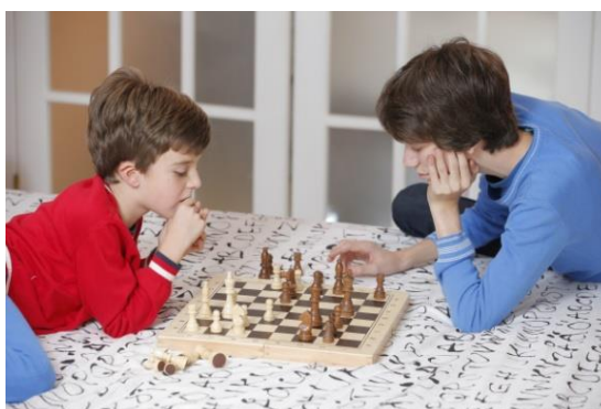
Slika 4: Igre s pravilima

Igre s pravilima su igre koje djeca igraju po unaprijed utvrđenim poznatim pravilima, poput skrivača, graničara, šaha i slično. Djeca tako shvaćaju da i kroz život postoje određena pravila kojih se moramo pridržavati i kako svako kršenje utvrđenih pravila za sobom nosi određene posljedice, pobjedu ili poraz. Takve igre, osim natjecateljske u kojima se susreću s uspjehom i neuspjehom, mogu biti i kooperativne, gdje se djeca uče i timskom radu i suradnji s drugima, pomaganju i dijeljenju.