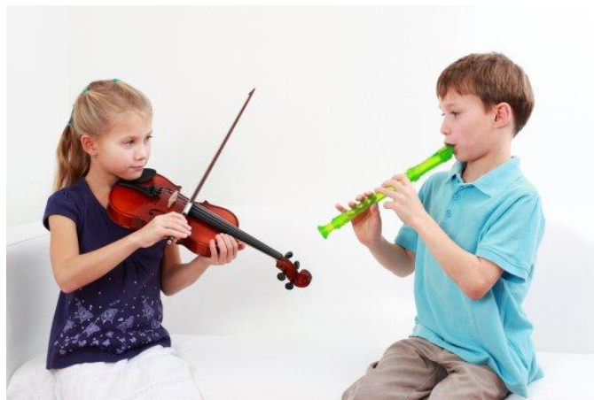
Slika 9: Glazbeno talentirana djeca

Kroz sve te aktivnosti djeca će se sve više približavati glazbi i razvijati svoje glazbene sposobnosti i talente. Tijekom aktivnosti valja ih promatrati i u skladu s njihovim mogućnostima i interesima pružiti im dodatne glazbene aktivnosti.