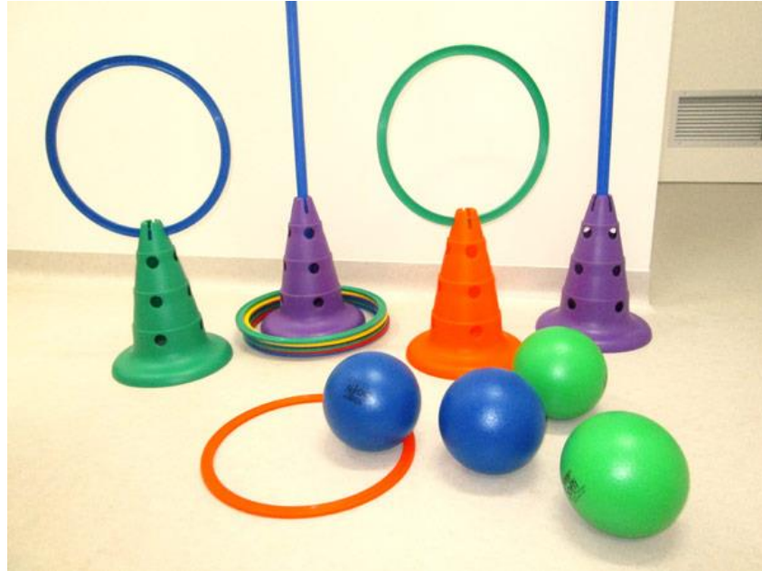
Slika 6: Pomagala u razvoju motoričkih sposobnosti