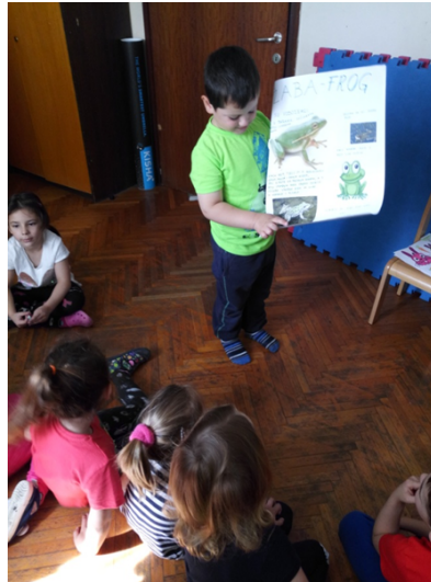
Slika 12 : Dijete predstavlja plakat koji je izradilo s roditeljima