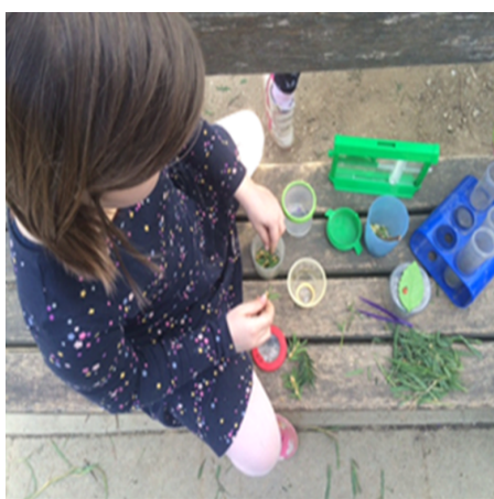
Slika 5 : Promatranje kukaca iz dvorišta vrtića