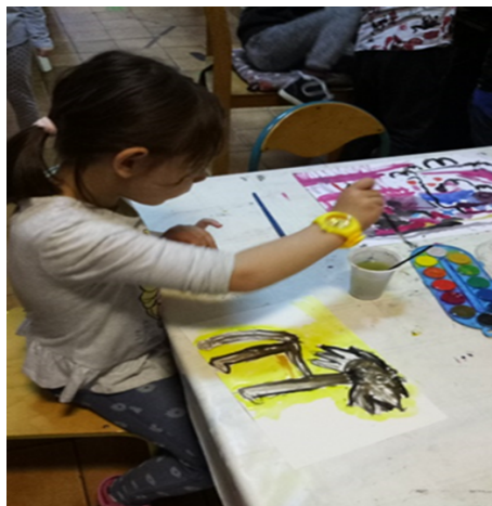
Slika 3 : Likovna aktivnost slikanja životinja