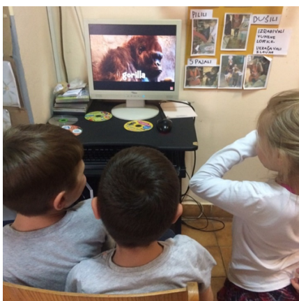
Slika 4 : Audio -vizualni materijali - izvor informacija