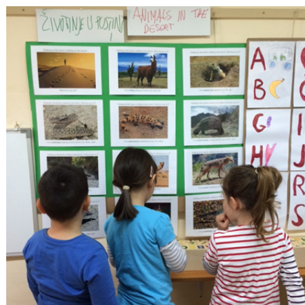
Slika 1 : Dječji plan istraživanja životinja iz pustinje