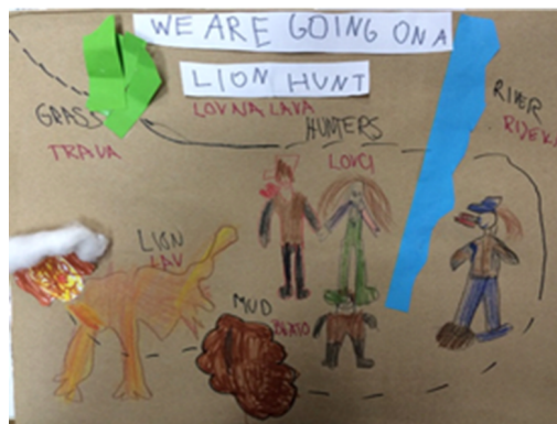
Slika 9 : Zapis dječjeg plana kako uloviti lava

Odgojitelj na temelju dokumentacije može razgovarati s djecom ili im može omogućiti da međusobno razgovaraju. Navedena im dokumentacija služi kao određena vrsta memorije jer se djeca pomoću dokumentacije prisjećaju ranijih razmišljanja te na osnovi toga grade, nadograđuju svoje mišljenje i stvaraju nove spoznaje i zaključke. Bitno je napomenuti da odrasli ne bi trebali očekivati unaprijed zamišljena rješenja ili neki točan odgovor. Djeci treba omogućiti otvoren dijalog u kojem postoje različita rješenja što znači da ne postoji točno ili netočno rješenje, već su sva rješenja ispravna (Slunjski, 2001).