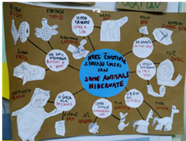
Slika 10 : Primjer zajedničkog dječjeg rada u projektu “Životinje”