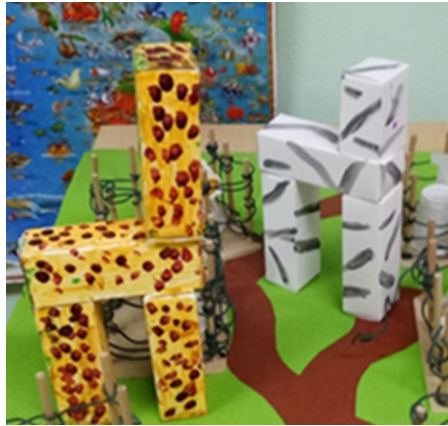
Slika 7 : Makete životinja -dječji radovi

njegove aktivnosti, izgovorena razmišljanja i napravljene konstrukcije i likovne i grafičke prikaze. U takvim okolnostima dijete može pratiti vlastito učenje i razmišljanje te preuzeti odgovornost za vlastito učenje (Slunjski, 2001).