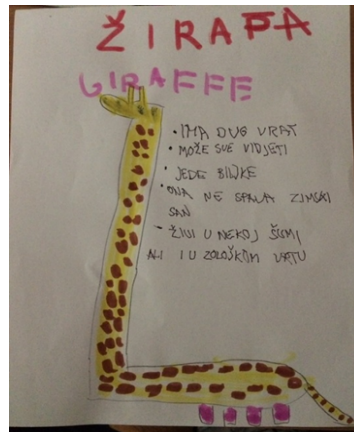
Slika 8 : Dječji crtež i zapis o žirafi

Slunjski (2001, str.129) za dokumentaciju kaže: „Dokumentacija o aktivnostima djece odgajateljima omogućuje da podrže procese učenja, u kojem istovremeno i oni sami uče od djeteta, o tome kako dijete misli i uči. Ona omogućuje uvid ne samo u to što su djeca radila, nego i kako i zašto su nešto radila, tj. čini vidljivim ne samo produkt nego i proces njihovog rada, pa ujedno predstavlja omogućuje i roditeljima da vide onaj dio života i razvoja djeteta koji je obično nedostupan, ili izvana nevidljiv“