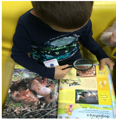
Slika 2 : Listanje enciklopedija kao dio istraživanja