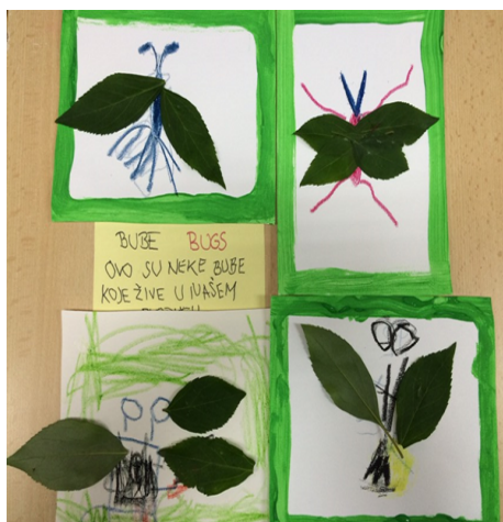
Slika 6 : Primjer dječjih radova iz projekta “Životinje”

Preduvjet suradnje između djeteta i odgojitelja je uočavanje, prihvaćanje i poštivanje razlika. Dokumentacija koja nastaje kao trag djetetove aktivnosti omogućuje svakom djetetu da uočava promjene u svojem mišljenju i stavovima. Upravo te promjene s vremenom postaju prirodne i očekivane i ne stvara se loš osjećaj, već se dočekuje kao uzbuđenje, odnosno kao otkrivanje novog i do tad nepoznatog. Kako bi se to ostvarilo, važna je međusobna komunikacija i uvažavanje koja je ravnopravna između svih sudionika odgojno-obrazovnog procesa.