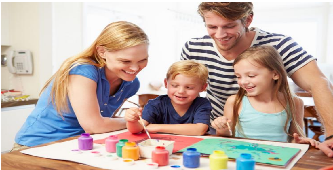
Slika 7. Učenje kroz igru

O igri je mnogo toga napisano, a ono najvažnije, što treba spomenuti, je da djetetu igra predstavlja pripremu za njegov kasniji život. Budući da je igra djetetu najprirodnija stvar tijekom njegova odrastanja, ona također predstavlja i najbolji način učenja. Kroz igru se dijete prirodno samoobrazuje, učeći o svijetu koji ga okružuje i tako razvija psihofizičke i spoznajne funkcije. Nadalje, kroz igru djeca imaju mogućnost razvoja oponašanja te izmjene uloga što predstavlja temelj komunikacije. Ona kroz igru uče o sebi, ljudima i svijetu koji ih okružuje te nastoje razumjeti i koristiti novo naučene riječi i pojmove, koji im pomažu u rješavanju problema kada do njih dođe. Kroz igru dijete skuplja i koristi informacije, uči o umjetnosti, znanosti, matematici, glazbi, prirodi i životinjama. Ona će mu pomoći u ovladavanju stresom te će ga potaknuti na razvijanje kreativnosti, ali i empatije za druge ljude.