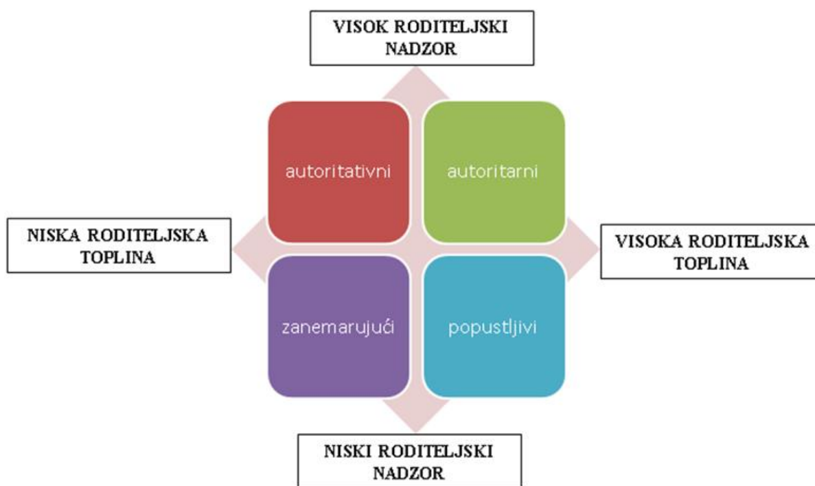
Slika 1. Prikaz roditeljskih stilova

Postoje dvije osnovne dimenzije svakog roditeljstva, a to su emocionalnost i kontrola. Kada govorimo o emocionalnosti, govorimo o rasponu dimenzije od hladnoće i odbijanja djeteta pa sve do topline i prihvaćanja djeteta, dok se kontrola odnosi na dimenzije od slabe roditeljske kontrole nad ponašanjem djeteta do čvrste roditeljske kontrole. Ove dvije osnovne dimenzije roditeljstva pomažu u klasifikaciji roditeljskih stilova, gdje govorimo o autoritativnom (demokratskom), popustljivom (permisivnom), autoritarnom (autokratskom) te zanemarujućem (indiferentnom) roditeljskom stilu (Baumrind, 1973; prema Brajša Žganec, 2003).