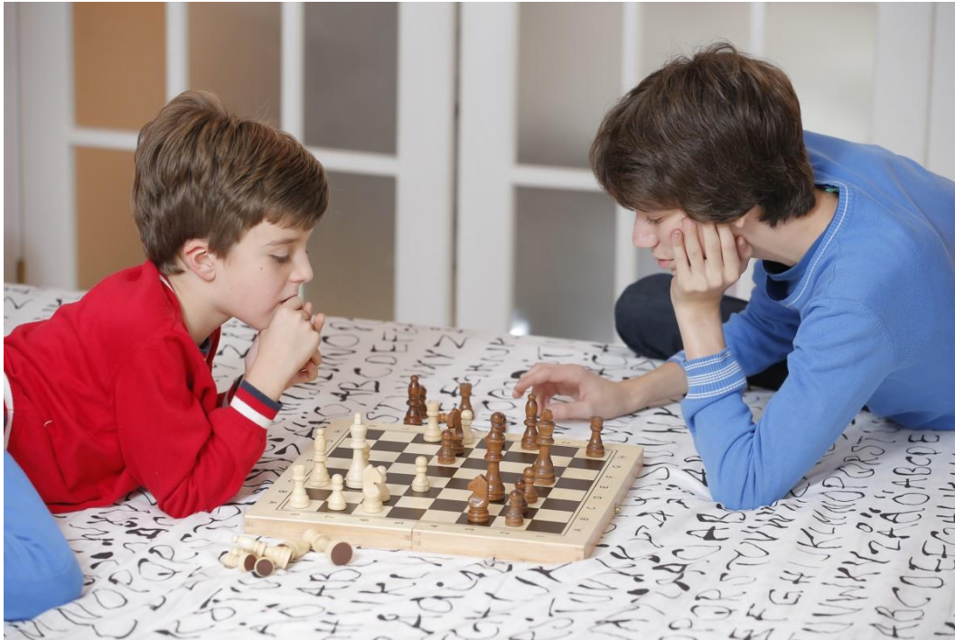
Slika 4. Igre po pravilima

važne funkcije koje su od iznimne važnosti za funkcioniranje sudionika ovih igara, a to su socijalna integracija i socijalna diferencijacija. Socijalna integracija pomaže zbližavanju članova grupe, kontroli vlastitih želja te pridržavanju pravila igre, dok socijalna diferencijacija nastoji povećati udaljenost između članova grupe te potaknuti segregaciju podgrupa.