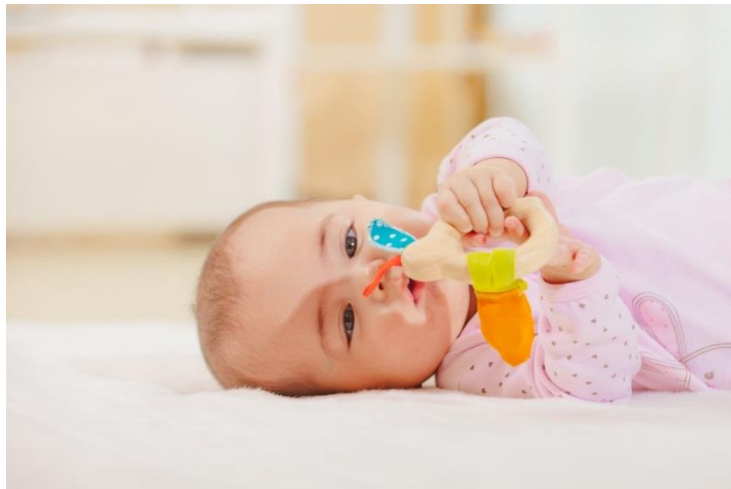
Slika 2. Igra u najranijoj dobi

Za funkcionalnu igru može se reći da je to prva dječja igra koja je obilježena senzomotoričkim razvojnim razdobljem te se pomoću nje postavljaju temelji za kasniji stupanj igre (Došen Dobud, 2016). Ovakav način igre karakterističan je za djecu tijekom njihove prve dvije godine života. Funkcionalnu igru karakteriziraju osjetne i pokretne funkcije djeteta koje mu donose radost i zadovoljstvo prilikom kretanja te njegovih prvih osjetilnih dodira sa stvarima koje ga okružuju. Duran (2011) ističe kako se funkcionalna igra smatra igrom novih funkcija koje sazrijevaju u djetetu, a to su motoričke, taktilne i perceptivne funkcije. Nadalje, važno je naglasiti kako je funkcionalna igra kod djece određena ranom socijalnom interakcijom.