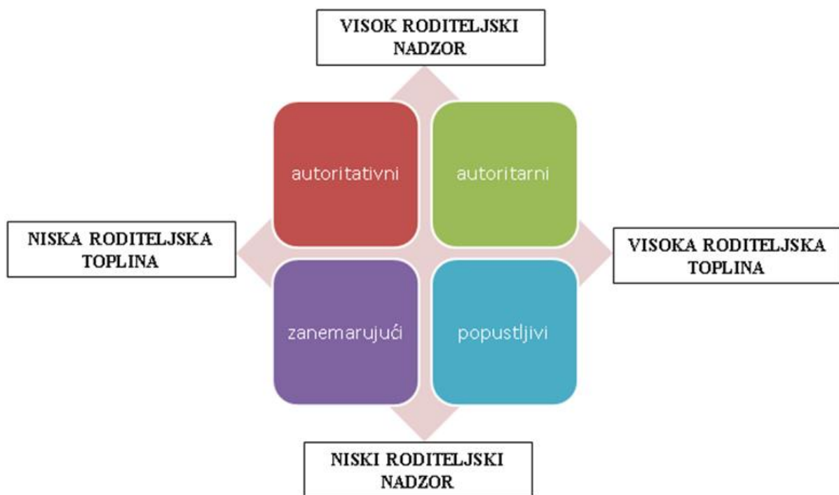
Slika 1. Prikaz roditeljskih stilova

Postoje dvije osnovne dimenzije svakog roditeljstva, a to su emocionalnost i kontrola. Kada govorimo o emocionalnosti, govorimo o rasponu dimenzije od hladnoće i odbijanja djeteta pa sve do topline i prihvaćanja djeteta, dok se kontrola odnosi na dimenzije od slabe roditeljske kontrole nad ponašanjem djeteta do čvrste roditeljske kontrole. Ove dvije osnovne dimenzije roditeljstva pomažu u klasifikaciji roditeljskih stilova, gdje govorimo o autoritativnom (demokratskom), popustljivom (permisivnom), autoritarnom (autokratskom) te zanemarujućem (indiferentnom) roditeljskom stilu (Baumrind, 1973; prema Brajša Žganec, 2003).