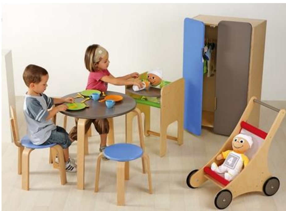
Slika 3. Simbolička igra

Simbolička igra još se naziva i imaginativna igra, igra fikcije, igra uloga, igra pretvaranja i slično. Duran (2011) navodi kako simboličku igru razvojni psiholozi promatraju kao razvojni fenomen. Nadalje, ova vrsta igre predstavlja aktivnost u kojoj je dijete motivirano željom za preuzimanje uloge odrasle osobe. Ona se javlja u trećoj godini djetetova života, kada njegova mašta postaje bogatija. Upravo ta mašta dovodi do prijelaza iz stvarnosti u nestvarnost, odnosno dovodi do područja zamišljenog. Poznato je kako djeca oponašaju sve i svašta te upravo kroz simboličku igru nastoje glumiti i uživljavati se u različite uloge.