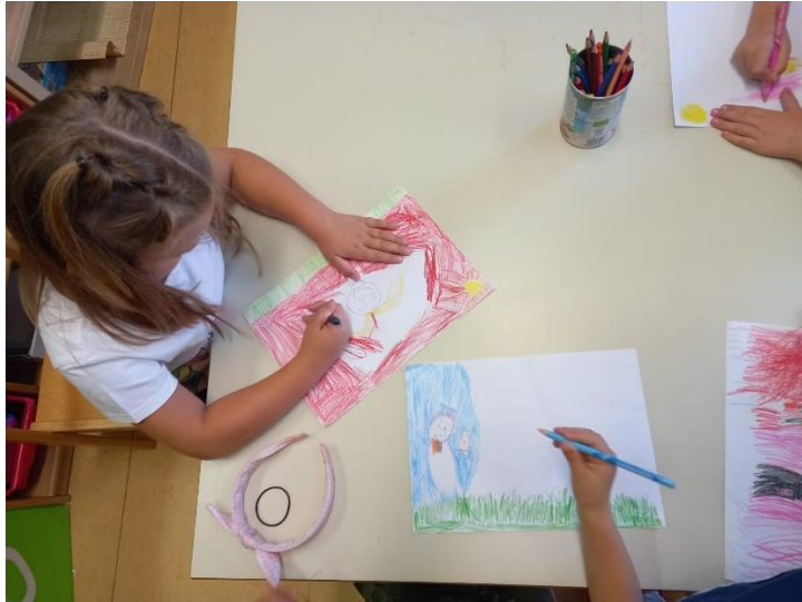
Slika 23. Proces izrade (Bosch)