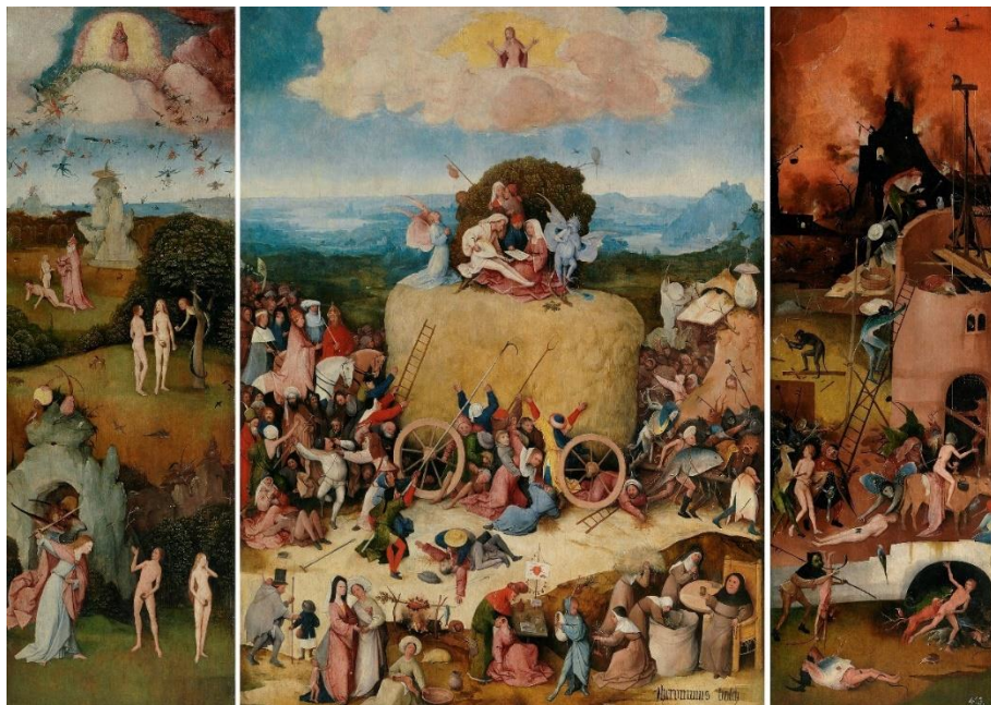
Slika 3. Hieronymus Bosch "Triptih Haywain" (1516.)