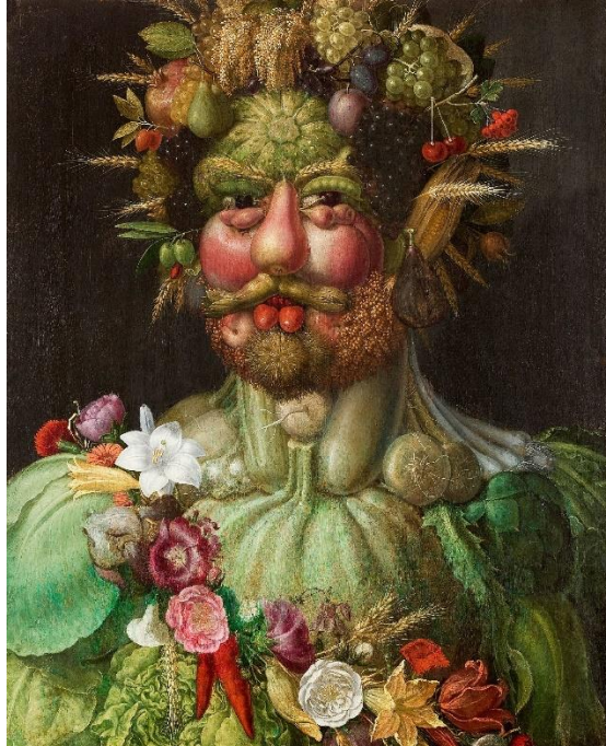
Slika 10. Giuseppe Arcimboldo "Vertumnus" (1591.)