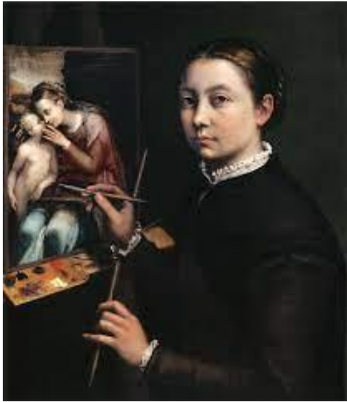
Slika 6. Sofonisba Anguissola "Autoportret" (1556.)

virtuoznost slikarice postavljajući svoje figure u različite poze. Pogledi subjekata vode oko gledatelja po platnu i na kraju se vraćaju na samu umjetnicu, koja zauzima poziciju izvan platna. Sofonisba također pokazuje svoje vještine i talentiranost slikajući različite teksture na odjeći svojih sestara i na tepihu ispod šahovske ploče. (L. Kilroy-Ewbank, 2016)