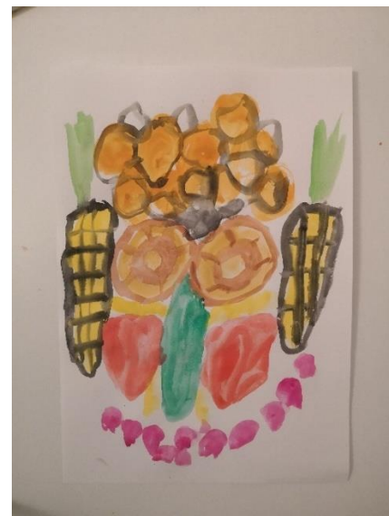
Slika 35. M.K. (5 god. i 2 mj.)