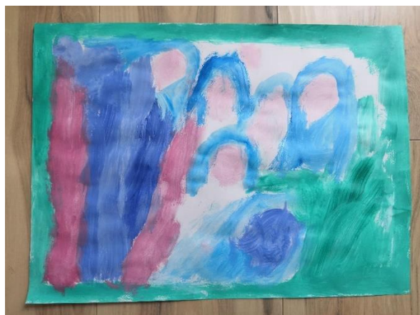
Slika 38. I.Č. (6 god. i 6 mj.)

Sljedeća aktivnost je u središte stavljala manirističkog slikara Jacopa de Pontorma i senzibilnost u njegovim umjetničkim djelima. On je bio poznat po tome da je koristio izrazito nježne i svijetle tonove pa je djeci bio zadatak da slikaju samo sa svijetlim bojama. Tehnika kojima su slikali je bila vodena boja da se dodatno ukaže na senzibilnost njegova pristupa umjetnosti.