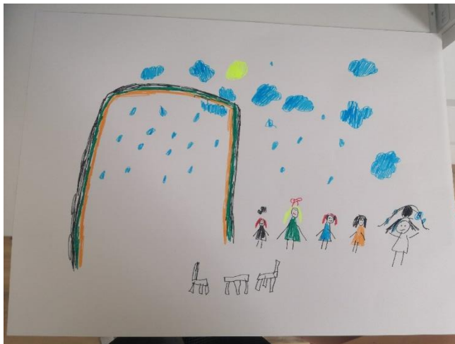
Slika 42. L.Š. (6 god. i 4 mj.)