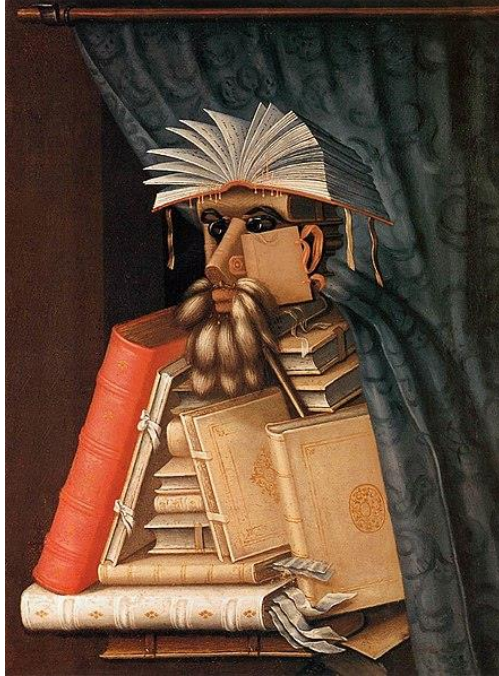
Slika 8. Giuseppe Arcimboldo "Knjižničar" (1566.)