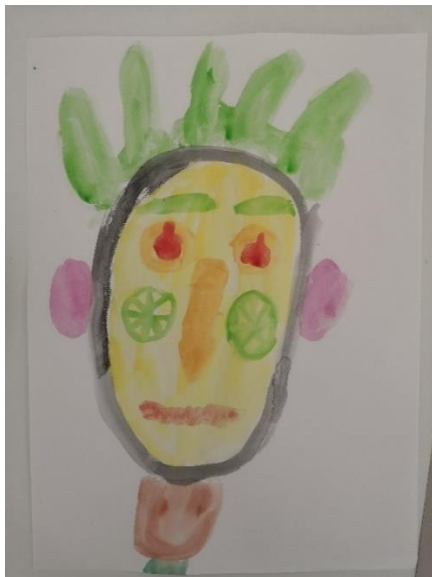
Slika 34. H.B. (6 god. i 5 mj.)