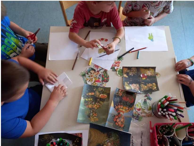
Slika 25. Proces izrade (Arcimboldo)

Drugi slikar koji je predstavljen djeci i koji je izazvao najviše oduševljenja je bio Giuseppe Arcimboldo. Pokazani su im alegorijski portreti po kojima je Arcimboldo bio poznat. Oni su im bili vrlo smiješni i komentirali su različite aspekte slike, te dijelove tijela i lica subjekata na portretima. U prvom dijelu aktivnosti je djeci ponuđen kolaž raznog voća, povrća i cvijeća izrezanih iz časopisa. Od tih materijala su izrađivali svoje verzije Arcimboldovih portreta. U drugom dijelu aktivnosti im je ponuđena tehnika vodenih boja i tempera, te su slikali neobične portrete kako god su htjeli i kako god su doživjeli inspiraciju pred sobom što je dovelo do vrlo kreativnih „povrtnih i voćnih“ lica.