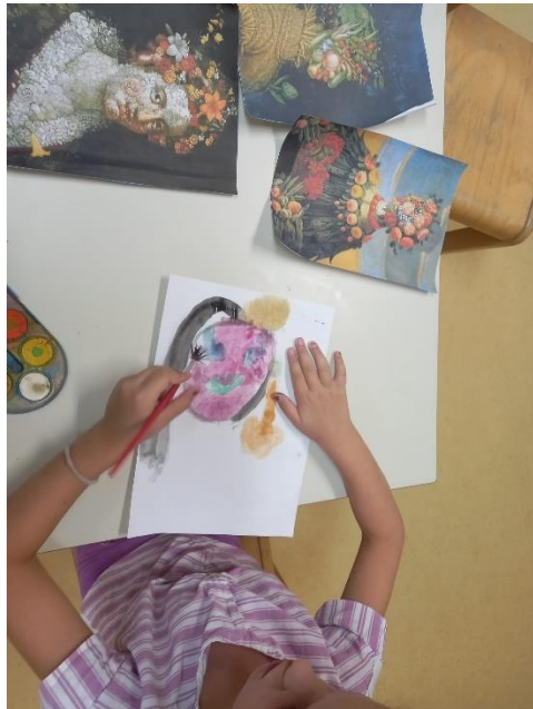
Slika 31. Proces izrade (Arcimboldo)