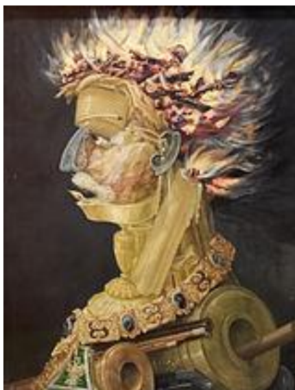
Slika 17. Giuseppe Arcimboldo "Vatra" (1566.)