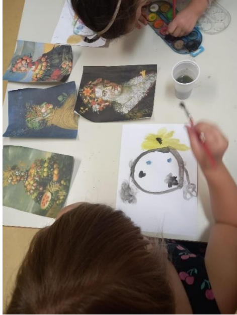
Slika 30. Proces izrade (Arcimboldo)