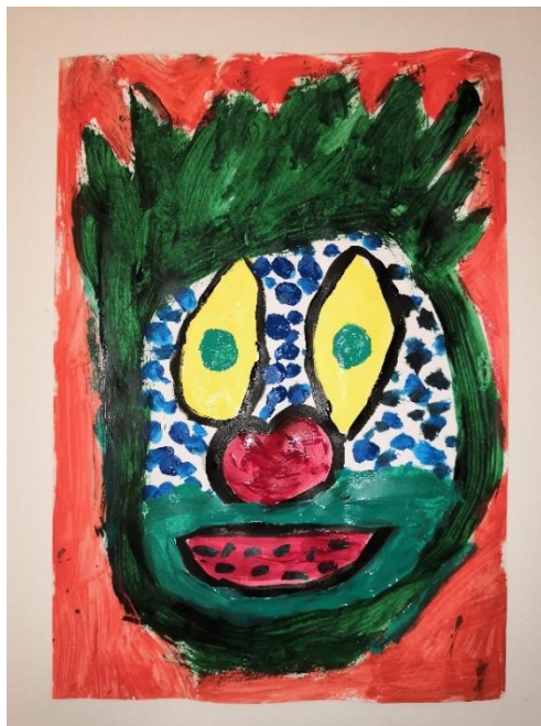
Slika 37. I.Č. (6 god i 6 mj.)

“Meni se najviše sviđa što su ove cure od cvijeća. Cijela faca joj je od cvijeća i koža i sve.”