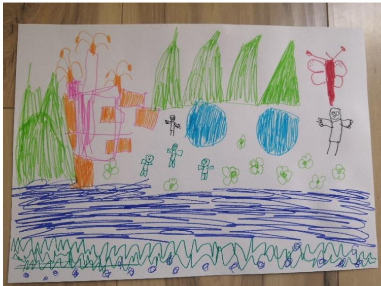
Slika 24. M.M. (4 god. i 8 mj.)

“A zaš' se zove horor kad nije ništa strašno na slici?”