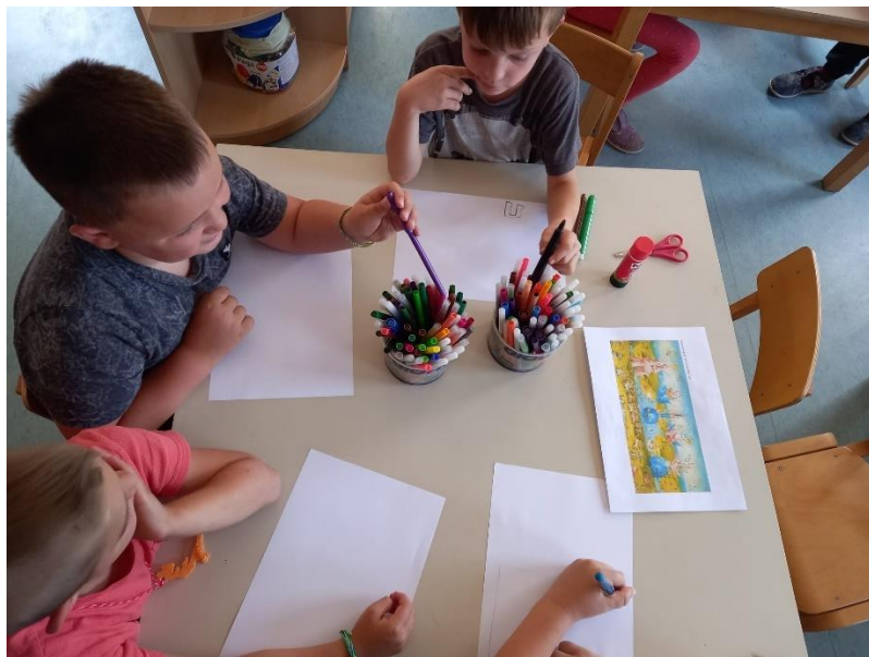
Slika 20. Proces izrade (Bosch)

Prvi slikar kojega su djeca upoznala je bio Hieronymus Bosch, prikazana im je polovica djela „Vrta naslade“ te „Triptih Haywain“. Ukazano im je na to da je ovaj umjetnik ispunio svaki dio prostora koji je mogao na slici stvorivši tako pojam koji se zove „horor vacui“ što znači strah od praznog prostora. Djeca su komentirala različite aspekte na slikama i često zapitkivala trebaju li popuniti baš svaki prazni dio na papiru. Tehnike koje su sami izabrali su bile drvene bojice i flomasteri. Tematika koju su crtali je bila slobodna, po želji, iako je jedna djevojčica nacrtala svoju verziju „Vrta naslade“, onako kako ga je ona doživjela. Mnogima je bilo naporno popuniti sve pa su odustajali od pokušaja, ali sve u svemu je aktivnost protekla glatko, u međusobnoj priči i komentiranju Bochove slike.