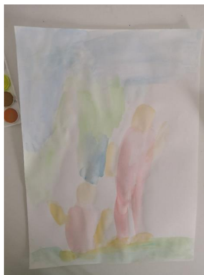
Slika 40. M.K. (5 god. i 2 mj.)