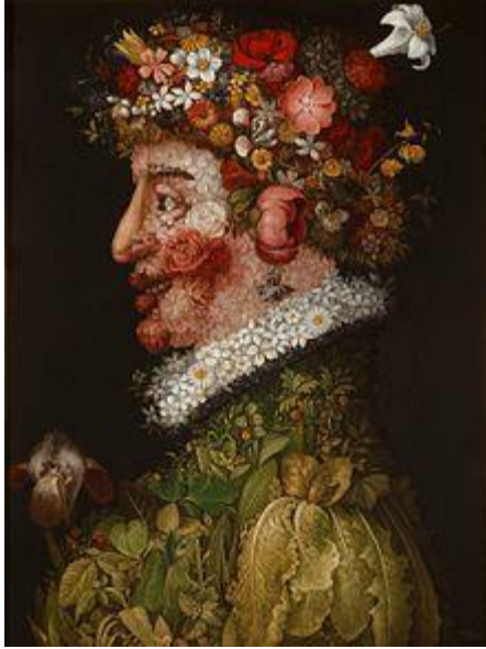
Slika 12. Giuseppe Arcimboldo "Proljeće" (1563.)