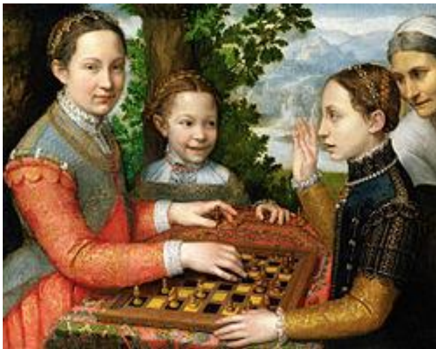
Slika 7. Sofonisba Anguissola "Partija šaha" (1555.)