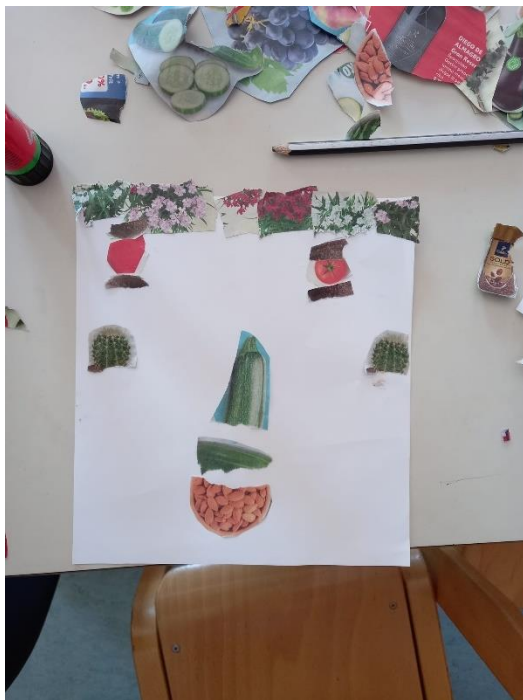
Slika 26. D.T. (5 god. i 9 mj.)