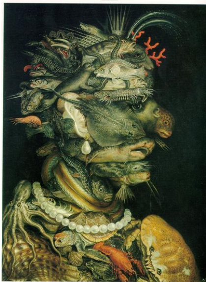
Slika 19. Giuseppe Arcimboldo "Voda" (1566.)