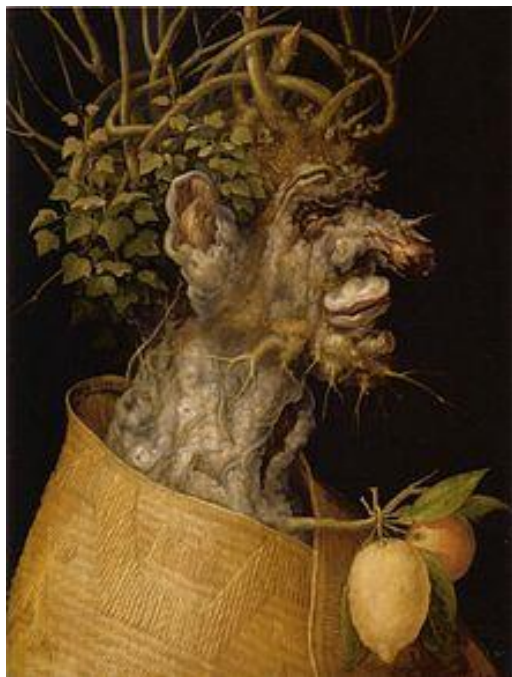
Slika 15. Giuseppe Arcimboldo "Zima" (1573.)