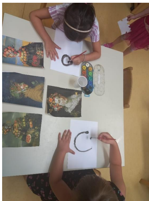
Slika 29. Proces izrade (Arcimboldo)