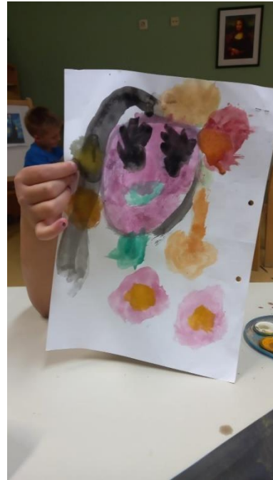
Slika 33. L.Š. (6 god. i 4 mj.)