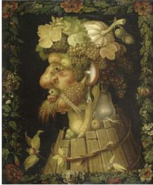
Slika 14. Giuseppe Arcimboldo "Jesen" (1573.)