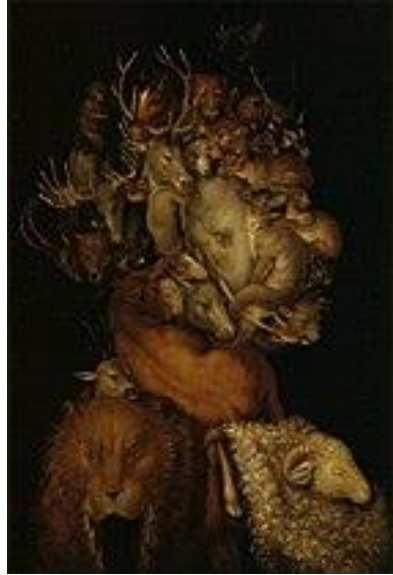
Slika 18. Giuseppe Arcimboldo "Zemlja" (1566.)