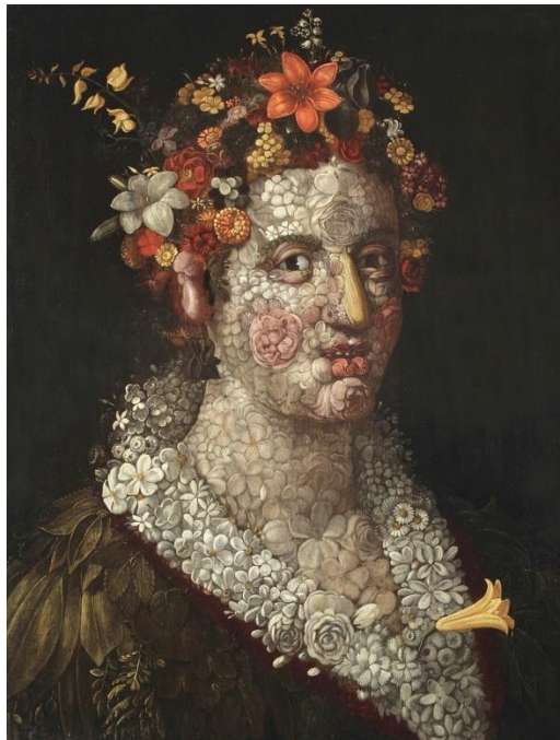
Slika 11. Giuseppe Arcimboldo "Flora" (1591.)