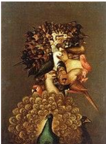
Slika 16. Giuseppe Arcimboldo "Zrak" (1566.)