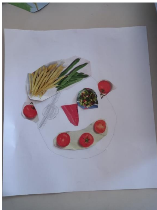
Slika 27. M.K. (5 god. i 2 mj.)