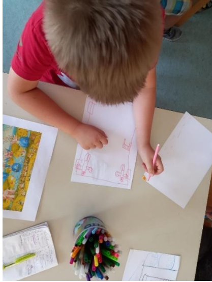
Slika 21. M.K. (5 god. i 2 mj.)