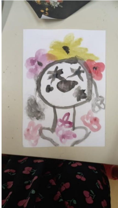
Slika 32. L.K. (6 god. i 3 mj.)