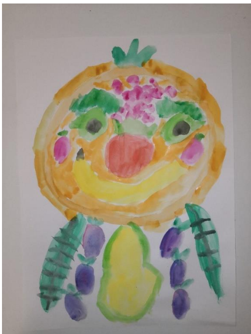
Slika 36. V.A. (6 god. i 6 mj.)