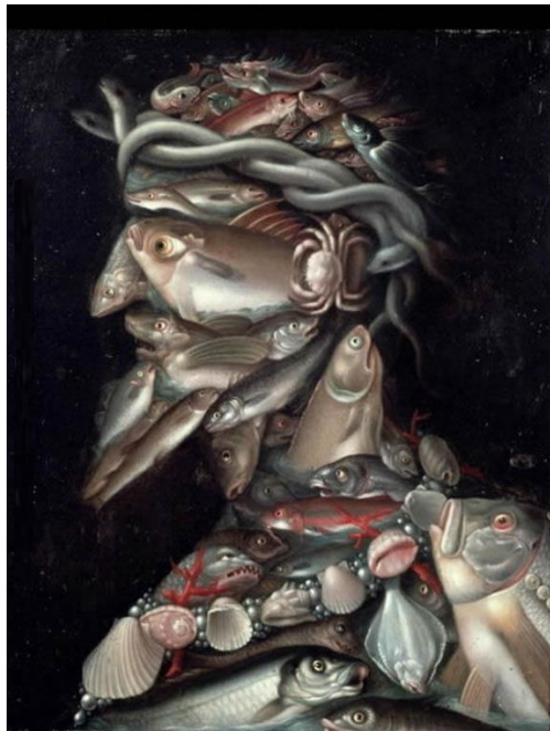
Slika 9. Giuseppe Arcimboldo "Admiral" (1560.)