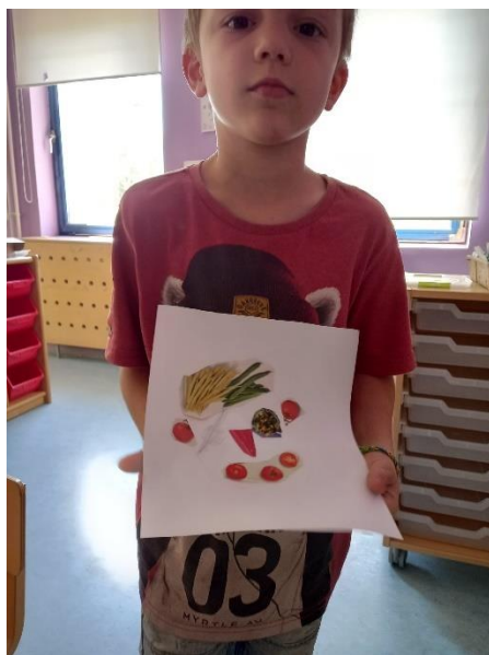
Slika 28. M.K. (5 god. i 2 mj.)