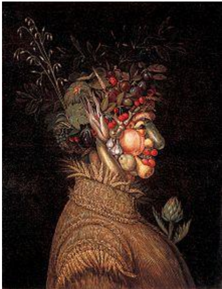
Slika 13. Giuseppe Arcimboldo "Ljeto" (1573.)