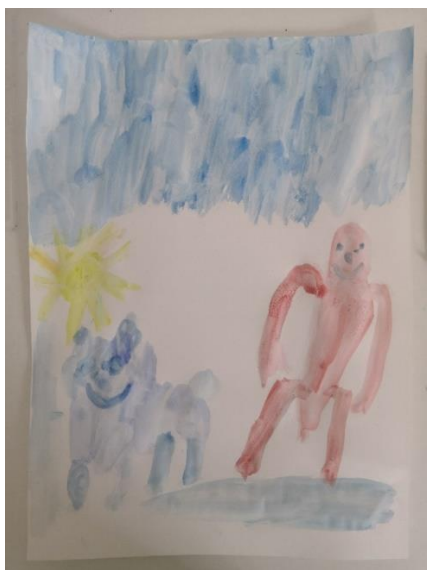
Slika 39. M.K. (5 god. i 2 mj.)