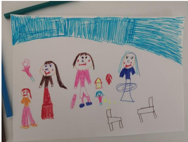
Slika 41. L.K. (6 god. i 3 mj.)

Posljednja obavljena aktivnost je predstavila veliku umjetnicu manirizma Sofonisbu Anguissolu koja je bila poznata posebice po portretnome i autoportretnome slikarstvu. Djeca su crtala prikaze svojih kolega u grupi kako rade nešto po uzoru na Sofonisbino djelo svojih sestara kako igraju šah. Tehnika koju su koristili su bili flomasteri.