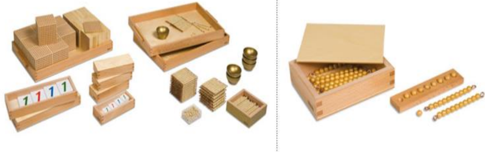
Slika 6. Pribor za matematiku

predstavlja primjerice promjenu šipke. Na taj način dijete spoznaje strukturu decimalnog sustava (Seitz i Hallwachs, 1996).