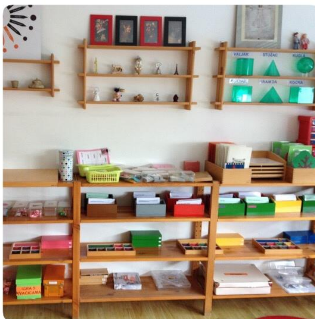
Slika 3. Materijal u Osnovnoj Montessori školi „Barunice Dédée Vranyczany“