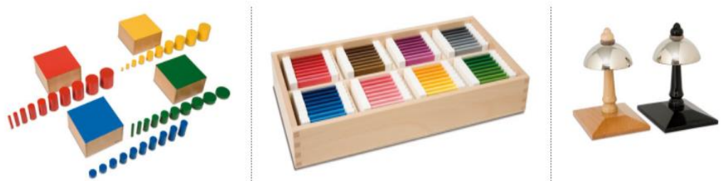
Slika 5. Pribor za razvoj osjetilnosti

Protivnici Marije Montessori misle da osjetilni materijal sužava interese i da je previše sustavan. Ako djeca preko reda, zakonitosti i strukture koja vlada u materijalu mogu otkriti svijet i stvarati pokuse, na taj način se onda izražava djetetova volja za stvaranjem i oblikovanjem (Seitz i Hallwachs, 1996).