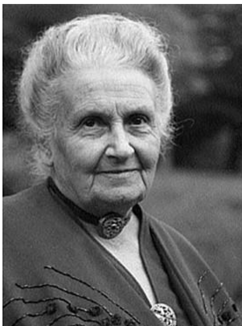
Slika 1. Maria Montessori

direktoricu instituta gdje se osposobljavaju učitelji za rad s djecom sa smetnjama u razvoju (Matijević, 2001).