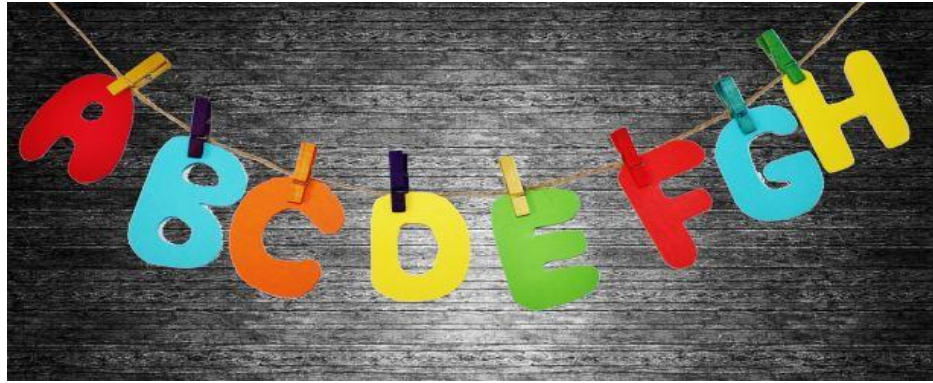
Slika 8. Slova od brusnog papira