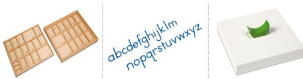
Slika 7. Pribor za razvijanje govora i jezika