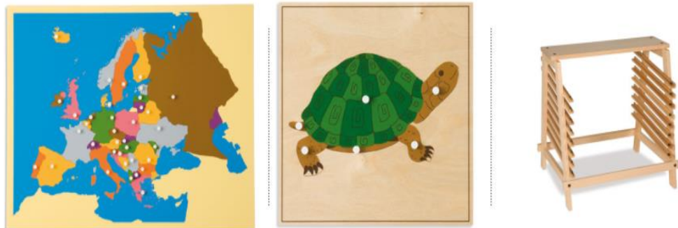
Slika 9. Pribor za kozmički odgoj

Kozmički odgoj je odgoj koji pomaže djetetu upoznati i razumjeti svijet i sve ono što ga okružuje. Zadaća mu je pobuditi i razviti istraživačku snagu u djetetu, maštu i kreativnost te razviti apstraktno mišljenje. Kozmički odgoj pomaže djetetu spoznati okolni svijet koji će pobuditi njegovu znatiželju i zanimaciju. Ujedno spoznaje da su ljudi, biljke, životinje i predmeti obvezni dio njegovoga okruženja te da su oni povezani s prirodnim pojavama i okruženjem. Dijete kroz kozmički odgoj uči o prirodnim i društvenim znanostima, umjetnosti, kulturi, ekologiji, evoluciji, religiji i sl. (Nebuda/Montessori asocijacija, 2010).