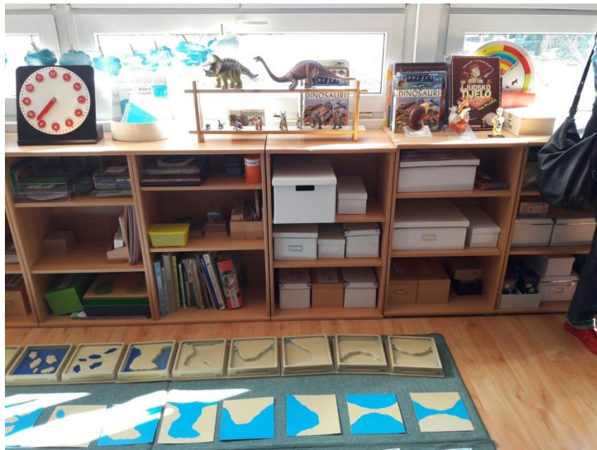
Slika 10. Učionica za kozmički odgoj u Osnovnoj Montessori školi „Barunice Dédée Vranyczany“

Kozmički odgoj pokriva područja: zemljopisa, zoologije, botanike, povijesti, umjetnosti, etike, antropologije, evolucije, ekologije, astronomije i informatike (Philipps, 1999). Materijal za kozmički odgoj obuhvaća globuse na kojima se zemlja i oceani mogu opipati, specijalne materijale za geologiju pomoću kojih se svladaju osnovni pojmovi iz geologije, slikovni materijal, kronološki prikazano vrijeme, atlase, mogućnosti za izvođenje pokusa, zbirku minerala itd. Zamisao Marije Montessori je bio da se pomoću tih materijala djeci omogući da na zoran i interdisciplinarni način uče i otkrivaju svijet i odnose unutar zemljopisa, geologije, kemije, biologije, fizike, astronomije, povijesti itd. (Seitz i Hallwachs, 1996).