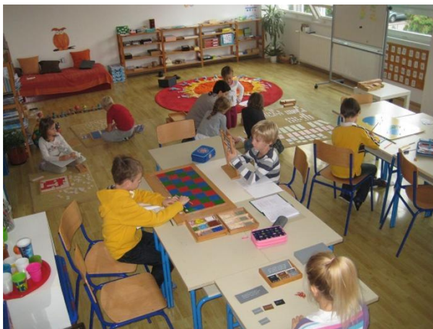
Slika 2. Učionica u Osnovnoj Montessori školi „Barunice Dédée Vranyczany“

Učionica je ukrašena biljkama, učeničkim pisanim radovima, crtežima i slikama (Jagrović, 2007). Takva učionica naziva se „uređenom sredinom“ koja učenike potiče na rad i raznovrsne aktivnosti koje zadovoljavaju njihove razvojne potrebe. Uređena učionica potiče djecu na konstruktivan individualni rad (Matijević, 2001).