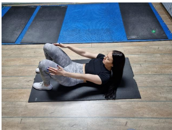
Slika 1 (autorov rad)

Vježbe za jačanje abdominalnih mišića i rotatora trupa