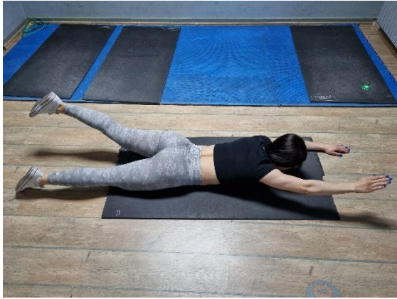
Vježba 2.b (autorov rad)