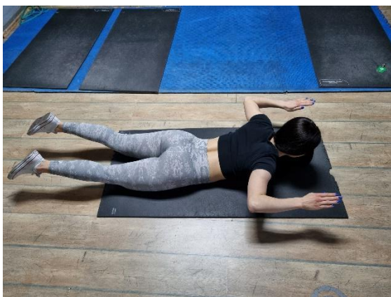
Vježba 1b. (autorov rad)