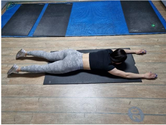
Vježba 1a. (autorov rad)