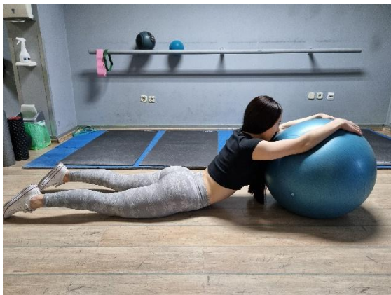
Slika 4

Vježba 3. Sjediti na petama uz paralelno opružene ruke položene na loptu. Udahnuti te potiskivati ramena prema dolje, a istezati kralježnicu prema natrag. Vježbu ponoviti 8 puta.