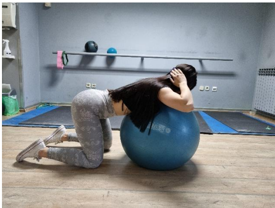
Slika 2 (autorov rad)

Vježba 1. Početni položaj sjedeći na lopti. Noge paralelne i razmaknute, a ruke savijene u laktovima. Udahnuti, uvući trbuh i izdužiti kralježnicu, a potisnuti ramena i laktove prema natrag. Zadržati 3 sekunde, a zatim se opustiti. Ponoviti vježbu 5 puta.