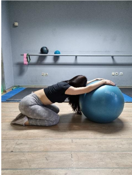
Slika 3

Vježba 3. Sjediti na petama uz paralelno opružene ruke položene na loptu. Udahnuti te potiskivati ramena prema dolje, a istezati kralježnicu prema natrag. Vježbu ponoviti 8 puta.