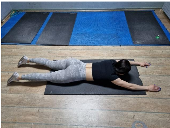
Vježba 2.a (autorov rad)