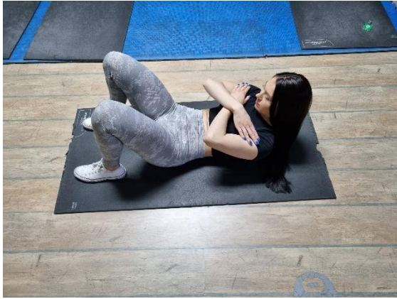
Slika 2 (autorov rad)

Vježba 2. Kao u prethodno prikazanoj vježbi, podizati glavu prema prsima.