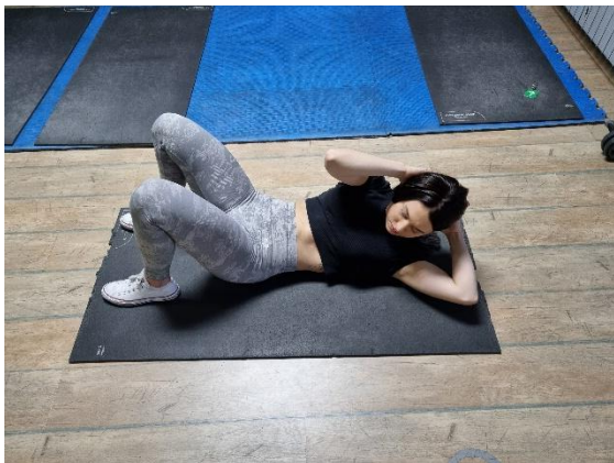
Slika 3

Vježba 2. Kao u prethodno prikazanoj vježbi, podizati glavu prema prsima.